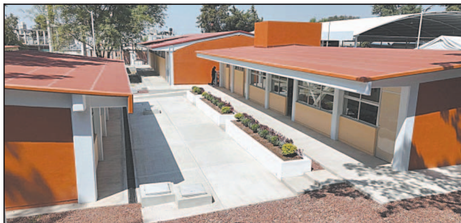
Se busca que los jóvenes estudien en salones habilitados con computadoras.