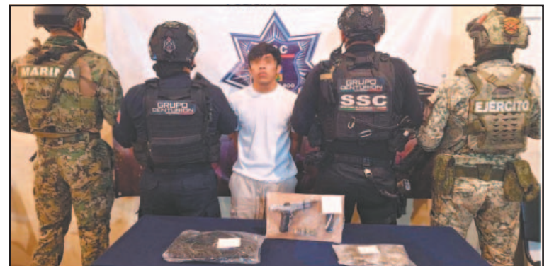
Las autoridades sorprendieron al sujeto manipulando cannabis.