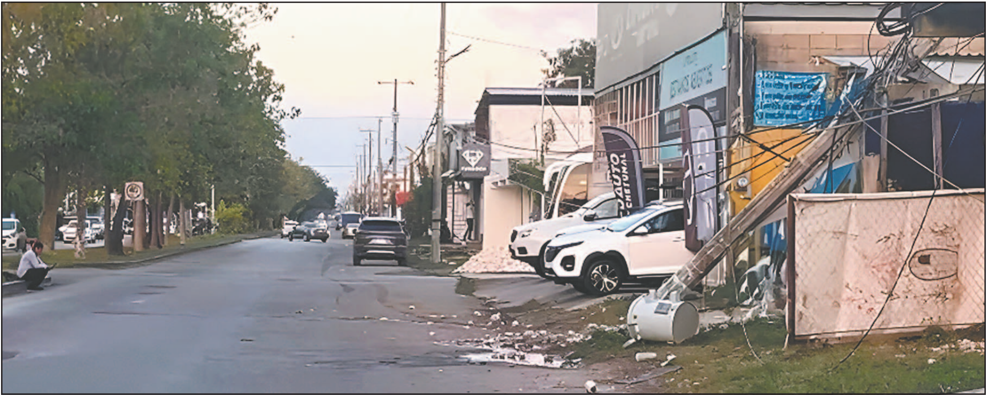
El aparatoso accidente alarmó a vecinos y automovilistas a las 5:00 horas de ayer; los cables de alta tensión quedaron sobre la avenida Erick Paolo. (Williams Duran)