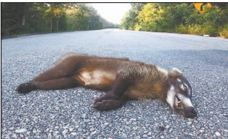
Biólogo destacó que en un día, 8 animales fueron arrollados.