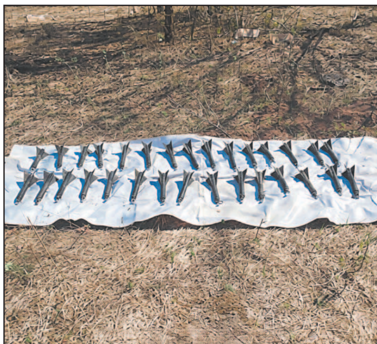
El decomiso se dio como parte de los operativos en la zona.