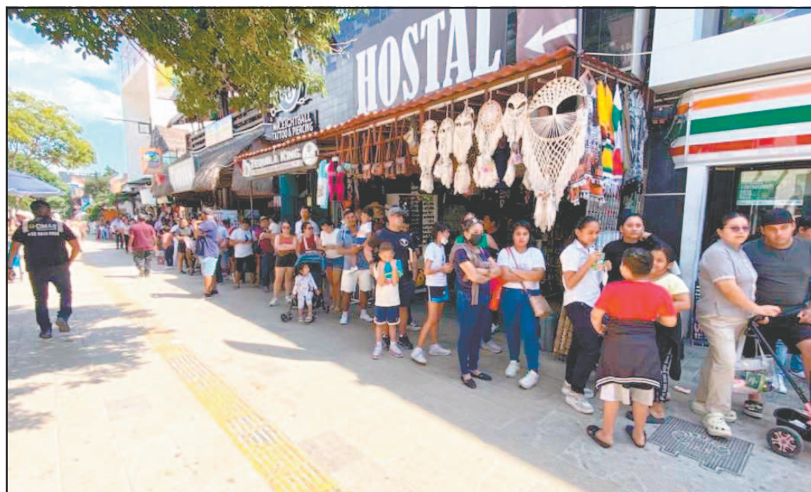
En los puntos de aplicación se acabaron las dosis antes de concluir el horario establecido. (POR ESTO!)

A estos puntos se sumará la Jornada de Vacunación contra el Sarampión convocada por el Gobierno municipal, a través de la Secretaría de Salud Municipal, programada para los días 16 y 17 de febrero, de 8:00 a 13:00 horas, en la explanada del