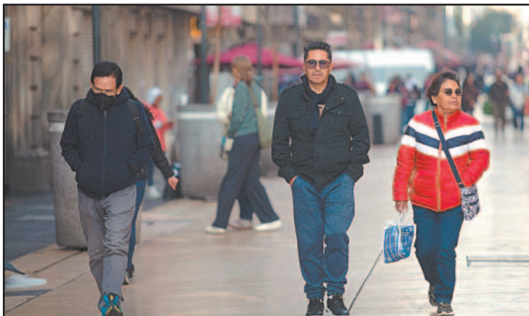
El sistema ingresaría mañana por Baja California. (Agencias)