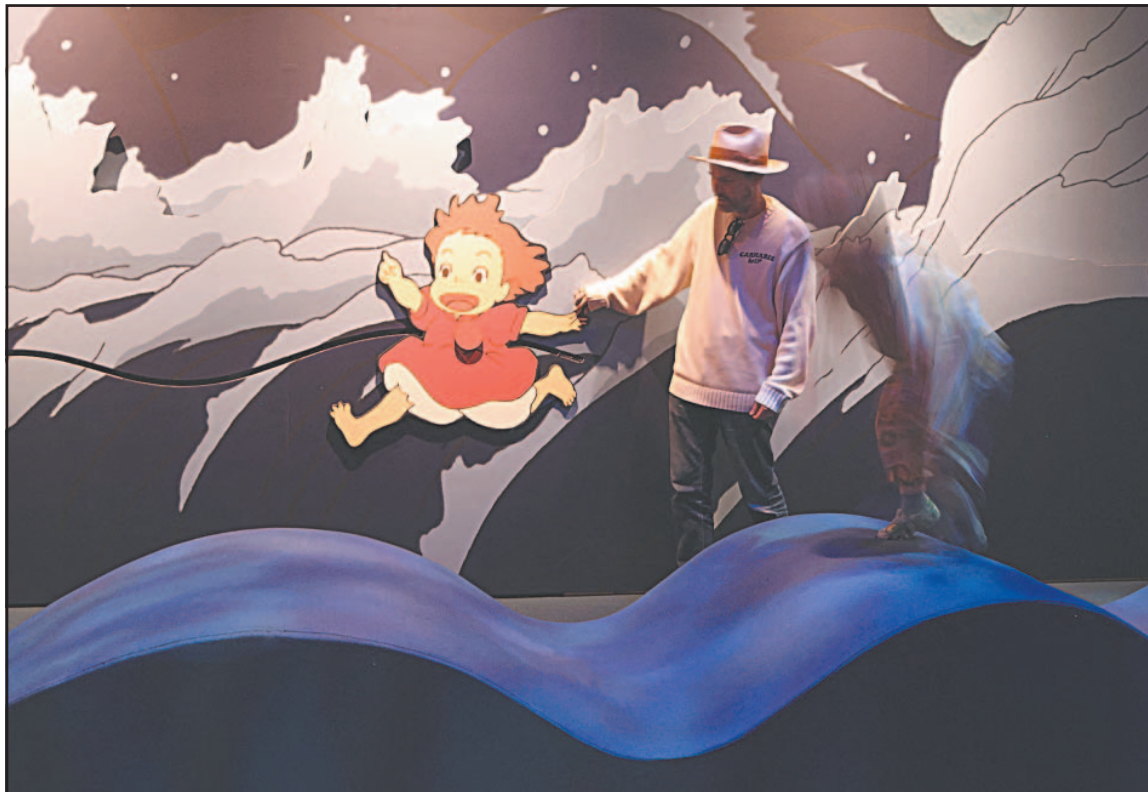
El espacio dedica poco más de 350 metros cuadrados a la película animada, estrenada en 2008.

A pesar de las reservas de su padre, el mago submarino Fujimoto , la pequeña Ponyo se enamora de su nuevo amigo y renuncia a sus