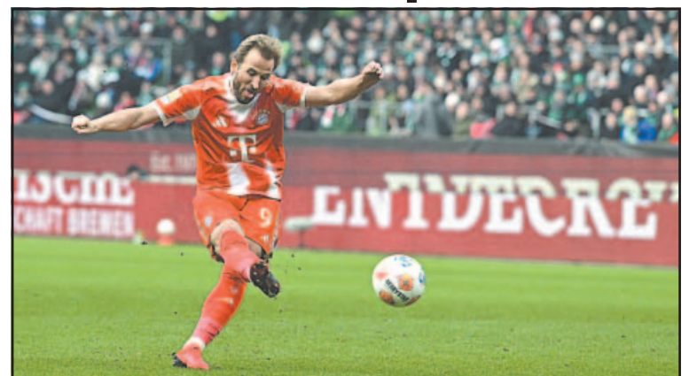
El atacante bávaro sumó dos anotaciones ante el Werder Bremen .