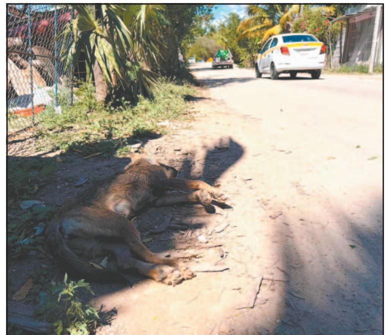
Habitantes dijeron que animales han muerto atropellados.

Señalaron que ellos mismos han estado a punto de ser arrollados por la cercanía con la que circulan los vehículos cuando transitan por la vía en busca de pasaje o con rumbo al mercado de Nuevo Progreso.