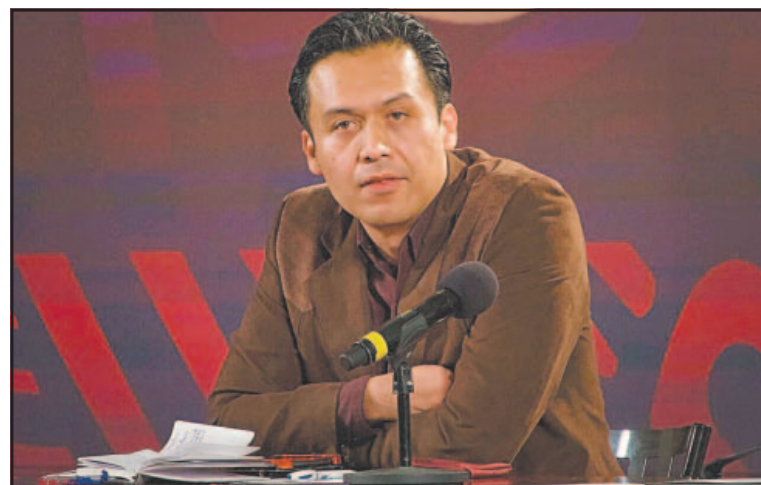
El exfuncionario señaló que no le han dado su acta de despidio.