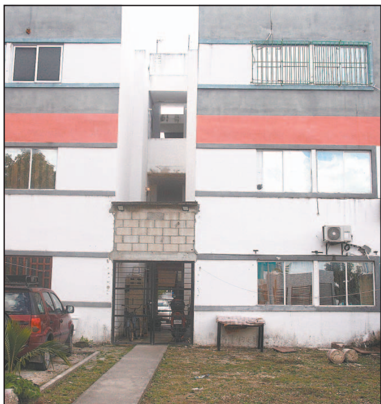
Balcones de los departamentos se han derrumbado. (Erick Romero)