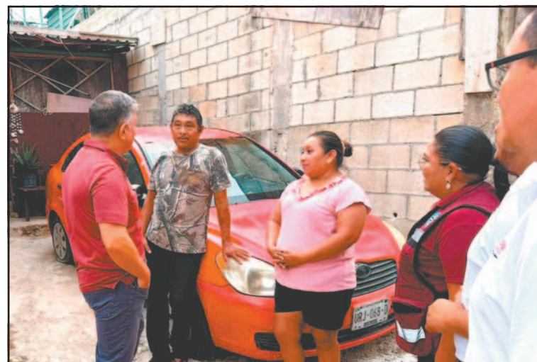
Ciudadanos pidieron no apoyar a militantes camaleónicos . (O. López)

Los morenistas recomendaron a su partido comenzar a promover a personas que están fuera del grupo de políticos, señalando que no deben temer a impulsar a nuevos cuadros, “porque como vamos, no ha cambiado la forma de gobernar del PRI y PAN”.