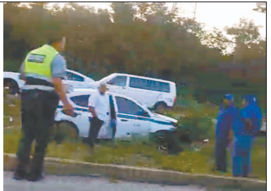
Sobre la carretera hacia Puerto Morelos ocurrió el primer incidente vial, donde un taxista perdió el control y terminó fuera de la cinta asfáltica.

CANCÚN.- Una intensa jornada de atención prehospitalaria y despliegue de operativos viales se vivió en la ciudad y en sus salidas carreteras, luego de que, casi de manera simultánea, se reportaran cuatro percances automovilísticos que dejaron tres heridos y cuantiosos daños materiales, los cuales podrían superar el millón de pesos.