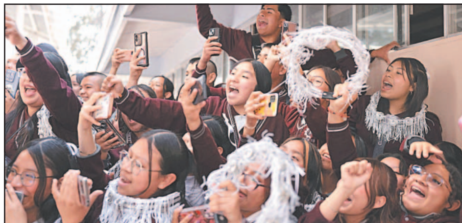
Los alumnos agradecieron a la mandataria su respaldo, que demuestra sensibilidad.