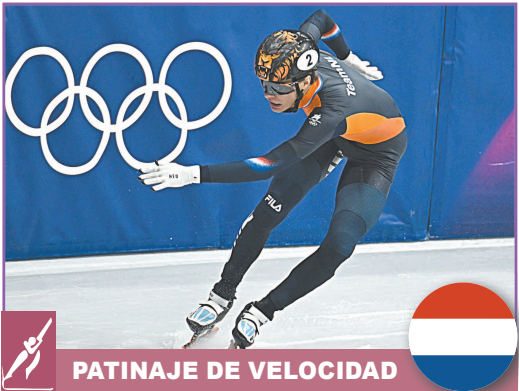
PATINAJE DE VELOCIDAD