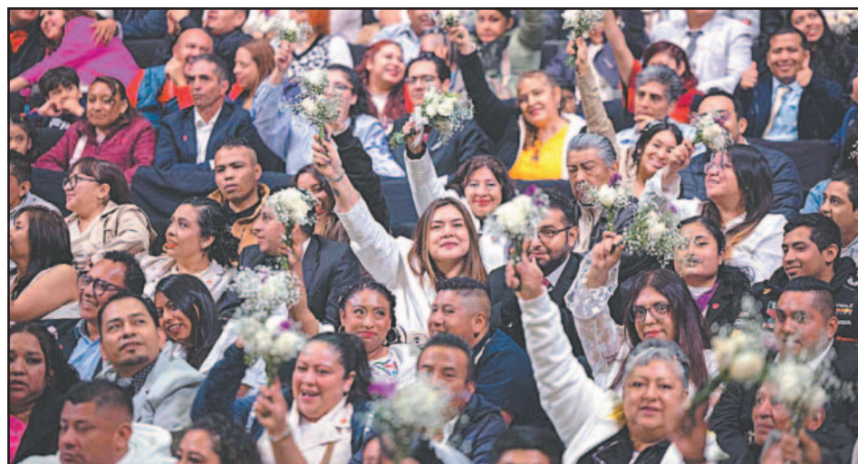
El enlace principal se realizó en el Auditorio Nacional con cientos de contrayentes.