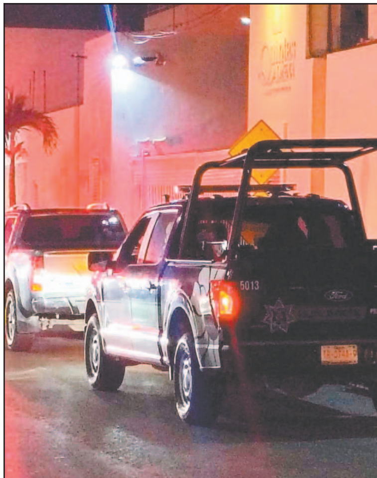
Elementos confiscaron 398 dosis de estupefacientes.