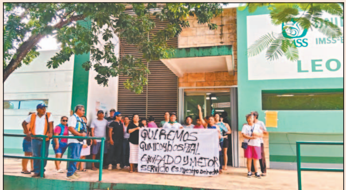
Pobladores refirieron que el tiempo de espera para ser atendidos en la clínica es excesivo. (POR ESTO!)