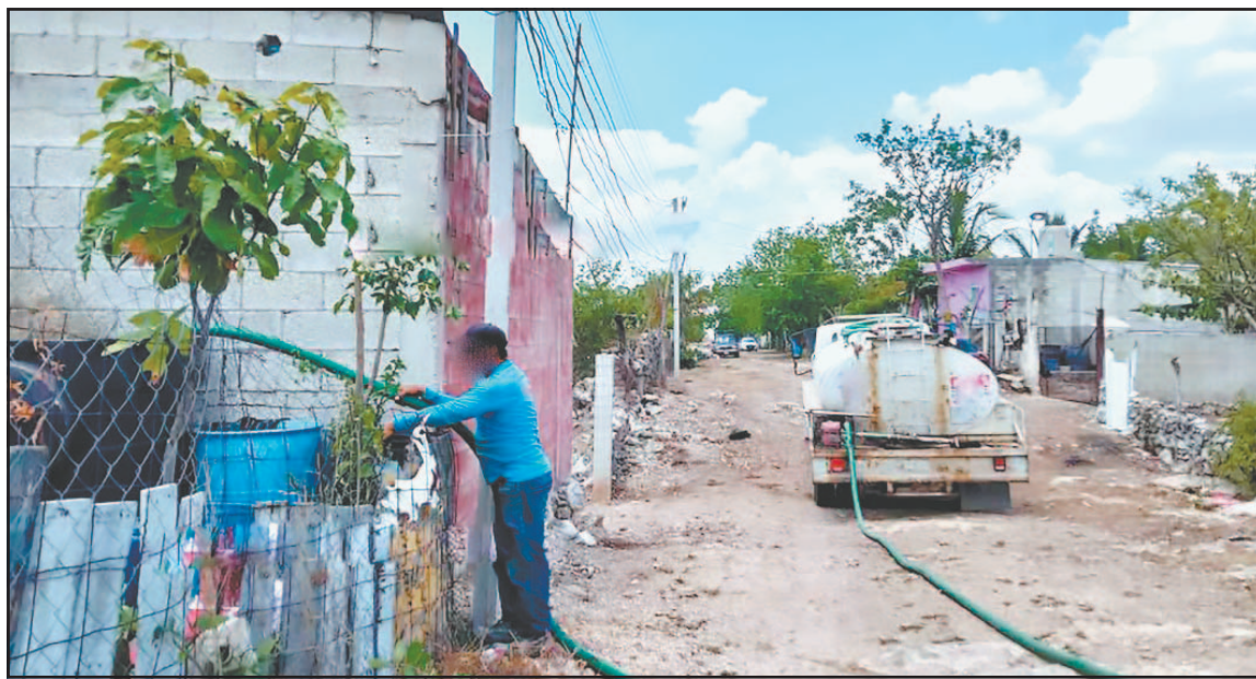
En esta ciudad, algunas de las zonas afectadas por esta práctica son Tres Reyes y El Milagro.