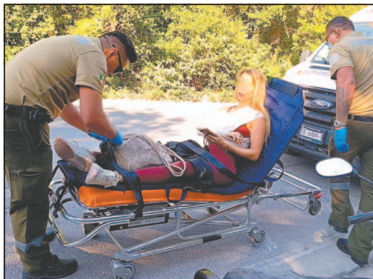
Policías detectaron a la afectada cuando hacían un rondín. (POR ESTO!)