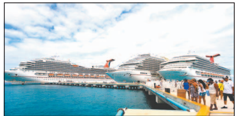
Turisteros dijeron que la alta afluencia les dará un respiro.