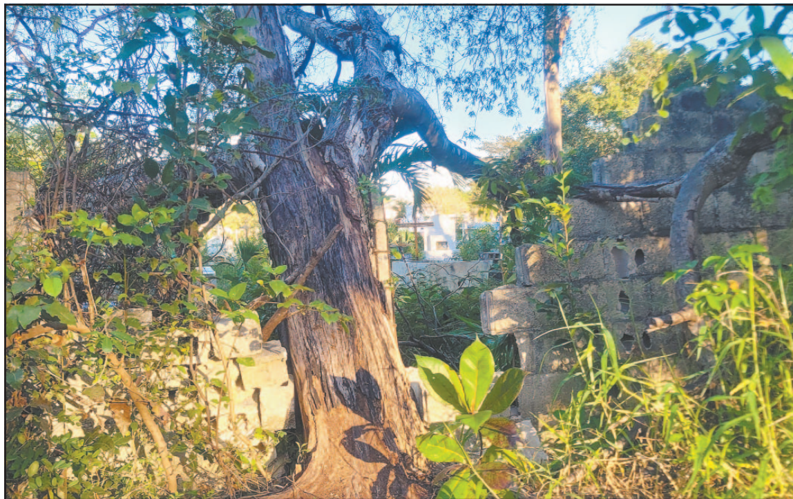
Acusaron ciudadanos que el cerco perimetral causa que la zona se inunde en temporada de lluvias.