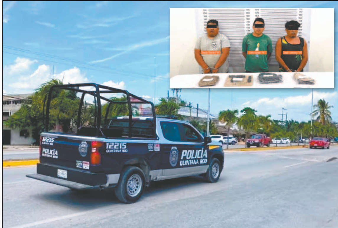
Jesús Daniel "N" y Julio Israel "N", son de Quintana Roo; José Lorenzo "N" es de Tizimín.

Según el parte informativo, durante la actuación policial los agentes localizaron a los tres individuos en posesión de los paquetes que