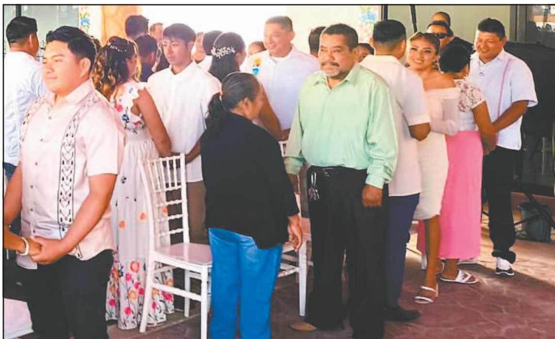
En el marco del Día del Amor y la Amistad, varios enamorados contrajeron matrimonio. (Lusio Kauil)

Señaló que actualmente se solicitan numerosos requisitos para