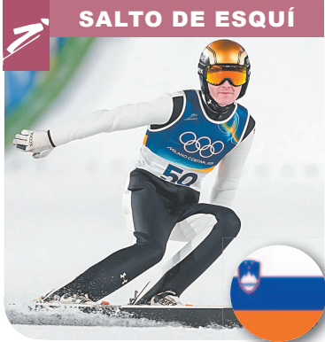
SALTO DE ESQUÍ

El esloveno Domen Prevc se colgó su segunda medalla de oro en los Invernales de Milán-Cortina al imponerse en la prueba de trampolín grande, ayer en Predazzo. Prevc (26 años), acumuló 301,8 puntos para superar al japonés Ren Nikaido (295 puntos), plata después de haber terminado en cabeza la primera manga.