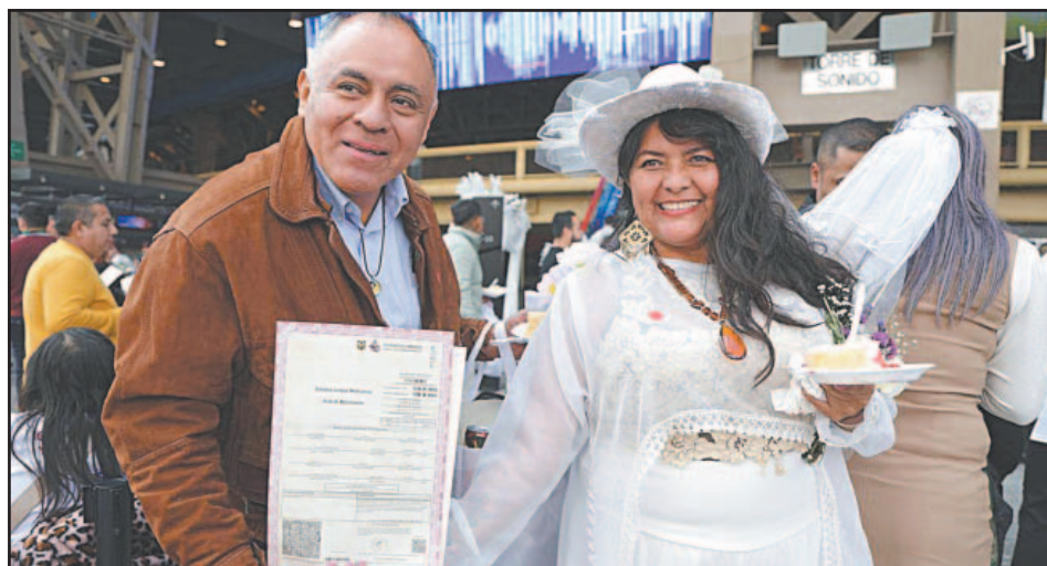
El evento masivo se llevó a cabo en las 16 alcaldías con motivo de la efeméride.