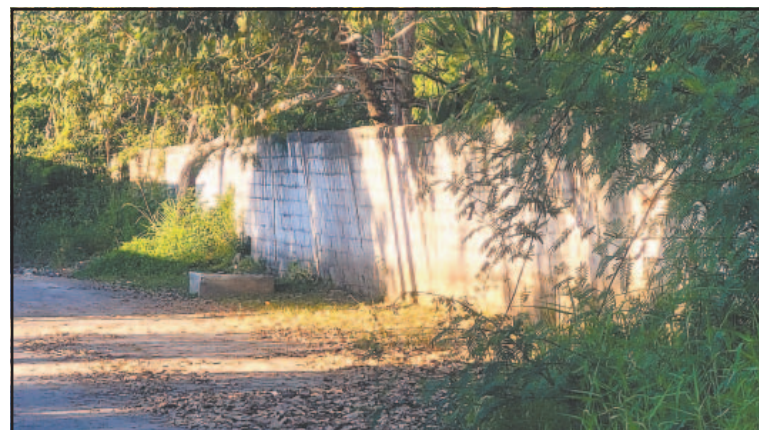
Los troncos ladearon una parte de los bloques.