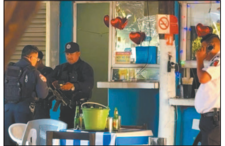
Autoridades recolectaron más de 10 casquillos percutidos y uno útil.