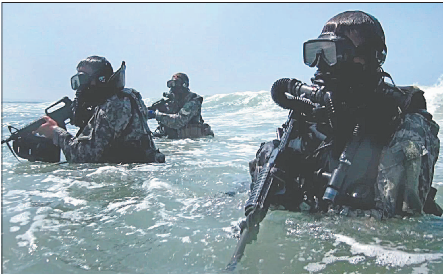
Los elementos de la Semar serán entrenados para realizar acciones marítimas, terrestres y aéreas contra grupos delictivos.