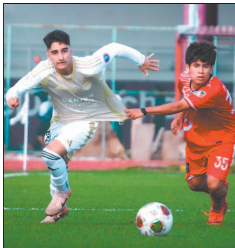
El equipo de la Liga TDP MX venció a Búhos de Puerto Morelos. (R. García)