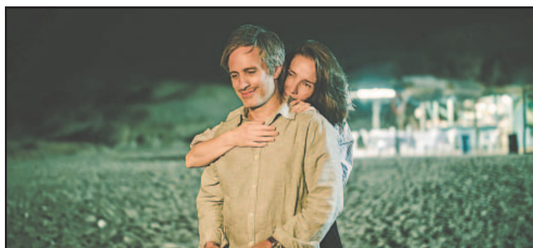
Nada entre los dos será presentada en el European Film Market.