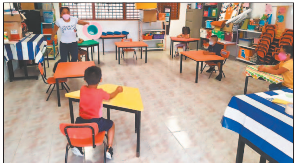
La medida se aplicará al volver a clase tras el receso por carnaval.