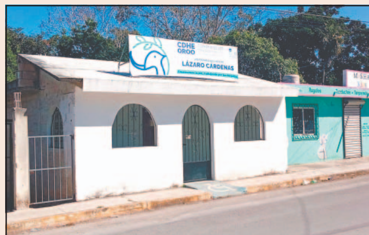
Afectados pidieron al Gobernadora atender la carencia. (E. Cauch)