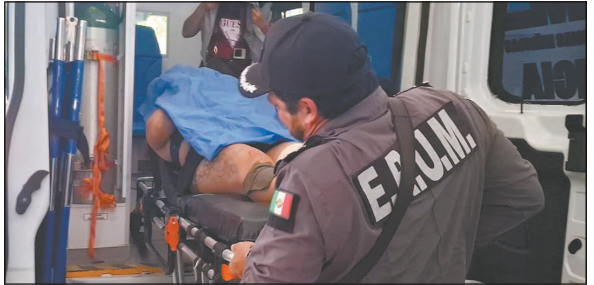
Las víctimas no pensaron que las balas eran para ellas y se agacharon bajo las mesas.

Asimismo, se informó que el responsable vestía playera de manga larga color blanco, pantalón de mezclilla azul y gorra, y que escapó en una motocicleta, presuntamente por la avenida Leona Vicario con dirección a la Lombardo Toledano.