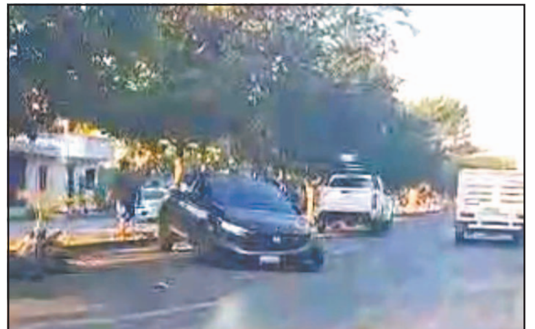
Atrás de la guarnición militar, un automóvil atravesó el camellón.

En los siniestros ocurridos en vías federales, elementos de la Guardia Nacional, División Caminos, realizaron el levantamiento de datos