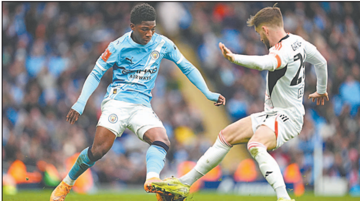
Los Citizens no dispararon a puerta hasta el segundo tiempo contra un equipo de cuarta división.

Recientemente adquirido por un grupo de inversores entre los que figuran las leyendas del United David Beckham y Gary Neville, el Salford resistió bien hasta el segundo tanto, obra de Marc Guéhi (81’), que marcó por primera vez desde su llegada al City , en enero procedente del Crystal Palace .