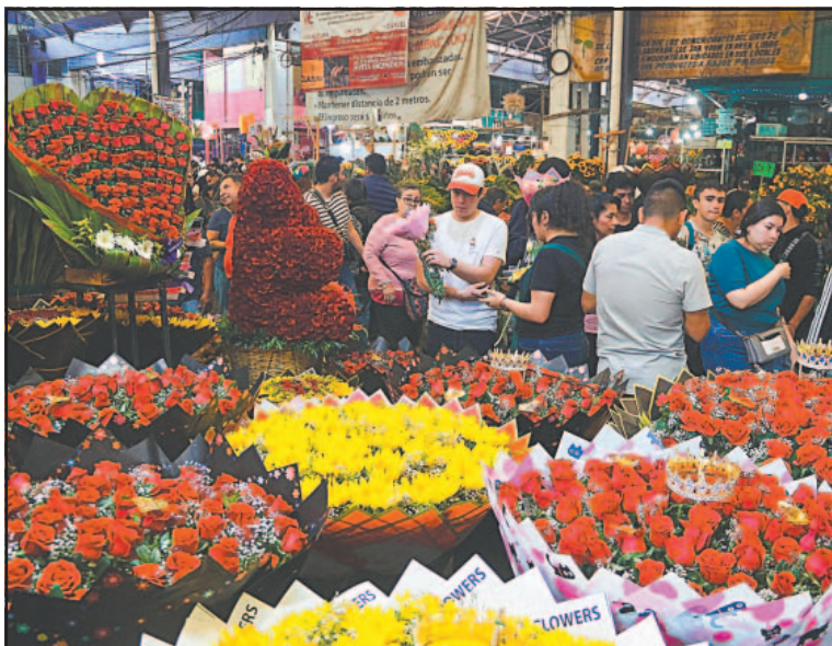
La rosa, gerbera y gladiola fueron las más solicitadas.