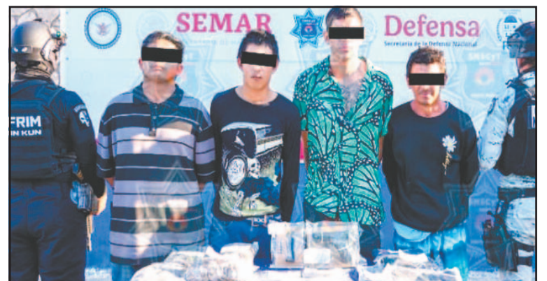
Los detenidos manipulaban sustancias en la Supermanzana 91.