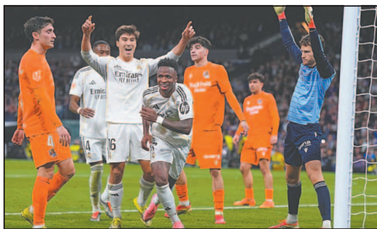
Los merengues frenaron la racha invicta de la escuadra de Matarazzo.