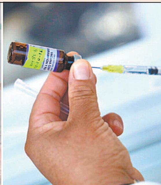
Actualmente, el país tiene 9 mil 478 casos acumulados confirmados de la enfermedad.