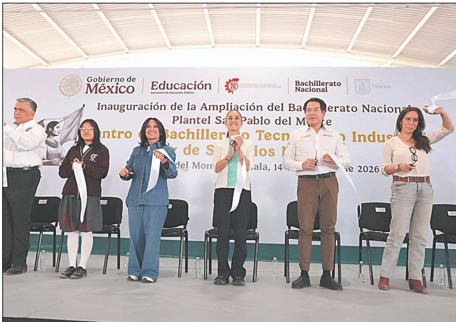
Claudia Sheinbaum explicó ayer que la meta al cierre de 2026 es crear 150 mil espacios de educación media superior. (POR ESTO!)

La gobernadora de Tlaxcala, Lorena Cuéllar Cisneros, agradeció el apoyo de la Presidenta e informó que el Gobierno estatal se sumó a esta estrategia con la creación de nueve opciones de educación superior y 25 de bachillerato para las y los jóvenes tlaxcaltecas,