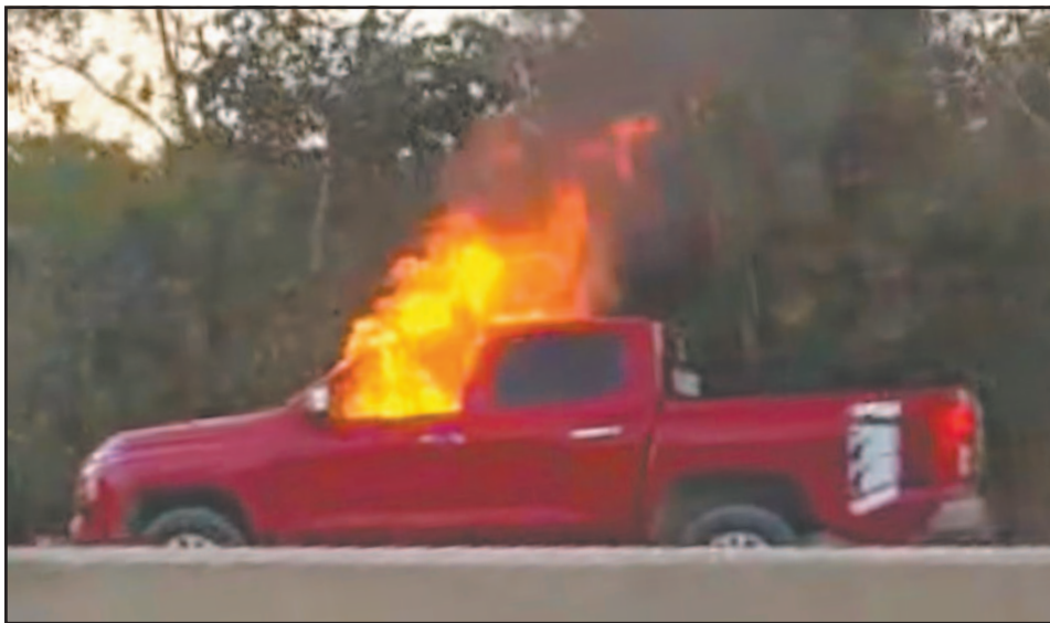
Supuesta falla mecánica provocó el incendio de una camioneta en el tramo Cancún-Mérida.

Chetumal, Q. Roo, domingo 15 de febrero del 2026