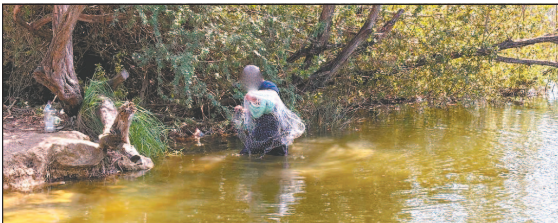
En la sabana han tirado personas sin vida, a fin de que los cocodrilos se las coman.