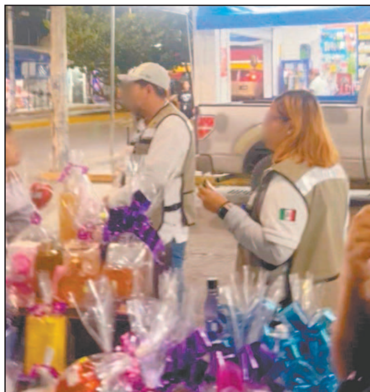
Al parecer, pidieron hasta 5 mil pesos en los días festivos. (POR ESTO!)