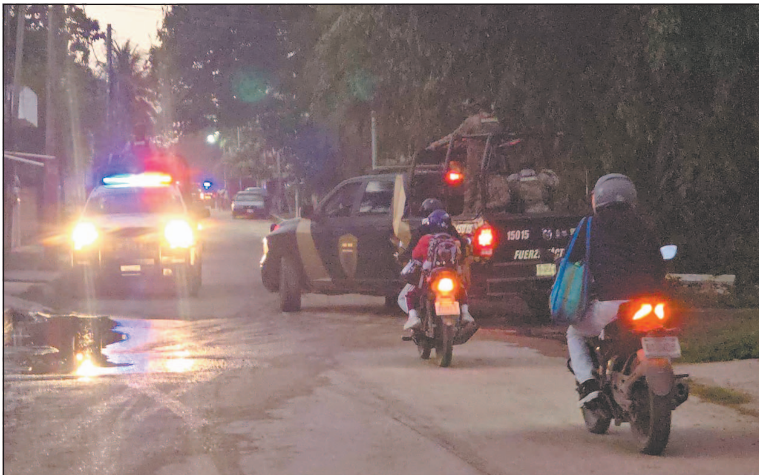
La víctima fue “levantada” el jueves y el viernes encontraron su cadáver en un camino de terracería; presentaba huellas de tortura. (POR ESTO!)