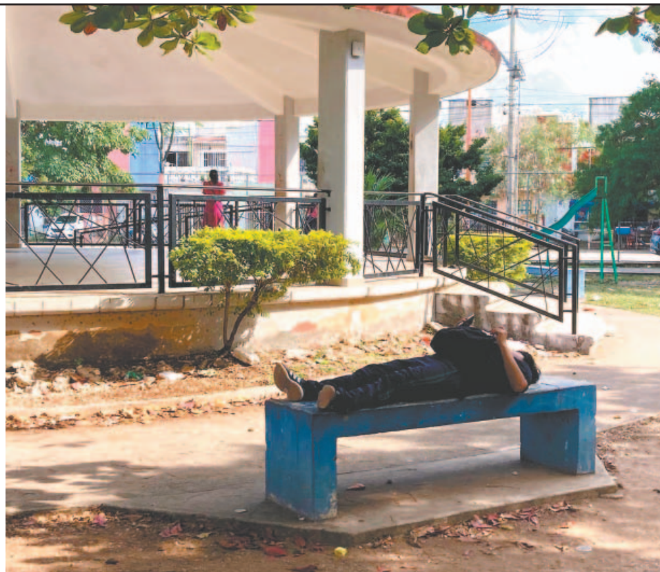
Promotores y residentes comentaron que las canchas están grafitadas y por las noches acuden personas en situación de calle a dormir sobre las bancas.