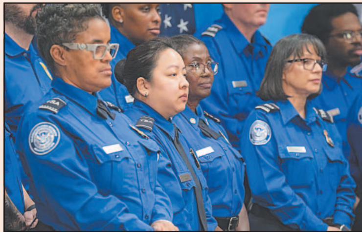
Esperan que los agentes de la TSA trabajen sin cobrar.

Se espera que los agentes de la Administración de Seguridad en el Transporte (TSA, por sus siglas en inglés) trabajen sin cobrar mientras los legisladores siguen sin llegar a un acuerdo para la financiación anual del DHS. Los agentes de la TSA pasaron por la misma situación durante el histórico cierre que terminó el 12 de noviembre, pero expertos en