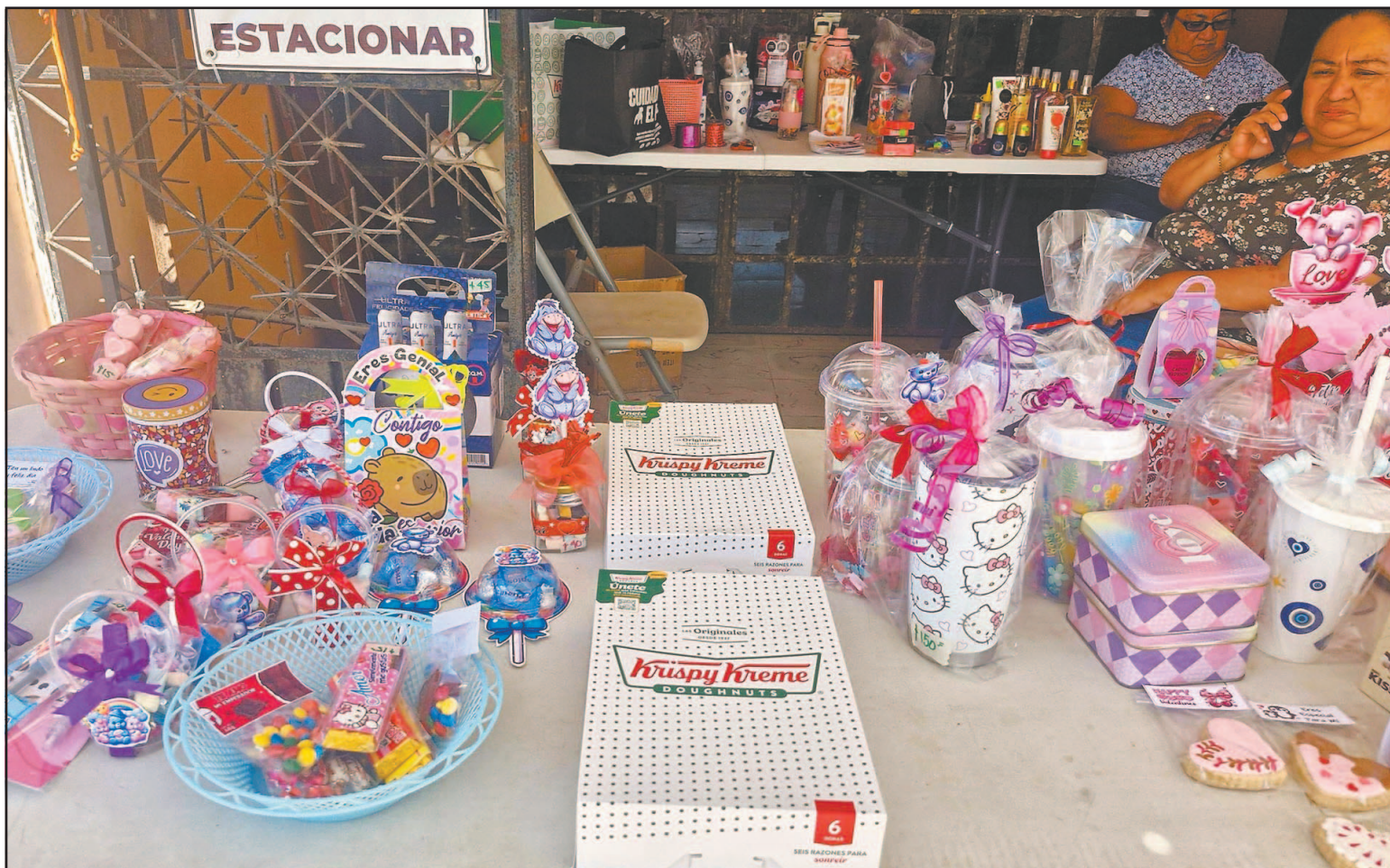
Dueños de locales señalaron que invirtieron para ofertar diversos productos, pero en las calles casi no había compradores. (Enrique Cauch)