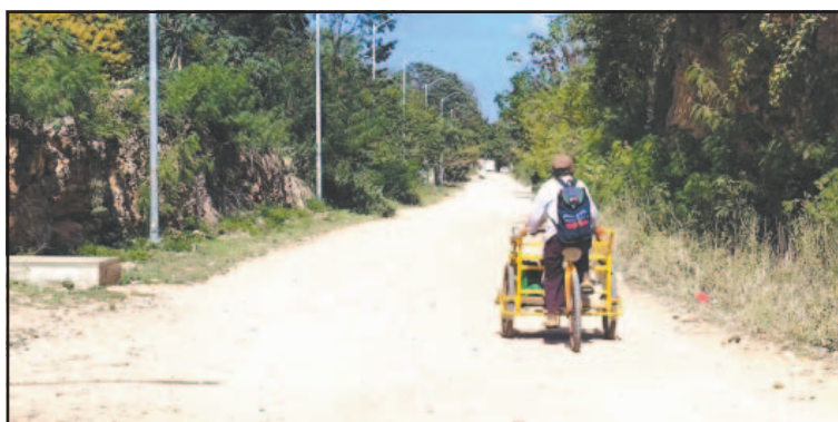
Vecinos dijeron que la avenida principal está en mal estado. (L. Kauil)