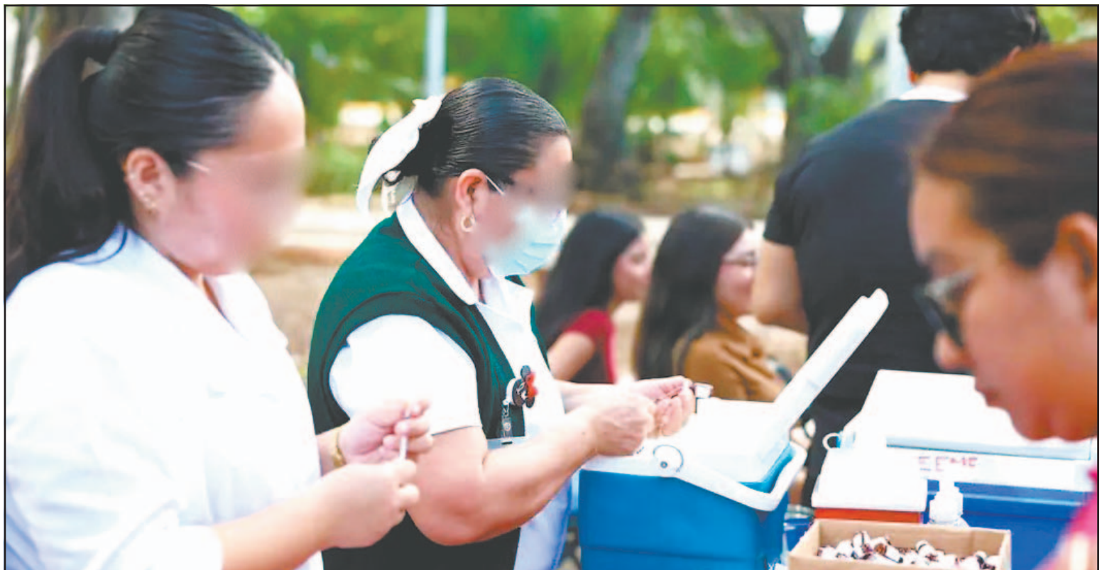
Inconformes dijeron que a pesar de que faltaba hora y media para el cierre de labores enfermeras les informaron que debían volver otro día. (POR ESTO!)