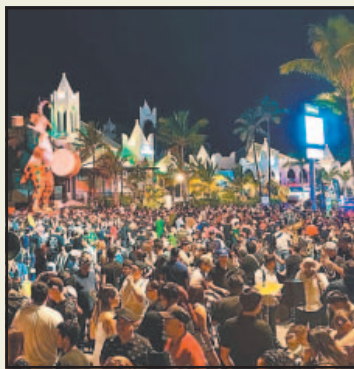
Se contabilizó 33 mil personas.

Protección Civil informó que el evento con mayor afluencia se desarrolló el pasado viernes en el Estadio Teodoro Mariscal , que concentró a más de 16 mil personas durante la coronación de la reina de los Juegos Florales y el espectáculo musical dedicado al músico sinaloense Germán Lizá-