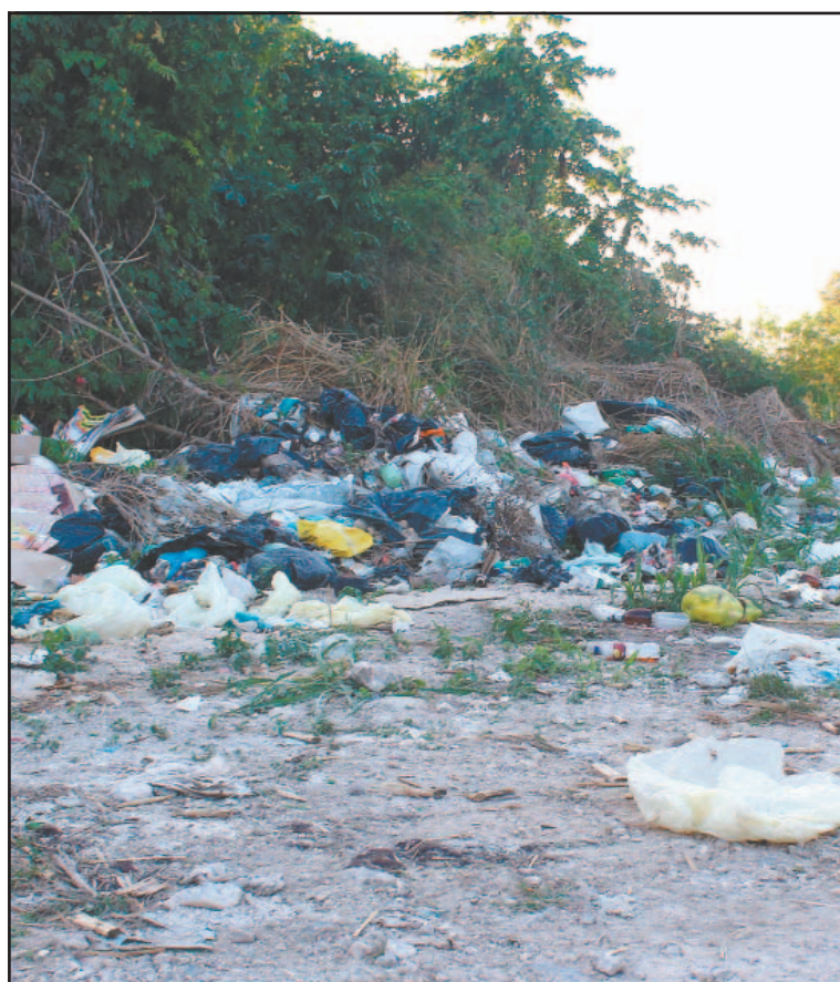
Habitantes dijeron que llevan sus desechos al vertedero. (A. Bautista)