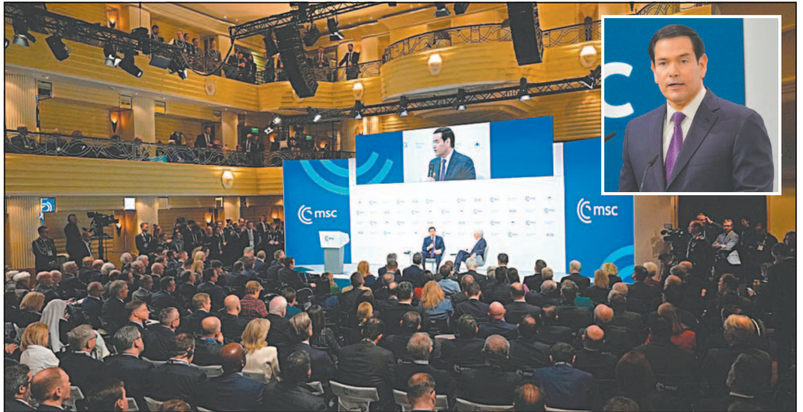
El jefe de la diplomacia estadounidense intentó enmendar expresiones del vicepresidente Vance y del mandatario republicano.

El jefe de la diplomacia estadounidense alegó que la euforia de la victoria Occidental en la Guerra Fría condujo a una “peligrosa