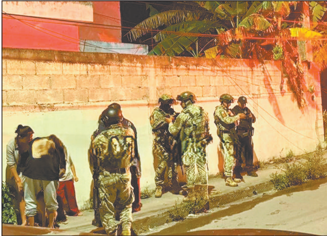
Oficiales detuvieron al sospechoso de causar el fuego que arrasó con muebles y ropa. (L. Jiménez)

Versiones preliminares indicaron que el presunto responsable sería el proveedor del hogar, quien