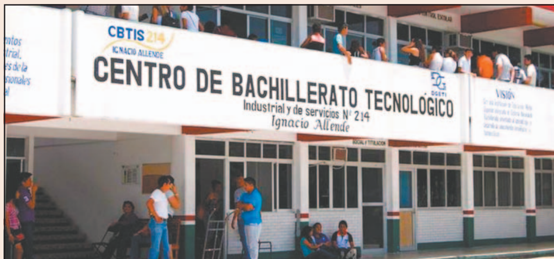
Autoridades eliminaron el examen de admisión como criterio de asignación de espacios. (E. Martín)