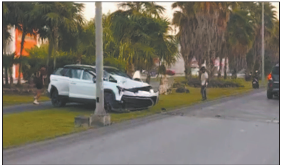
En la avenida Huayacán, un vehículo colisionó contra postes de la CFE y alumbrado público.