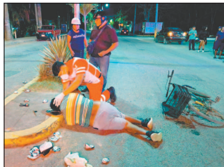
Paramédicos atendieron al herido en la colonia Leona Vicario.

Después de recibir atención prehospitalaria, el conductor de la bicicleta —conocido en la zona