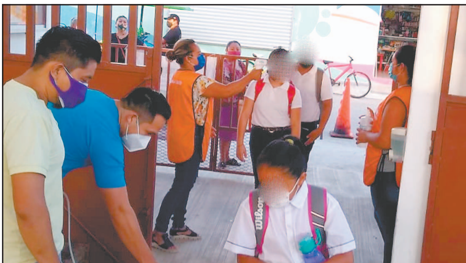
Estudiantes detectados con síntomas sospechosos a la hora de entrada serán aislados.