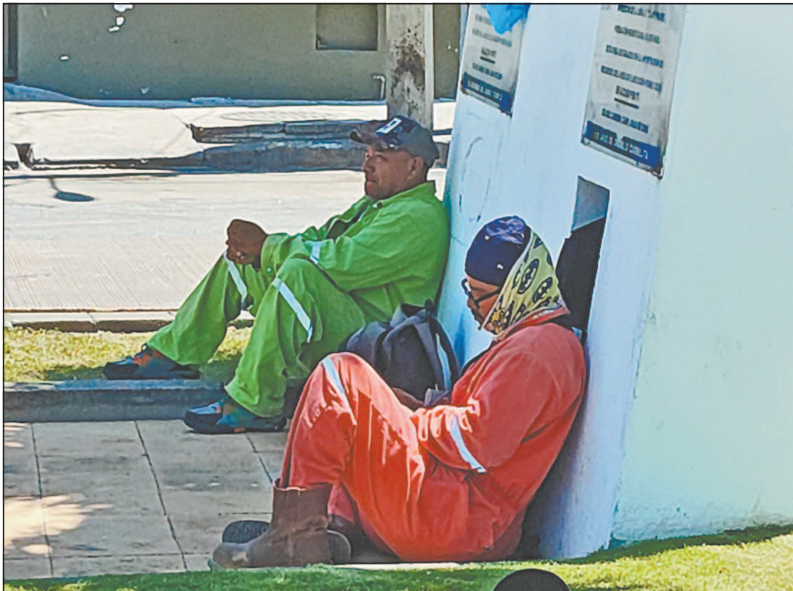
Empresarios y trabajadores se mantienen en la incertidumbre, preocupados y endeudados ante la crisis de insolvencia. (Perla Prado G.)

Roldán Pérez también recordó el episodio en el que no se concretó el traslado de oficinas de PEMEX a Ciudad del Car-