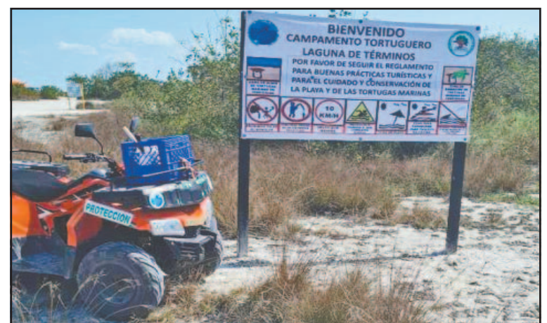
El achicamiento de las playas es una amenaza ecológica. (P. Prado)