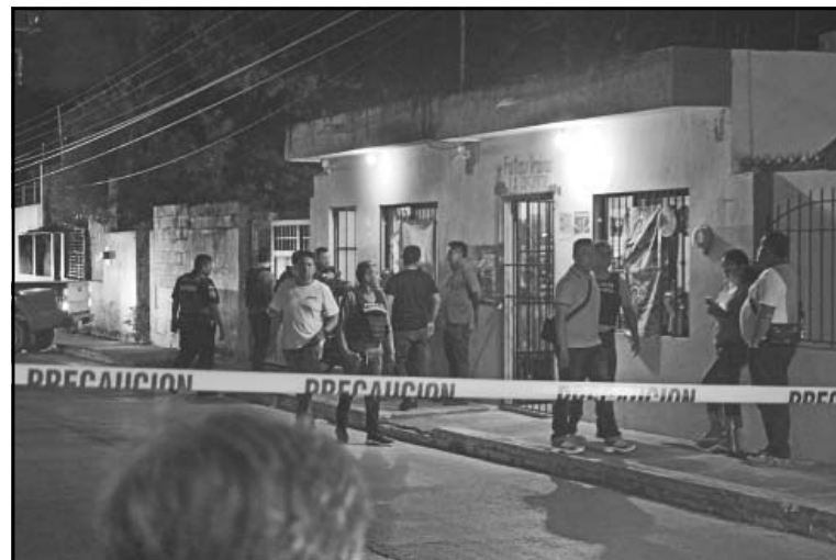
Armas de fuego y golpes letales marcan los últimos crímenes.