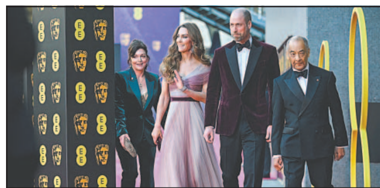
La familia real está envuelta en escándalo relacionado con Epstein.

William y Kate recorrieron la alfombra roja sin detenerse a responder preguntas, una dinámica habitual en este tipo de ceremonias,