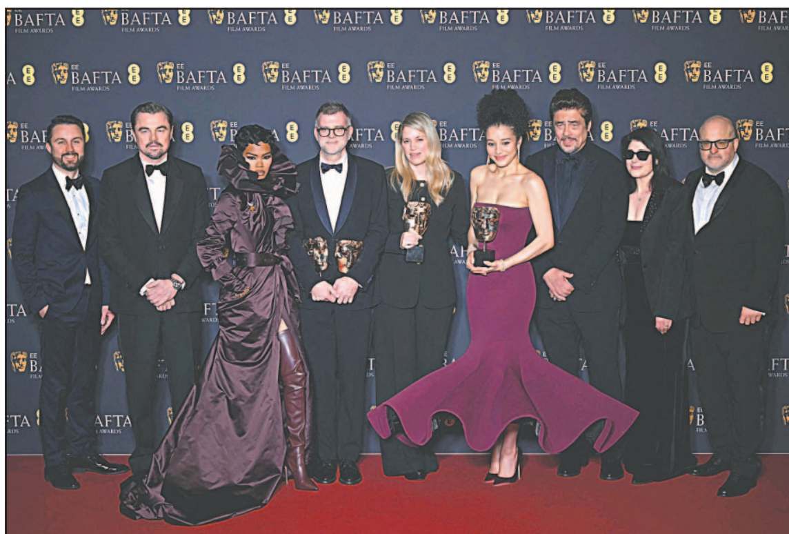
Ganó distinciones a la dirección, guion adaptado, fotografía, montaje y actor de reparto para Sean Penn.

lloso”, dijo Anderson al aceptar el premio a la dirección.