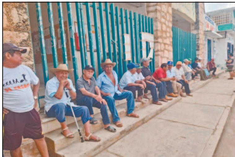
Labriegos denuncian retrasos en la entrega de 950 pesos por tonelada.