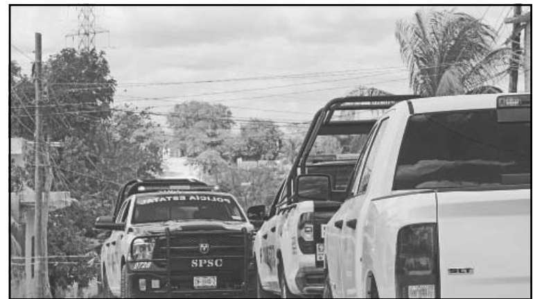
La SPSC aseguró a los implicados y recuperó un arma y cartuchos.

PUNTOS ACUMULADOS AL 22 DE FEBRERO DE 2026