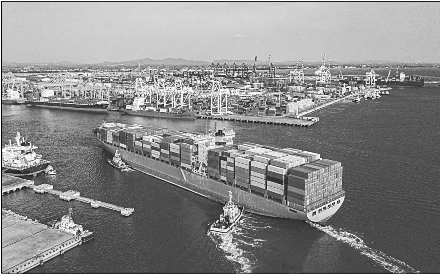
Economía aseguró que los productos que sí cumplen con las reglas de origen entran a EE.UU. sin pagar impuestos especiales. (POR ESTO!)