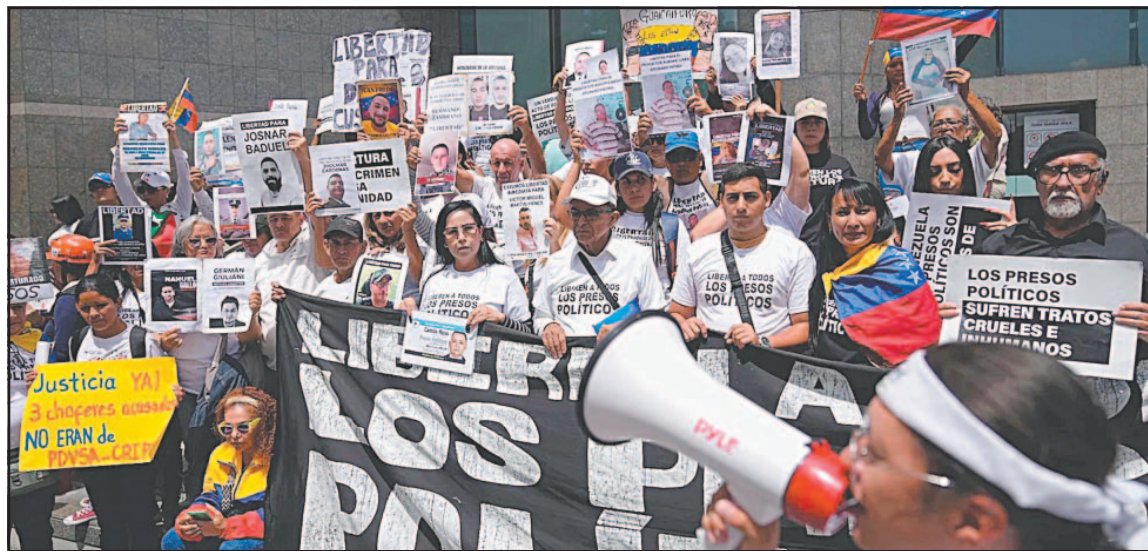
Las personas protestan dentro de la cárcel El Rodeo I , que se encuentra a las afueras de Caracas.