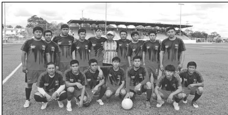
El equipo sublíder bajo al tercer lugar tras un duro enfrentamiento en el "MC".