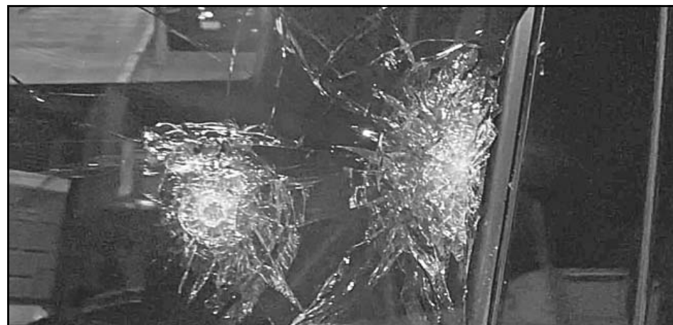
El periodista Ciro Gómez Leyva fue agredido cuando iba en su camioneta, en el 2023.