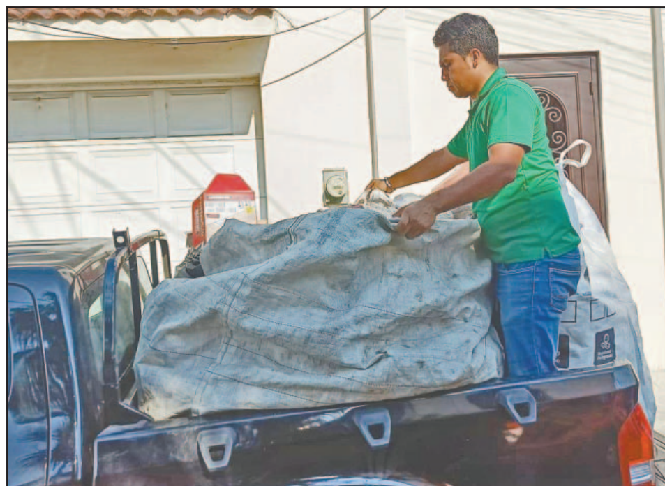
Buscan que más personas se sumen a las actividades de la agrupación. (Perla Prado)