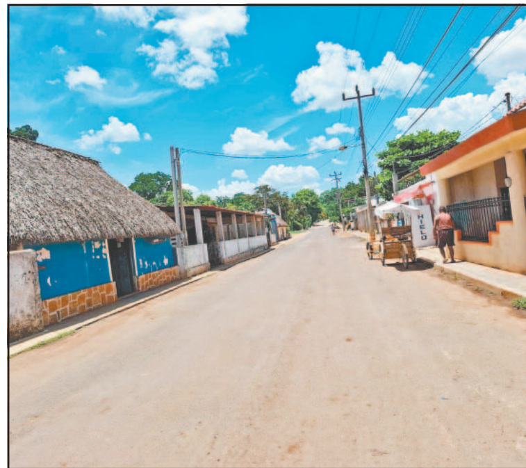
La población enfrenta escasez desde hace dos meses. (A. Caamal)