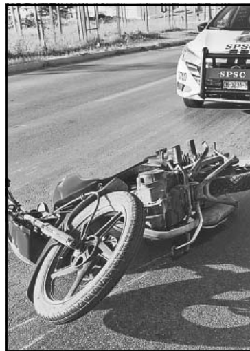
Taxi impacta por alcance a una pareja en la colonia Kalá.