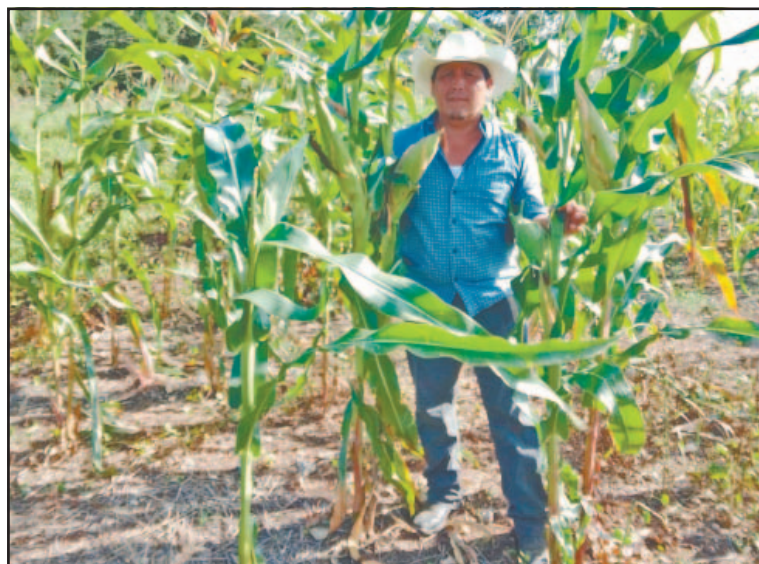
El ejido se considera como el huerto del valle de Yohaltún. (Jorge M.)

CHAMPOTÓN, Campeche.- La zona del ejido de Chacheito es considerada a nivel local como el huerto del Valle de Yohaltún, debido a su destacada producción anual de elote, la cual, en una buena cosecha, puede alcanzar entre dos y 2.5 millones de elotes, cantidad que genera una utilidad neta estimada en 1.8 y 3.8 millones de pesos.