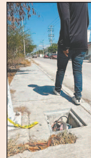
Piden a la CFE que atienda el problema. (Jorge May S.)