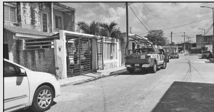
Se incendia unidad dentro de casa por cortocircuito. (Especial)