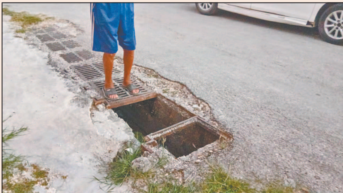
Además del riesgo de caídas, este lugar desprende fetidez que afecta a los colonos. (Joaquín G.)