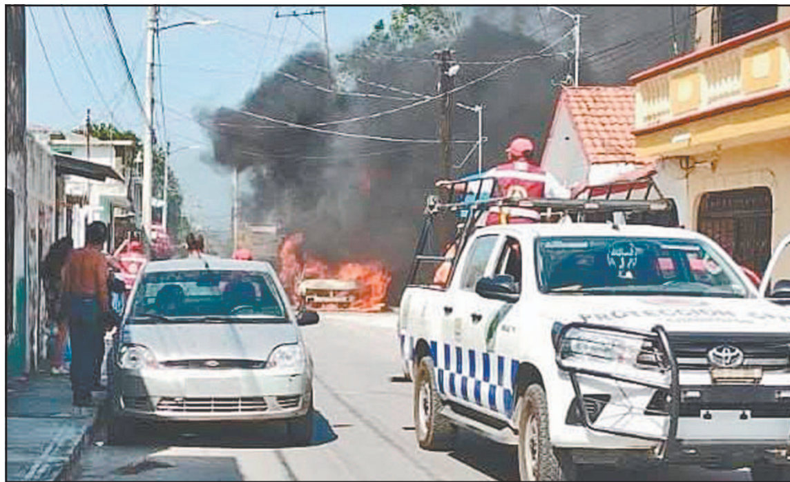
El incidente generó temor entre los testigos al suponer que estaba relacionado con un hecho nacional.

Tanto la Secretaría de Seguridad y Protección Ciudadana del