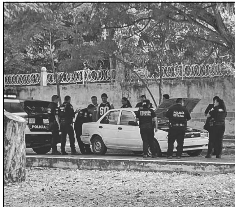
El vehículo portaba placas sobrepuestas de Yucatán. (Lucio Blanco)