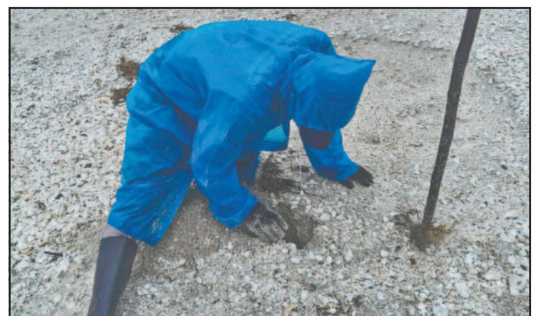
Los activistas solicitan al gobierno estatal mejor apoyo. (Perla Prado)