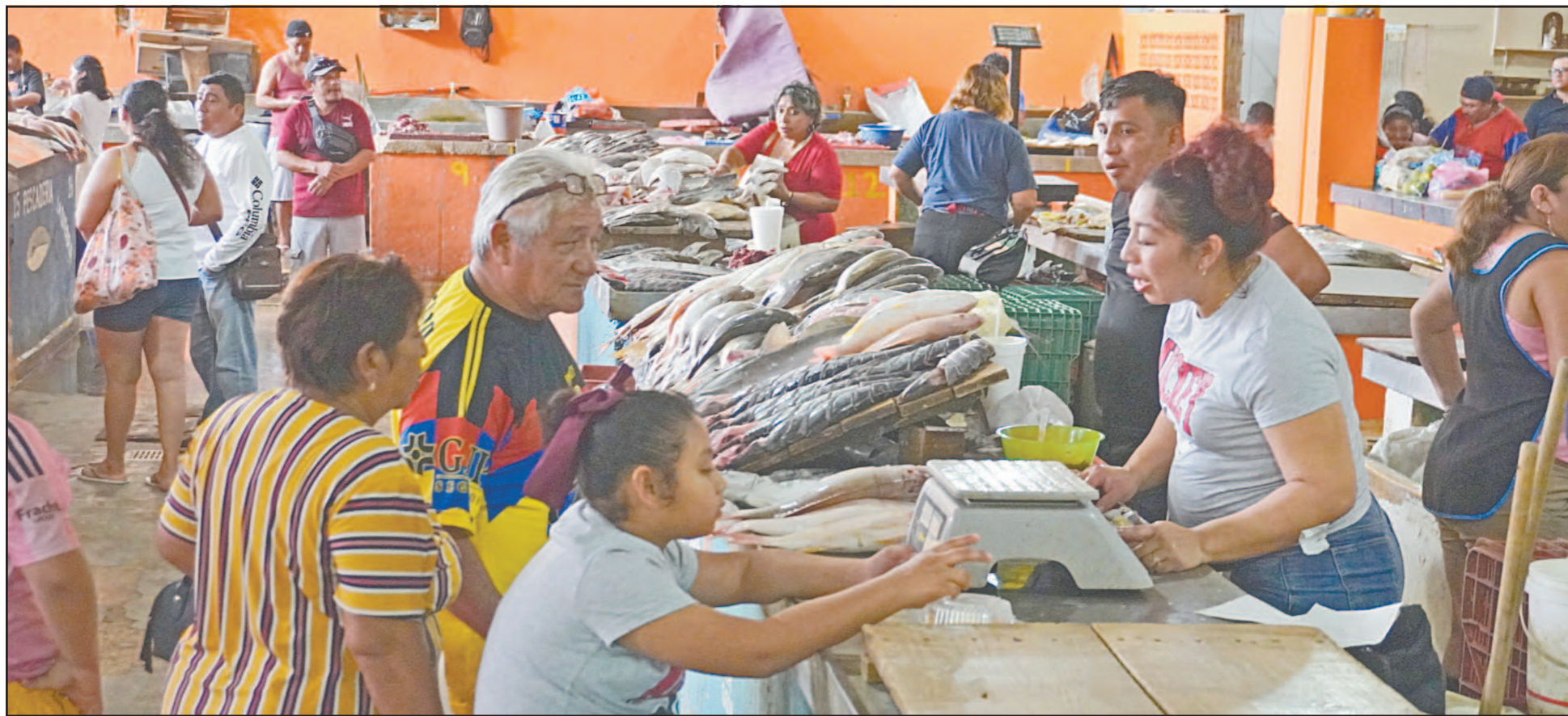
Los locatarios del mercado principal opinan que la falta de “marchantes” se debe a que las quincenas están casi agotadas, pero a fin de mes habrá un repunte. (Lucio Blanco)