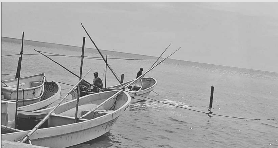
El cierre de puertos arruinó compromisos con compradores, justo en inicio de Cuaresma. (Erik Caamal)