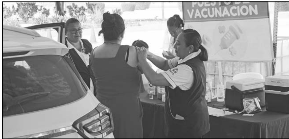
En la primera jornada aplicaron dos mil dosis con ayuda del IMSS, Issste y la Semar.