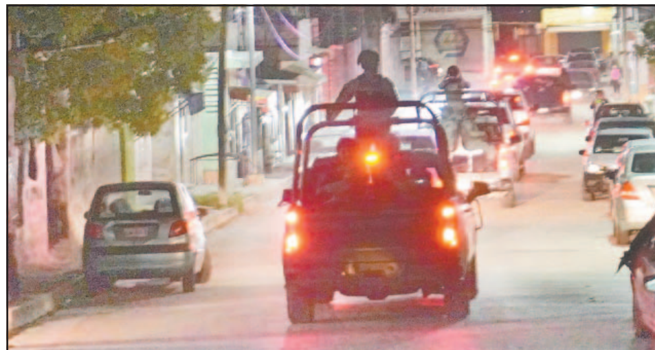
La presencia de los uniformados incrementó en el transcurso de la tarde. (Lucio Blanco)