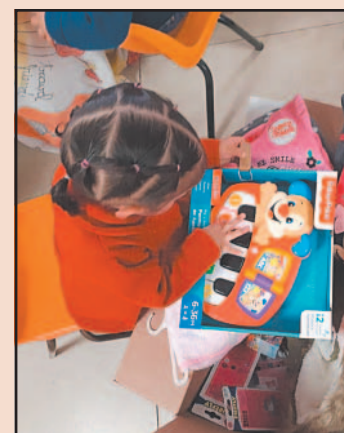
Trabajadores del DIF de Oaxaca acusaron casos de maltrato.