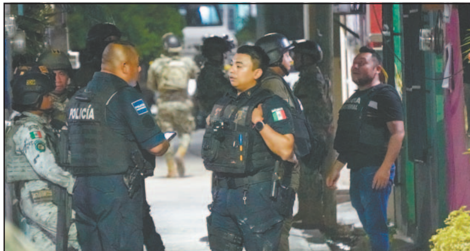
En Ciudad del Carmen los operativos se desplegaron en puntos estratégicos. (L. Blanco)