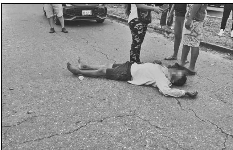
La víctima denunció el hurto de sus pertenencias y señaló agresores.