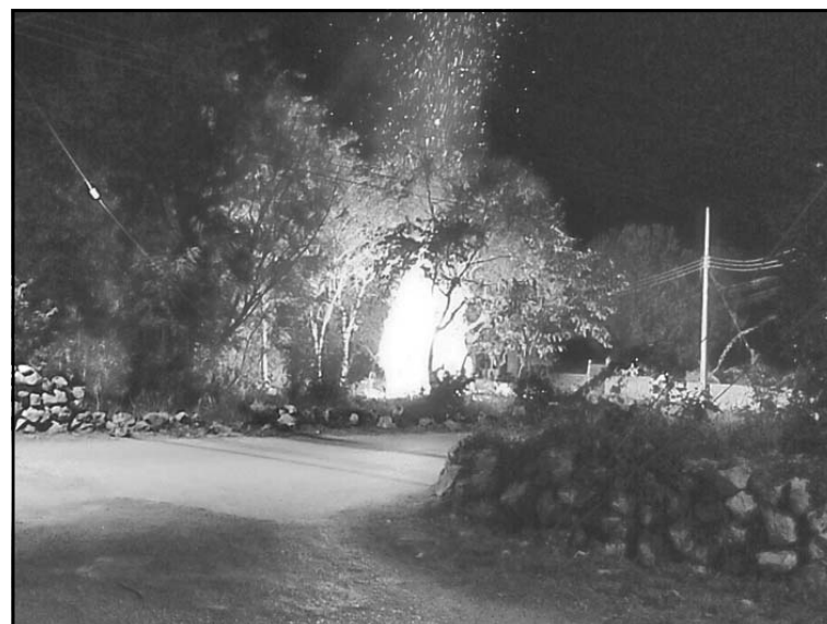
El material con el que estaba construido el predio fue determinante.