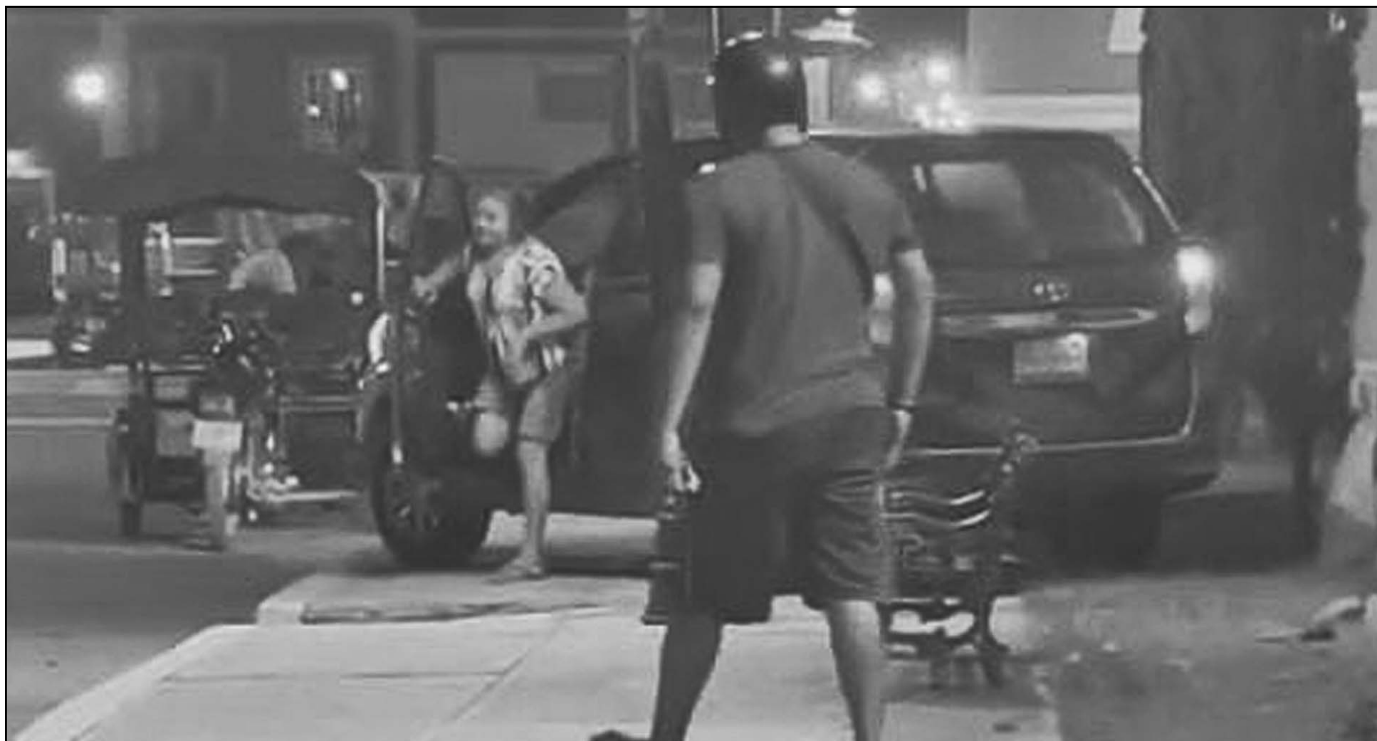
La mujer, al ver lo ocurrido, emprendió la huida, pero por el accidente el vehículo presentó una fuga de aceite que la policía rastreó, y la fue a buscar a su casa. (Erik Caamal)