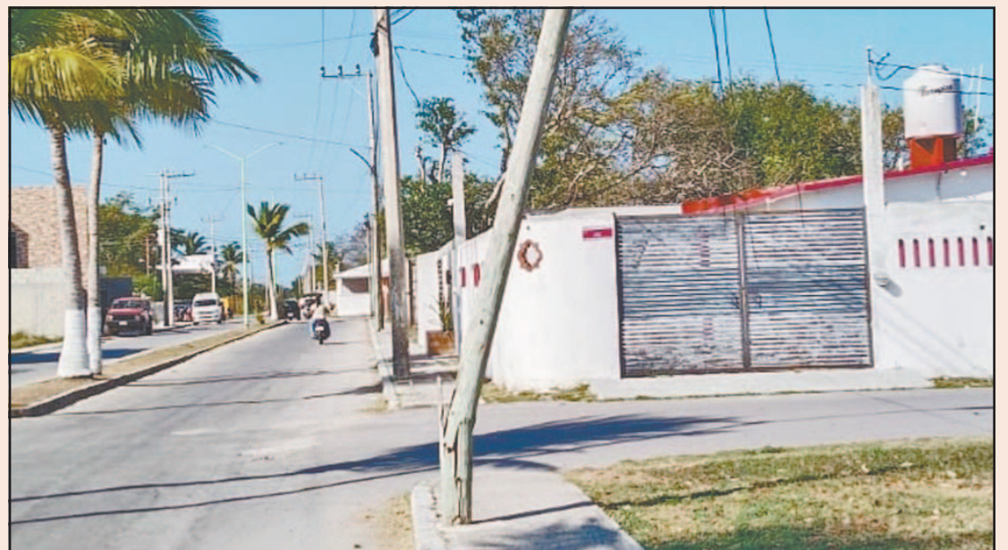
La estructura está al paso de cientos de estudiantes, lo que genera mayores temores. (Pedro Díaz)