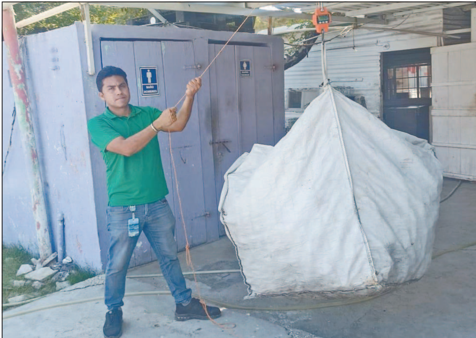
Además de plástico, recuperaron 89 kilos de cartón, 25 de vidrio y cuatro de baterías alcalinas, también 12 litros de aceite usado.