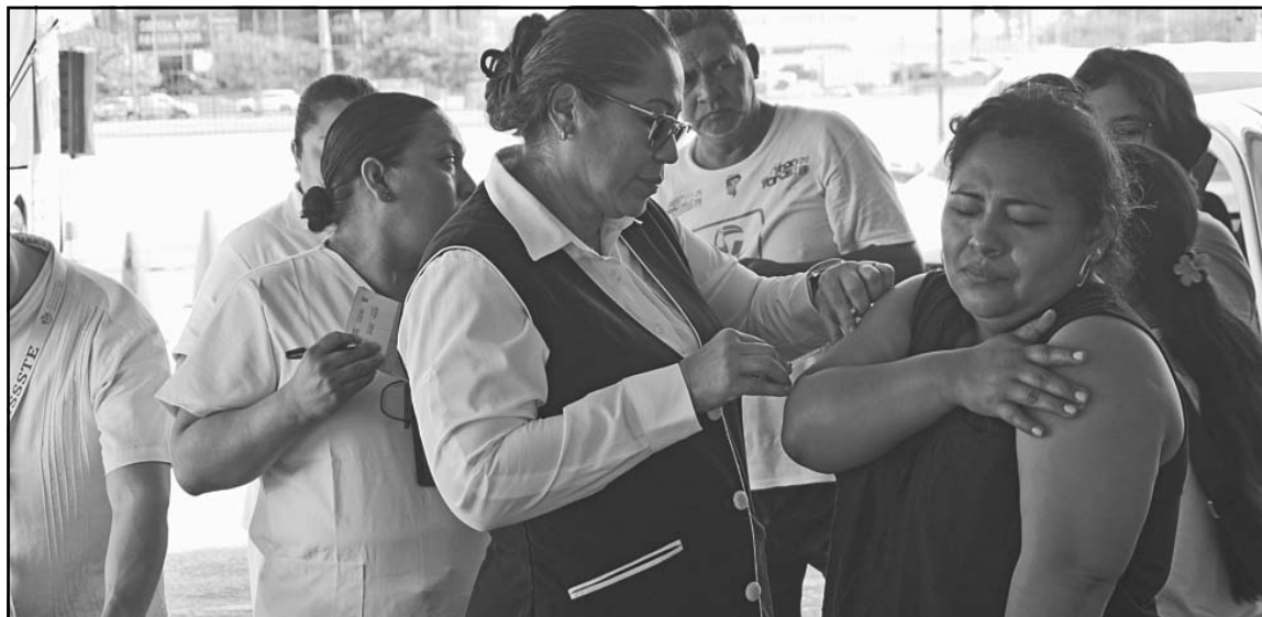
Se registró buena afluencia de la ciudadanía a las acciones encaminadas a cuidar la salud.

En cuanto al suministro, aseguró que la distribución se realiza conforme a la programación