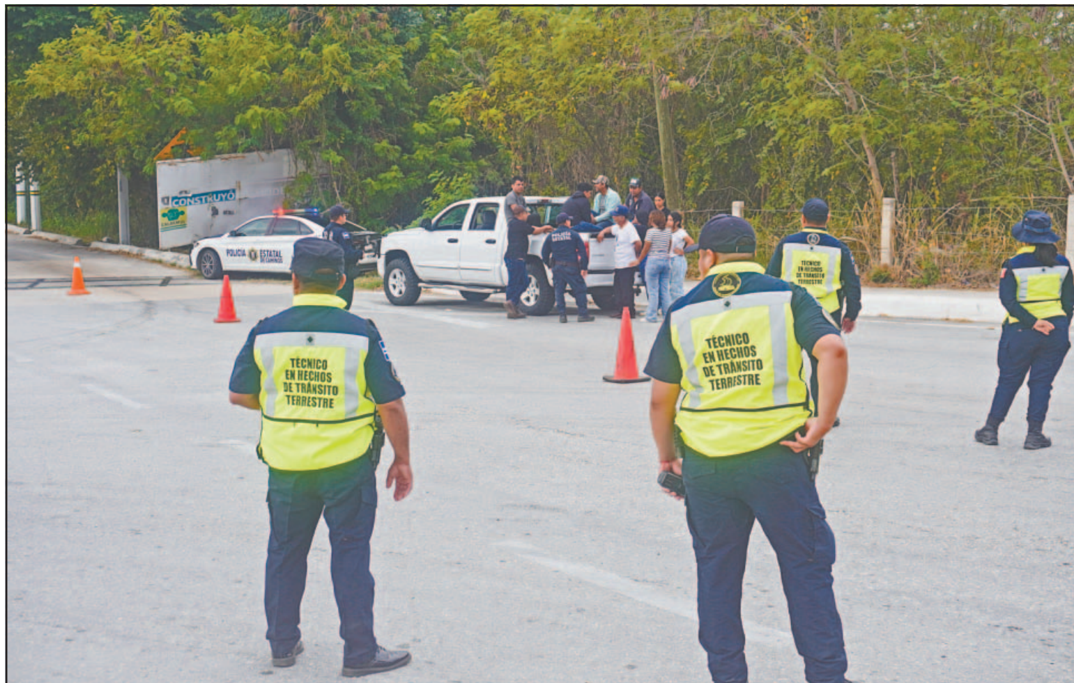
Las fuerzas policíacas estatales efectúan labores de proximidad social en las colonias, carreteras y lugares públicos. (Lucio Blanco)

Lo anterior, debido a que durante la mañana del domingo y hacia el cierre de la tarde, se registraron diversos enfrentamientos armados en la zona norte del país, siendo considerado Jalisco como foco rojo, a raíz de que, las fuerzas armadas abatieron al cabecilla del Cartel Jalisco Nueva Generación (CJNG) Nemesio Oseguera