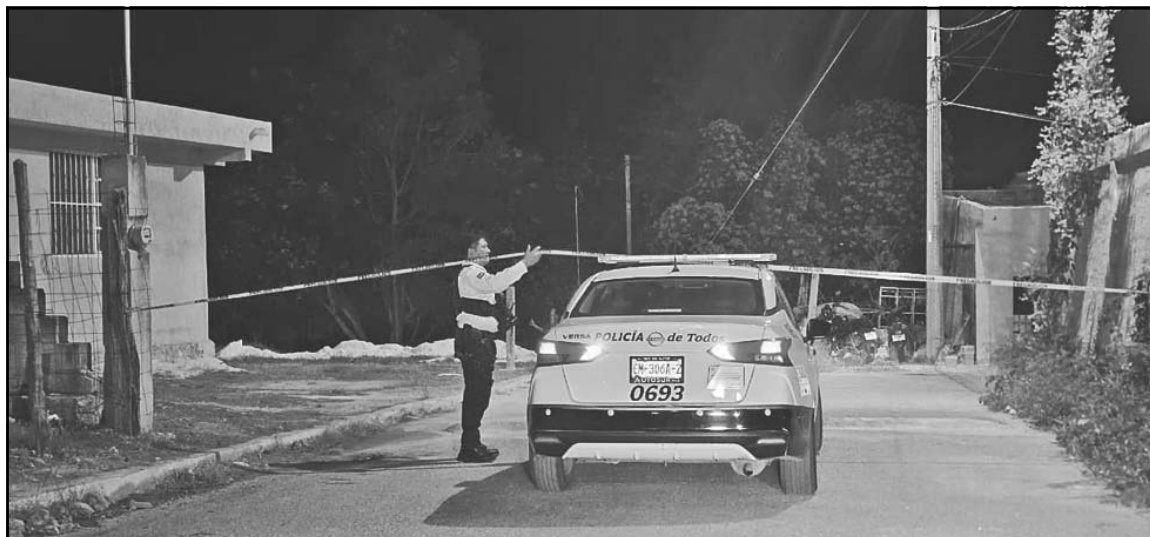
En la Cuarta Privada del Becán, SPSC y Semefo acordonó la zona y realizó el levantamiento del cuerpo.

Los datos oficiales también muestran un incremento en los re-