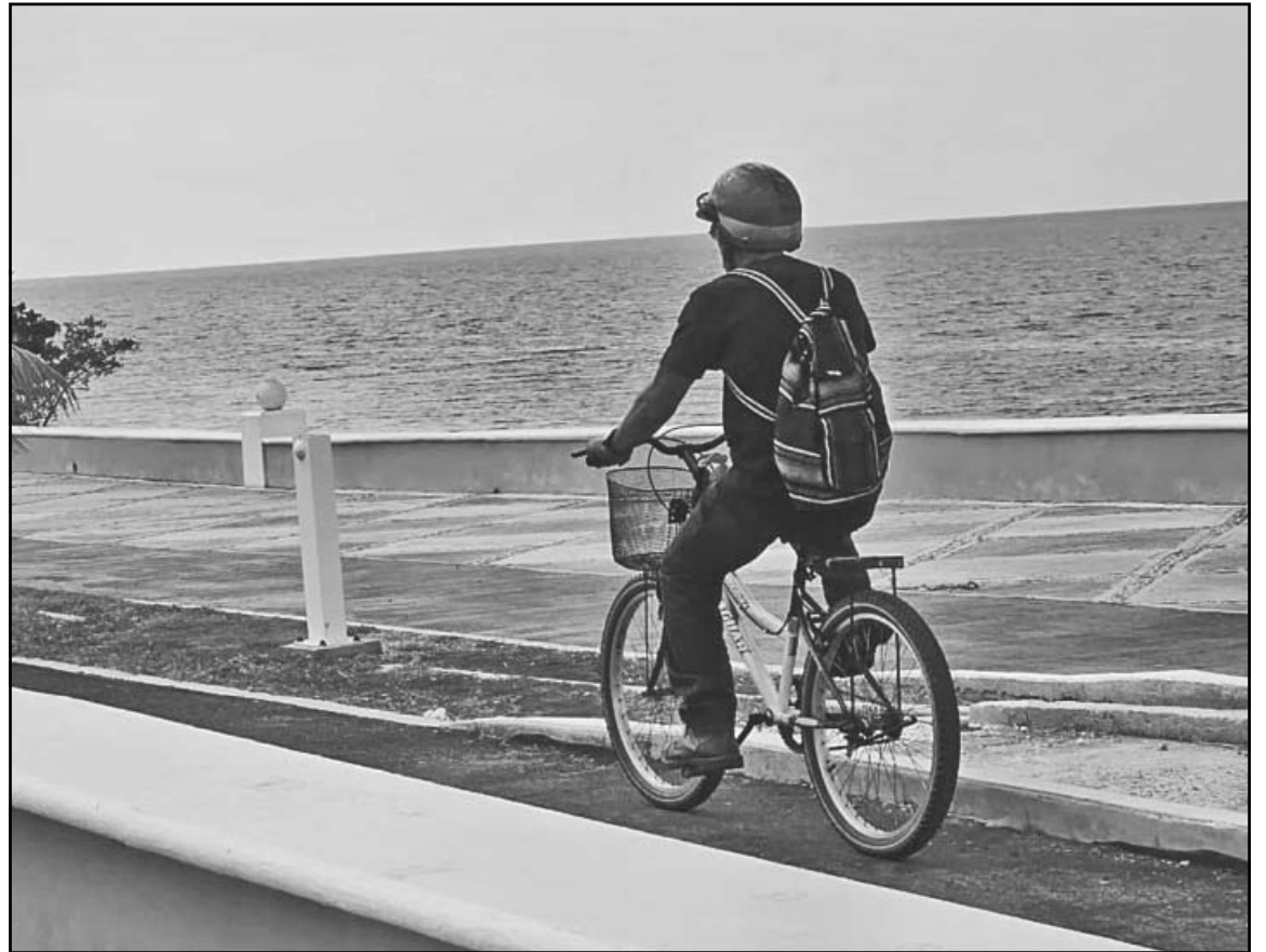
Las autoridades exhortaron a la población a mantenerse informada y seguir recomendaciones. (A. Pech)