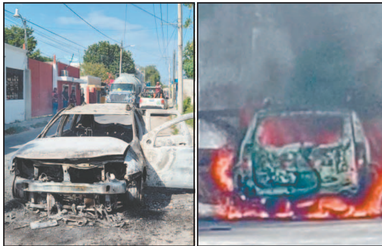
Los ocupantes lograron salir a tiempo y resultaron ilesos. (J. May)