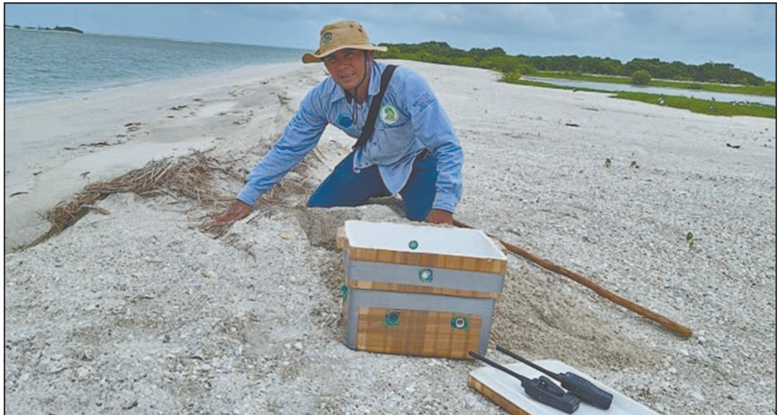
El encargado de uno de estos santuarios de preservación de los quelonios informó que trabajan ya en el aspecto logístico.

No obstante, explicó que el principal reto que enfrentan es la erosión en distintos puntos del litoral, particularmente en Punta San Julián, parte de Puerto Real, donde el avance del mar ha provocado el derrumbe de franjas de playa. Esta situación pone en riesgo la anidación, ya que al no existir suficiente playa las tortugas