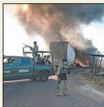
La ciudad quedó incomunicada.

Usuarios de las redes sociales compartieron gráficas de unidades incendiadas, así como ponchallantas en diversas zonas de la ciudad, por lo que los conductores