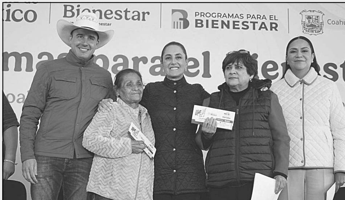
Claudia Sheinbaum encabezó la entrega de apoyos de los Programas del Bienestar.