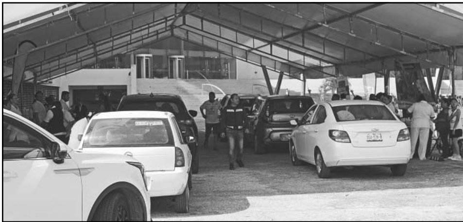
La campaña fue en el Centro Internacional de Convenciones y Exposiciones Campeche XXI.