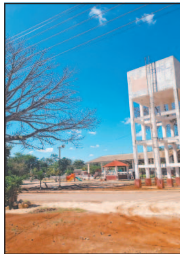
Amenazan con protestas si CFE no arregla la red eléctrica.