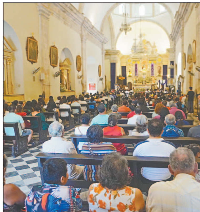
La Catedral lució llena el primer domingo de Cuaresma.