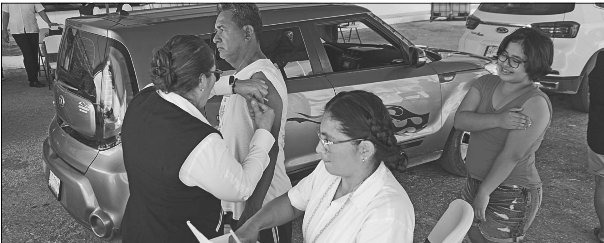
El despliegue sanitario es en respuesta a la alerta epidemiológica nacional por 10 mil 439 contagios y 31 fallecimientos, y forma parte de la estrategia preventiva. (Lucio B.)

Llegan 30 mil dosis más del fármaco para proteger a la población de los 13 municipios campechanos