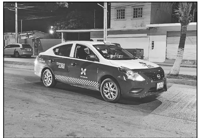
Tras el percance, el jinete resultó con golpes leves. (Israel Lozano)