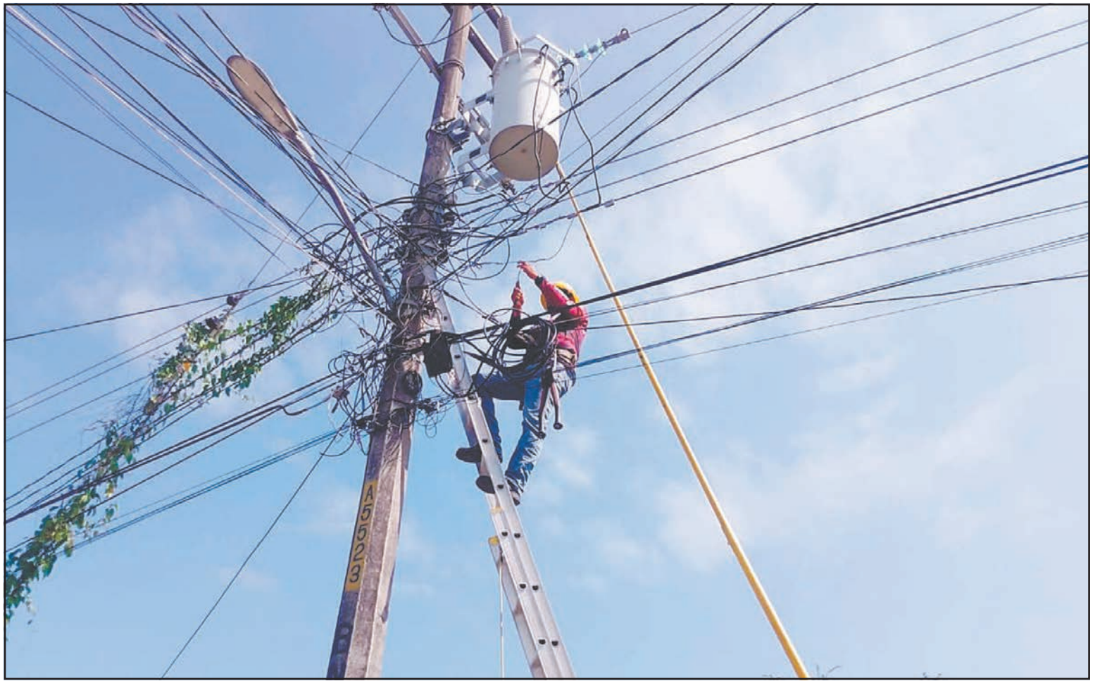
De nuevo Obras Públicas acudió a arreglar el desperfecto, uno de tantos productos del pésimo estado de las líneas eléctricas.