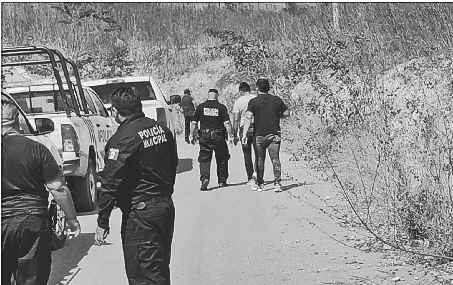
Las autoridades todavía investigan cuál fue el móvil de este atroz doble asesinato, aunque no descartan actividades ilícitas. (E. Caamal)