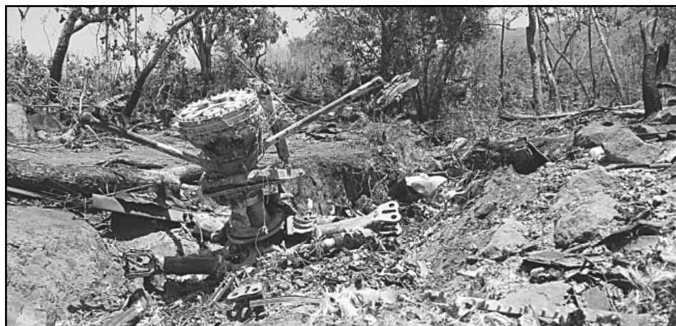
En mayo del 2015, tumbaron una aeronave del Ejército Mexicano en Villa Purificación.