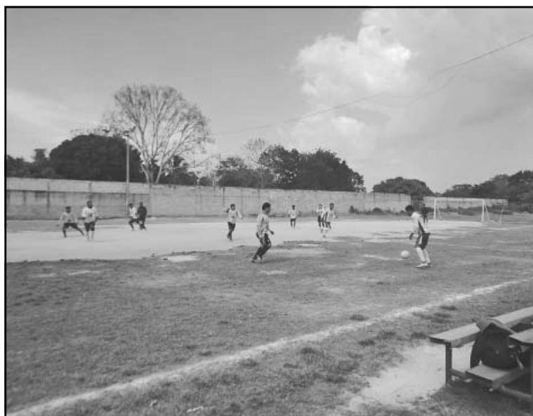
El duelo de la Liga de Plan de Ayala se definió en los últimos minutos.