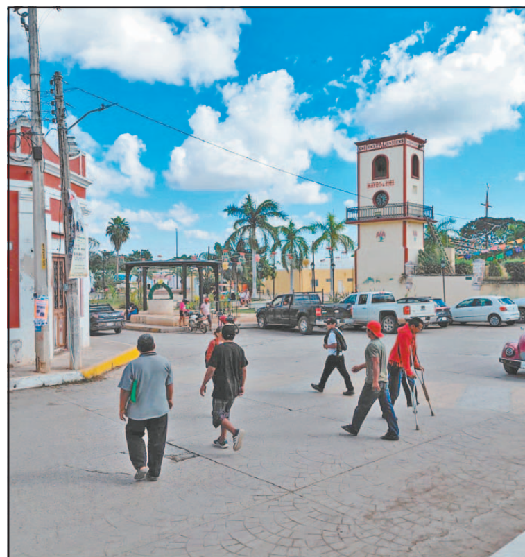
Residentes destacan urgencia para bienes raíces y testamentos. (Mauriel Koh)