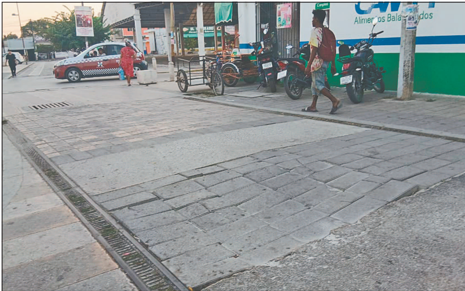
La situación se ha agravado desde hace cuatro meses, a pesar de que ya ha sido reportada en reiteradas ocasiones. (Joaquín Guevara)