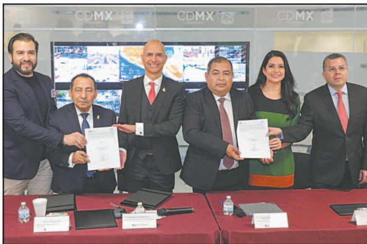
El acuerdo busca reforzar la atención y la prevención de la violencia.

bajo del CIIS como líder en igualdad sustantiva y señaló que el C5 no puede hacer su labor sin gafas violeta : una perspectiva de género en la atención de emergencias y una visión alineada con la política de la presidenta Claudia Sheinbaum y la Jefa de Go-