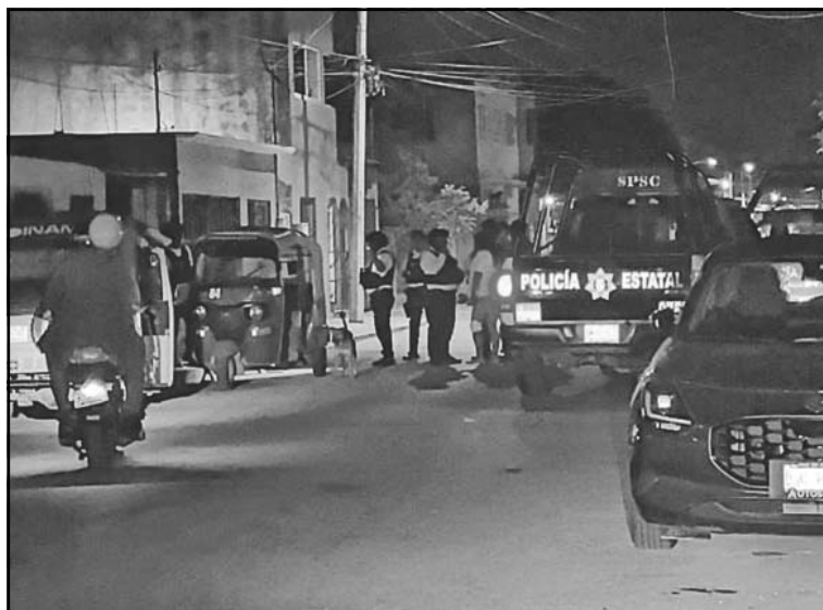
En Volcanes, se desató la confrontación física luego de un pleito.