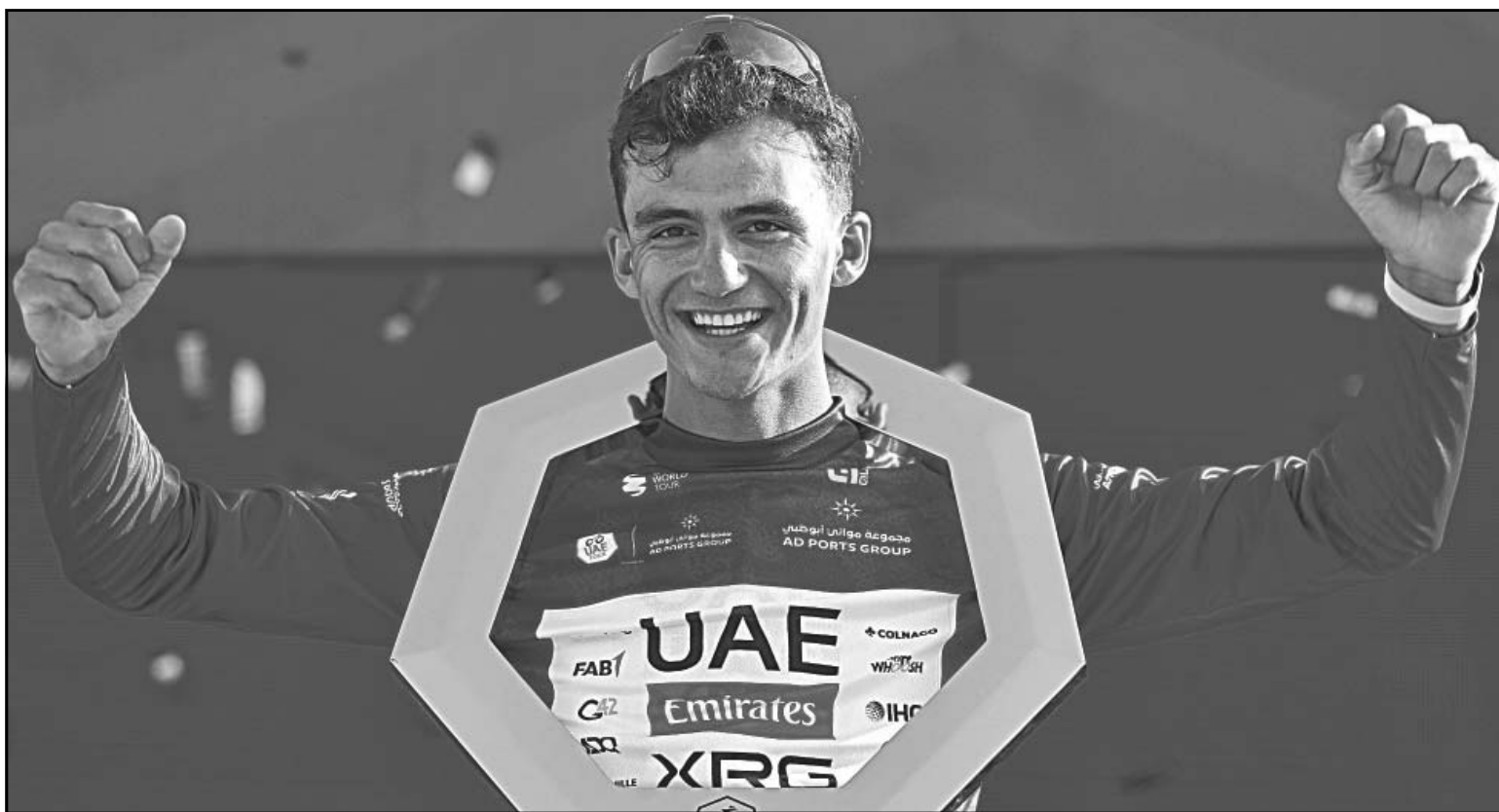
El de Ensenada alcanzó las 24 victorias para superar el récord histórico de Raúl Alcalá, pionero del ciclismo mexicano en Europa.