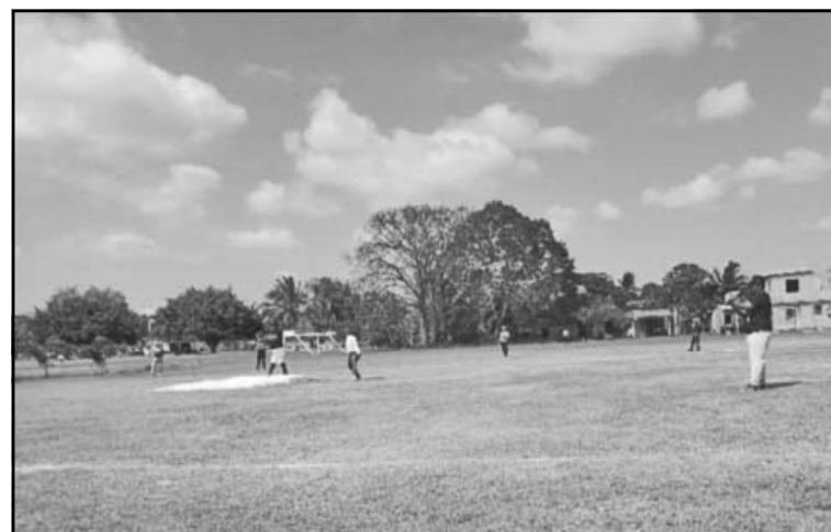
El conjunto visitante se llevó la victoria 8-5 en el amistoso. (P. Díaz)