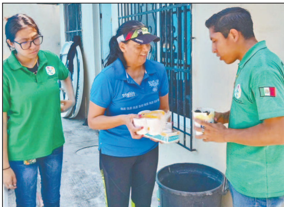
Empresas, instituciones, escuelas y ciudadanos tomaron parte en la jornada. (Perla P.)