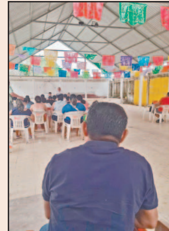
Diestros de la Plaza México participarán en Coloxche.