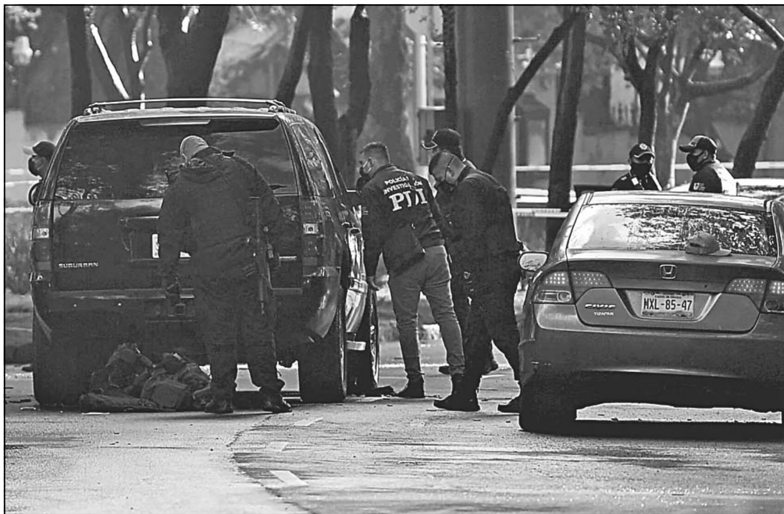
En el 2020, sicarios del Cártel Jalisco Nueva Generación atentaron contra Omar García Harfuch, entonces titular de la SSC-CDMX.

En la aeronave viajaban 18 elementos: cinco de tripulación, 11 pasajeros militares y dos de la Policía Federal, estos últimos partici-