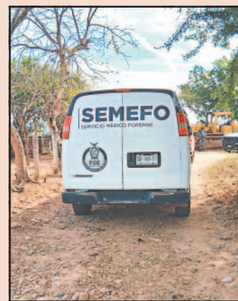
La FGR trabaja en peritajes de la fosa clandestina en Concordia.