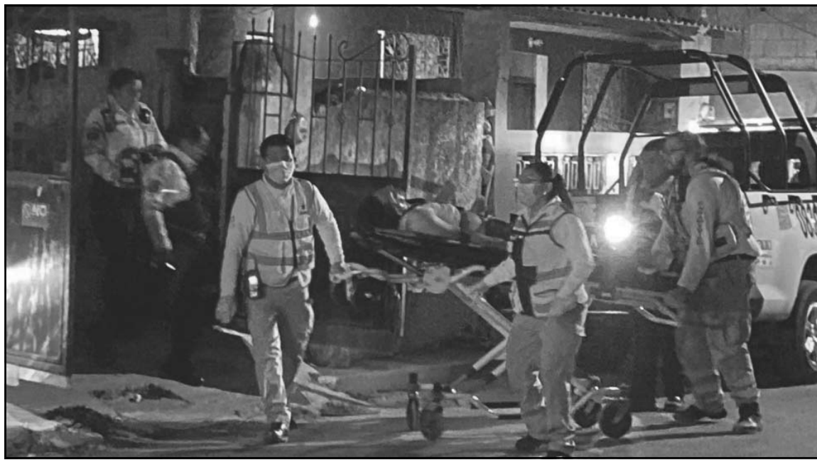
Su pareja y familiares lo descubrieron, lo descolgaron y solicitaron ayuda al número de emergencias.