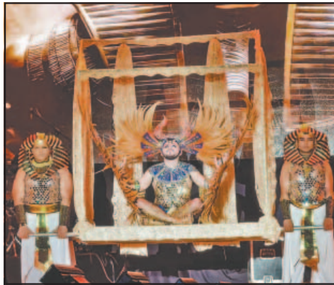
Los atuendos lucieron fastuosos. (P. Prado)