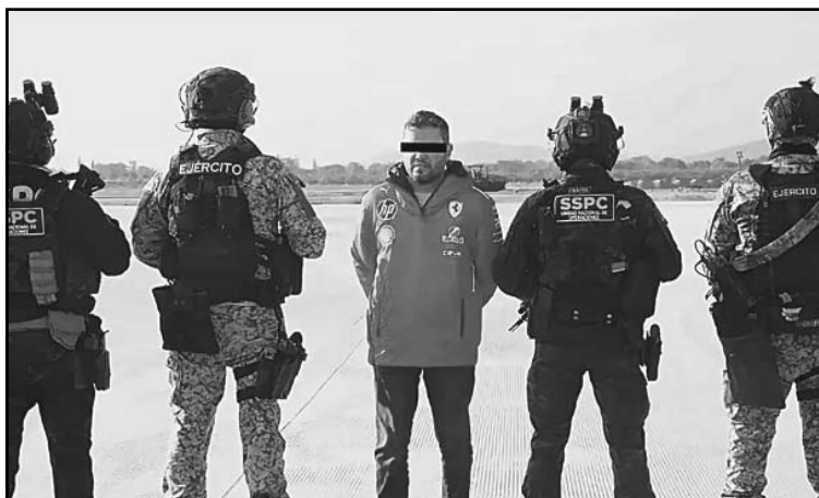
El Presidente permanecerá preso en el Penal de El Altiplano .