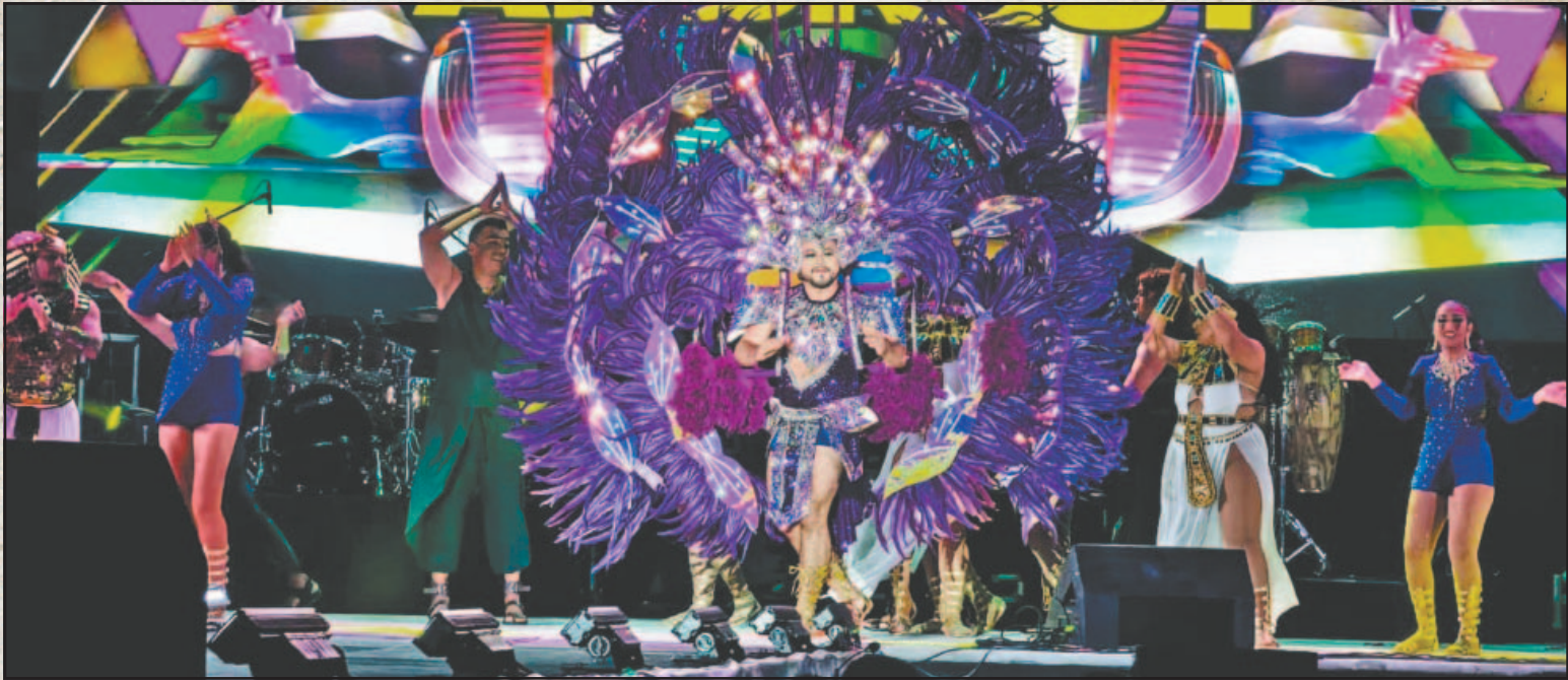
El show del soberano de la comunidad lésbico-gay carnelita resultó glamoroso, alegre, vistoso y perfectamente coordinado.