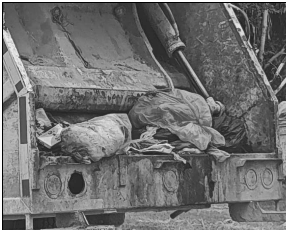
A la unidad de recoja ni siquiera le vaciaron la carga, lo que origina hedores.