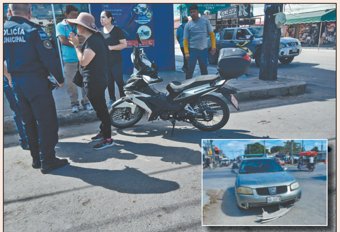
La mujer de la moto resultó con golpes leves; ambas llegaron a un acuerdo satisfactorio. (Joaquín G.)