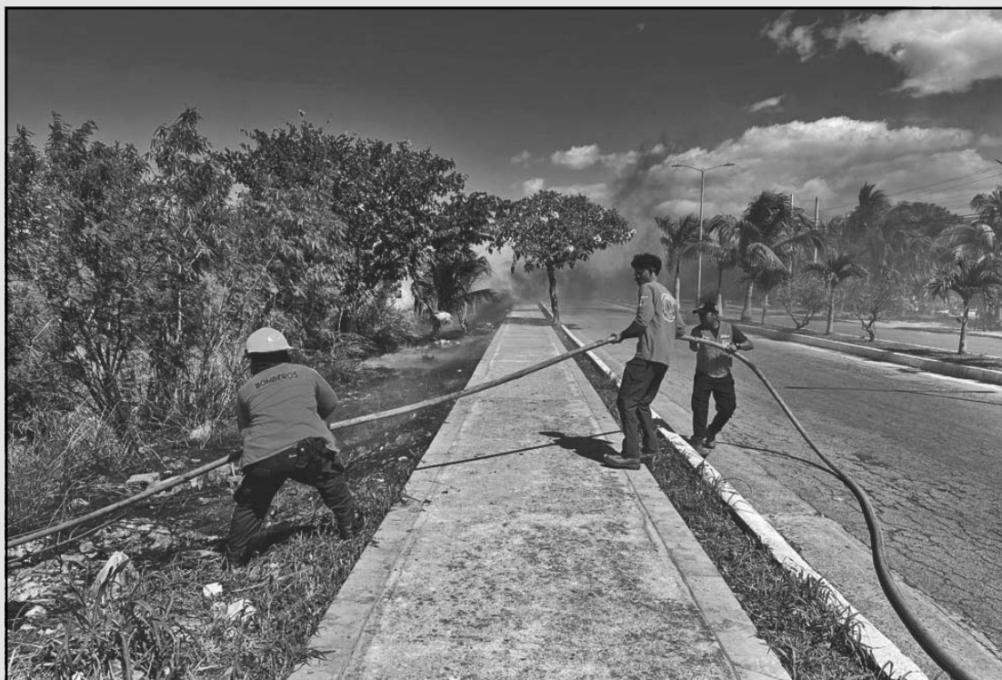
A pesar de las denuncias de los vecinos afectados, nadie sanciona a quienes contaminan. (Dismar H.)