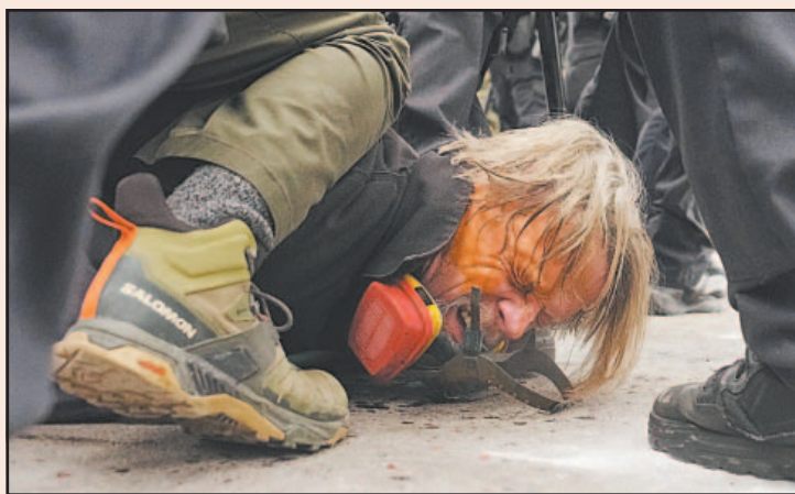
Una de las imágenes difundidas de uso de violencia en Mineápolis.

La ACLU afirma haber enviado una petición urgente al Comité de las Naciones Unidas para la Eliminación de la Discriminación Racial (CERD, por sus siglas en inglés) en la que le insta