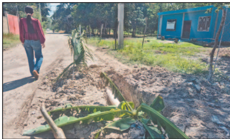
Alertan riesgo para peatones y conductores en Nueva Esperanza.