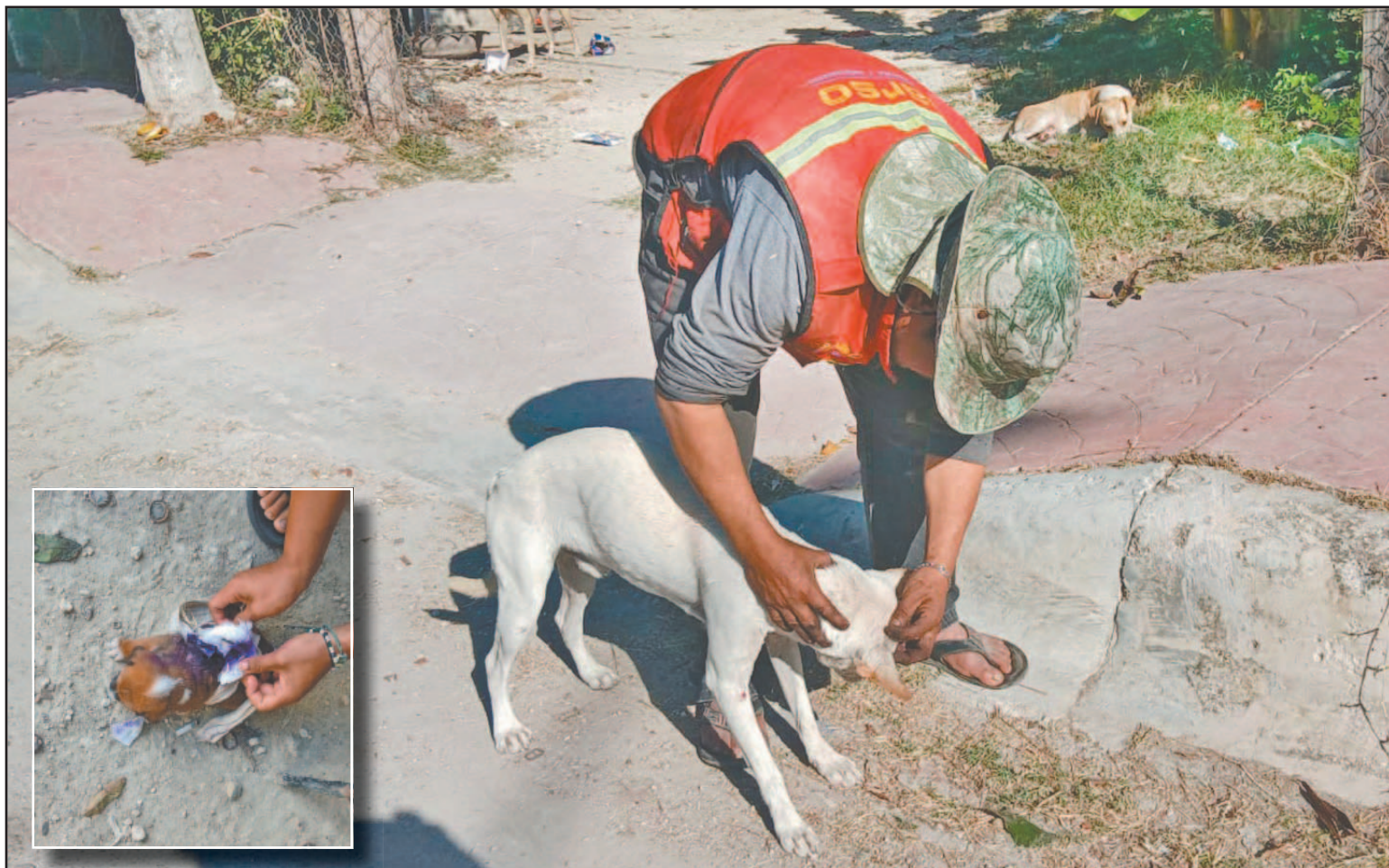
El vecino limpiaba las heridas del animal con sus propios medios. Los casos anteriores (recuadro) murieron a los pocos días. (Joaquín G.)