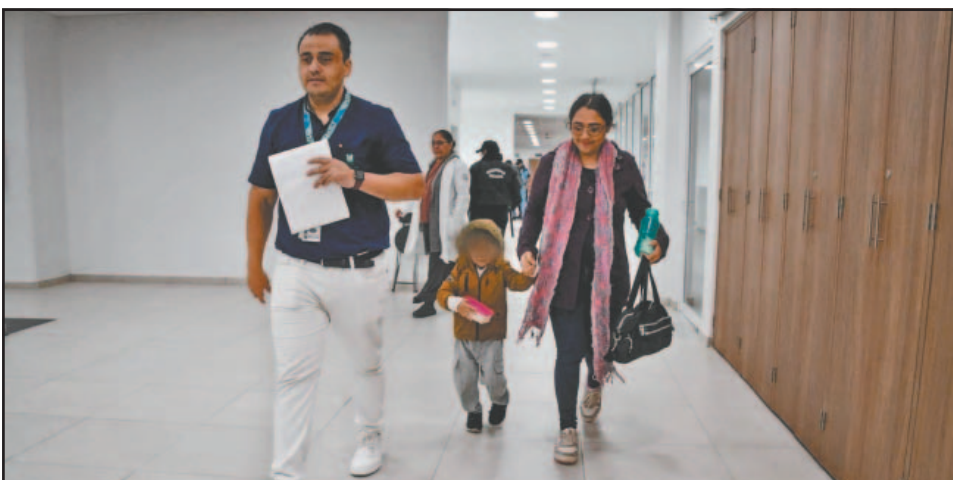
Las campañas están dirigidas a niñas, adolescentes y ahora abarcan a niños.