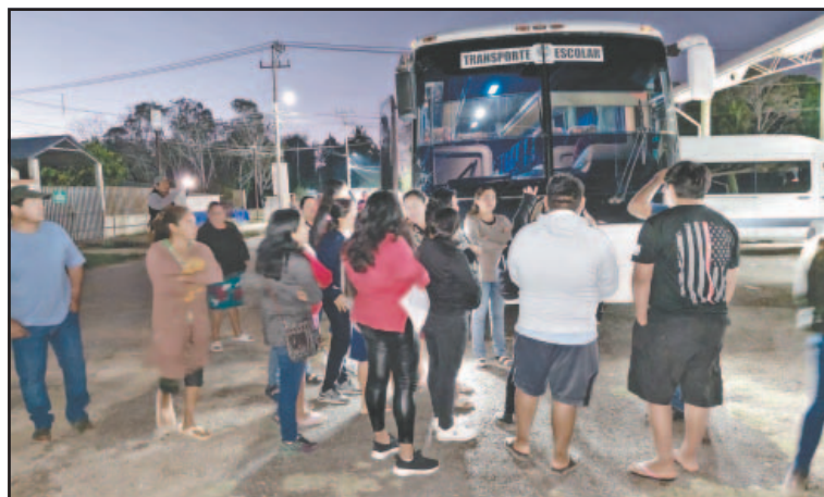
Un autobús con licencia federal estará disponible por dos semanas.