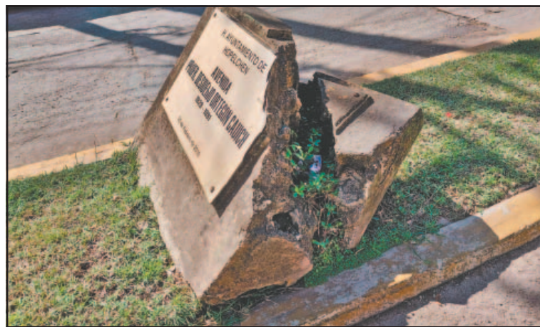
La estructura fue partida en un accidente desde 2015. (Mauriel Koh)