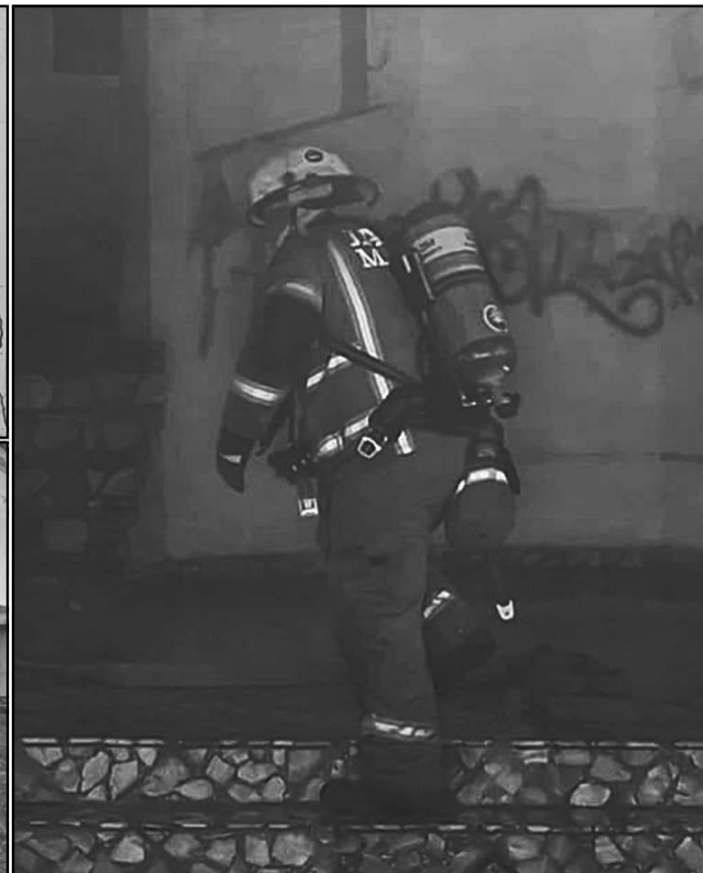
Los bomberos requirieron de más de 3 mil litros de agua para extinguir las llamas; el inmueble resultó con graves daños. (Dismar H.)