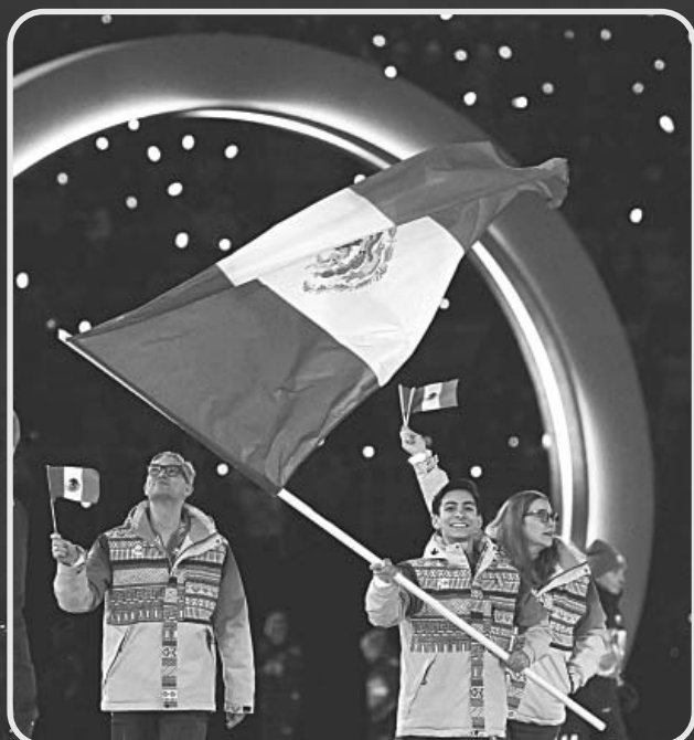
Sólo cinco deportistas conforman la Selección Azteca.