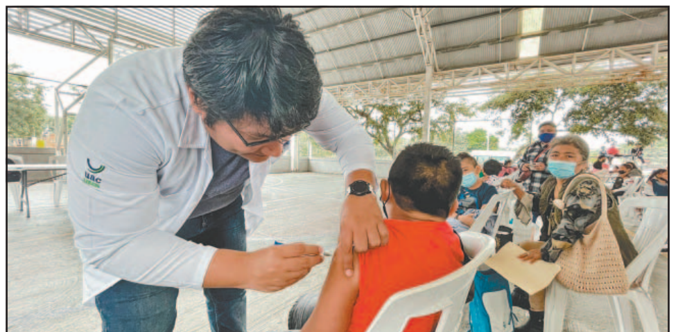
Los módulos trabajan los siete días de la semana en horario de 08:00 a 20:00 horas.