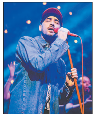
Visitará tres ciudades. (POR ESTO!)

En este último, el cantante arrancará presentaciones en el Estadio Borregos, de la ciudad nortea de Monterrey (14 de junio), continuará en la Arena VFG, de Guadalajara (17 de junio), y concluirá el recorrido en el Estado GNP, de la Ciudad de