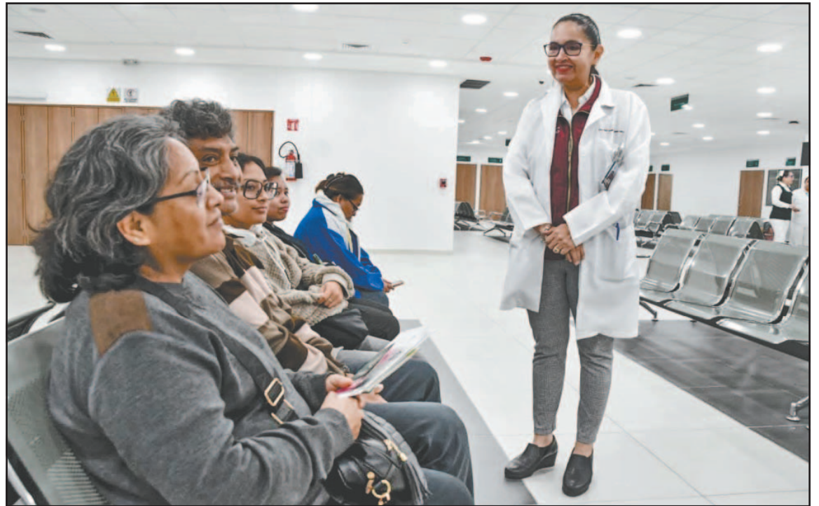
La clínica de la Isla es una de las 9 de este tipo en el país y se convierte en el nosocomio estratégico.