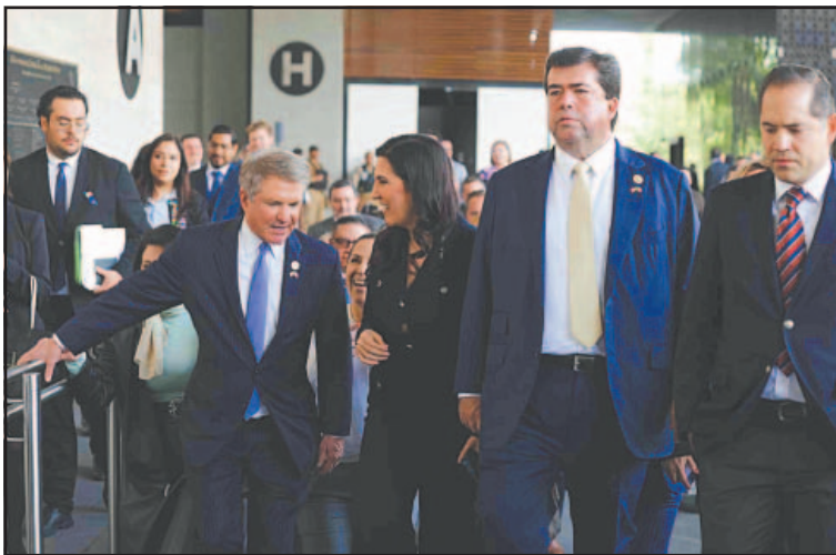
Funcionarios estadounidenses reconocieron avances en seguridad.

Se resaltó la importancia de fortalecer vías regulares, la cooperación regional y los programas orientados al desarrollo, así como la asistencia humanitaria a personas