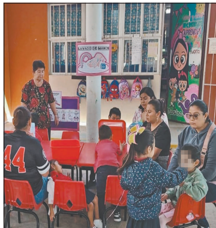
Una semana más sería lo ideal, manifestaron los padres. (Pedro Díaz)