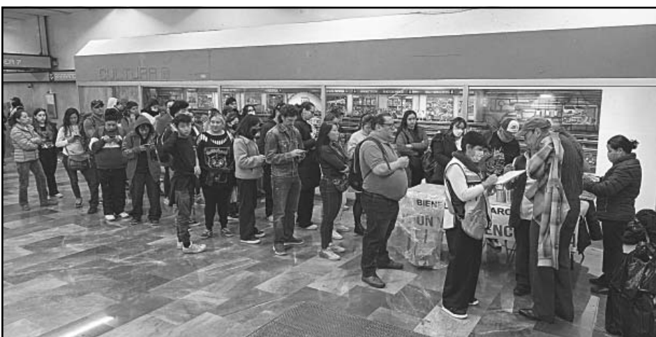
Usuarios del Metro de la CDMX han respondido a la instalación de módulos de inoculación.