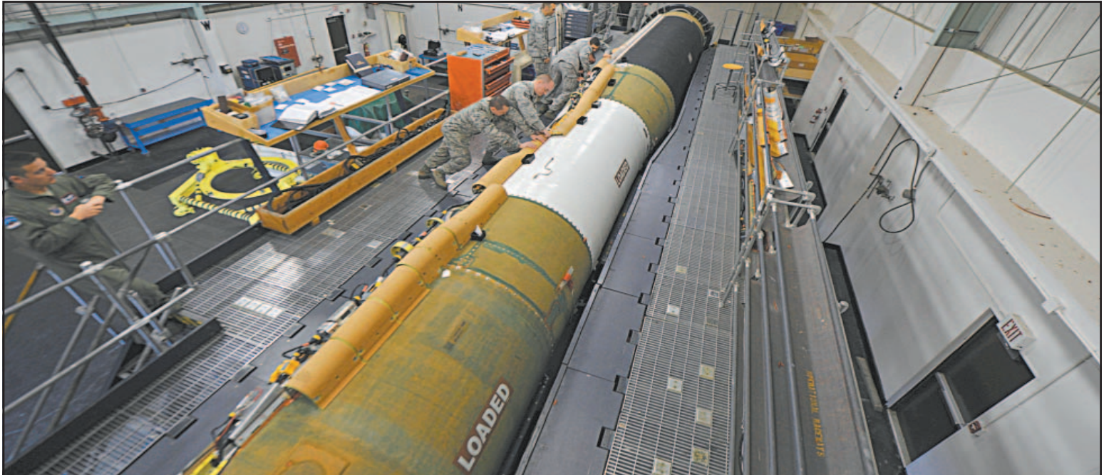
El Nuevo START obligaba a desplegar mil 550 ojivas nucleares, en no más de 700 misiles y bombarderos listos para su uso.

“Rusia y China no deberían esperar que Estados Unidos se quede de brazos cruzados mientras eluden sus obligaciones y amplían sus fuerzas nucleares”, escribió Rubio. “Mantendremos una disuasión nuclear robusta, creíble y modernizada. Pero lo haremos mientras exploremos todas las vías para cumplir el genuino deseo del presidente de un