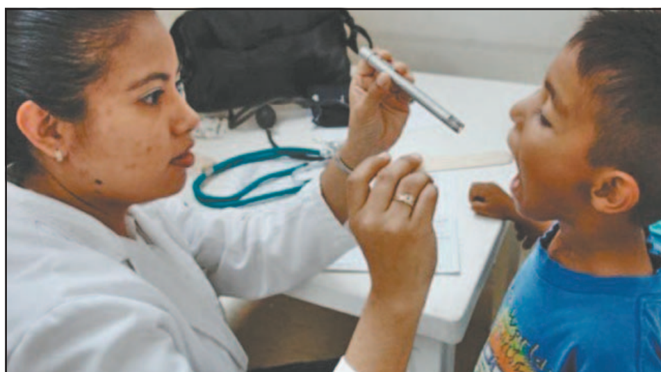
Los contagios de IRAS son fáciles de detectar mediante exploración bucal.