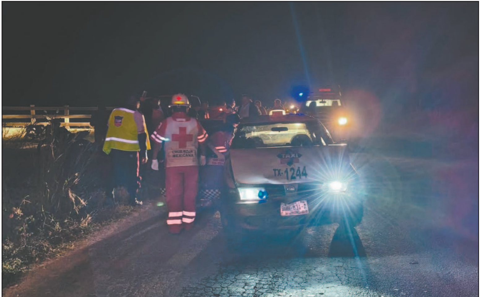
Presuntamente la unidad Chevrolet Aveo estaba descompuesta en la cinta de rodamiento cuando ocurrió el impacto. (Joaquín Guevara)