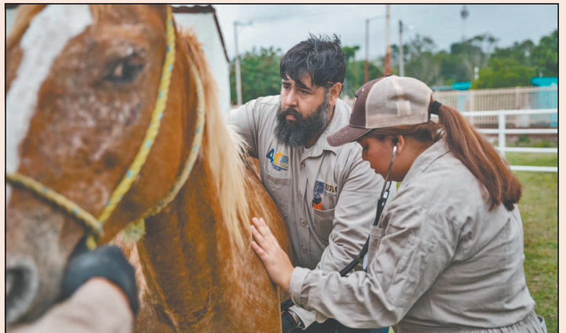
Los veterinarios aseguran que no puede descuidarse la incidencia de esta plaga. (Alejandro Pech)