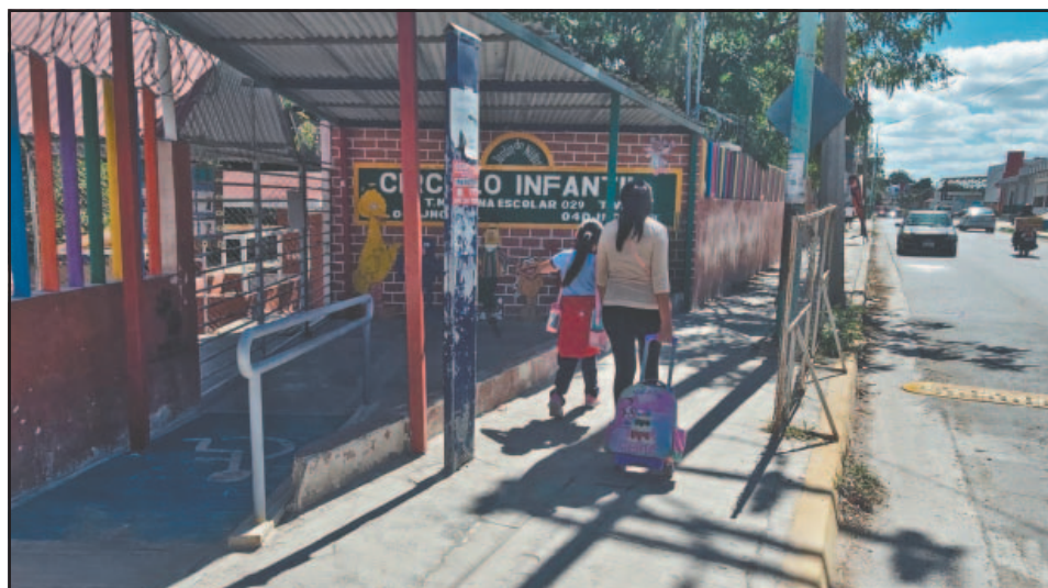
El Colegio de Médicos pide abrigarse bien; no confiarse al salir a la calle. (A. Pech)