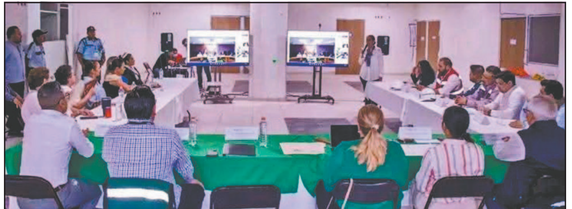
Actualmente se realiza trabajo de promoción y visitas a unidades médicas para reclutar a los mejores.