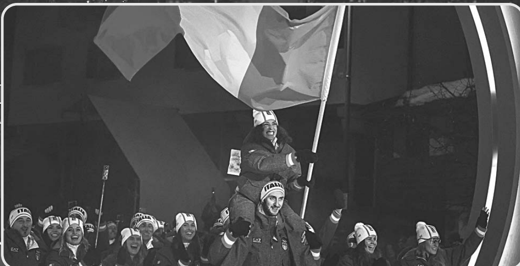
La delegación italiana fue la última en aparecer y desató una ovación en el estadio San Siro.