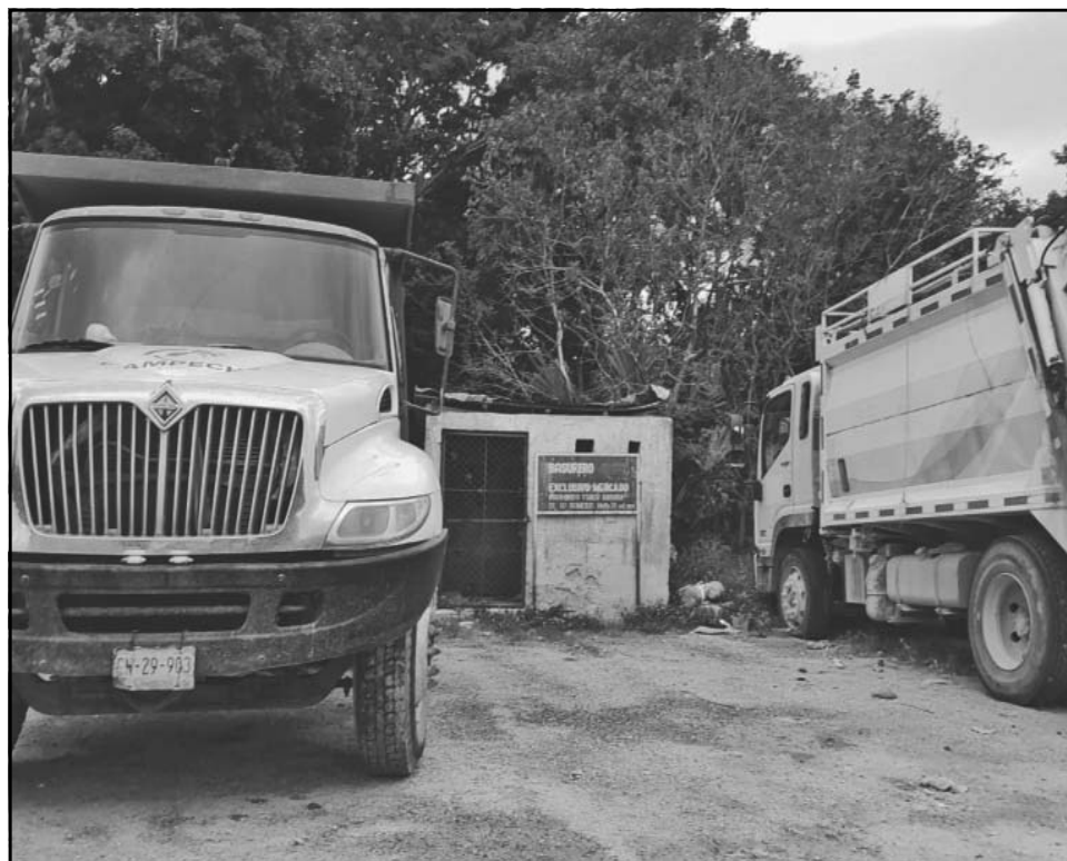
Ambos vehículos están ociosos por la desidia de las autoridades locales. (Erik Caamal)