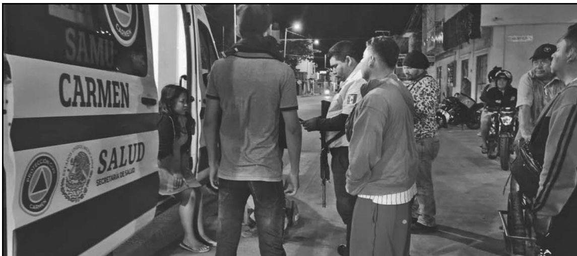
Ambos tripulantes cayeron al pavimento debido a la falta de visibilidad y señalización del cordón.