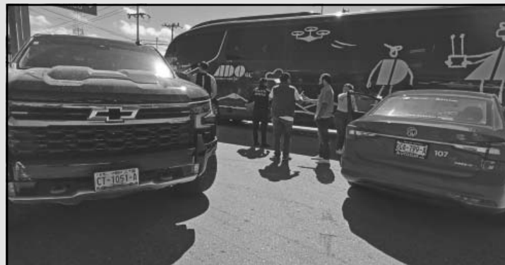
Alcance provoca bloqueo parcial en López Portillo. (D. Herrera)