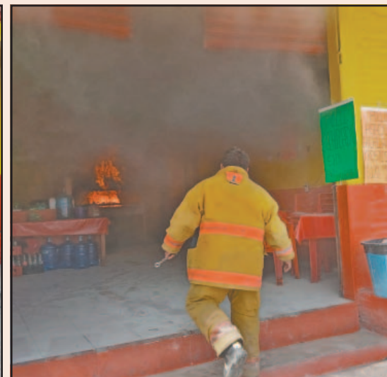
Los vecinos y comerciantes cooperaron con extinguidores ante la falta de los mismos. (Joaquín G.)