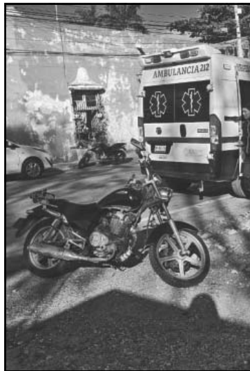
Colisionó de frente contra un vehículo que invadió su carril.