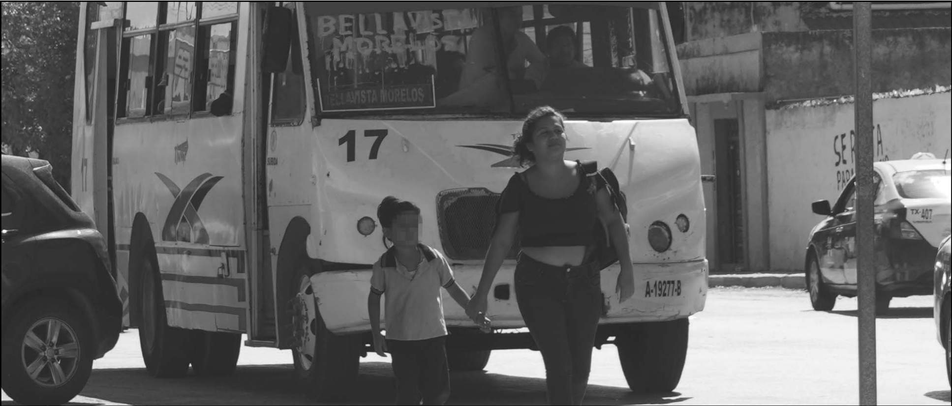
Los usuarios consideran problemático que los camiones antiguos sean retirados, ya que las nuevas unidades han complicado el acceso a la movilidad. (Lucio Blanco)