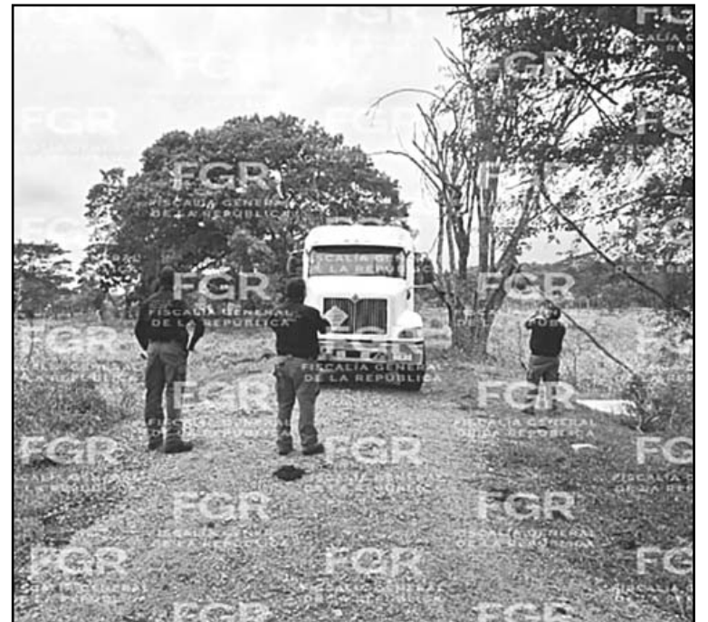
El aseguramiento se concretó en una rancharía de Centro. (POR ESTO!)