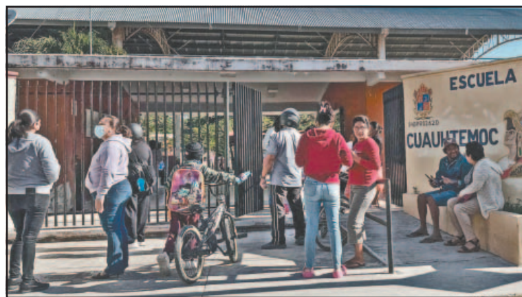
La asistencia fue casi total pese a casos aislados de gripe. (J. May)