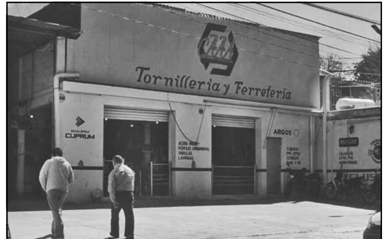
Se llevan herramientas; dueños descubren el hurto horas después.