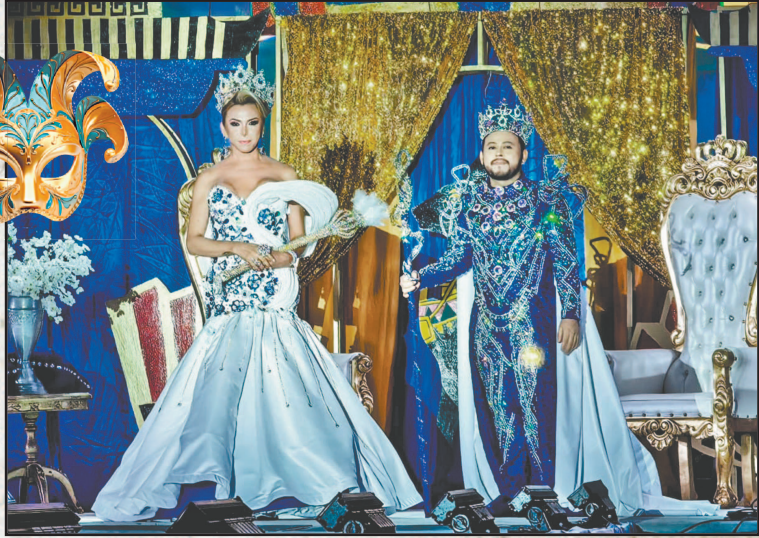
Los dos monarcas realizaron la tradicional pasarela. (Perla Prado)