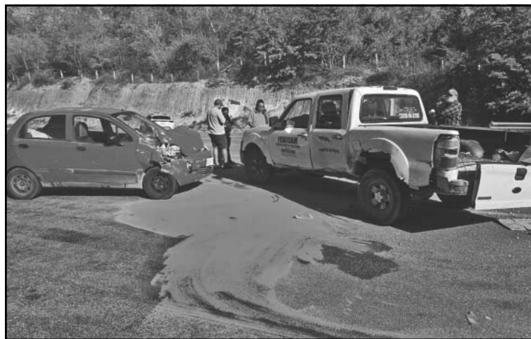
Se proyectó sobre una camioneta que intentó dar vuelta en “U”. (A. Pech)