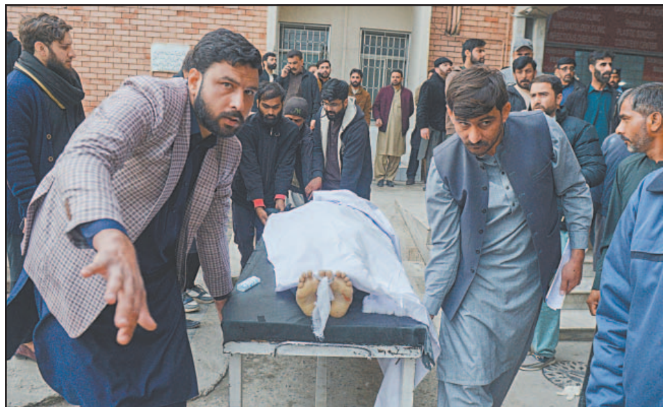
Medios de prensa comprobaron el arribo de cadáveres a los hospitales locales.