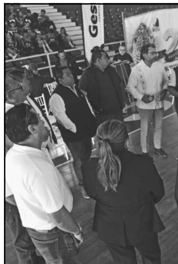
Se suman siete gremios, así crear la Federación. (A. Pech)