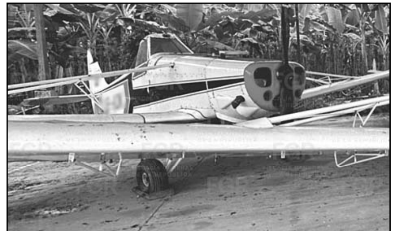
Elementos de investigación localizaron un hangar ilegal. (POR ESTO!)