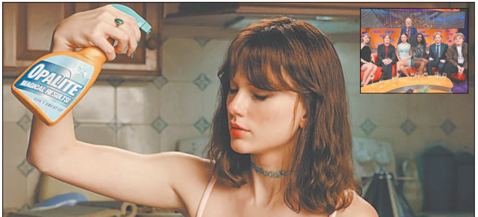
La estrella de la música decidió convocar a sus compañeros de entrevista del programa The Graham Norton Show para el videoclip.

De momento, los suscriptores de Spotify Premium y Apple Music ya pueden disfrutar del video de un tema que forma parte del álbum The Life of a Showgirl , que Swift lanzó en octubre de 2025 y del que ya se lanzó el video de The Fate of Ophelia .