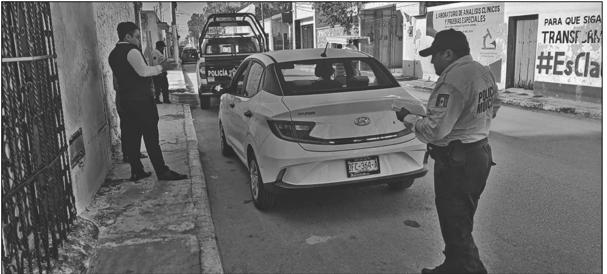
Testigos señalan que el automóvil intentó ganarle el paso a una unidad de pasajeros, que lo impactó; los hechos ocurrieron en el cruce de las calles 15 x 2 de Calkiní. (E. Caamal)