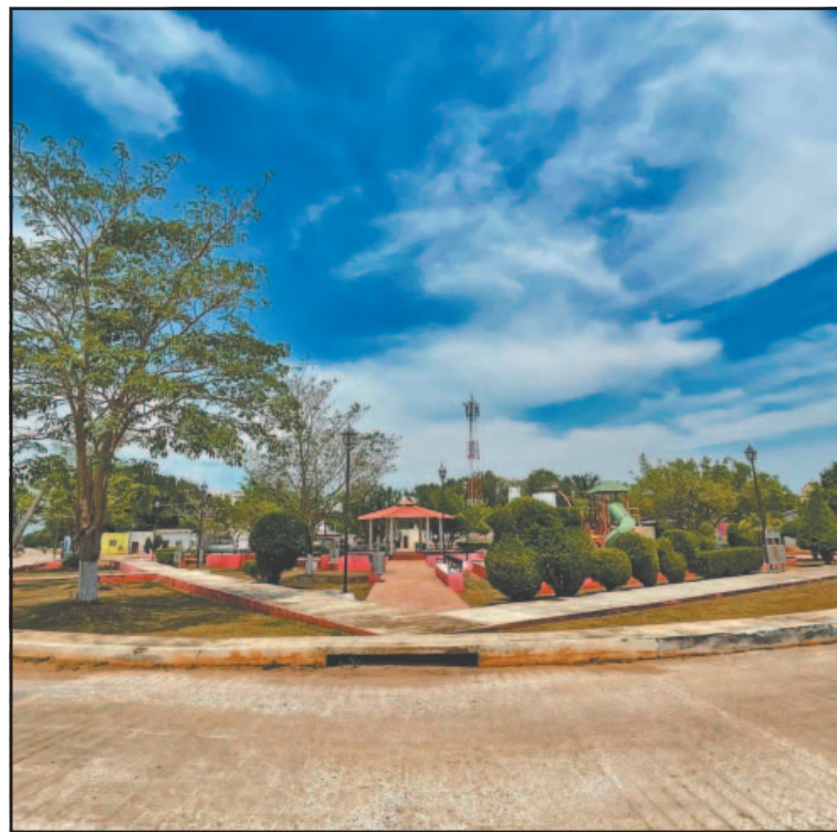
Exhortan a la ciudadanía a no contestar números desconocidos.