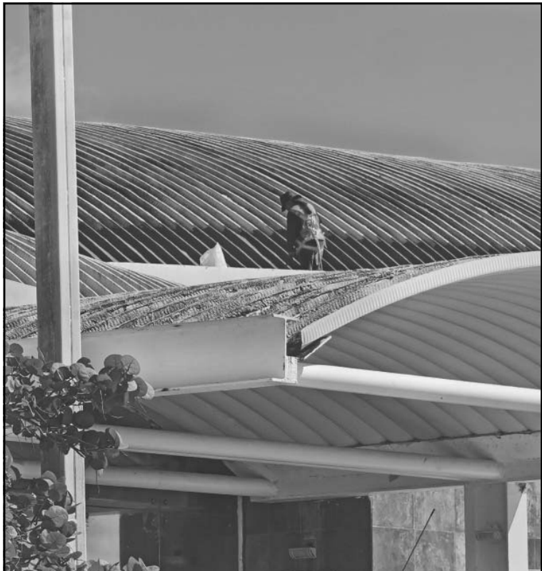
Reacondicionan pista y áreas del aeropuerto, así elevar el servicio.

les más bajos. Durante el 2023, cuando la administración pasó al Gobierno Federal, el promedio de pasajeros fue de 106 mil; en 2024, se incrementó a 121 mil viajeros; y en 2025 alcanzó los 133 mil pasajeros. “Realmente vamos al alza. Esperamos superar el récord histórico de 165 mil pasajeros, registrado en 2018, que es la cifra más alta que tenemos, y confiamos en poder superarlo este año”, señaló el administrador de la terminal. (David Vázquez)