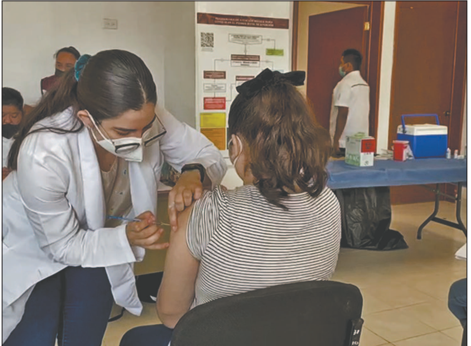
El VPH es una infección de transmisión sexual, pero la vacunación temprana evita y reduce riesgos a largo plazo.

Actualmente, la UMF número 12 tiene como meta vacunar a mil 520 menores de 11 años de