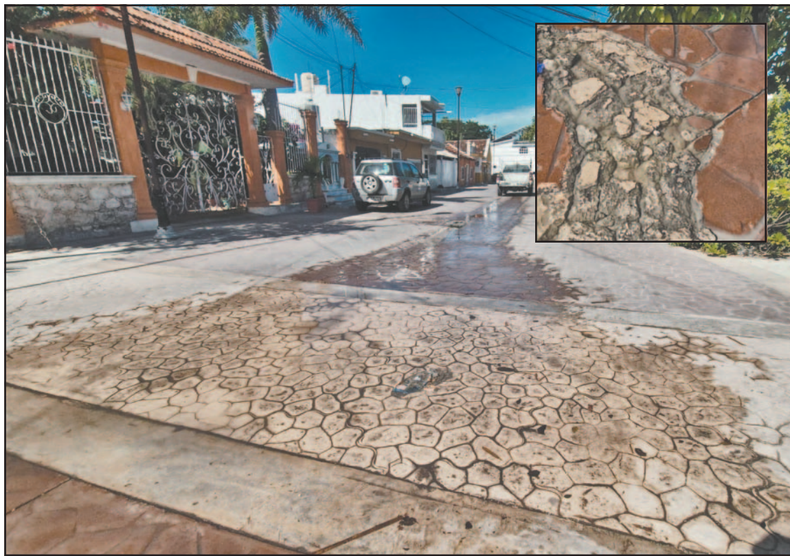
Habitantes de la calle 29 señalan que el líquido pasa debajo del pavimento, generando desperdicio.