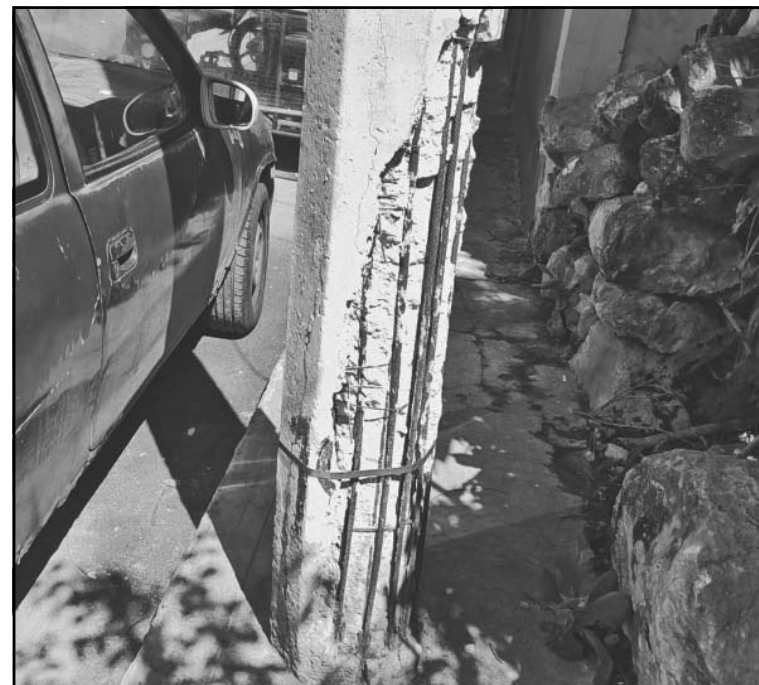
Algunas estructuras dañadas están junto a las casas. (Erik Caamal)