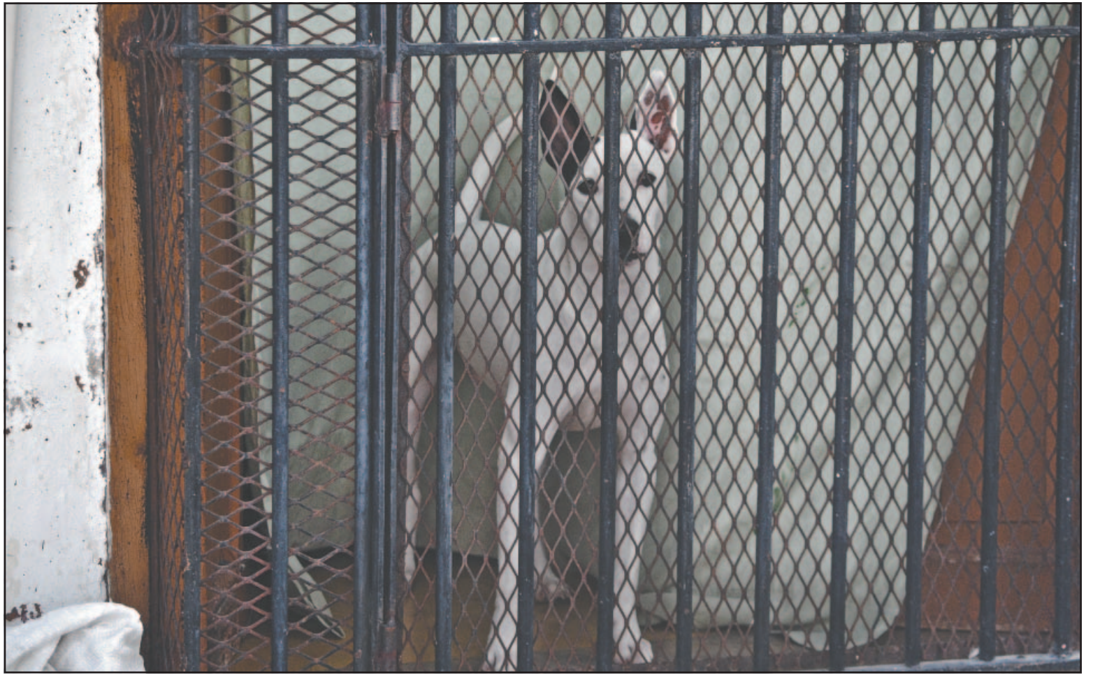
Los perros y gatos requieren cuidados y atenciones como cualquier ser vivo, explicó la autoridad fiscal en la materia.

mil pesos podría costar la multa por exponer a los animales a la intemperie