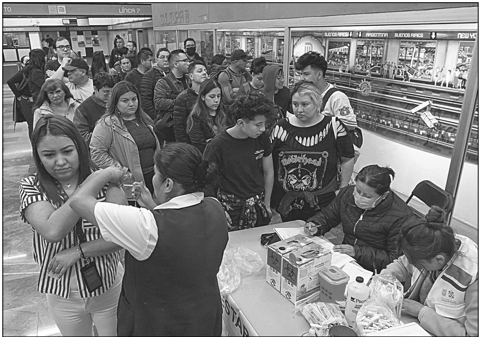
Para combatir el virus, el Gobierno federal dispone de 23 millones 529 mil 75 vacunas para contrarrestar el problema de salud.

De acuerdo con el reporte sobre la situación regional de la enfermedad de la Organización Panamericana de la Salud (OPS), México ocupa el primer lugar en casos de sarampión en América con 8 mil 411 confirmados hasta el pasado miércoles. Le siguen Canadá, con 5 mil 503 afectados, y Estados Unidos, con 2 mil 413.