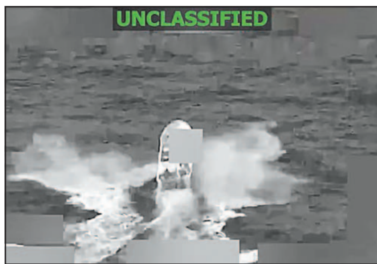
Imagen difundida por el Pentágono sobre la embarcación.

El ataque fue anunciado tan sólo unas horas después de que el secretario de Defensa de Estados Unidos, Pete Hegseth, declaró que “algunos de los principales narcotraficantes de cárteles” en la región “han decidido cesar todas las operaciones de narcóticos indefinidamente debido a las recientes (y altamente efectivas) acciones cinéticas en el Caribe”. Sin embargo, Hegseth no proporcionó detalles ni datos que respaldaran esta afirmación, hecha en una publicación en su cuenta personal en redes sociales. Ni el Comando Sur de Estados Unidos