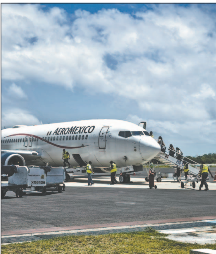
Mejorarán los servicios, pero se requieren de pasajeros. (Perla P.)