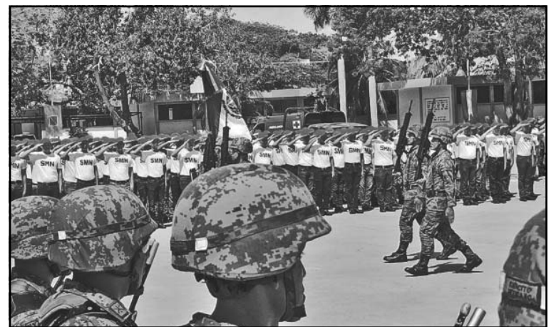
Clase 2007 y remisos participarán en sesiones sabatinas.