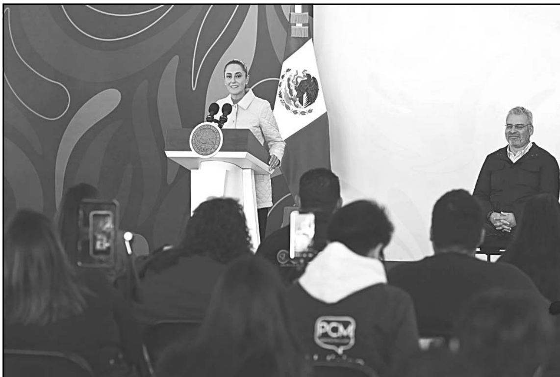
En Michoacán, la mandataria Claudia Sheinbaum se refirió a la detención de un Alcalde en Jalisco.

La mandataria añadió que ella misma tuvo conocimiento directo de quejas sobre la situación en la zona.