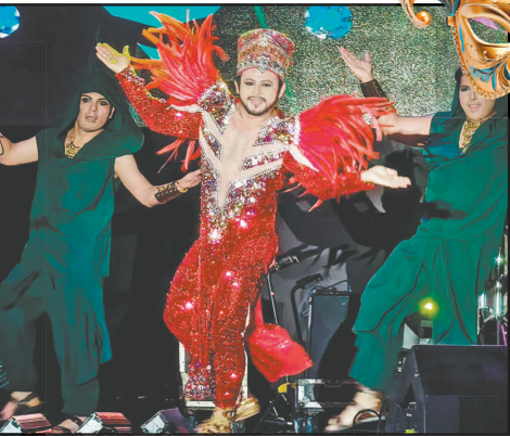
El baile fue “Euforia Egipcia”. (P. Prado)