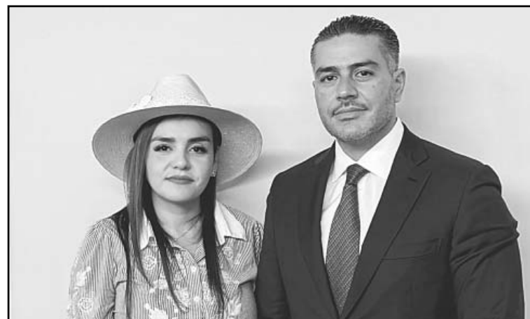
La Presidenta Municipal de Uruapan se reunió con el titular de la SSPC.