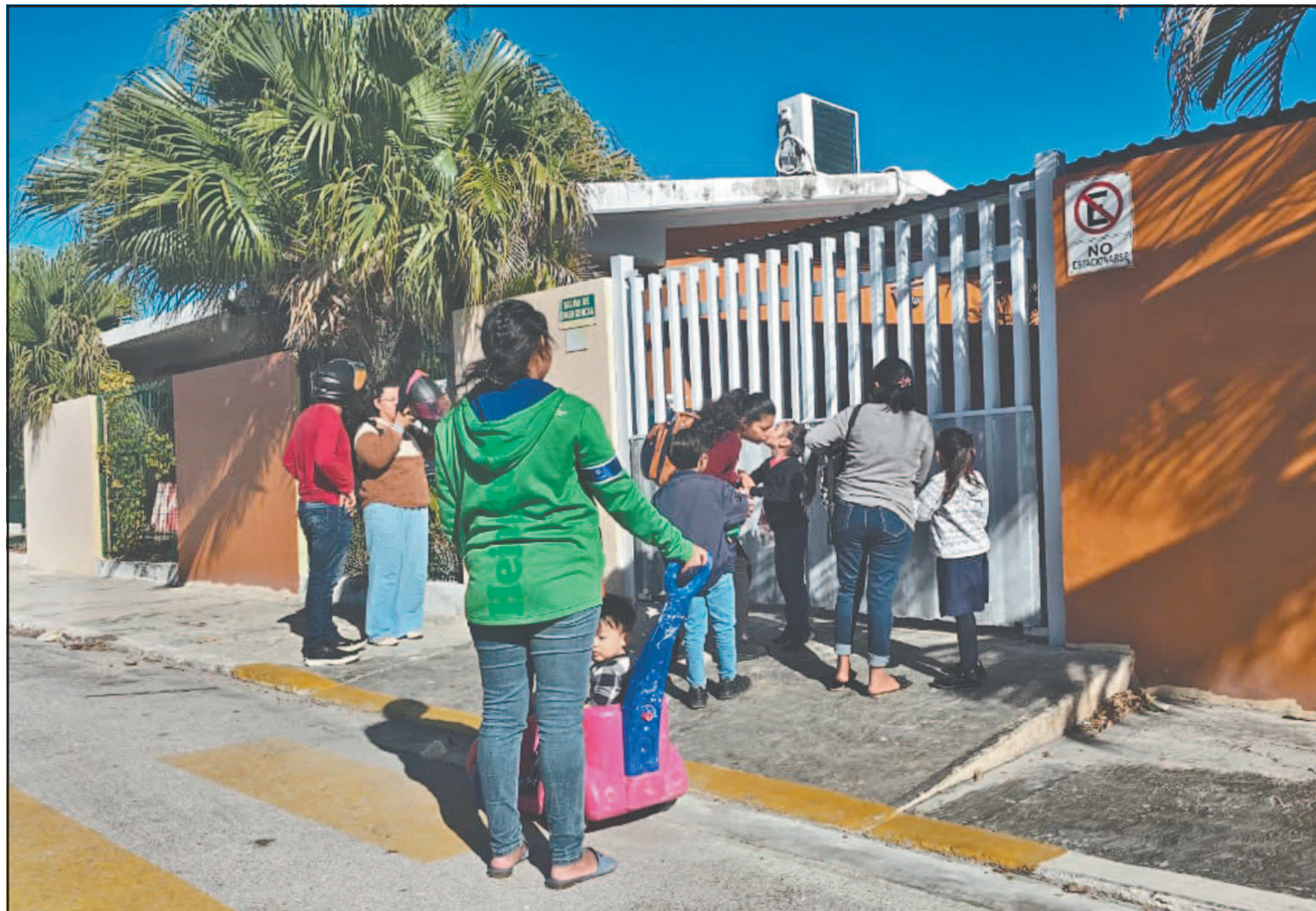
El clima frío por lo general encuentra en los niños a las víctimas adecuadas para provocarles enfermedades respiratorias. (Alejandro Pech)

El especialista subrayó que los grupos más vulnerables son