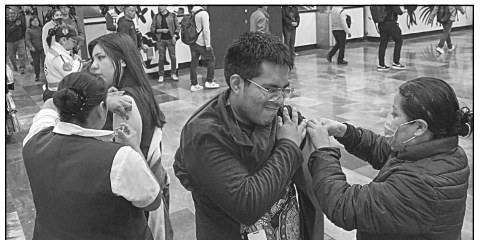
El esquema de inmunización será ampliado, anticipó la presidenta Claudia Sheinbaum.