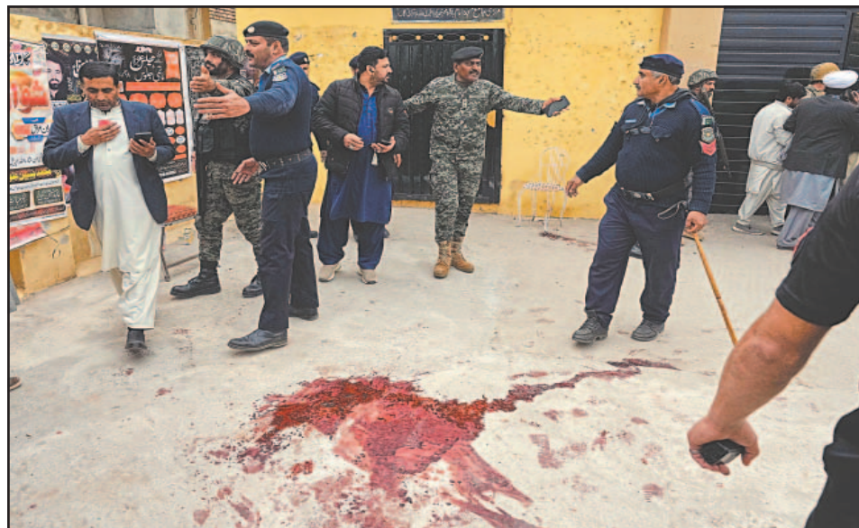
El atacante fue detenido en la entrada del templo, donde se hizo estallar.