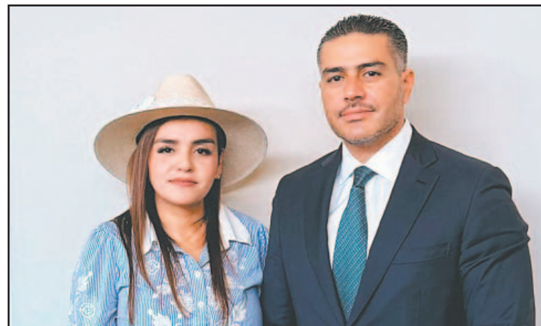
La Presidenta Municipal de Uruapan se reunió con el titular de la SSPC.