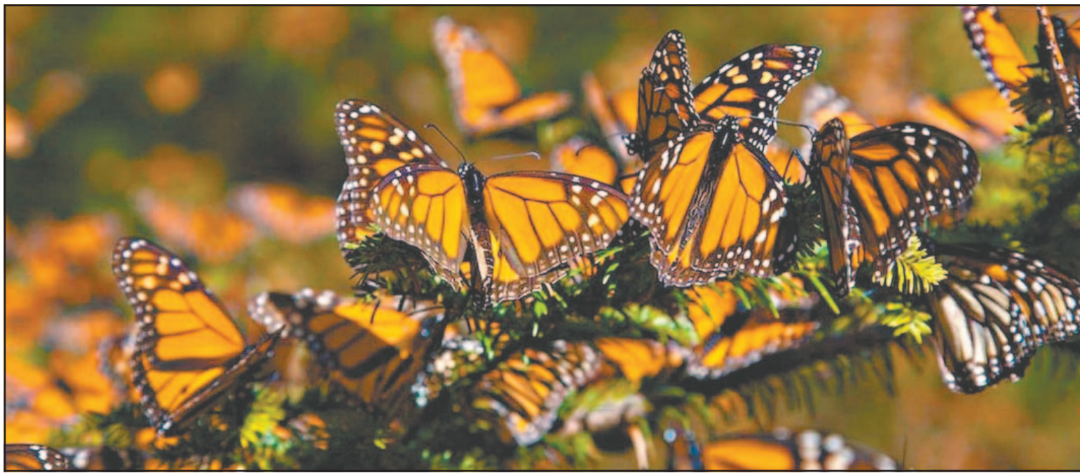
Biólogo confirmó que en la ínsula hallaron ejemplares, huevecillos, orugas y crisálidas sobre la planta Asclepias curassavica .