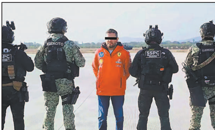
El Presidente permanecerá preso en el Penal de El Altiplano .