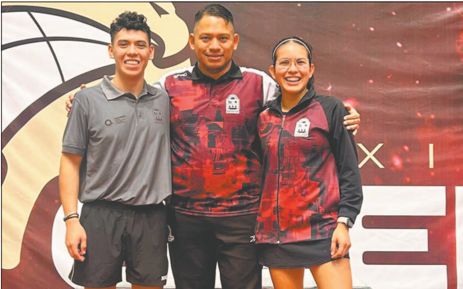
La dupla obtuvo medalla de plata en dobles mixtos de los pasado Juegos Panamericanos Junior Cali-Valle 2021. (Rafael García)