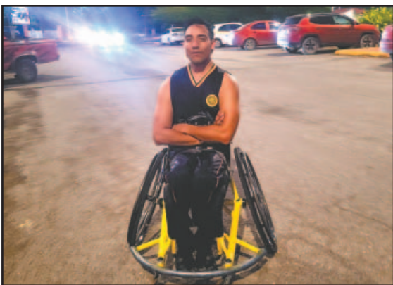
AUNQUE llenan de gloria al estado en cada competencia, los deportistas con discapacidad son marginados.- (A. Bautista)