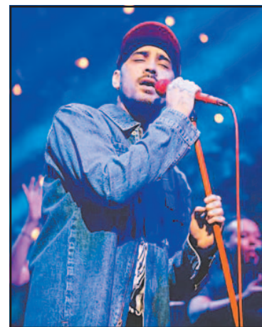
Visitará tres ciudades. (POR ESTO!)

En este último, el cantante arrancará presentaciones en el Estadio Borregos, de la ciudad norteña de Monterrey (14 de junio), continuará en la Arena VFG, de Guadalajara (17 de junio), y concluirá el recorrido en el Estado GNP, de la Ciudad de