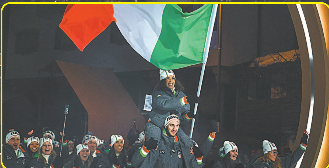
La delegación italiana fue la última en aparecer y desató una ovación en el estadio San Siro.