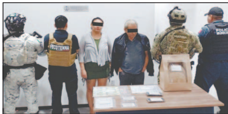
Guillermo "N" y Rubí "N" trabajaban en un bar de la Sm. 75.