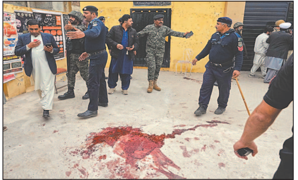
El atacante fue detenido en la entrada del templo, donde se hizo estallar.