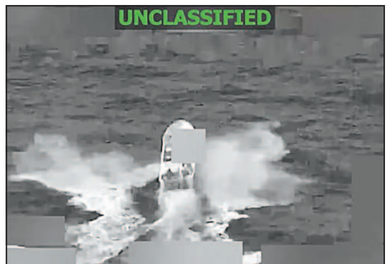
Imagen difundida por el Pentágono sobre la embarcación.

El ataque fue anunciado tan sólo unas horas después de que el secretario de Defensa de Estados Unidos, Pete Hegseth, declaró que “algunos de los principales narcotraficantes de cárteles” en la región “han decidido cesar todas las operaciones de narcóticos indefinidamente debido a las recientes (y altamente efectivas) acciones cinéticas en el Caribe”. Sin embargo, Hegseth no proporcionó detalles ni datos que respaldaran esta afirmación, hecha en una publicación en su cuenta personal en redes sociales. Ni el Comando Sur de Estados Unidos