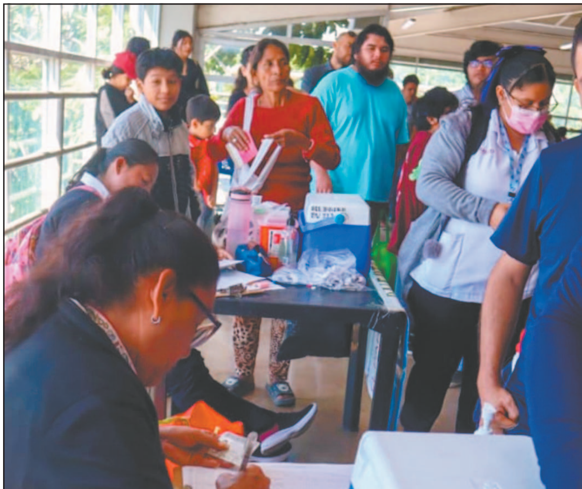
El sitio funcionará durante todo febrero para que la gente no tenga que acudir a unidades de salud. (POR ESTO!)