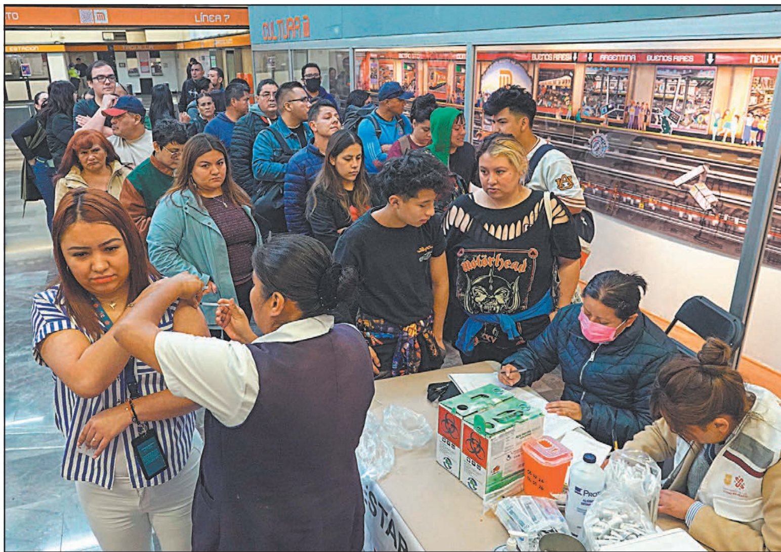
Para combatir el virus, el Gobierno federal dispone de 23 millones 529 mil 75 vacunas para contrarrestar el problema de salud.

De acuerdo con el reporte sobre la situación regional de la enfermedad de la Organización Panamericana de la Salud (OPS), México ocupa el primer lugar en casos de sarampión en América con 8 mil 411 confirmados hasta el pasado miércoles. Le siguen Canadá, con 5 mil 503 afectados, y Estados Unidos, con 2 mil 413.