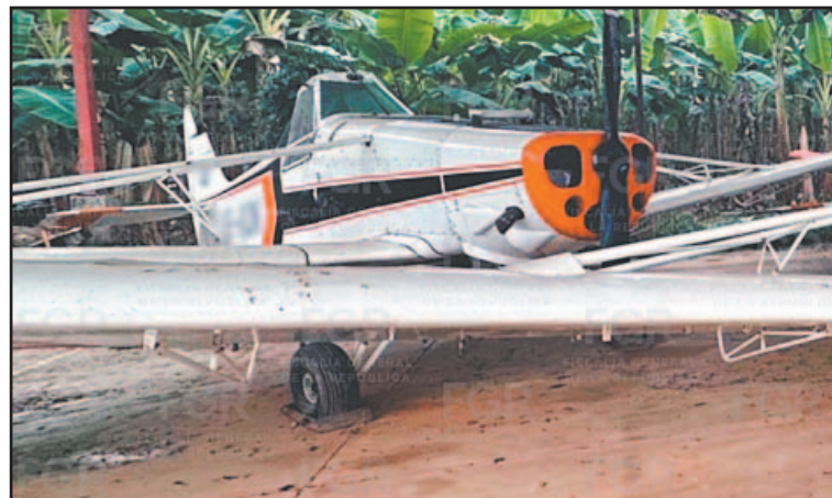
Elementos de investigación localizaron un hangar ilegal.