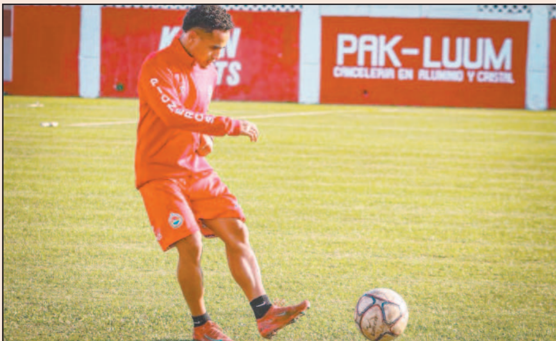
El club de casa busca mantener su paso firme en Liga Premier y Tercera División. (Rafael García)