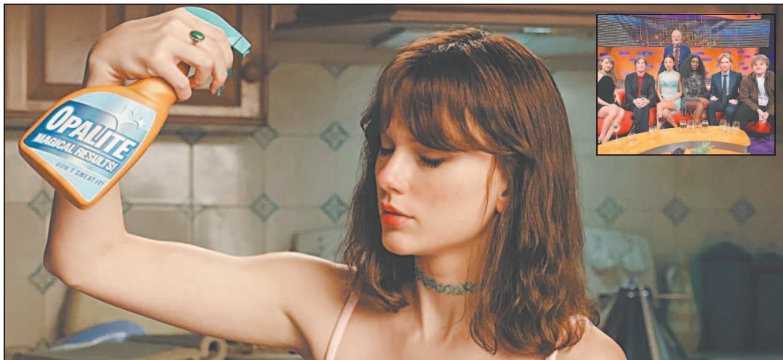
La estrella de la música decidió convocar a sus compañeros de entrevista del programa The Graham Norton Show para el videoclip.

De momento, los suscriptores de Spotify Premium y Apple Music ya pueden disfrutar del video de un tema que forma parte del álbum The Life of a Showgirl , que Swift lanzó en octubre de 2025 y del que ya se lanzó el video de The Fate of Ophelia .