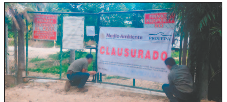
Detectaron afectación en la selva mediana subperennifolia. (J. Xiu)