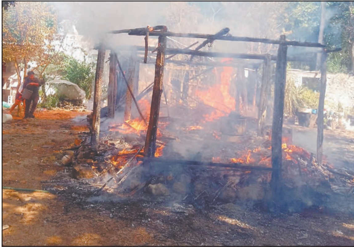
Las llamas avanzaron rápidamente, mientras los voluntarios llevaban agua en cubetas. (Justino Xiu)

Asimismo, se presentaron elementos de la Policía Municipal destacamentados en la comunidad