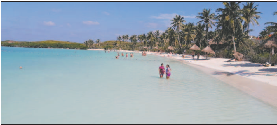
Los arenales se redujeron y no alcanzan para proteger a los huevos de quelonios.