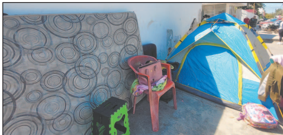
Personas llevaron colchones para descansar y soportar el frío.