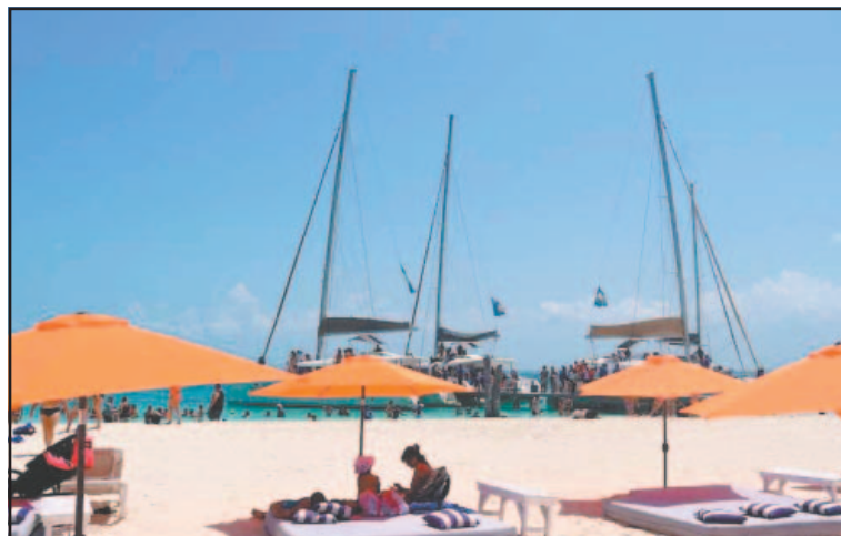
Indicaron que los turistas cada vez gastan menos. (Ovidio López)