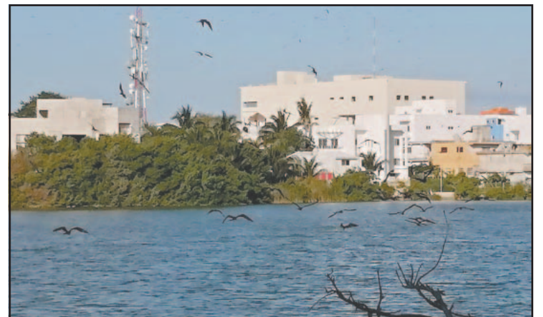
Las aves llegaron a la isla para alimentarse de sardinas. (Ovidio López)