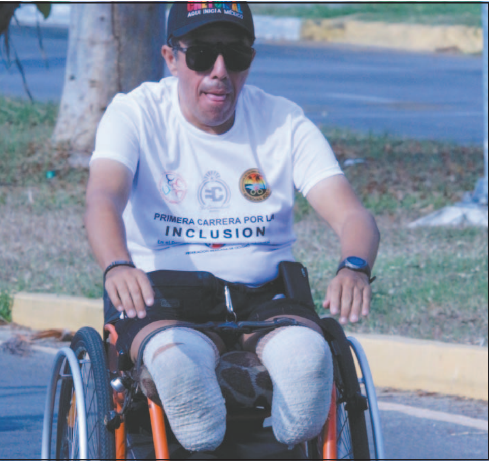
Los Pioneros de Chetumal exhibieron que durante años no recibieron ayuda de la Codeq y practicaron con equipos desgastados para torneos.