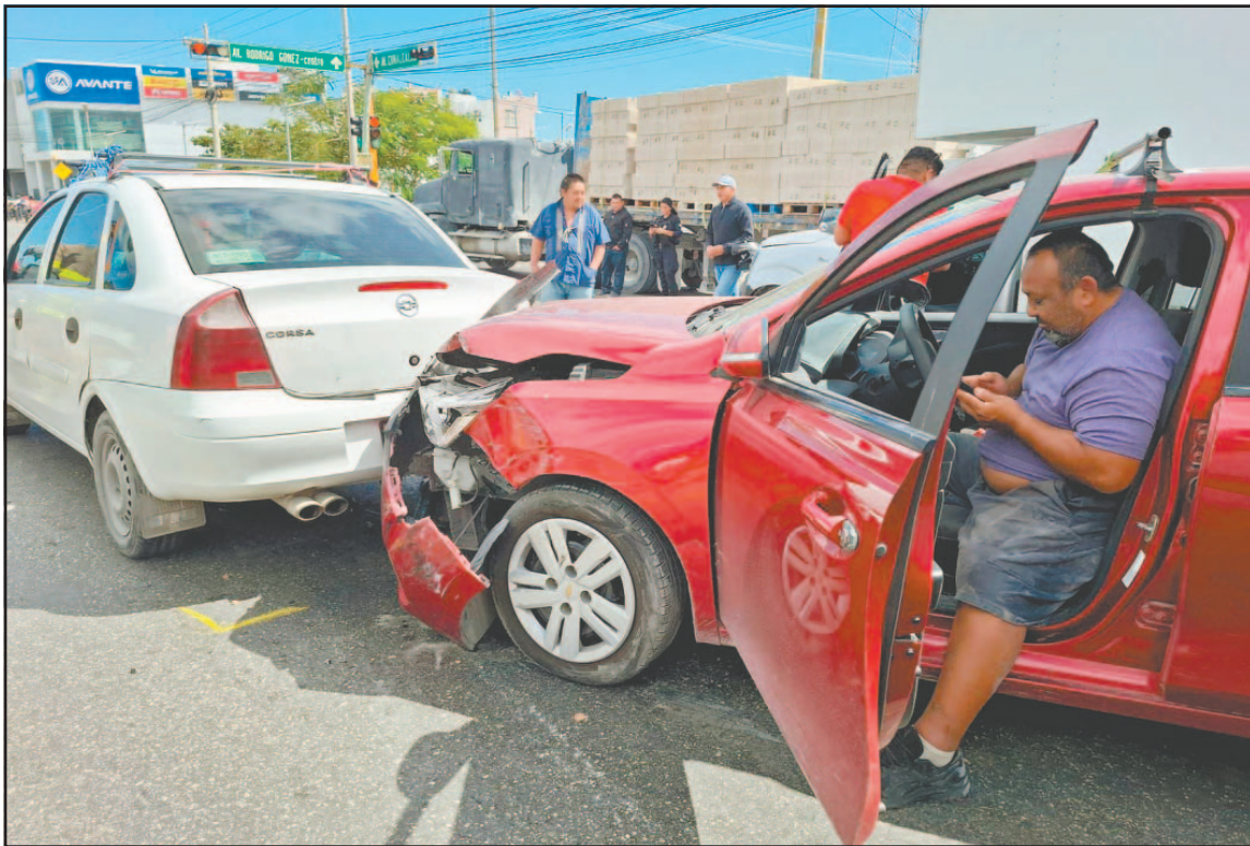
El percance ocurrió sobre la avenida José López Portillo, entre la 127 y Chac Mool. (Leonardo Chacón)

Ante la magnitud del accidente, los testigos dieron parte