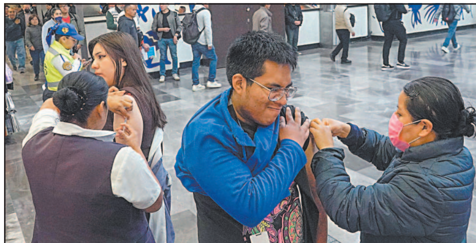
El esquema de inmunización será ampliado, anticipó la presidenta Claudia Sheinbaum.