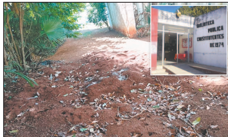
Usuario dijeron que representa un riesgo para los libros.