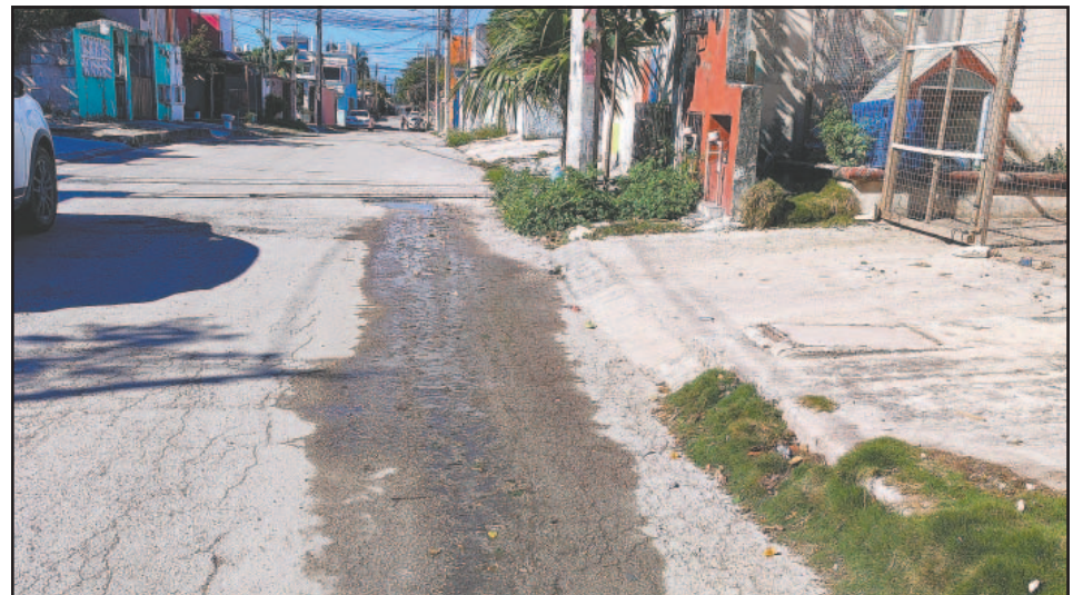
Vecinos reclamaron que limpien pozos, arreglen las líneas y restaurezcan el servicio.