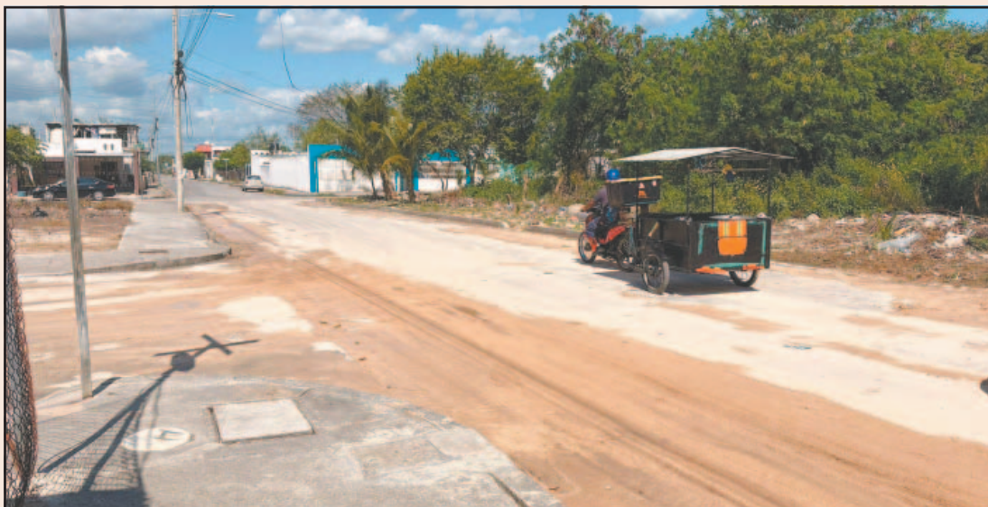
Los reportes comenzaron a hacerse las 7:00 horas. Se desperdiciaron miles de litros de agua.