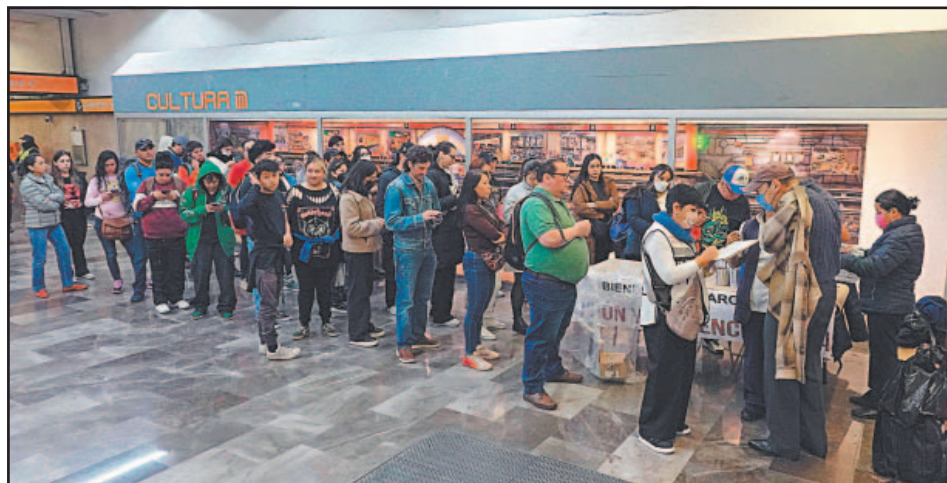
Usuarios del Metro de la CDMX han respondido a la instalación de módulos de inoculación.