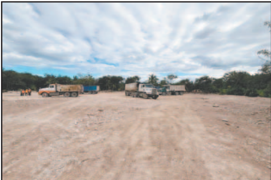
LA construcción del parque acuático de Mahahual sigue en marcha, en desacato a una suspensión federal.- (POR ESTO!)

Familiares de pacientes improvisan campamentos a las afueras del Hospital General de Chetumal ante retrasos en cirugías y atención médica; denuncian amenazas y represalias si protestan / Personal de Perfect Day continúa obras pese a clausura de la Profepa / Atletas en sillas de ruedas cumplen 12 años sin apoyo / Muerte de obrero exhibe omisiones empresariales 👉 Ciudad 9, 10 y 11 / Municipios 20