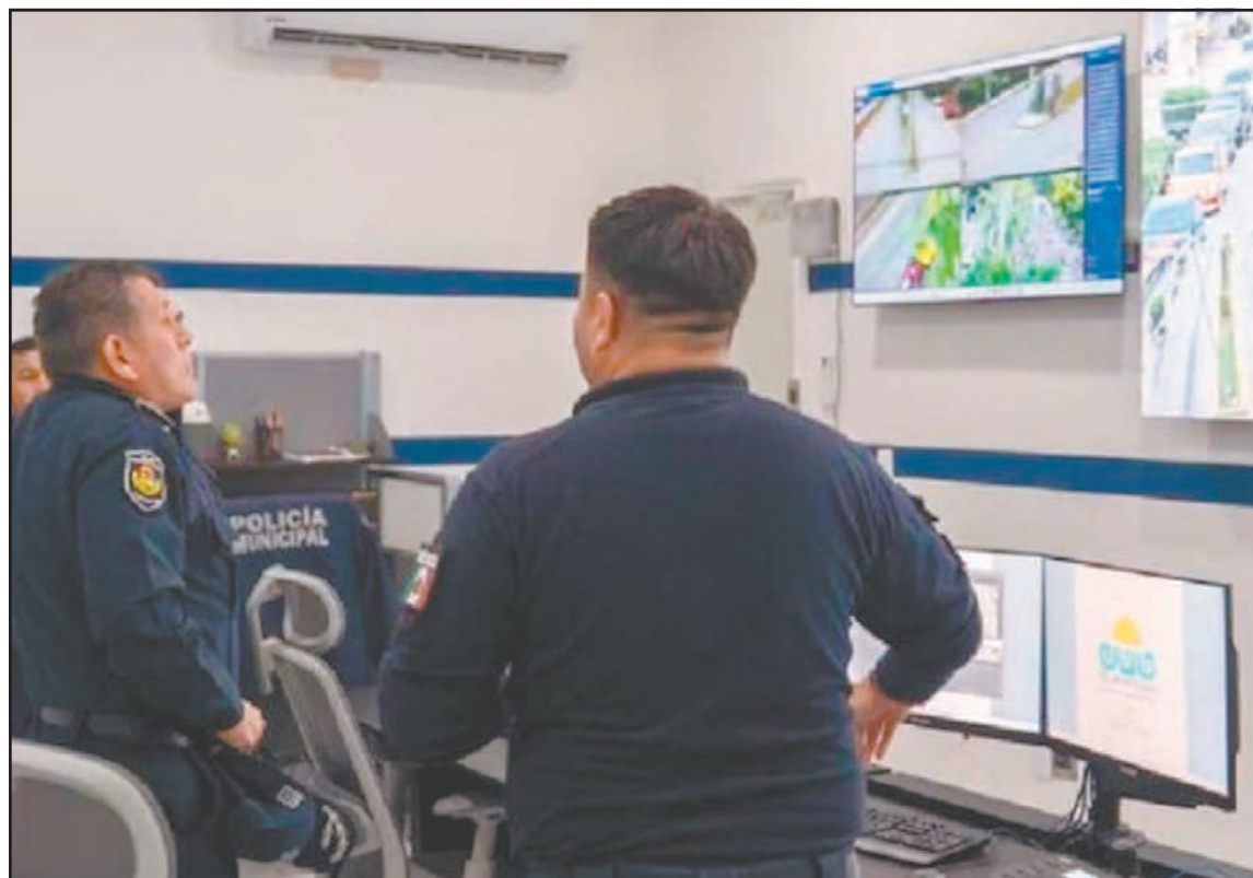
El año pasado registraron 84 casos de acoso escolar cibernético y 39 de grooming.

los delincuentes abren otras con facilidad. La prevención y la educación digital siguen siendo el eslabón más débil”, dijo.