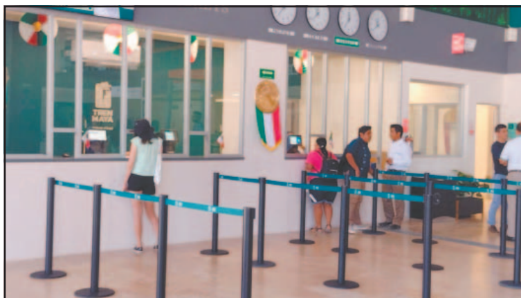
Se informó que las tierras fueron destinadas al Tren Maya. (Justino Xiu)