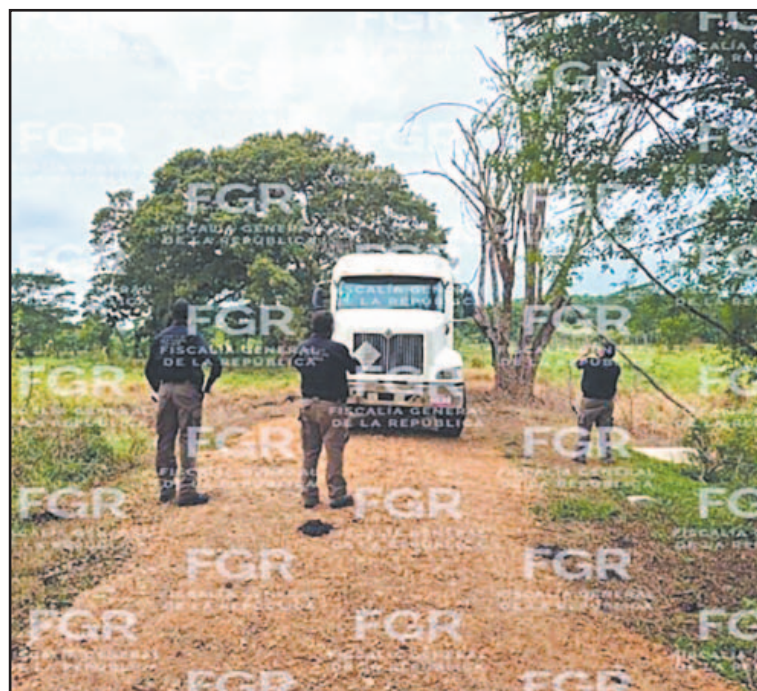
El aseguramiento se concretó en una rancharía de Centro.