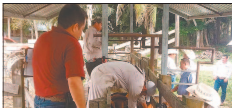
Colocaron paja en los corrales para abrigar el hato. (POR ESTO!)