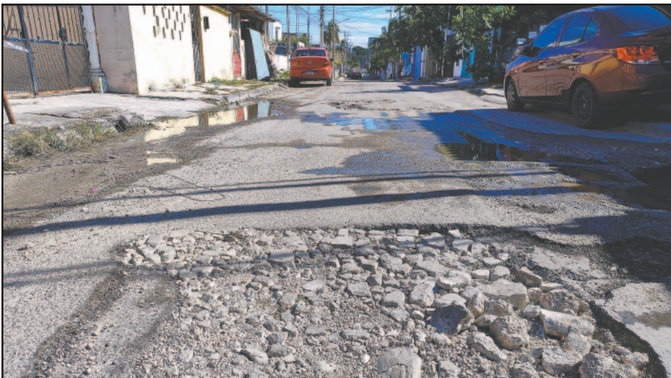
Muchas calles rotas por la concesionaria no terminan de repararse.