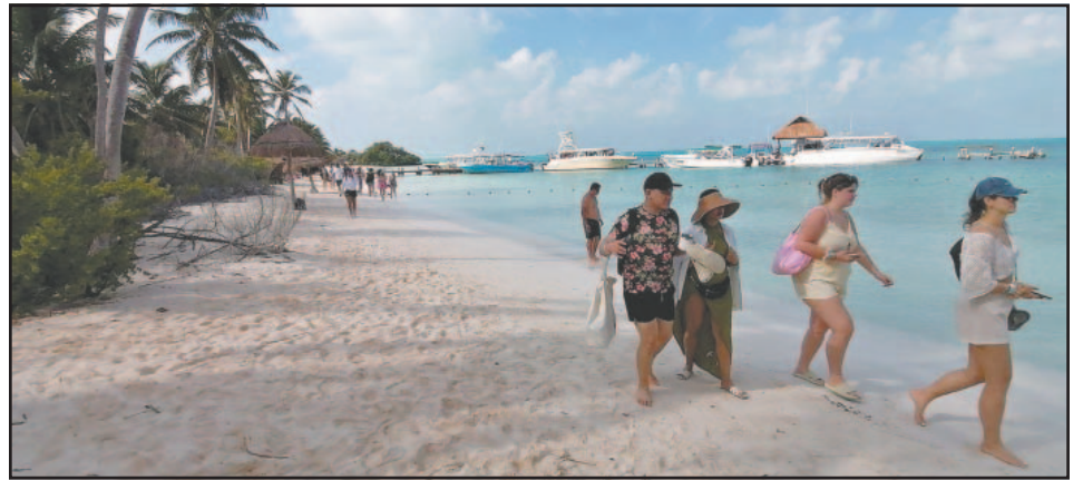
Durante el 2024 liberaron 5 mil 454 tortuguillas de esta especie.