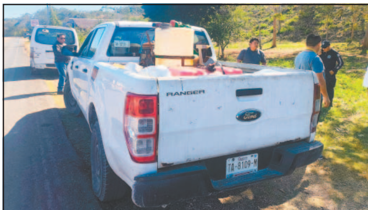
La camioneta con el equipo fue detenida en un filtro policiaco. (L. Kauil)