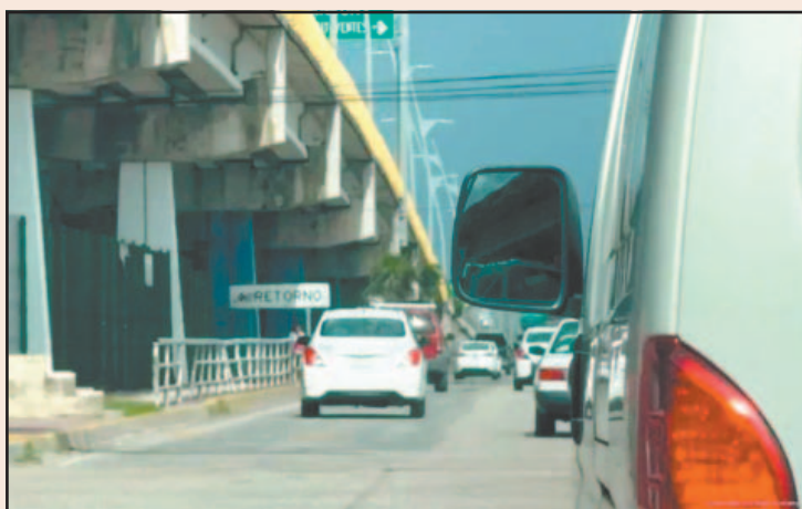
El crecimiento urbano volvió muy peligroso el tráfico. (POR ESTO!)