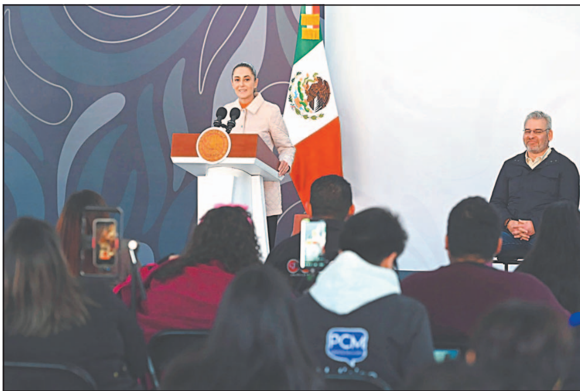
En Michoacán, la mandataria Claudia Sheinbaum se refirió a la detención de un Alcalde en Jalisco.

La mandataria añadió que ella misma tuvo conocimiento directo de quejas sobre la situación en la zona.