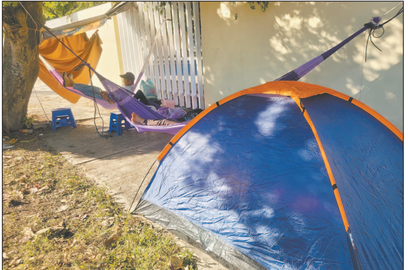
COMO vergonzoso, calificaron usuarios del principal nosocomio de la capital el trato que reciben durante la espera o atención a sus parientes internados. Deben pernoctar en la vía pública, padecer hambre y frío; se le niega el uso de los baños y han sido advertidos con desalojos policiacos.- (E. Martín)

Habitantes de Polyuc se quedan sin vivienda tras voraz incendio