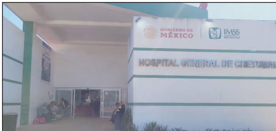
La gran demanda supera la capacidad de atención en el centro médico de la ciudad.