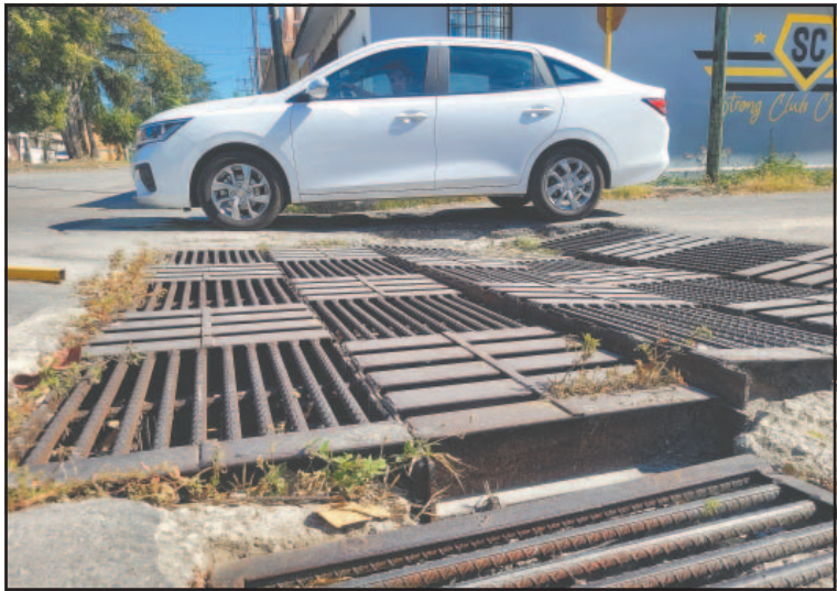
Vecinos dijeron que la zona registra alta carga vehicular.