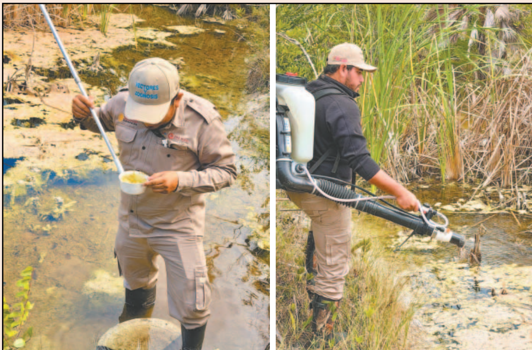
Personal de Vectores supervisa charcos, zanjas y recipientes abandonados con agua.