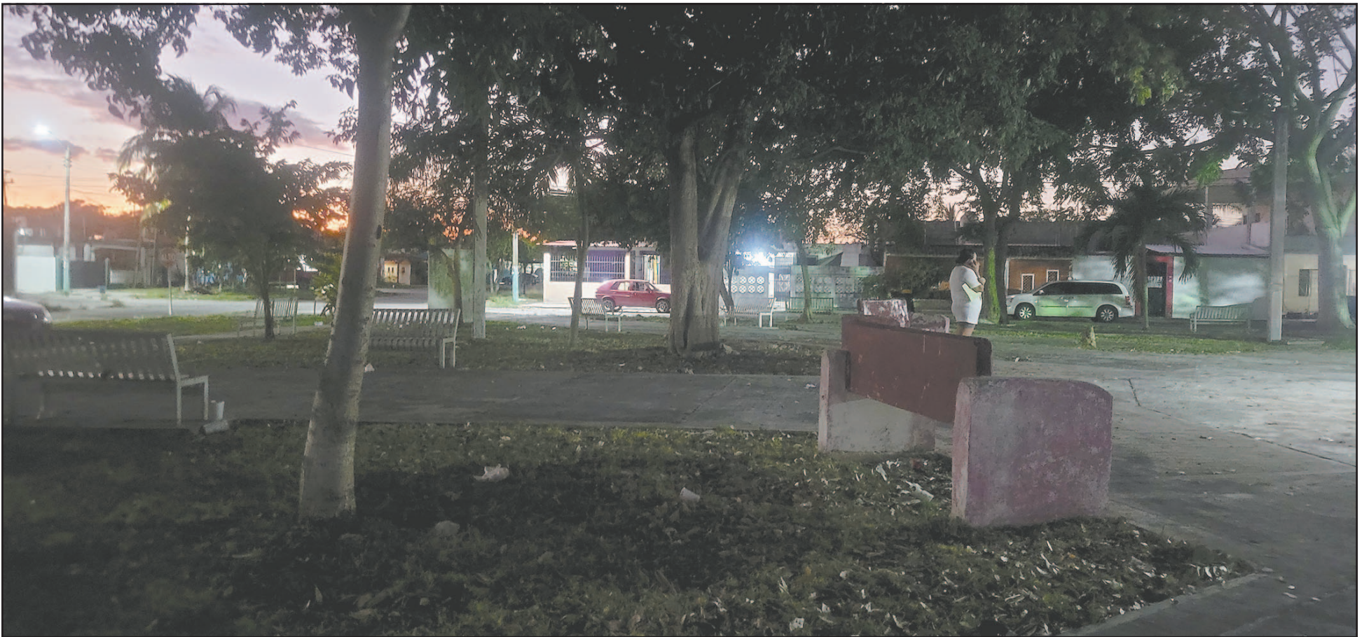
Vecinos de la zona dijeron que han realizado múltiples solicitudes al Gobierno municipal, pero falta solución. Además, sufren ante la proliferación de moscos. (A. Bautista)