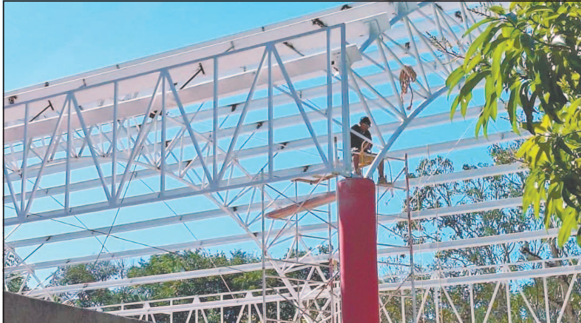
Al parecer, los empleados no tenían la capacitación adecuada para usar el equipo de protección.

Dicha NOM, emitida por la Secretaría del Trabajo y Previsión Social (STPS), establece las condiciones de seguridad para la ejecución de trabajos en altura. Su cumplimiento es obligatorio en todos los centros laborales donde se realicen actividades a más de 1.8 metros sobre el nivel del suelo, y tiene como finalidad prevenir riesgos laborales y salvaguardar la