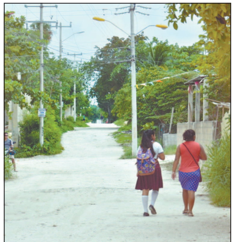
En el destino hay al menos 12 colonias no municipalizadas. (E. Martín)