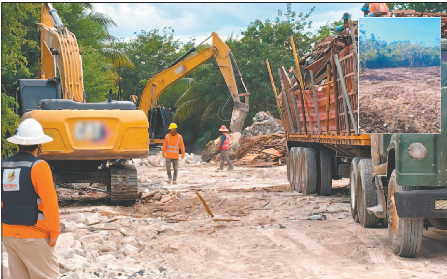
Presuntos infractores dijeron que cuentan con permisos de los tres niveles de Gobierno para talar. El problema podría escalar a un ecocidio.