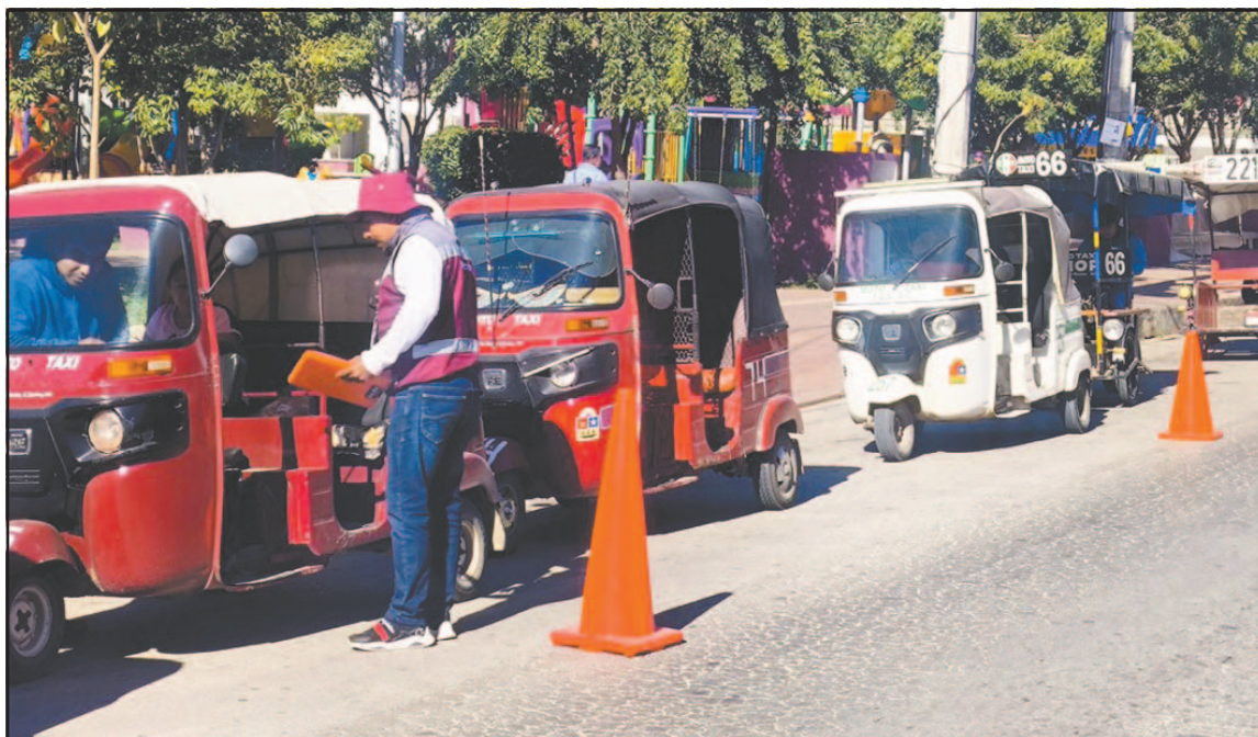
Empleados constataron que los vehículos se encuentren en buen estado mecánico y sin luces excesivas. (L. Kauil)

Se observó que a los operadores que presentaron licencia de manejo, pero carecían de la póliza de seguro o del tarjetón, se les otorgó la oportunidad de regularizar su situación; sin embargo, quienes no contaban con ninguno de los documentos mencionados no pudieron continuar