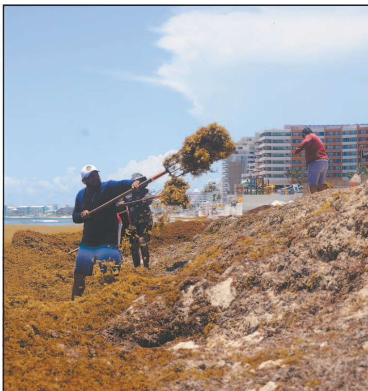
Se retiraron 2 mil 570 t de talofita en lo que va de este año. (L. Vera)