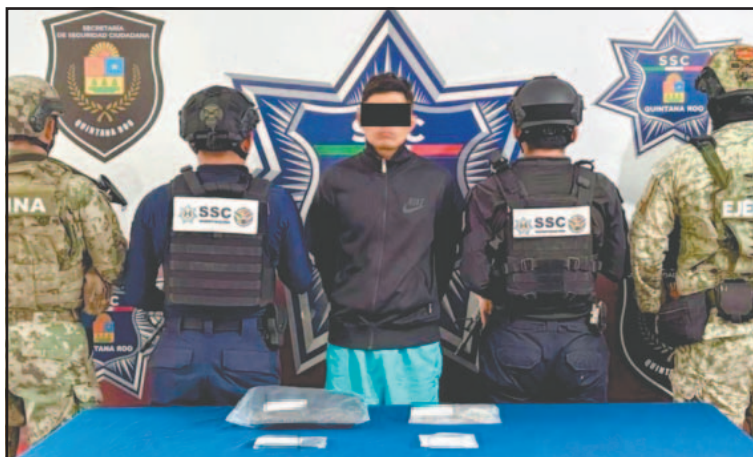
Diego Armando "N" tenía hierba similar a la marihuana.