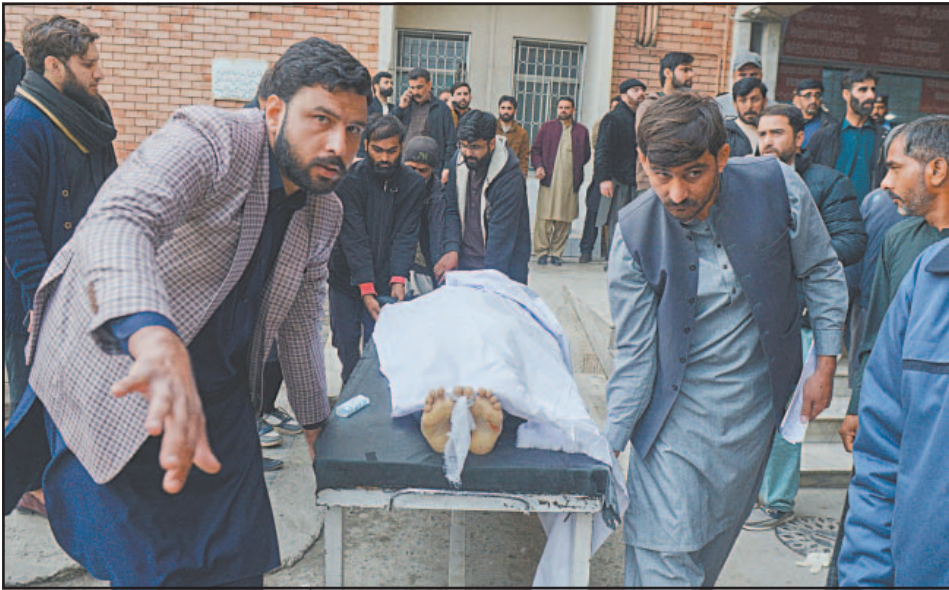
Medios de prensa comprobaron el arribo de cadáveres a los hospitales locales.