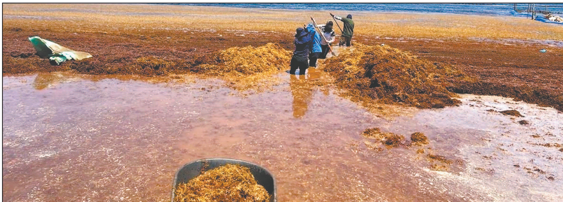
Hoteleros fueron convocados para reforzar las labores de limpieza en los arenales del sur del estado; mientras la Marina se encarga del acopio en altamar.