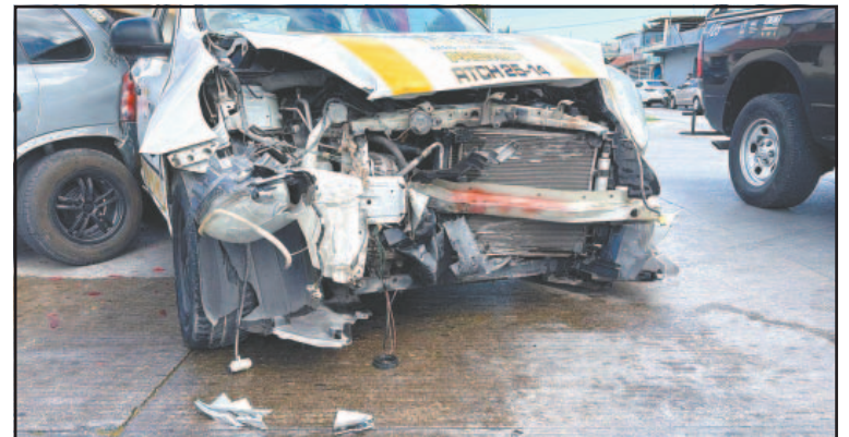
Una unidad de servicio de transporte público sacó la peor parte.