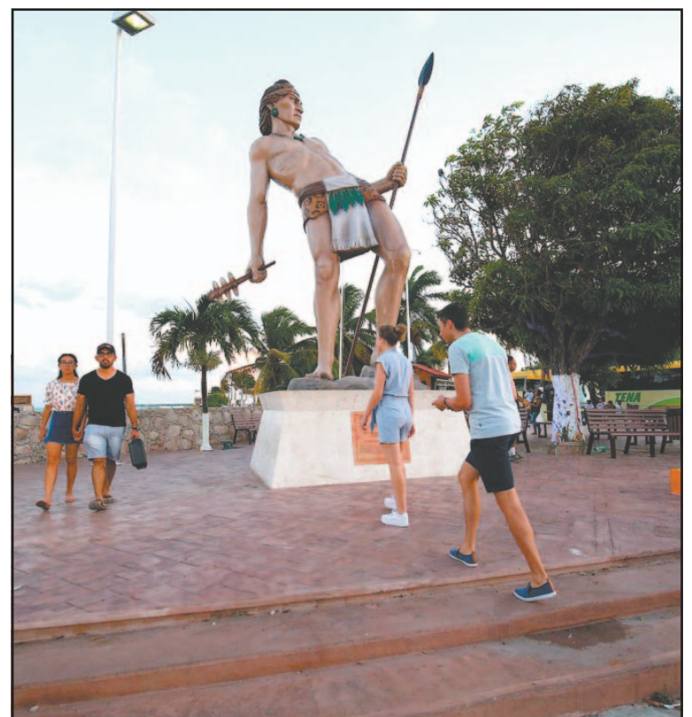
Se informó que la ocupación actual es del 40 por ciento. (E. Martín)