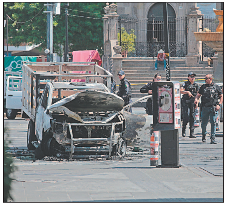
La AMIS pidió a propietarios afectados presentar su reporte.