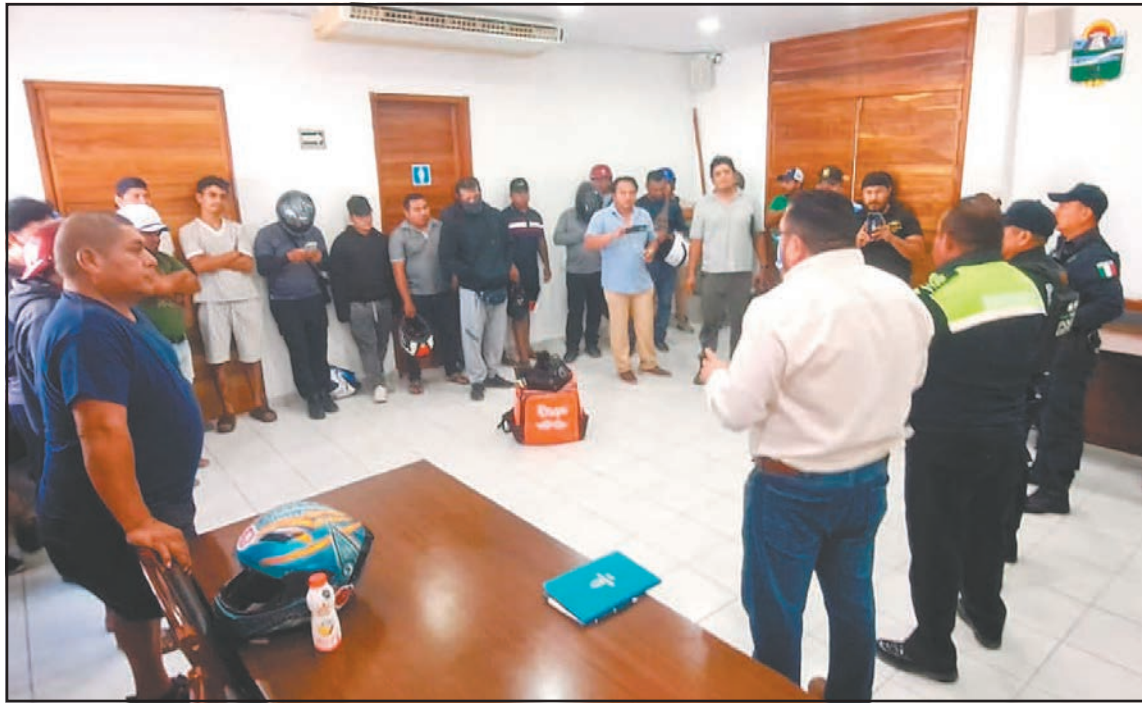
Los quejosos se reunieron con autoridades y acordaron reforzar los canales de denuncia. (A. Bee)

Durante el diálogo con mandos presentes, los trabajadores cuestionaron cómo proceder ante una presunta irregularidad si, en algunos casos, aseguraron, les retiran teléfonos