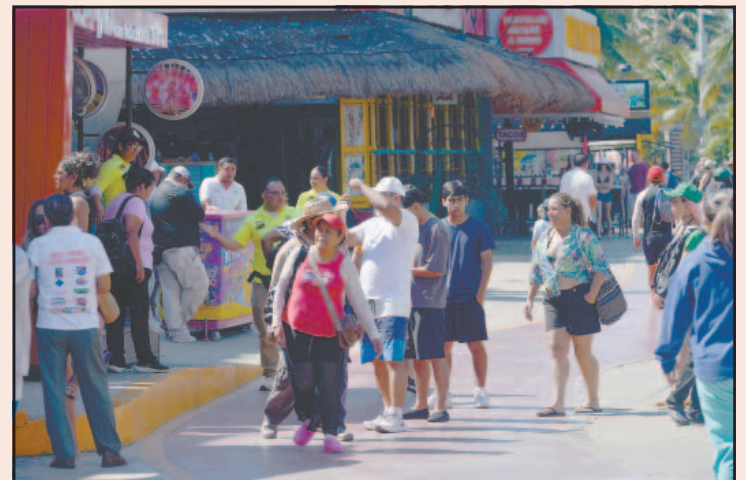
En centros de hospedaje cayó la ocupación al 83.7%. (M. Hernández)