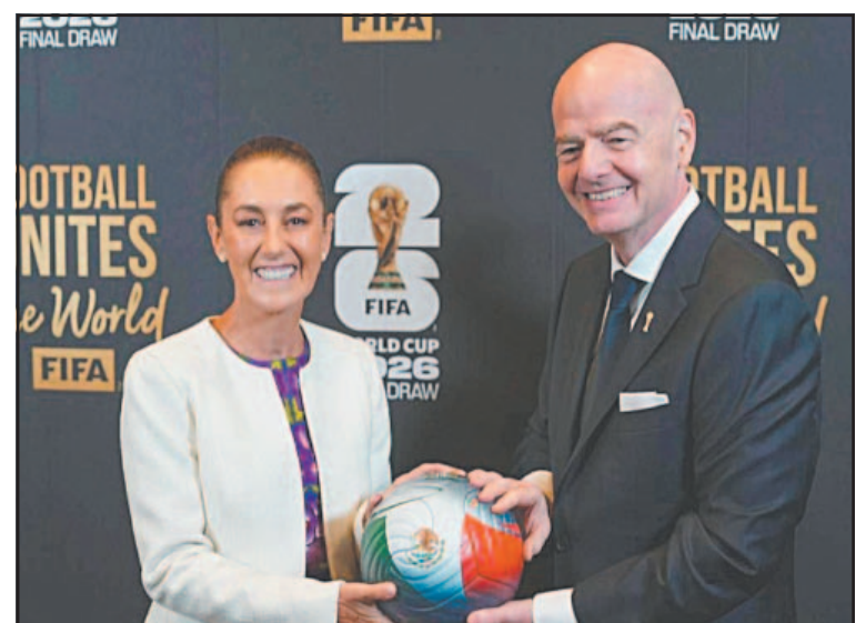
La máxima competencia de fútbol se mantiene en pie.

Ayer miércoles, Gianni Infantino, presidente de la FIFA, descartó que haya otra sede que