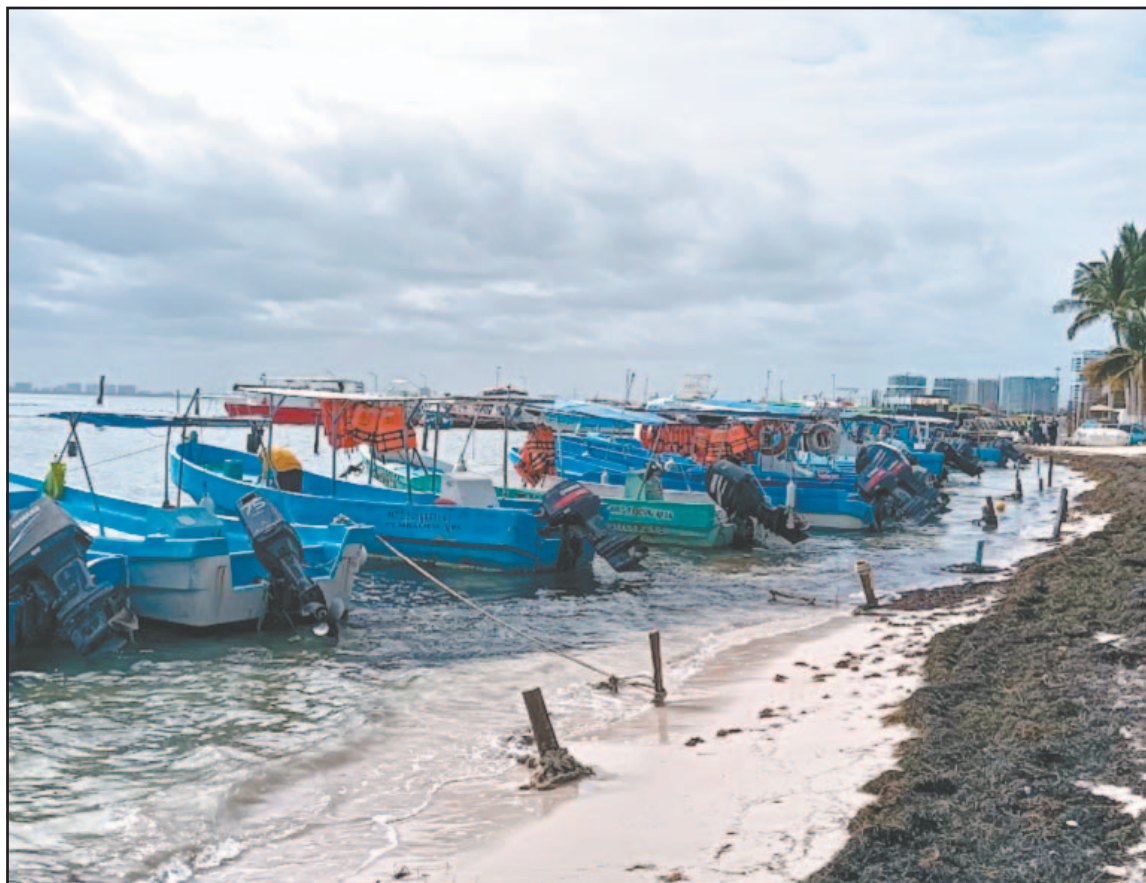
Los hombres de mar y trabajadores náuticos tendrán afectaciones económicas.