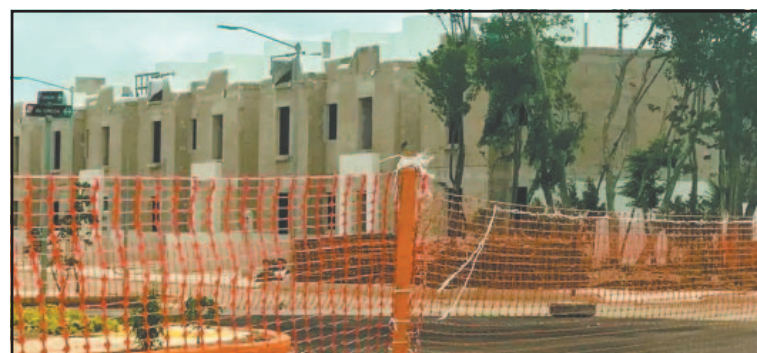
Explicaron que el ajuste será en las casas del Bienestar. (POR ESTO!)