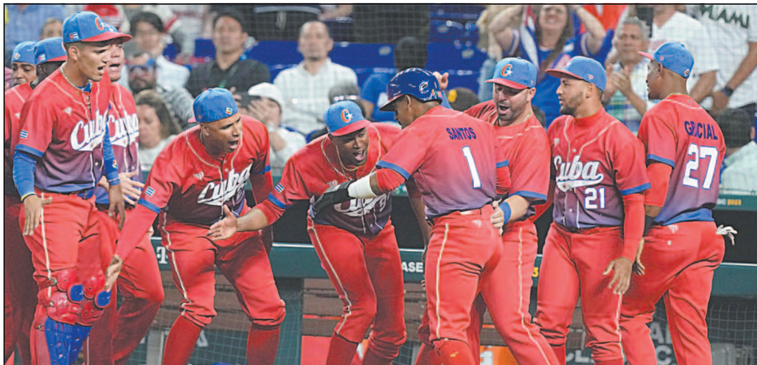
La sexta edición del torneo otorgará dos cupos al Continente Americano para los Juegos Olímpicos de Los Ángeles 2028. (POR ESTO!)

EE.UU. niega la visa a ocho miembros del equipo isleño que participará en el Clásico Mundial