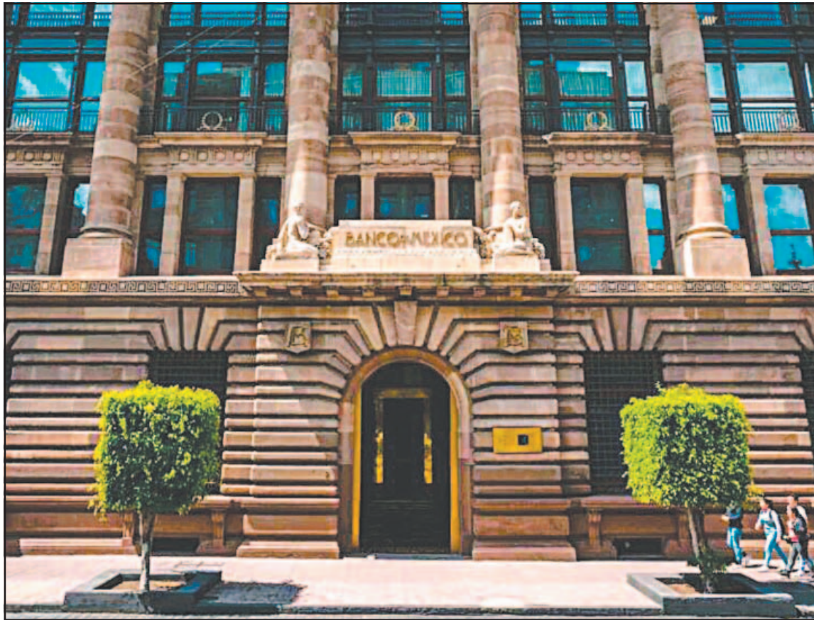
El organismo justificó el aumento de expectativas por el desempeño de la variación del PIB en 2025.

Se prevé que el crecimiento de Estados Unidos sea menor a lo esperado y que la reconfiguración de cadenas de proveeduría nacionales