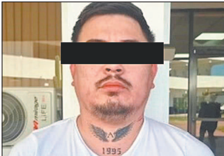
El sujeto fue arrestado en el ejido El Sandoval , en Matamoros.

Este despliegue ocurrió cuatro días después de las manifestaciones violentas en varios estados del