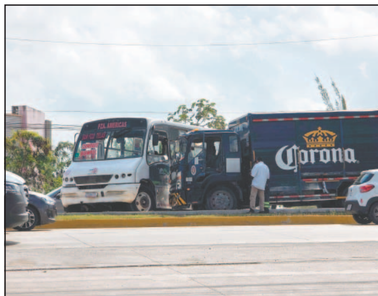
Testigos indican que al autob s se sali  de control. (Gabriel Alcocer)