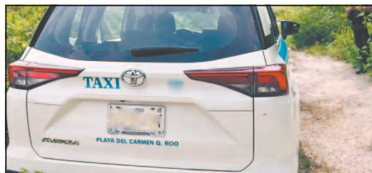
El vehículo de Obed apareció en Puerto Aventuras.