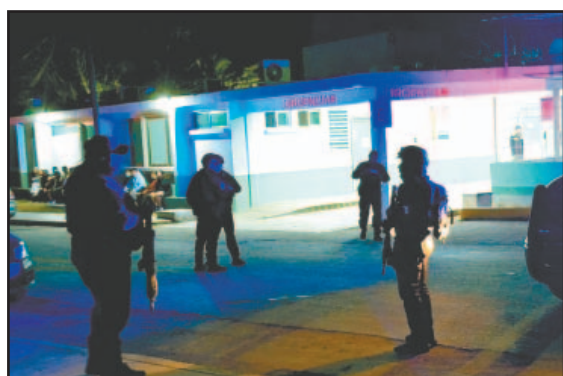
EN un operativo cerca de la carretera 307, atraparon a dos supuestos criminales a bordo de un autobús.- (Justino Xiu)