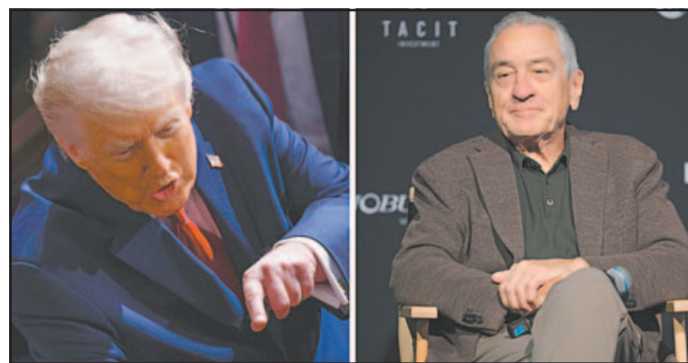
La estrella de Taxi Driver es un crítico acérrimo del Mandatario.

también atacó en su mensaje a las legisladoras demócratas Ilhan Omar y Rashida Tlaib, a quienes llamó “lunáticas”.