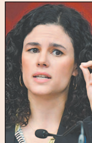
La lideresa de Morena, Luisa Alcalde, explicó la iniciativa.