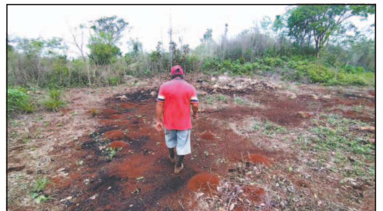
Este año pronosticaron escasas lluvias en la región. (Lusio Kauil)