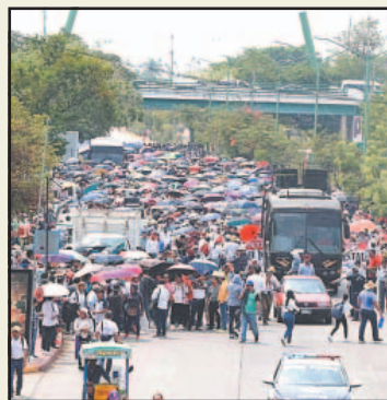
Iniciaron paro laboral de 48 horas.

Ambas, subrayó, se encuentran intactas y no tienen señal de solución, porque la mesa nacional que