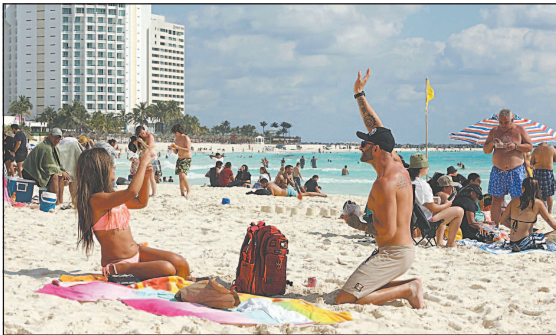
El año pasado pernoctaron 47.8 millones de turistas internacionales en territorio nacional. (POR ESTO!)

Rodríguez aseguró que 2019 sigue siendo el año de referencia del sector por tratarse del último previo a la pandemia. En ese sentido, la funcionaria señaló que mientras Canadá y Estados Unidos aún no alcanzan sus