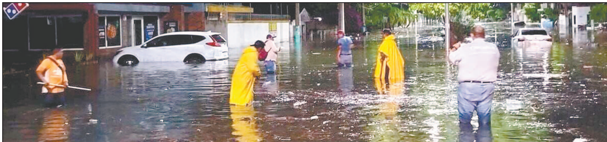
Investigador instó al Gobierno estatal a hacer obligatorias las evaluaciones de impacto hidrológico para todos los nuevos desarrollos inmobiliarios.