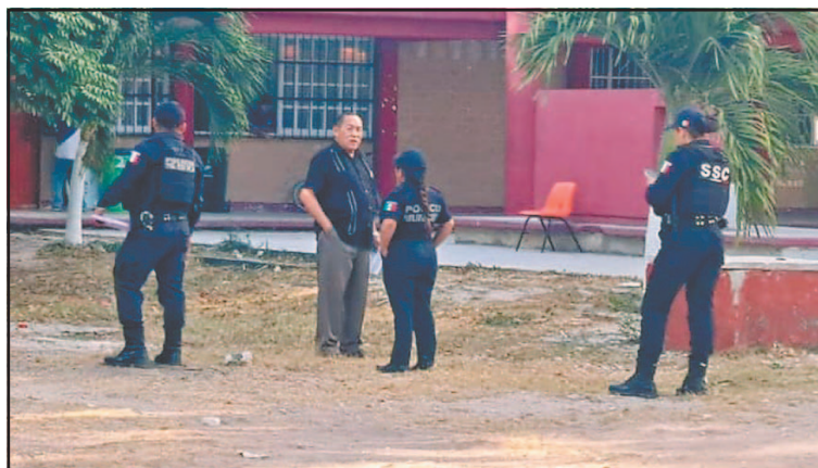
Los responsables aventaron una posible bomba molotov. (A. Bee)