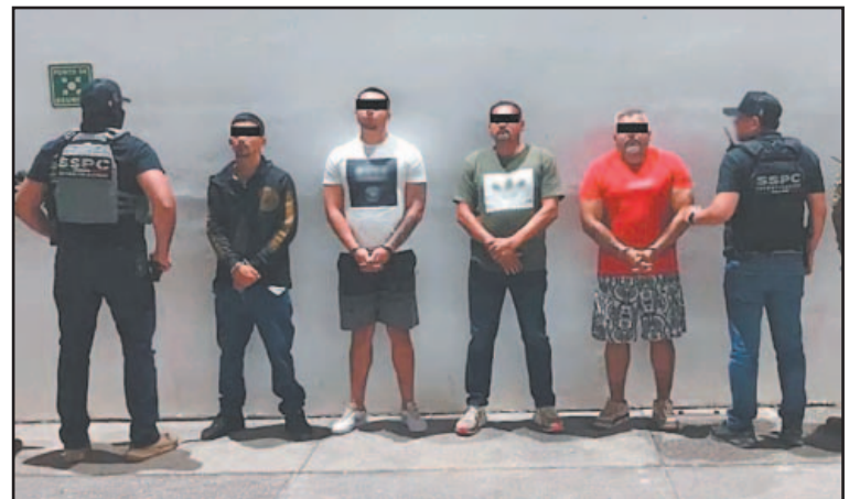
Los sujetos habían escapado del penal de Puerto Vallarta.