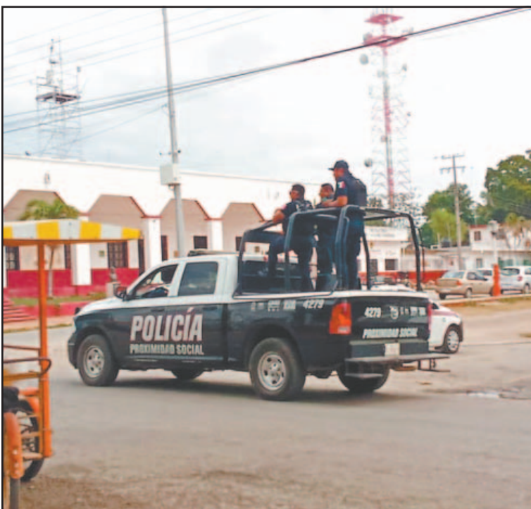
La policía incrementó los rondines desde el domingo. (Enrique Cauch)