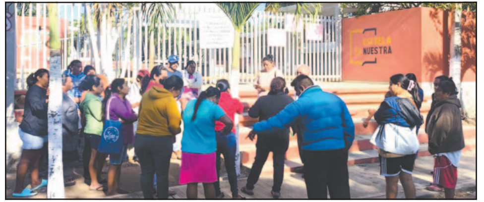
El maestro amenazó a los tutores con una demanda por difamación.