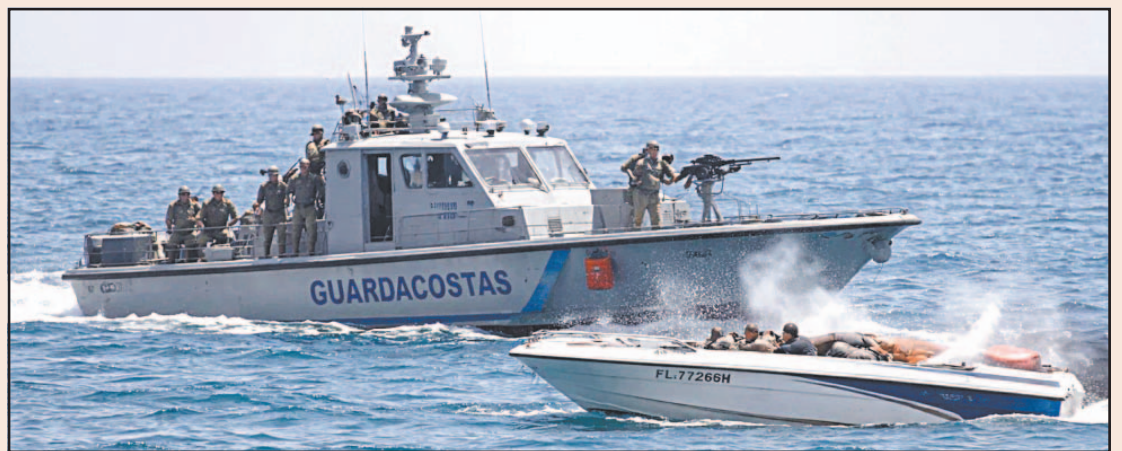
Uno de los tripulantes dijo que quería “ir a combatir” y ver “si eso prendía la chispa y el pueblo se levantaba”.

Al menos dos de los pasajeros de la lancha interceptada en Cuba son estadounidenses, declaró ayer a la AFP un alto funcionario de Estados Unidos. “Al menos dos personas (a bordo de la lancha) eran ciudadanos estadounidenses, una ha fallecido y la otra está herida”, precisó, y añadió que “el