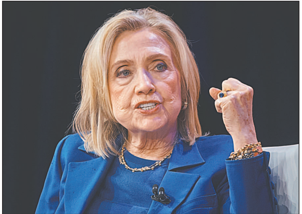
Si la comisión quisiera conocer la verdad le pediría a nuestro presidente que declare bajo juramento, dijo.

“Como toda persona decente, me ha horrorizado lo que hemos sabido sobre sus delitos”, añadió Hillary Clinton en su declaración inicial. Ella había dicho que su esposo había volado con Epstein en viajes benéficos, pero que no recordaba haber conocido a Epstein. Sí había interactuado con Maxwell, exnovia y confidente de Epstein, en conferencias organizadas por la Fundación Clinton . Ghislaine Maxwell, una socialité británica, también asistió a la boda de su hija, Chelsea Clinton, en el 2010.