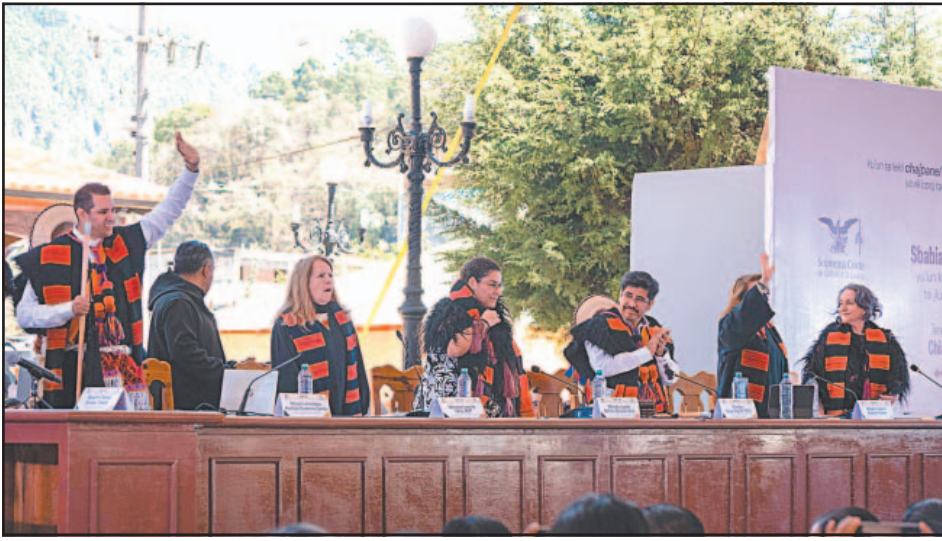
La discusión de la Corte se efectuó en la explanada de la Casa de Cultura de Tenejapa.