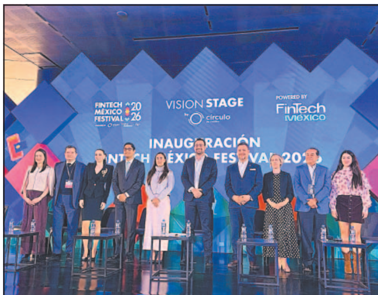
El titular de la Comisión estuvo en el Fintech México Festival .