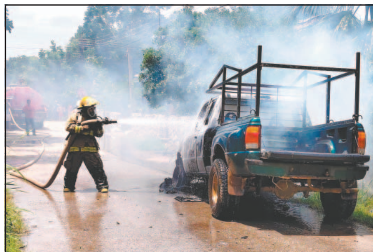
Habitantes afirmaron desconocer el uso del dispositivo. (Lusio Kauil)