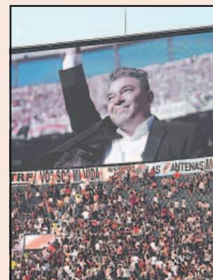
El DT más ganador de River deja al club tras una crisis.