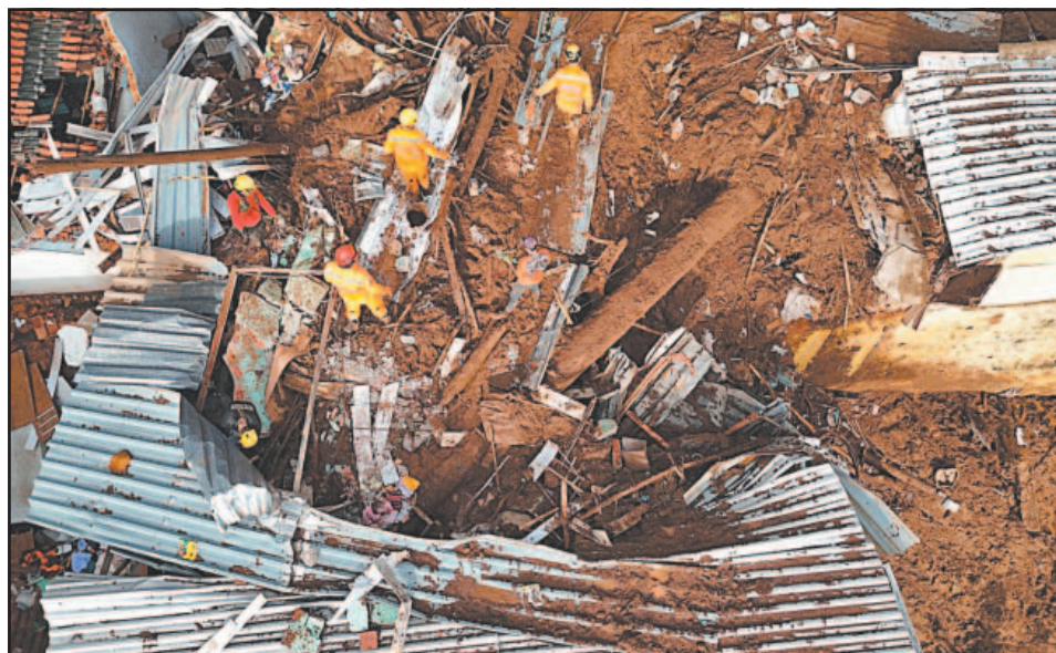
En zonas de Juiz de Fora y Ubá, más de 5 mil personas debieron dejar sus casas.