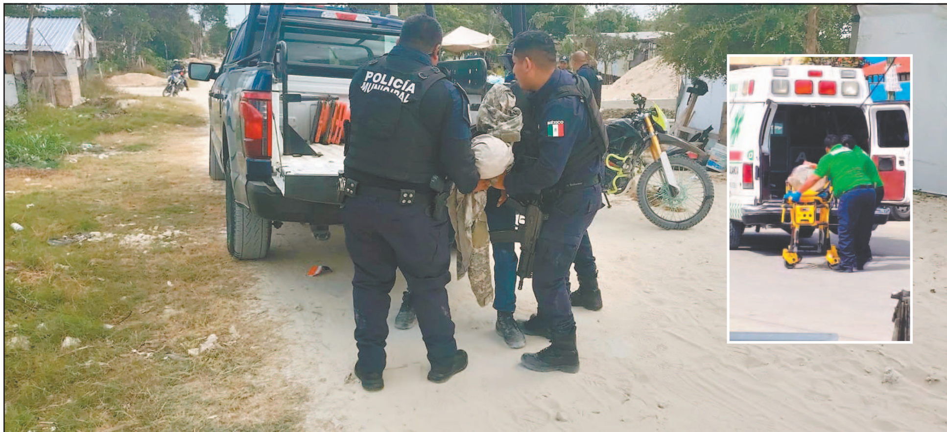
Elementos de la Secretar a Municipal de Seguridad Ciudadana capturaron a un individuo en la zona de invasi n Benito Ju rez, cerca del Arco Norte.

Chetumal, Q. Roo, viernes 27 de febrero del 2026