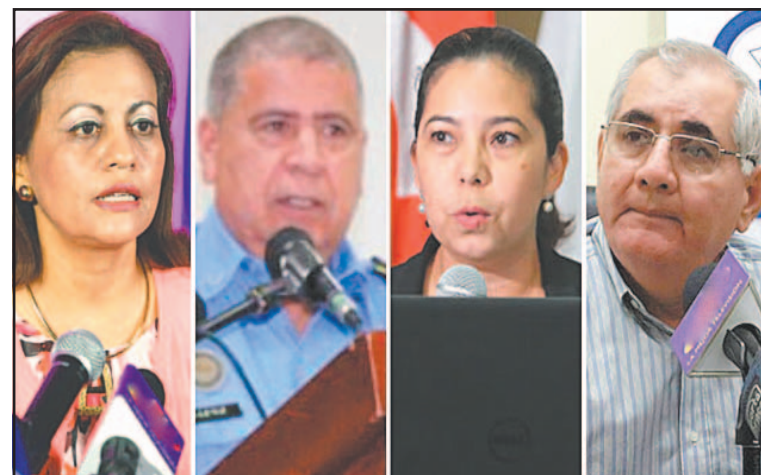
Cuatro de los funcionarios inhabilitados por el Tesoro.