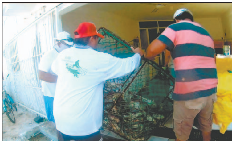
Calcularon una producción de 90 toneladas del crustáceo vivo. (O. López)