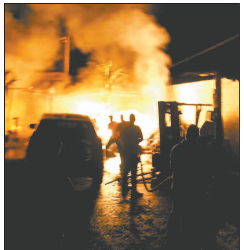
Una casa ardió en la colonia Sor Juana Inés de la Cruz. (POR ESTO!)