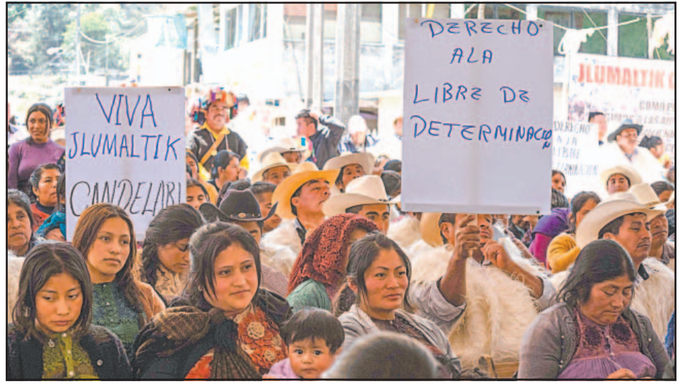
El Máximo Tribunal reconoció el autogobierno de una comunidad tsotsil.