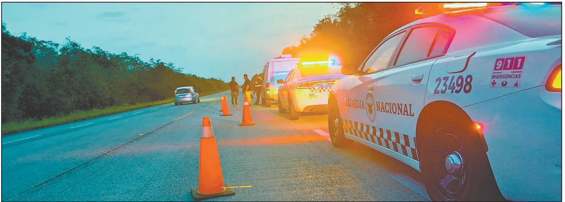
El arresto de los sujetos sucedió en el tramo del municipio con Tulum, donde iban a bordo de un autobús con destino a Chetumal. Fueron enviados a la Fiscalía. (Alberth Kiin)