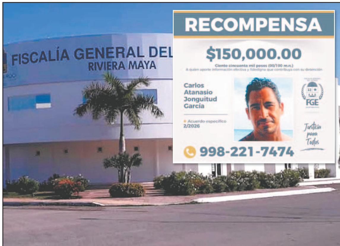
El imputado laboraba como entrenador personal en gimnasios antes de escaparse.

En contraste, la madre del menor exhortó a la población a compartir la ficha de búsqueda para ubicar al presunto agresor, quien