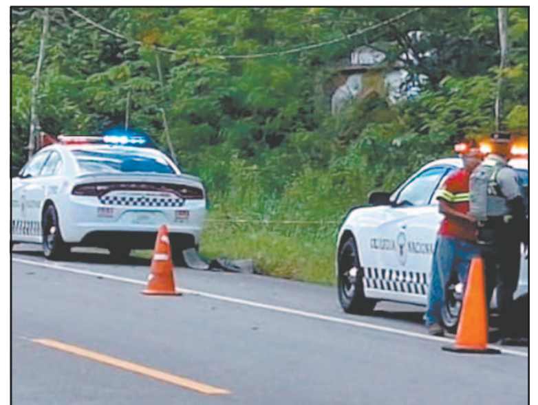
Oficiales efectuaron recorridos sobre la Carretera Federal 307. (J. Xiu)

La titular de la Dirección de Seguridad Pública municipal exhortó a que si se presenta otra situación en el futuro los afectados soliciten apoyo inmediato a través del número de emergencias, para que los elementos preventivos puedan acudir al sitio en coordinación con las corporaciones federales, responsables de la atención en esa ruta.