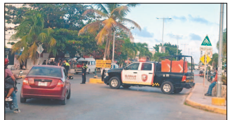
Automovilistas criticaron la complicación en la movilidad. (E. Silva)