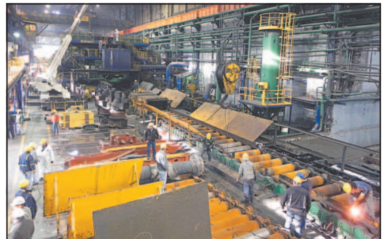
Las ventas de Altos Hornos y Minosa no se concretaron.