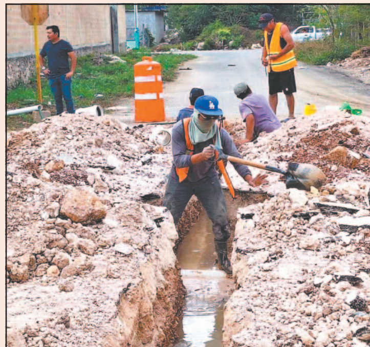
Exhortaron a la CAPA a solucionar la falta de presión.

El enlace se realizó en las calles 47 y 68, donde abrieron una zanja con maquinaria pesada para unir la red