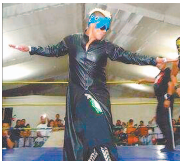
Confirmaron choque de maestros contra "Huachicoleros". (Rafael García)

La función arrancará con una batalla de parejas mixtas que arrastra una cuenta pendiente. La dupla integrada por La Chacala y Lady Pink chocará contra Sister Star y Crocman. El foco de atención estará en el encono personal entre La Chacala y Sister Star, un pique que nació en las eliminatorias por el campeonato femenino de Benito Juárez y que, tras acusaciones de traición, amenaza con escalar hasta un duelo de apuestas por las máscaras.