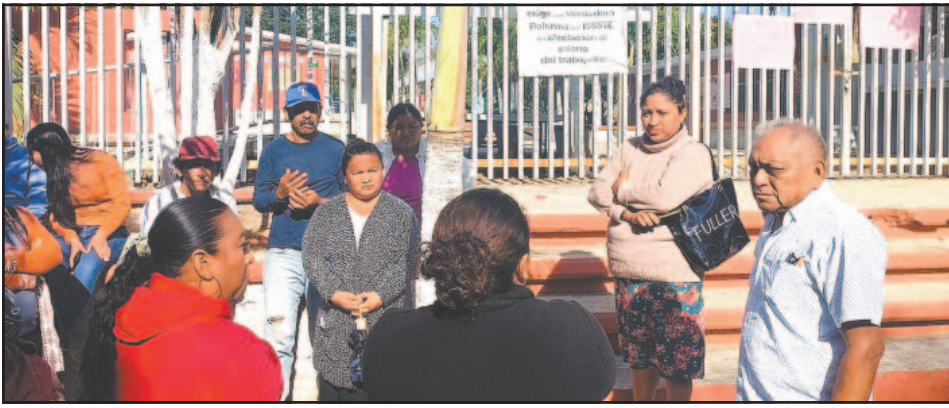
La escuela había permanecido cerrada por los padres desde la noche anterior.