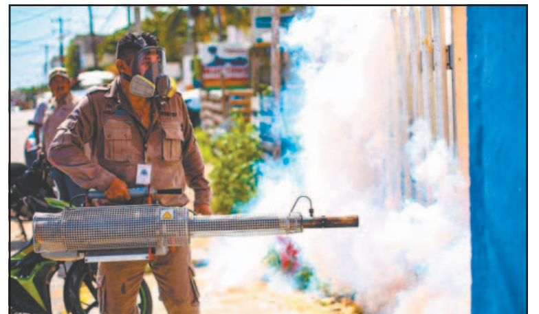
El nivel más alto fue en el 2022, con más de 30 enfermos. (O. López)