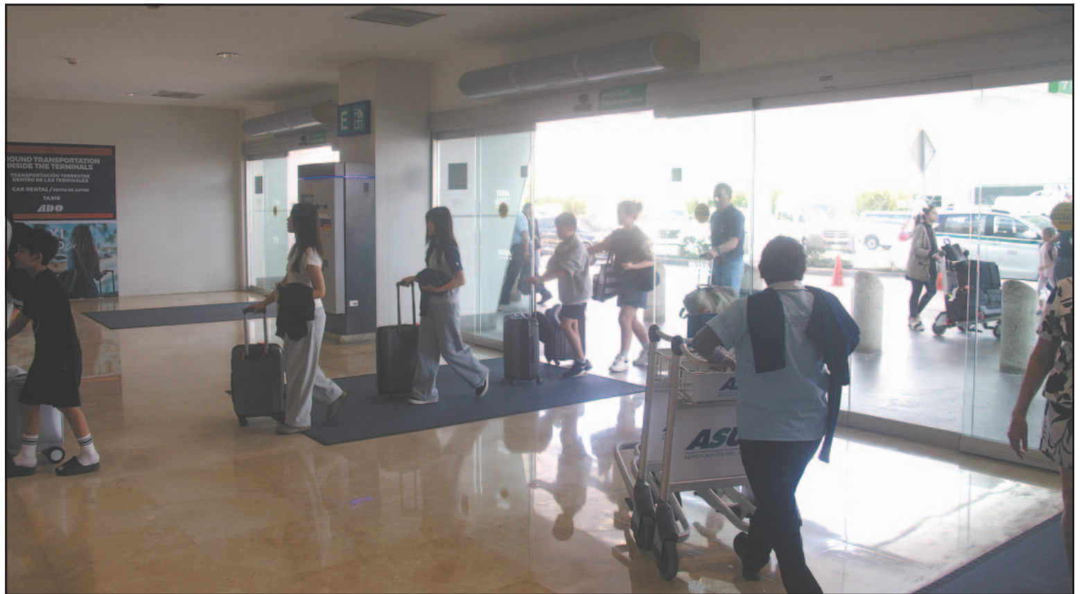
Prestadores de servicio con gafete solicitaron poner freno a los “asistentes” de transporte que lucran sin registro legal. (Henry Bressón)

Trabajadores con 25 años de servicio señalan complicidad de autoridades para permitir el cobro a los viajeros