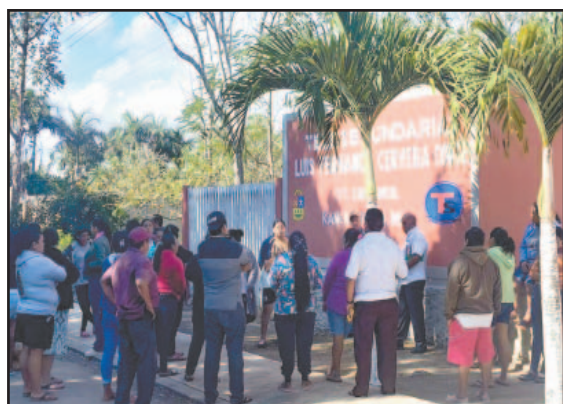
PADRES de familia de Kancabchén cerraron una escuela y exigieron la destitución inmediata del titular.- (Lusio Kauil)