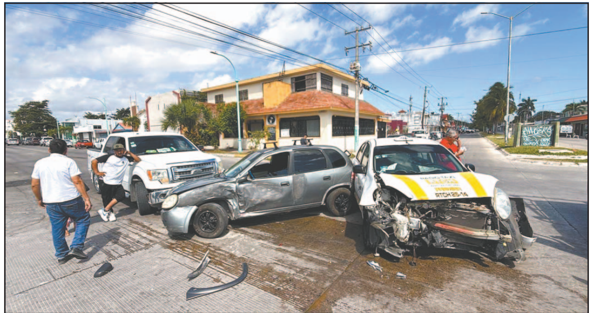
El incidente automovilístico habría sido responsabilidad del conductor de un Chevy.

A pesar de lo aparatoso del percance, no se reportaron personas lesionadas; sin embargo, los participantes se veían visible-