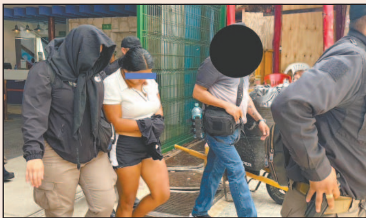
Presuntamente, la fémina es la pareja de un líder criminal.