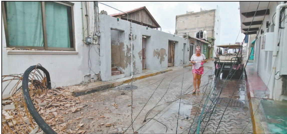
Un temporal derribó 10 unidades en el Centro Histórico y causó un apagón el 5 de junio del 2024.

Coincidieron en que el plan para sustituir la red aérea por cableado subterráneo debe continuar