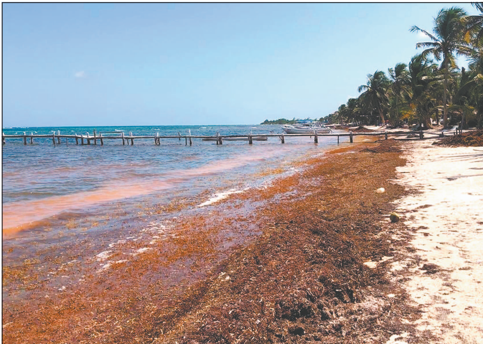
Prestadores de servicios dijeron que actuar previamente ayuda a reducir la afectación de la imagen del destino y evita pérdidas económicas.