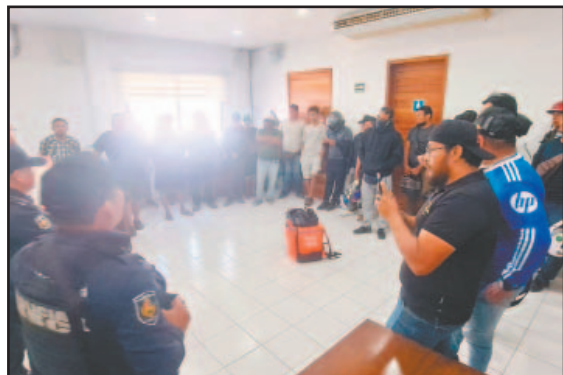
TRABAJADORES de plataformas de reparto advirtieron que amarrarán a oficiales que cometan actos ilícitos.

Chetumal pierde 32% de su capacidad de infiltración pluvial debido a la urbanización sin control; investigadores advierten riesgo de inundaciones históricas / Motorepartidores protestan en el Ayuntamiento y acusan abusos policiales / Cesan a director de telesecundaria por presunta relación con una alumna / Detienen a supuestos homicidas de un agente 📍 Ciudad 9 / Municipios 20, 21 y 24