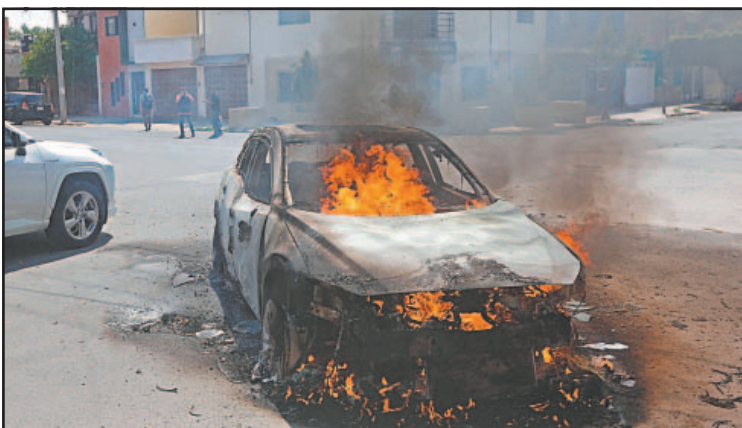
LA Asociación Mexicana de Instituciones de Seguros indicó que más del 90% de las sustracciones fueron con violencia hacia los conductores.- (POR ESTO!)

LA secretaria de Turismo, Josefina Rodríguez Zamora, destacó que el crecimiento de la industria sin chimeneas coloca al territorio nacional por encima del promedio global y del Continente Americano. Señaló que el objetivo es posicionar a México como el quinto destino más visitado del mundo en el 2030.- (POR ESTO!)