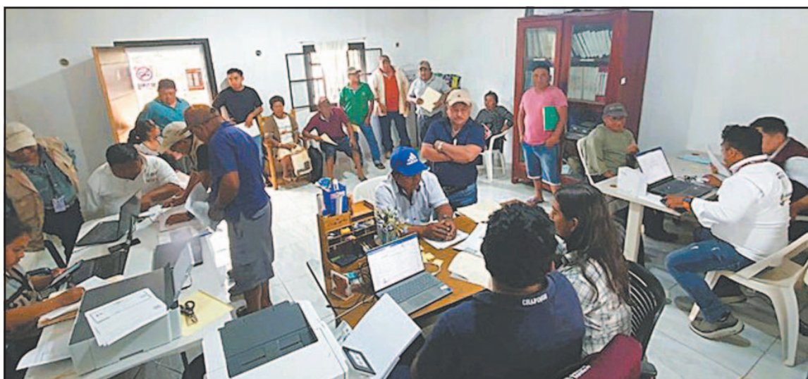
Esta semana, la Sader entrega el incentivo de 950 pesos por tonelada de maíz blanco.

La cifra de personas que han recibido el incentivo es de menos de un cuarto de los inscritos en este plan en dichos seis estados, el cual fue creado luego de las protestas del año pasado para exigir un precio base del maíz.