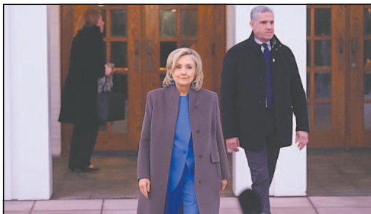
LA exprimera dama de los Estados Unidos aseguró que NO tenía idea de las actividades criminales del fallecido delincuente sexual convicto.- (POR ESTO!)