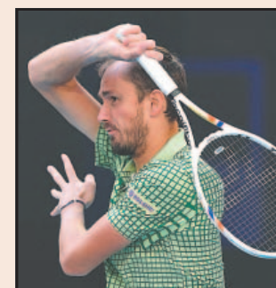
Medvedev chocará por 10ª vez con Auger-Aliassime.