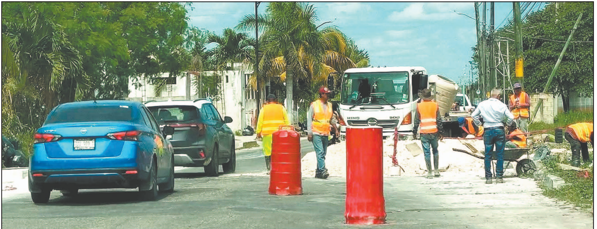
Habitantes criticaron la falta de señalización preventiva en algunos tramos. Los tiempos de traslado se incrementaron al doble, derivado de los cierres parciales de las calles. (W. Duran)