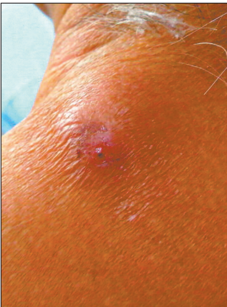
Othón P. Blanco y Bacalar concentran la mayor cantidad de miasis.