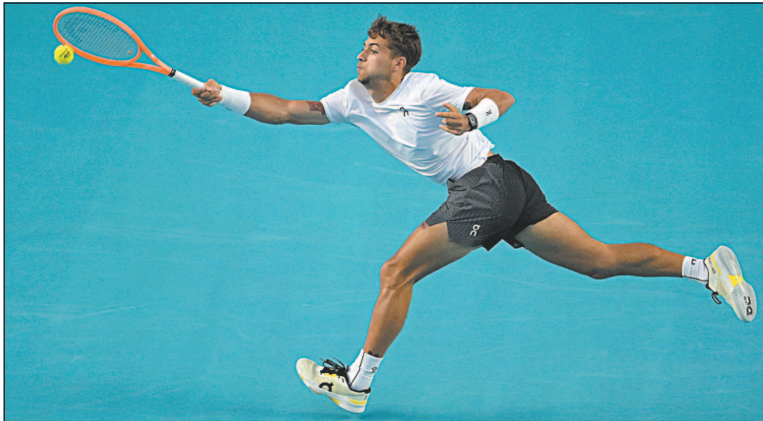
El actual número 20 del ranking ATP se impuso por 7-6(4) y 6-1 al chino Wu Yibing, luego de una hora y 24 minutos de partido. (POR ESTO!)

El tenista italiano llena el vacío de las figuras y avanza a las semifinales del Abierto Mexicano