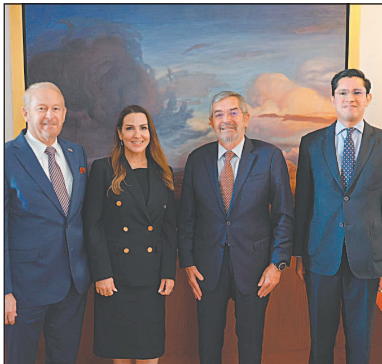
El Canciller mexicano recibió a la zar antidrogas de EE.UU.

CIUDAD DE MÉXICO.- Juan Ramón de la Fuente, titular de la Secretaría de Relaciones Exteriores (SRE), sostuvo ayer un encuentro con el embajador de Estados Unidos en México, Ronald Johnson, y con la zar antidrogas del Gobierno estadounidense, Sara Carter.