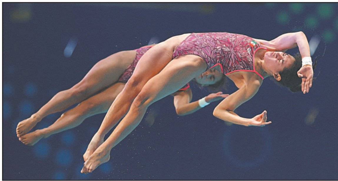
La Ciudad de México, Veracruz y Yucatán son los posibles candidatos para albergar el evento. (POR ESTO!)

World Aquatics decidió cancelar el torneo, previsto del 5 al 8 de marzo, tras una consulta realizada con Aquatics México, la Federación Mexicana de Clavados y el Consejo Estatal para el Fomento Deportivo de Jalisco, estado donde se encuentra el Centro Acuático