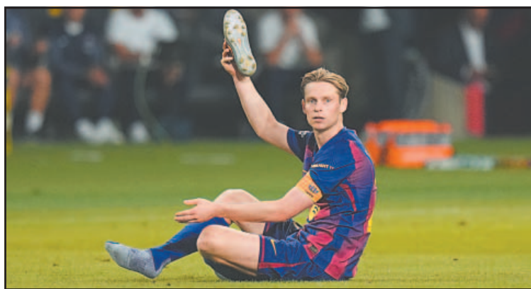
El mediocampista neerlandés sufre de una molestia en el muslo derecho.