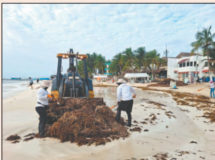
Estimaron que llegue el doble de algas que en el 2025. (POR ESTO!)