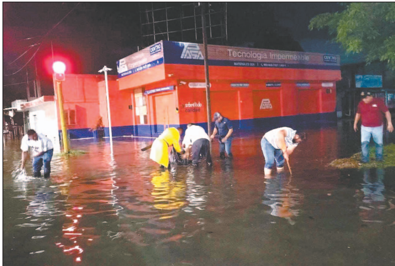
LA capital está propensa a graves afectaciones ante la temporada de huracanes, ya que los asentamientos en terrenos kársticos reducen la absorción de líquido. Entre las colonias vulnerables se encuentran Framboyanes, Solidaridad, Barrio Bravo y 8 de Octubre.

Investigan a estudiantes que, al parecer, lanzaron bombas molotov a plantel