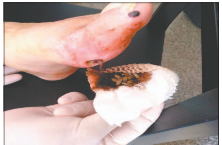
Médicos indican que las personas se atienden solas.