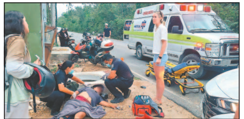
Turistas impactaron una moto, en la que iban dos personas. (A. Bee)