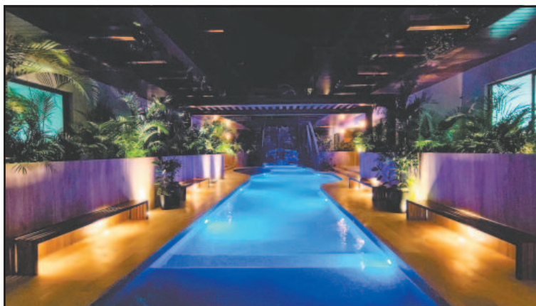
Quejoso dijo que tiene un proceso legal contra un desarrollo.