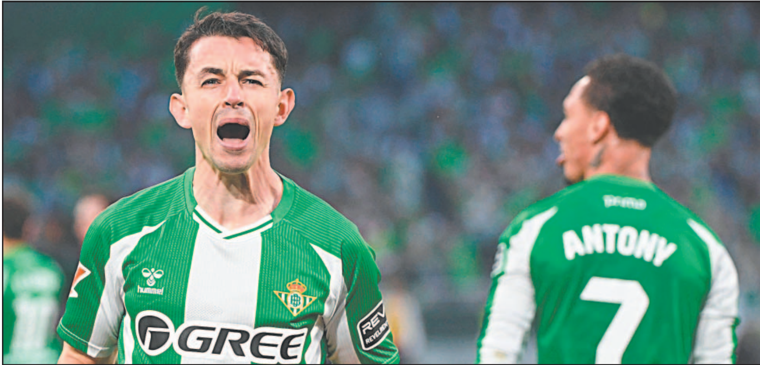
El jugador del Betis y Obed Vargas ayudarán al Vasco a cubrir ausencias por lesión de Marcel Ruiz y Edson Álvarez, ambos por lesión.

Álvaro Fidalgo recibe su llamado a la Selección Mexicana para los duelos ante Portugal y Bélgica