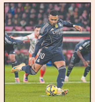
El galo regresó tras un mes de baja por una lesión.