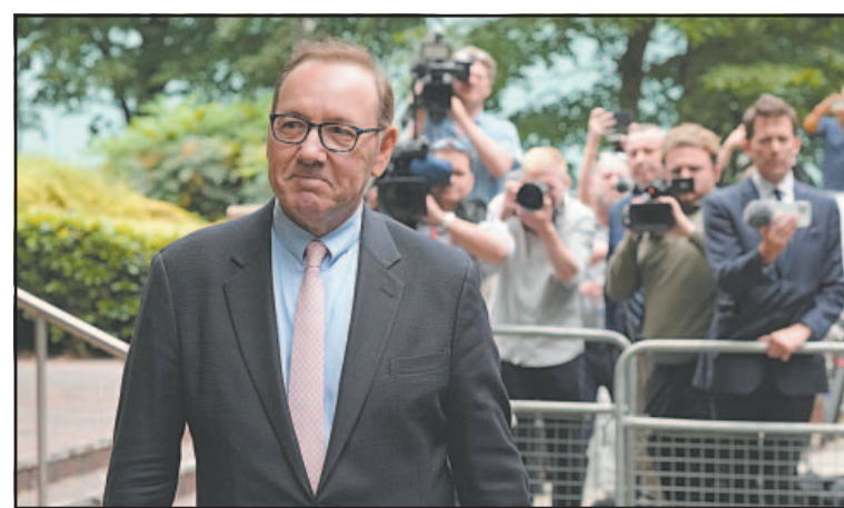
El histrión de House of Cards fue acusado de abuso sexual.

No se divulgaron los términos y la jueza no emitió ninguna orden