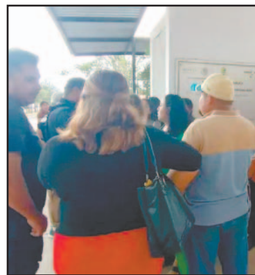
Padres se reunieron afuera del plantel educativo.

De acuerdo con los testimonios, el suceso derivó del consumo de dulces proporcionados presuntamente por un docente, quien ya se encuentra bajo custodia. Los reclamantes denunciaron que, pese a la severidad de los síntomas, la dirección del plantel postergó el aviso a los familiares casi dos horas; la noticia trascendió solo porque un tercero