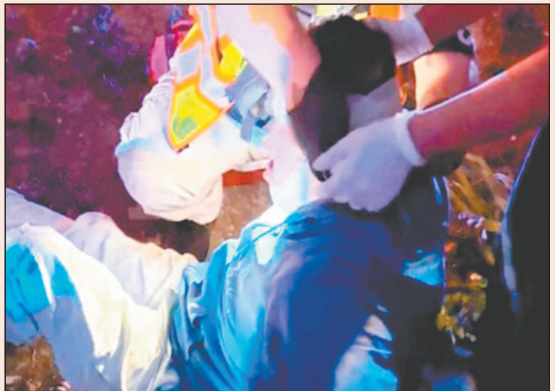
El hombre de 27 años tenía fuertes golpes en el cuello, por lo que fue llevado al IMSS.