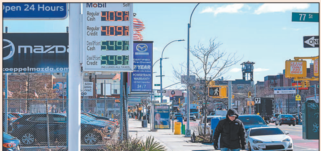
Estados Unidos, principal exportador de crudo, sufre el mayor alza de combustibles en décadas.

Los inversores enfrentaron un nuevo golpe inflacionario, apenas un día después de que la Reserva Federal señaló la guerra con Irán como un gran factor de incertidumbre. El Dow Jones comenzó con una baja de 90.3 puntos, el S&P 500 perdió un 0,63 por ciento y el Nasdaq cayó 1.27.