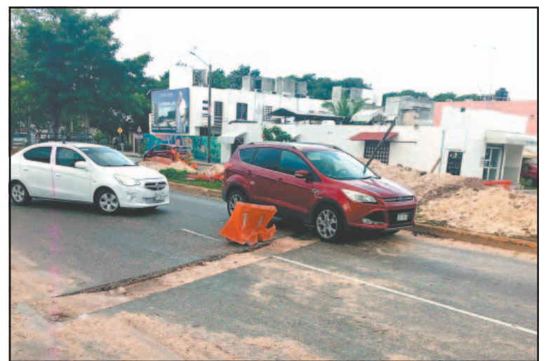
Habitantes de Villas Morelos 2 pidieron cerrar la zanja.

Otro usuario señaló que sufrió daños en su vehículo al no lograr detectar la zanja debido a la presencia de agua por las lluvias, lo que derivó