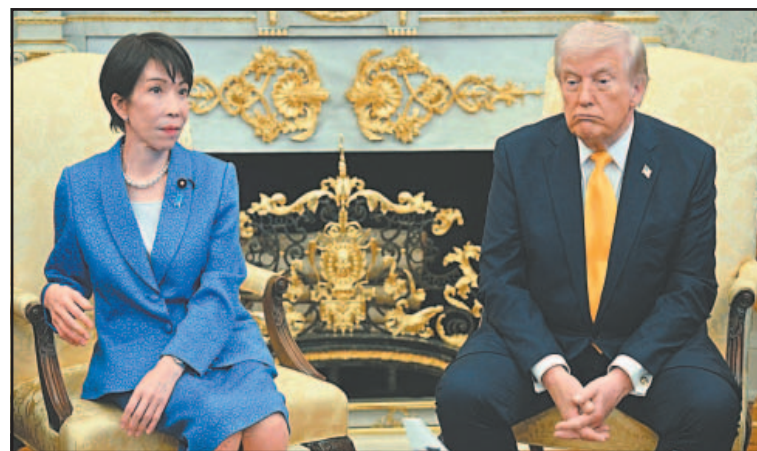
La alusión del mandatario desconcertó a la primera ministra.

Y para sorpresa lo que iba a soltar Trump después: “¿Quién conoce mejor las sorpresas que Japón?”, dijo, y agregó: “¿Por qué no me has hablado de Pearl Harbor?”. La sombra de una mueca pareció cruzar el rostro de la primera ministra