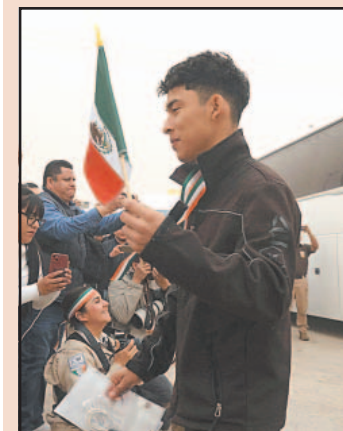
La Federación registró 189 mil 830 repatriaciones a México.