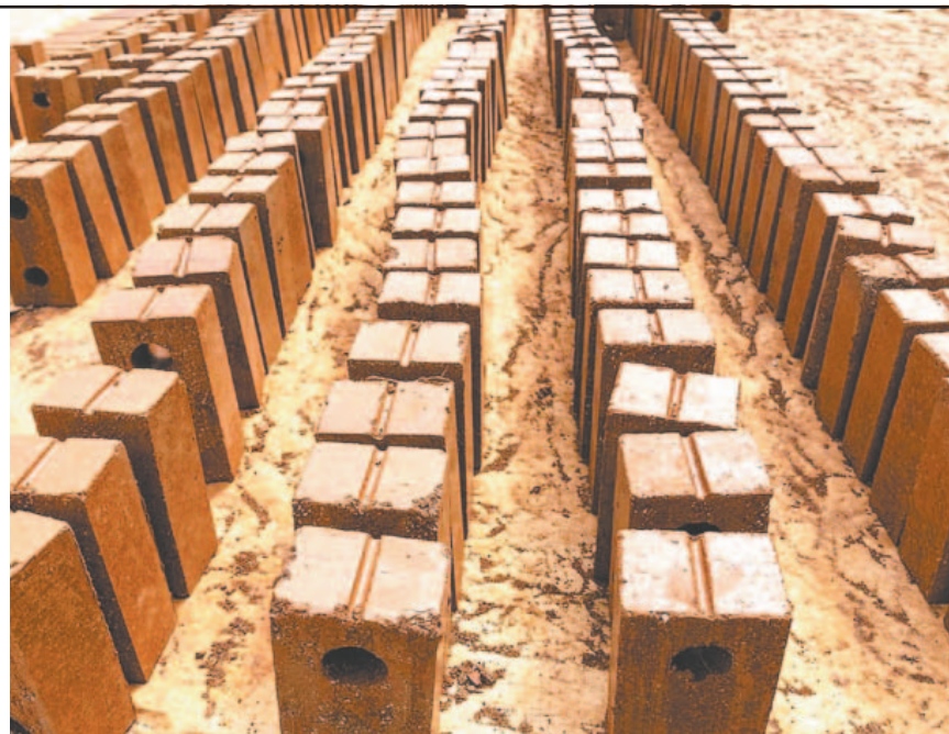
Un catedrático dijo que el empleo de la talofita que arriba en grandes volúmenes cada año permitiría reducir hasta un tercio los materiales tradicionales y es térmico.