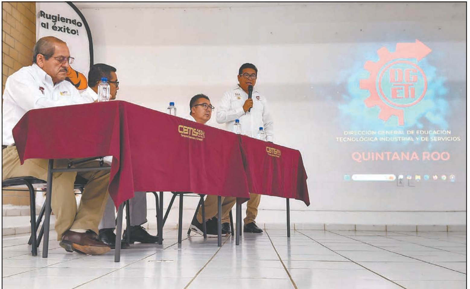
La Dirección General de Educación Tecnológica Industrial pretende consolidar a Quintana Roo como polo informático.