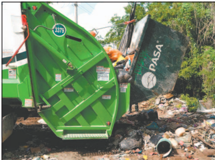
Altas temperaturas agravaron proliferación de insectos. (A. Blanco)