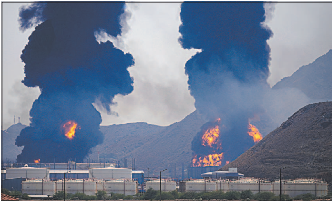
Campos energéticos destruidos en Oriente Medio: South Pars fue alcanzado y Ras Laffan sufrió daños.

Arabia Saudita advirtió que "se reserva el derecho" de responder militarmente a Irán y Qatar afirmó que el bombardeo de su infraestructura es una "prueba clara" de que la república islámica no sólo