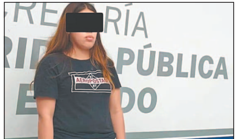
La madre del menor está entre los presuntos implicados.