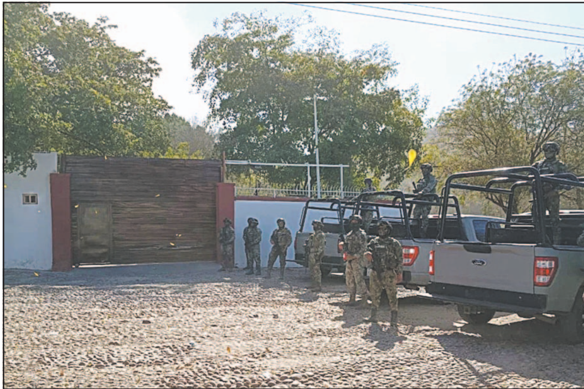
Elementos federales aseguraron un predio perteneciente a la familia de Ismael El Mayo Zambada.