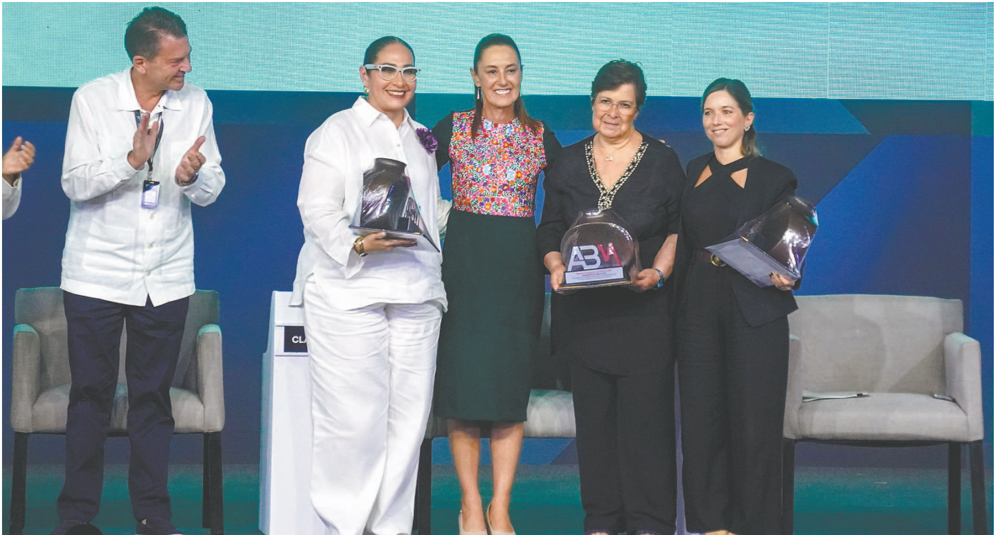
La Presidenta pidió corresponsabilidad al sistema financiero para impulsar la productividad, innovación y formalización en el sureste, donde el turismo y las Pymes son clave. (POR ESTO!)

☞ simplificar el proceso para realizar una transferencia bancaria, lo cual también busca combatir el rezago.