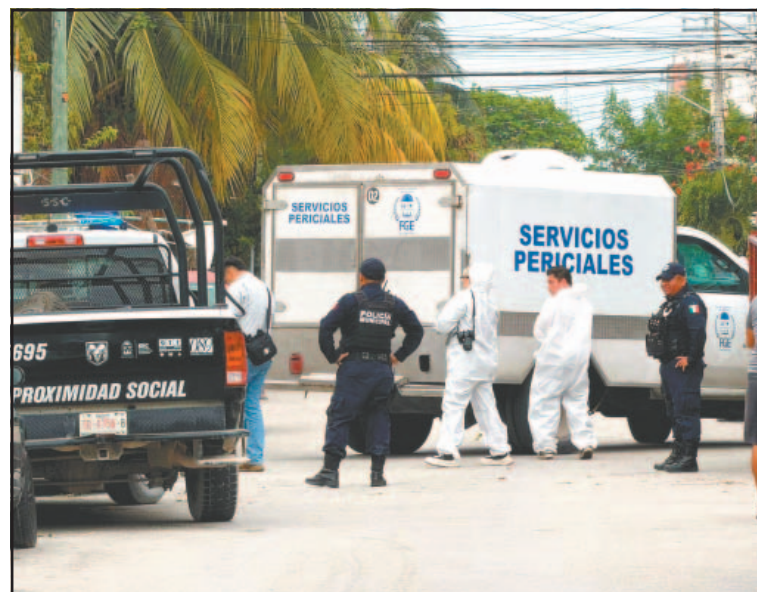
En la escena del crimen se encontró una pistola. (Leonardo Chacón)