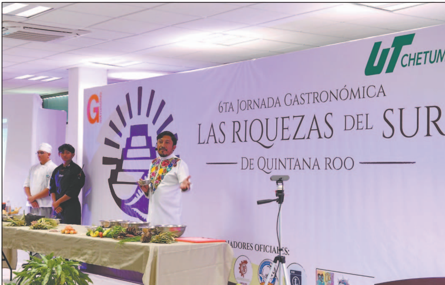
Alumnos que se preparan para ser chefs presentaron ponencias y abordaron temas como el mestizaje afrocaribeño en Othón P. Blanco.