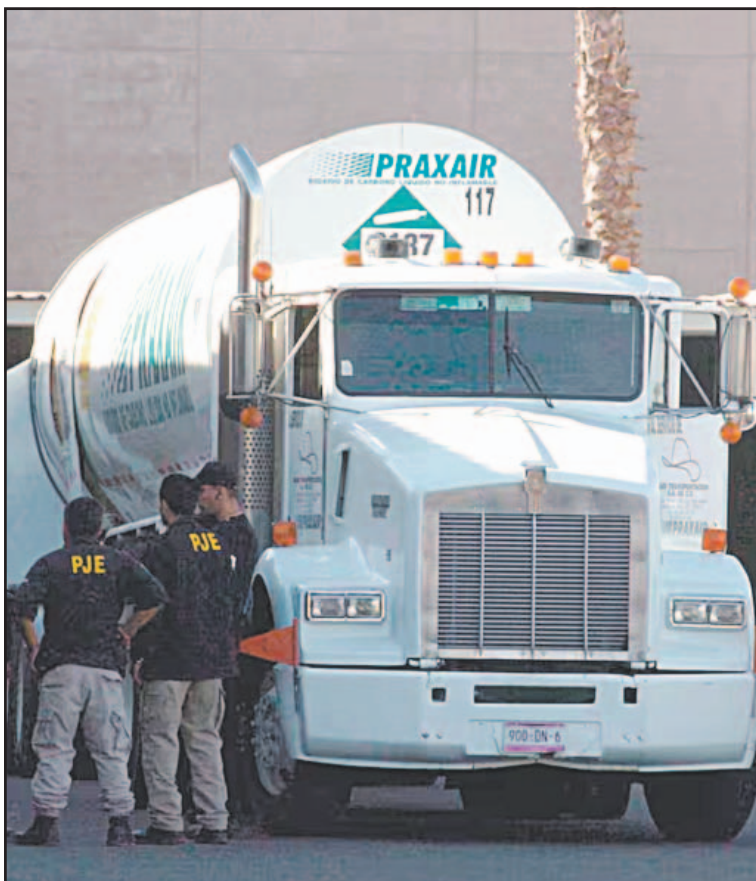
El órgano acusó prácticas anticompetitivas de las compañías.