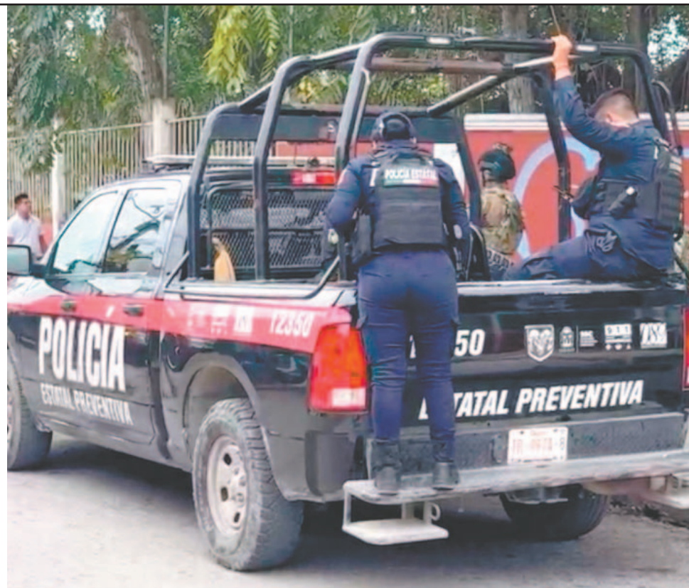
A las 12 del día, personal de vigilancia y docentes solicitaron la intervención de los cuerpos de emergencia, luego de un incidente con un estudiante que fue expulsado. (L. Chacón)