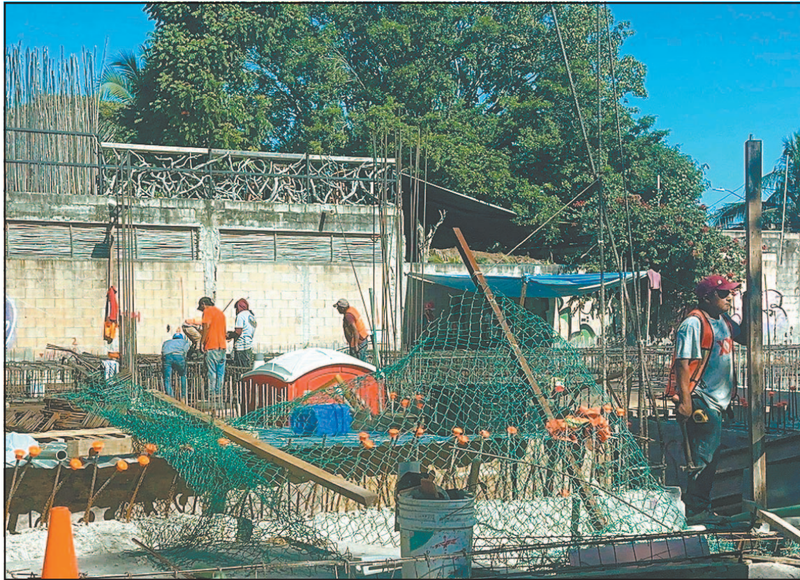
Se informó que la actividad de la construcción opera entre un 30 y 40% de su capacidad.

Uno de los factores que inciden en esta situación, señaló, consiste en que diversas empresas desarrolladoras optan por trabajar con equipos propios, trasladando desde otras regiones a su personal de confianza, lo que restringe la contratación de mano de obra local.