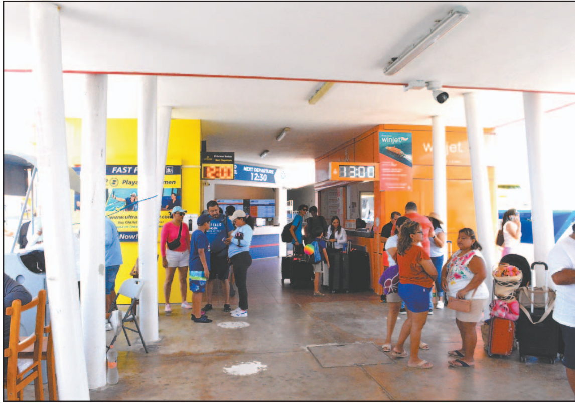
Comerciantes señalan que bares y restaurantes captarán mayor derrama económica. (Antonio Blanco)

México será sede de encuentros en ciudades como Ciudad de México, Guadalajara y Monterrey, pero empresarios locales prevén que parte del flujo se disperse hacia el Caribe mexicano, incluidos Cancún, Playa del Carmen y Cozumel. Prestadores de servicios señalaron que la visibilidad internacional del torneo permitirá promocionar la isla como destino ideal para descanso, buceo y expe-