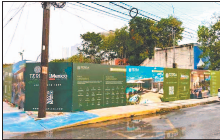
En septiembre del 2025, el predio fue inhabilitado. (POR ESTO!)