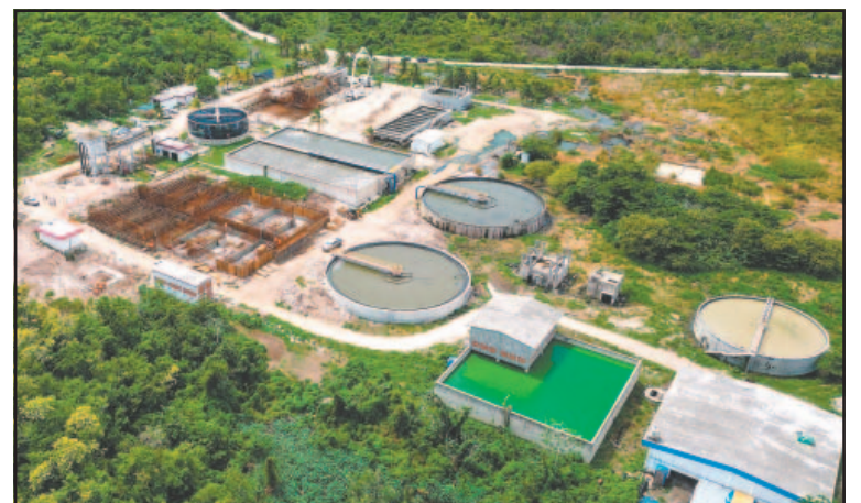
La inversión superó 113 millones para mejorar saneamiento. (A. Blanco)