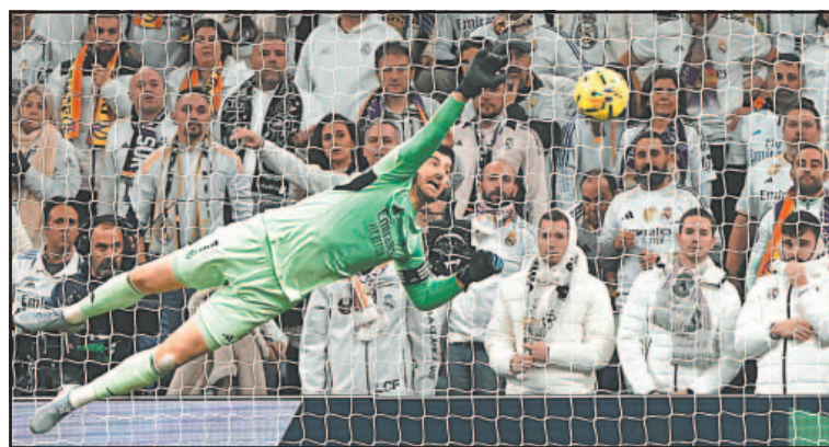
El guardameta Thibaut Courtois no estará en la portería ante México.