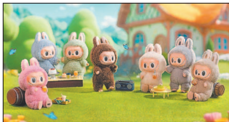
Sony Pictures prepara un largometraje junto con la empresa Pop Mart.