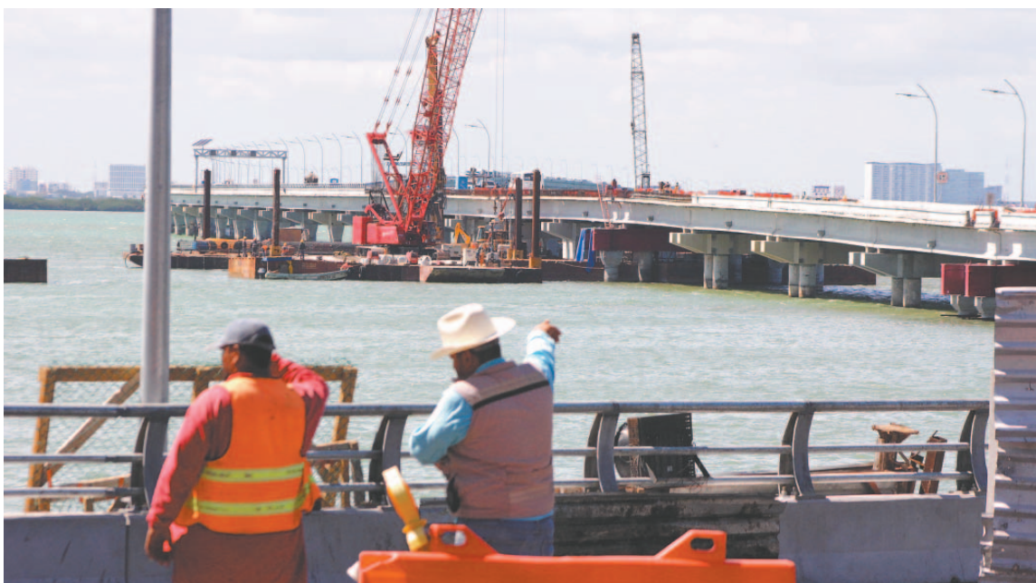
En abril, la Jefa del Ejecutivo prevé inaugurar la obra vial en la zona hotelera de Cancún. (E. Romero)

(Elisa Rodríguez / José Pinto Casarrubias)