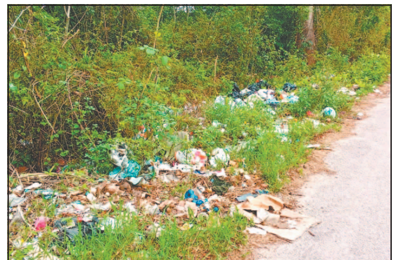
El principal vertedero se ubicó en un predio de Puerto Morelos. (E. Cauch)

El origen del problema, según el representante, radica en la falta de educación ambiental. La disposición indiscriminada de residuos por habitantes y visitantes evi-