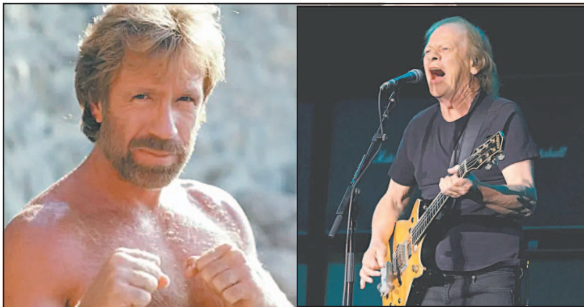
Trascendió que ambos famosos se encuentran estables tras recibir atención de los especialistas.

Para comprender la magnitud de la noticia, es necesario profundizar en la trayectoria de un hombre que redefinió el cine de acción. De acuerdo con la base de datos especializada IMDb y registros históricos de la