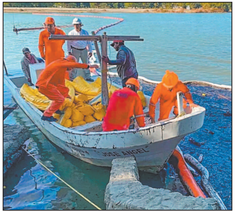
En Mata de Uva y El Zapote se recolectaron 80 kg de químicos.