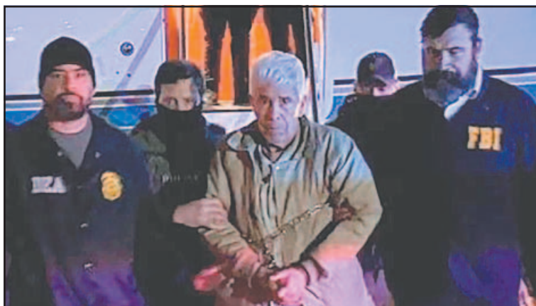
El capo mexicano puede llegar a un acuerdo con EE.UU.