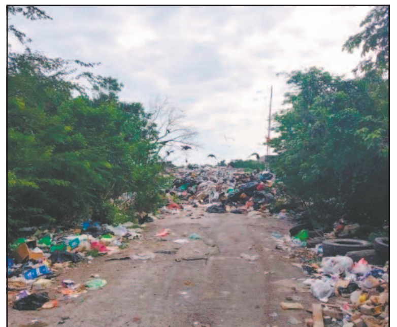
Dijeron funcionarios que la opción es comprar terrenos privados.

Ante ello, la opción más viable sería adquirir predios privados, aunque implicaría procesos complejos y costos elevados, especialmente en Mahahual. También se analiza, como en otros municipios como Bacalar, la posibilidad de ampliar o sanear los espacios ac-