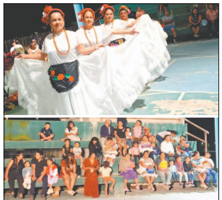
En Margarita Maza de Juárez realizaron bailables.