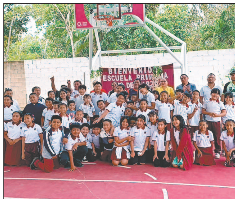
Hubo actividades civico-deportivas con cuatro escuelas invitadas. (J. Chan)