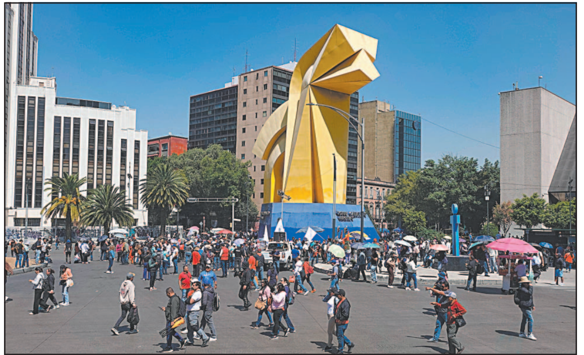
Los docentes disidentes advirtieron que, de no cumplirse sus demandas, boicotearán el Mundial de fútbol.

Ayer, en Morelia, Michoacán, como parte del segundo día de movilizaciones, integrantes de la Sección 18 de la CNTE tomaron los