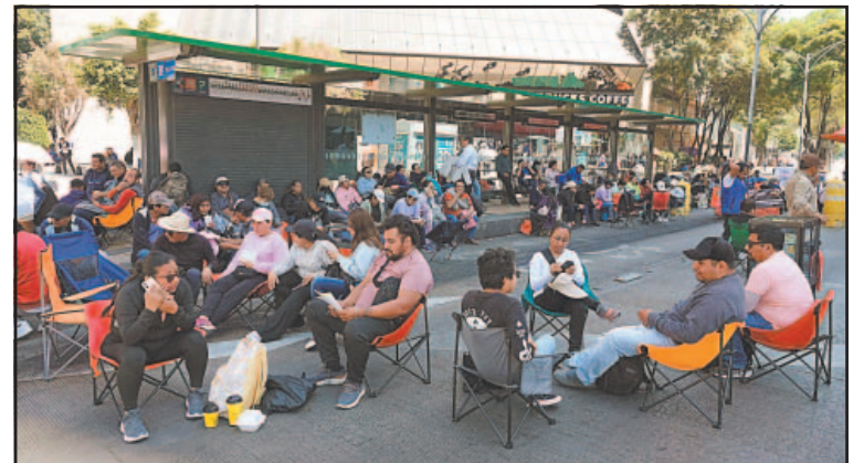
La Coordinadora indicó que se reorganizarán en sus estados.