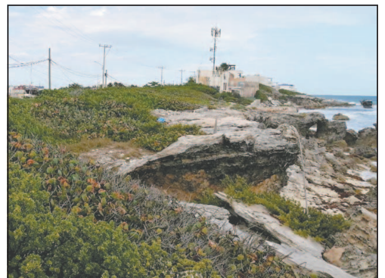
Promoviente presentó su plan y espera aval de la Semarnat.