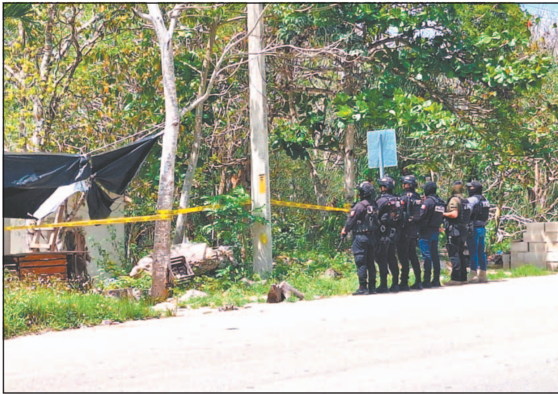
Los hechos se registraron cerca del mediodía en el entronque de la ciudad con la vía a Valladolid. (A. Kiin)

Al concluir la inspección, los oficiales colocaron sellos para resguardar la zona, toda vez que las indagatorias continúan como parte de la integración de la carpeta de investigación. El caso perfila un posible comercio de sustancias tóxicas, aunque los detalles se conocerán una vez