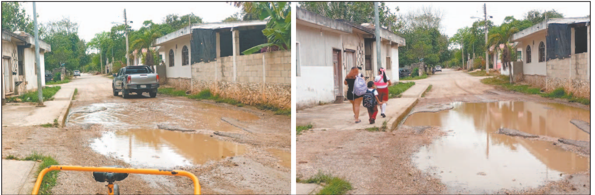
Pobladores consideraron que las obras deben realizarse antes que lleguen las lluvias para evitar que los estudiantes caminen entre lodazales y charcos. (Enrique Cauch)