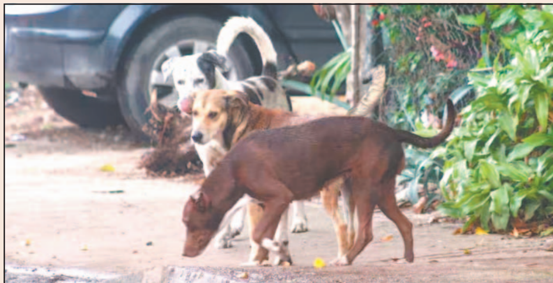
Acusó que el envenenamiento que se registra en Q. Roo afecta el equilibrio ecológico. (POR ESTO!)