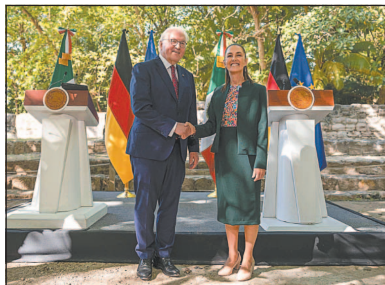
Los líderes de México y Alemania acordaron estrechar cooperación.