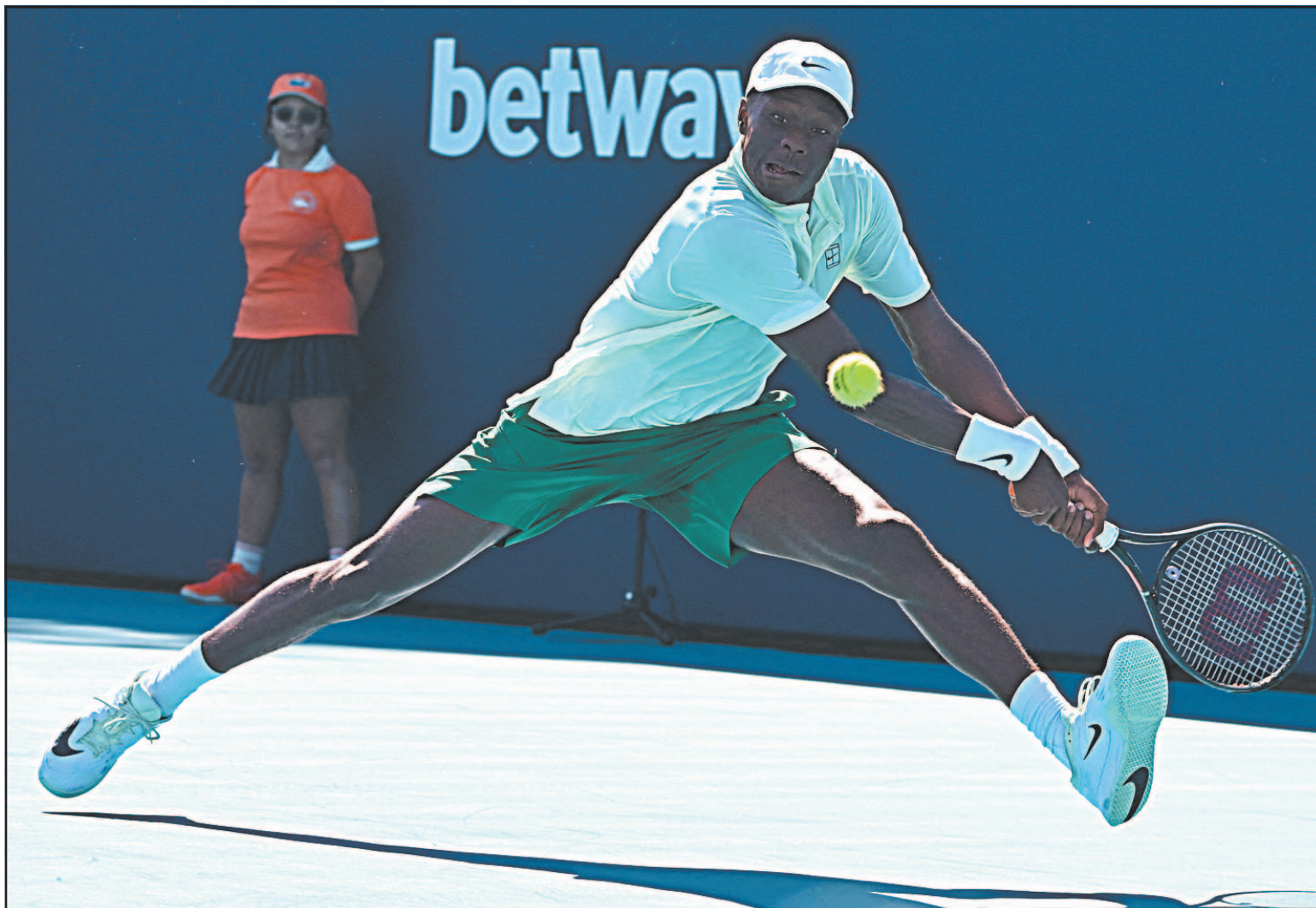
Para encontrar a un vencedor más precoz en un torneo de categoría Masters 1000 hay que rebobinar hasta Rafael Nadal en 2003, en Hamburgo.