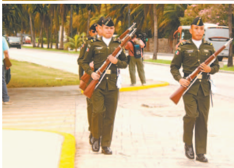
Amplio despliegue policial hubo en el área de playas en Cancún.

sido la conducción responsable de las finanzas públicas, que ha permitido mantener la deuda gubernamental en niveles considerados sostenibles.