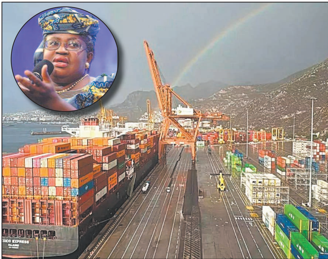
Okonjo-Iweala advirtió sobre presiones en los costos para los consumidores y las empresas.

Los economistas de la organización revisaron sus proyecciones y plantean dos escenarios princi-