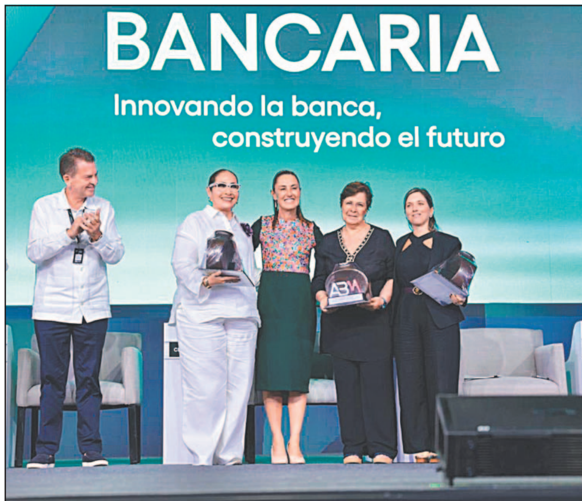
Ante dirigentes de la banca mexicana, la titular del Ejecutivo destacó la fortaleza del peso.