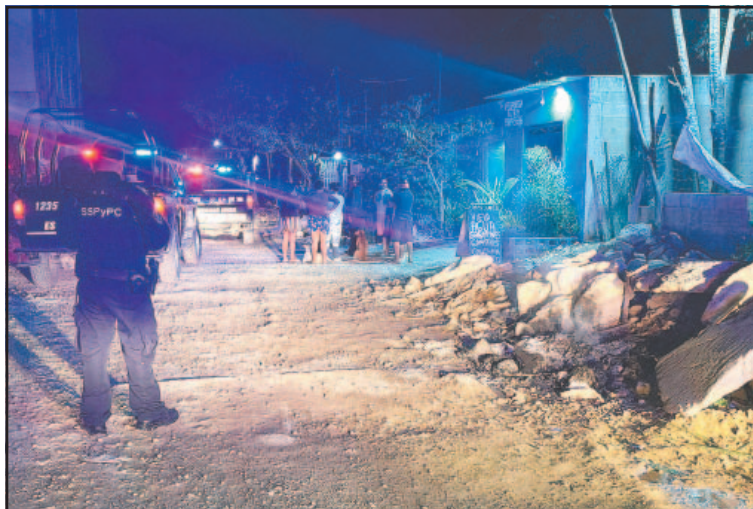
La agresión armada fue cerca de base policial. (Aquiles Bee Cituk)