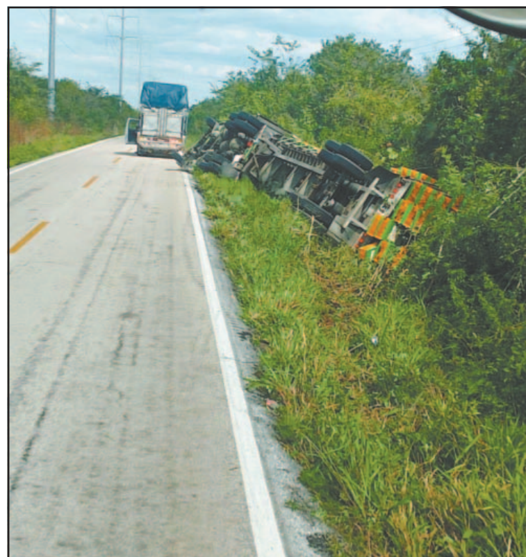
El conductor resultó ileso y logró salir por si mismo de la unidad.