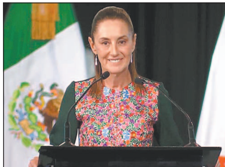
La Jefa de Estado subrayó la reducción de la pobreza y la desigualdad.