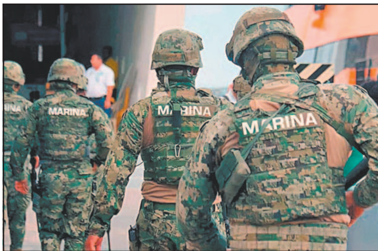
Integrantes de Semar participarán en un entrenamiento en Mississippi.

La embajada de Estados Unidos en México informó que la Oficina de Aduanas y Protección Fronteriza (CBP, en inglés) capacitó a autoridades mexicanas en la detección y