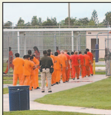
El joven falleció bajo custodia.

“Se procederá con las gestiones diplomáticas pertinentes para exhortar activamente al Gobierno federal estadounidense a atender las condiciones que facilitan este tipo de sucesos lamentables. Se