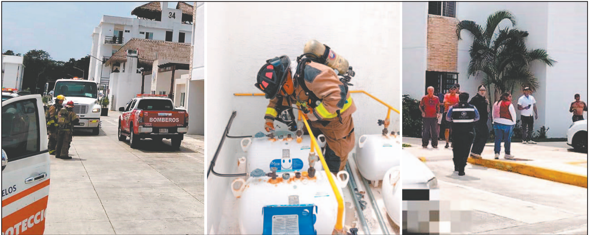
Elementos de Protección Civil, así como de Bomberos acudieron al sitio y liberaron de forma segura el combustible acumulado; desconocen las causas del hecho.