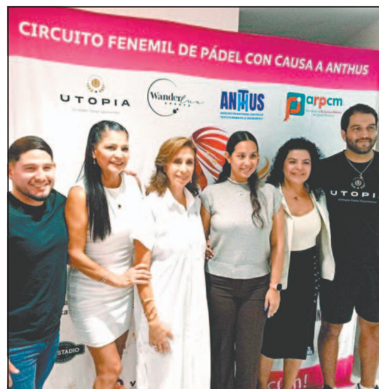
La competencia se realizará del 23 al 26 de abril en esta ciudad. (POR ESTO!)