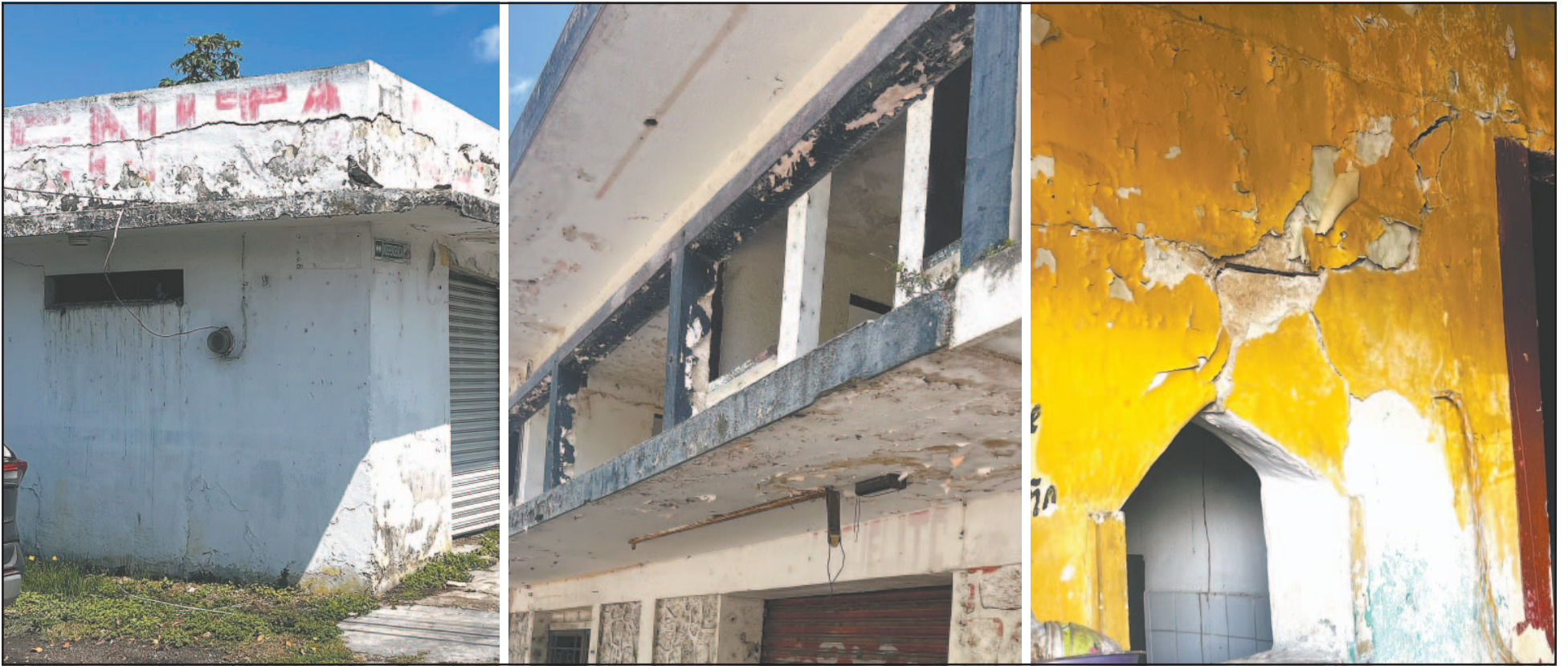
Habitantes del Barrio Mágico exigieron a las autoridades que localice a los propietarios y los obligue a repararlos o derribarlos para evitar un accidente de gravedad.