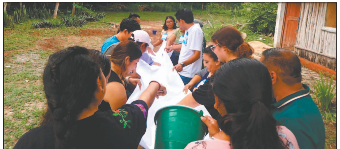
Entre las cooperativas que confirmaron su asistencia está “Xyaat”, de Señor.

Comunidades gestionan la generación y atención de la oferta del destino en la que integran diversidad de gastronomía, así como costumbres de la región.