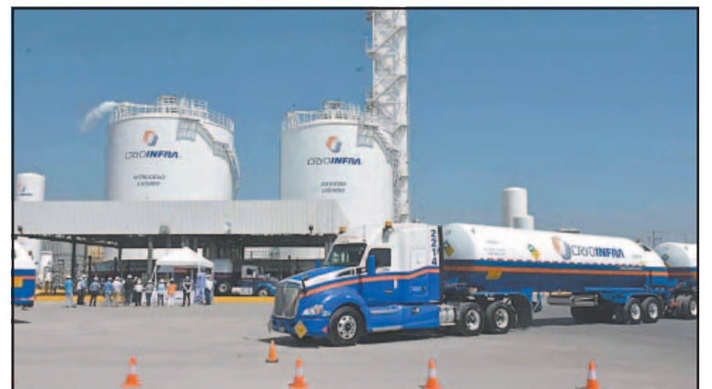
Las empresas fueron exhortadas a eliminar contratos de exclusividad.