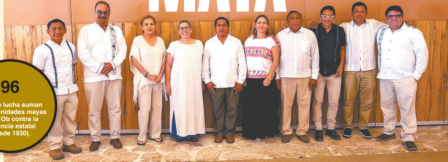
Los integrantes de la actual dirigencia del organismo, junto a políticos y funcionarios de Quintana Roo han sido señalados por los representantes de los pueblos originarios de usurpar rangos militares y religiosos que no les corresponden, según la tradición.