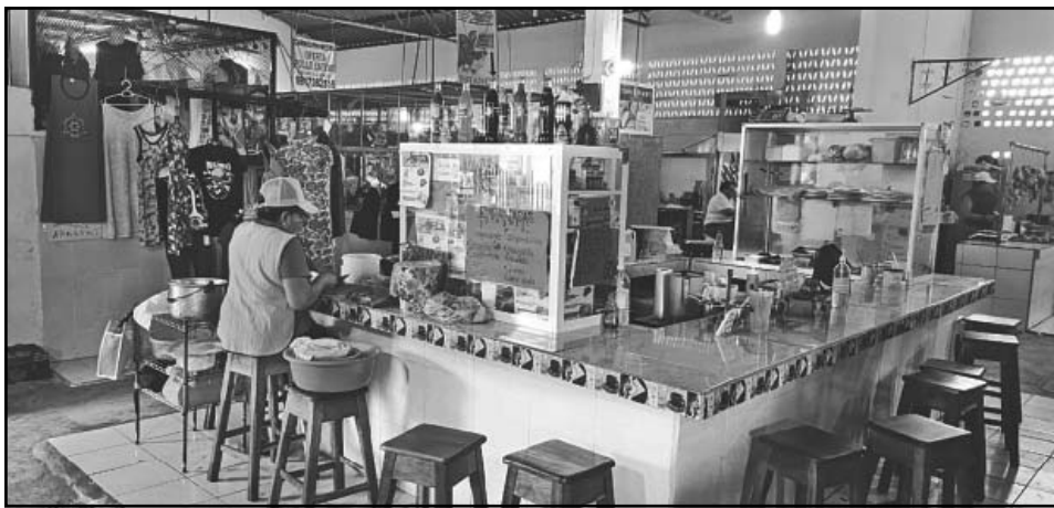
De las quejas más sentidas es que deben pagar 100 pesos por el cuarto frío. (A. Pech)