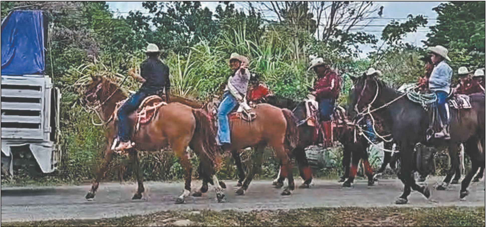
El ejido Adolfo López Mateos celebra su aniversario y los jinetes de la zona organizaron la clásica marcha a caballo como parte de las festividades anuales. (Pedro Díaz)