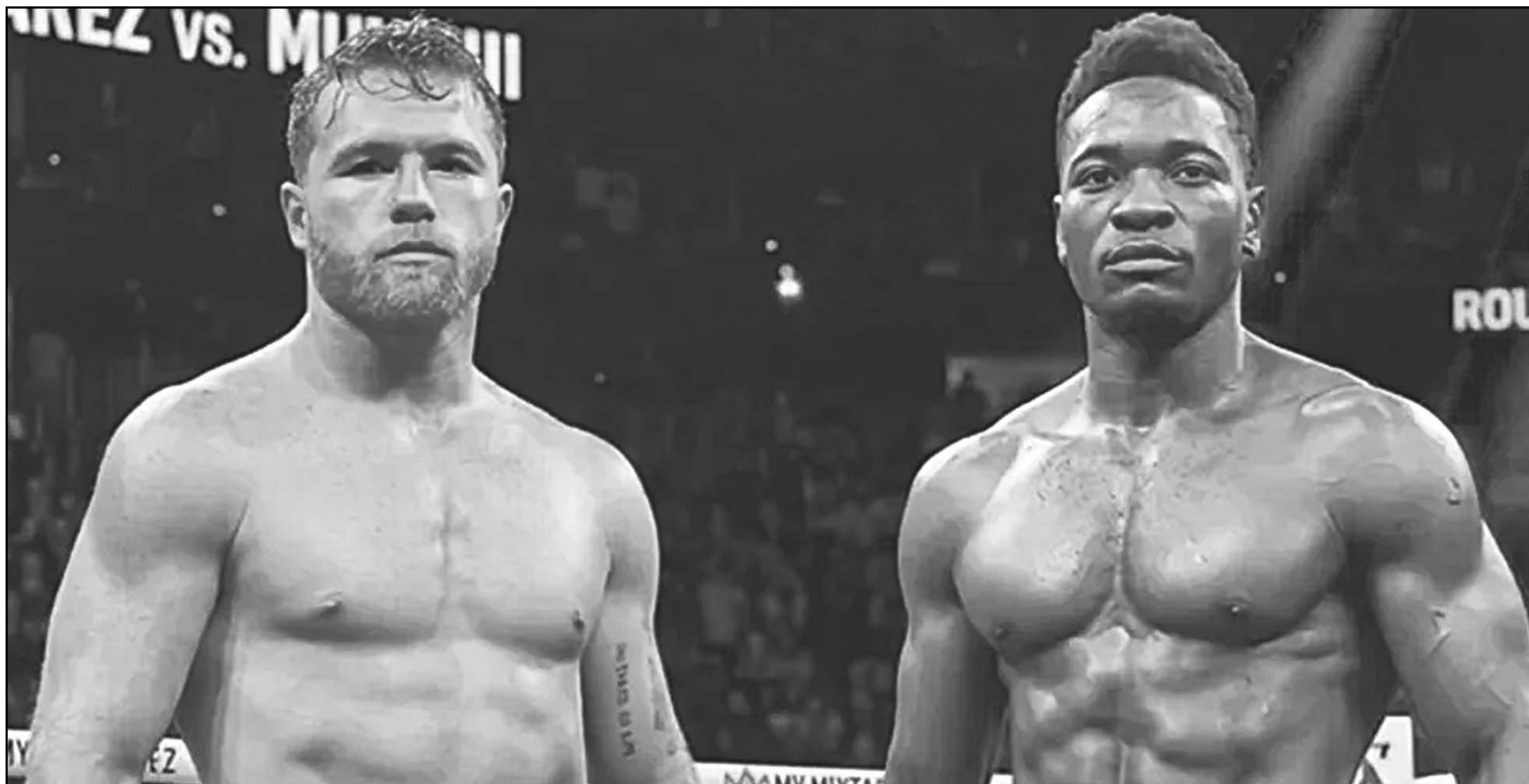
La última pelea del boxeador mexicano fue en 2025, cuando perdió ante Terence Crawford; su nuevo rival llega invicto con récord de 29 triunfos (24 por la vía rápida) y un empate.