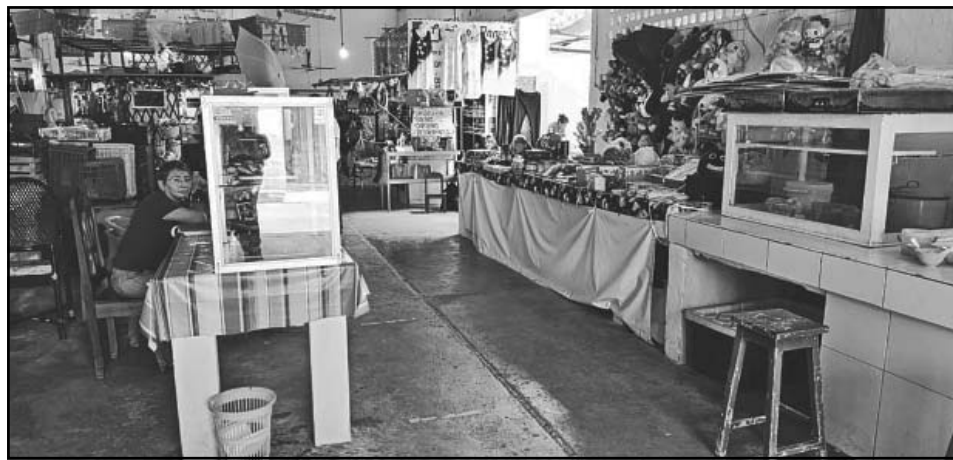
A pesar de que contribuyen al municipio, no reciben la atención que requieren. (A. Pech)