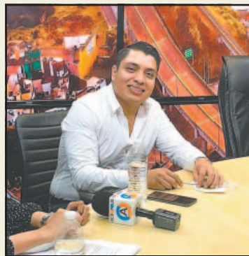
Ramsés Aldebarán fue plagiado.

Los hechos sucedieron alrededor de las 20:45 horas, cuando sujetos desconocidos ingresaron a su establecimiento, ubicado en la