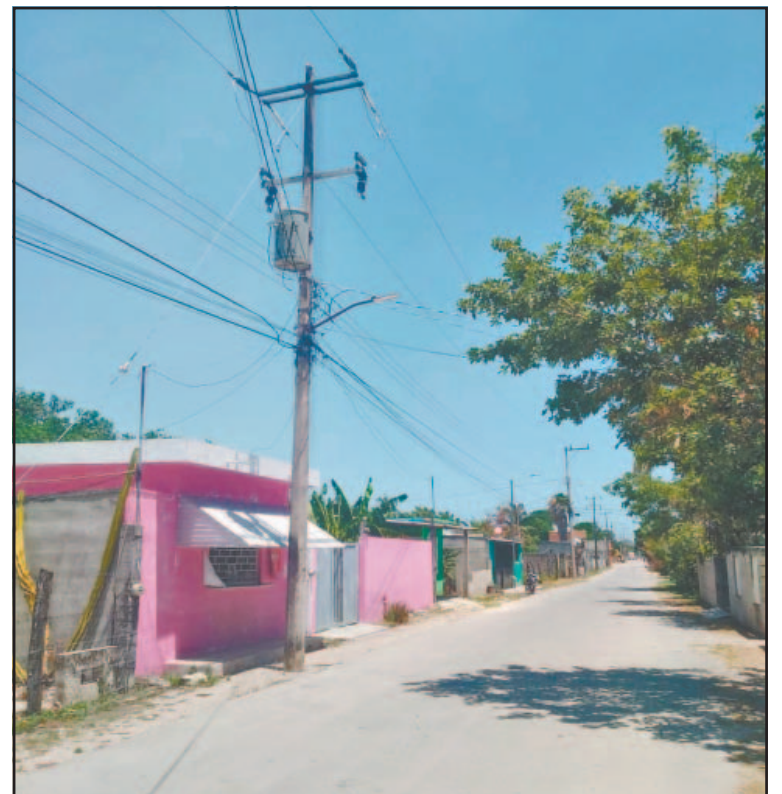
Los reclamos debido a los apagones por fin tuvieron eco. (Pedro Díaz)