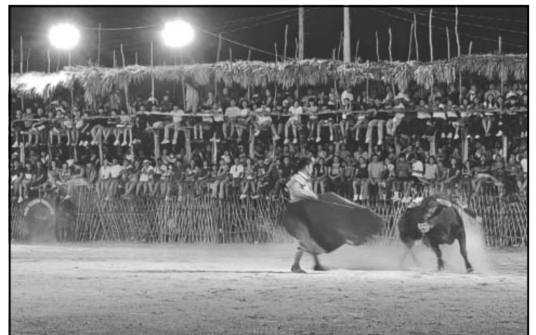
El diestro no logró orejas ni rabos ante sus astados. (Amado Caamal)