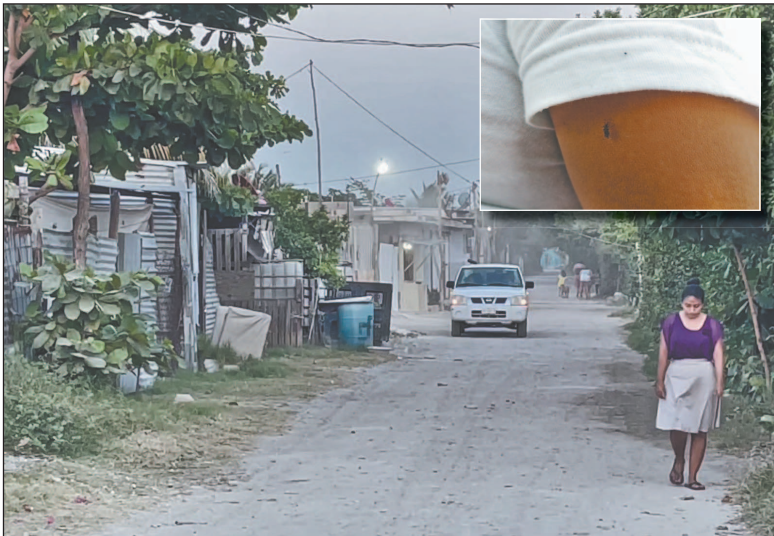
Una simple picadura de mosquito puede desarrollar la enfermedad en gente vulnerable, más en zonas de alta vegetación. (Perla Prado)

El funcionario señaló que, cada que se detecta un caso sospechoso o probable, personal del área de vectores realiza acciones de control alrededor del domicilio del paciente, además de monito-