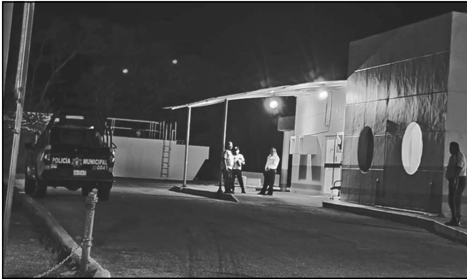
La víctima fue llevada de urgencia al Hospital del IMSS, donde permanece.