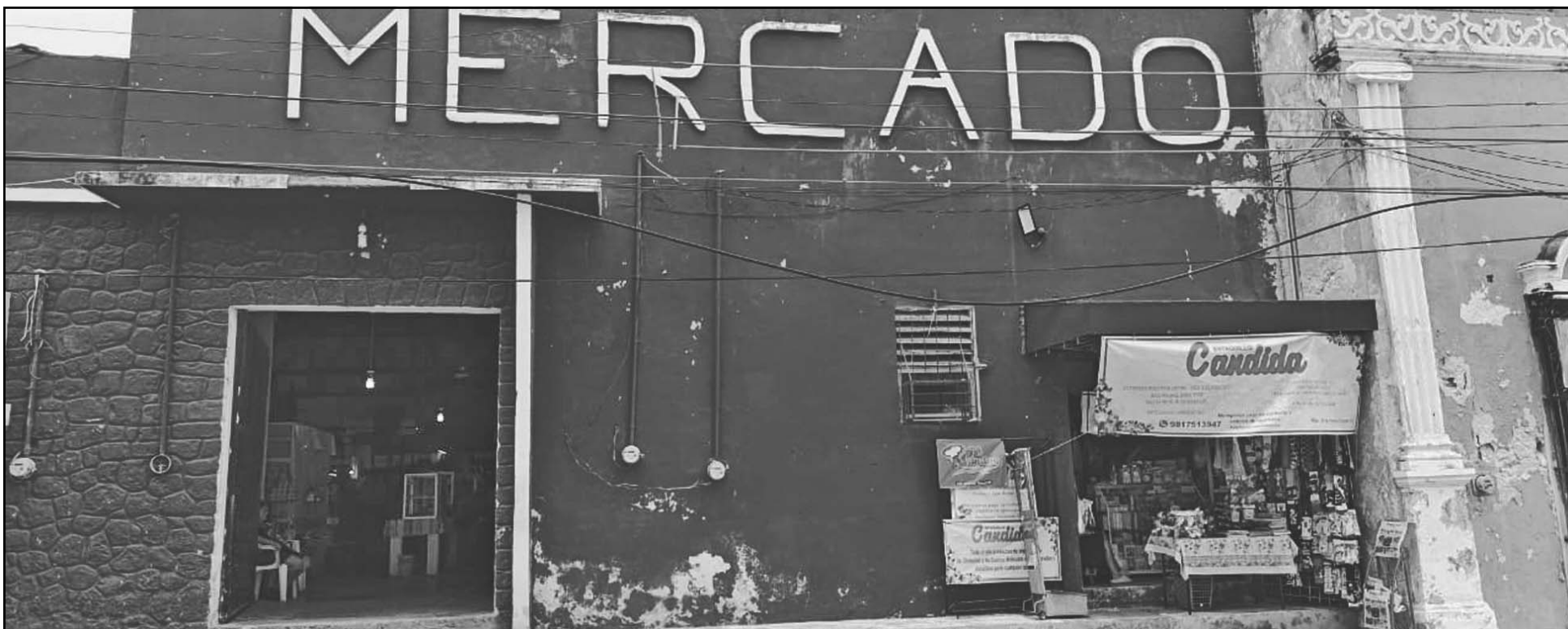
El edificio presenta evidente deterioro, con filtraciones en el techo, pisos que necesitan cambio y el abasto de corriente es deficiente e incluso representa un riesgo. (A. Pech)

La central de San Francisco apenas sobrevive por los altos impuestos y las fugas eléctricas