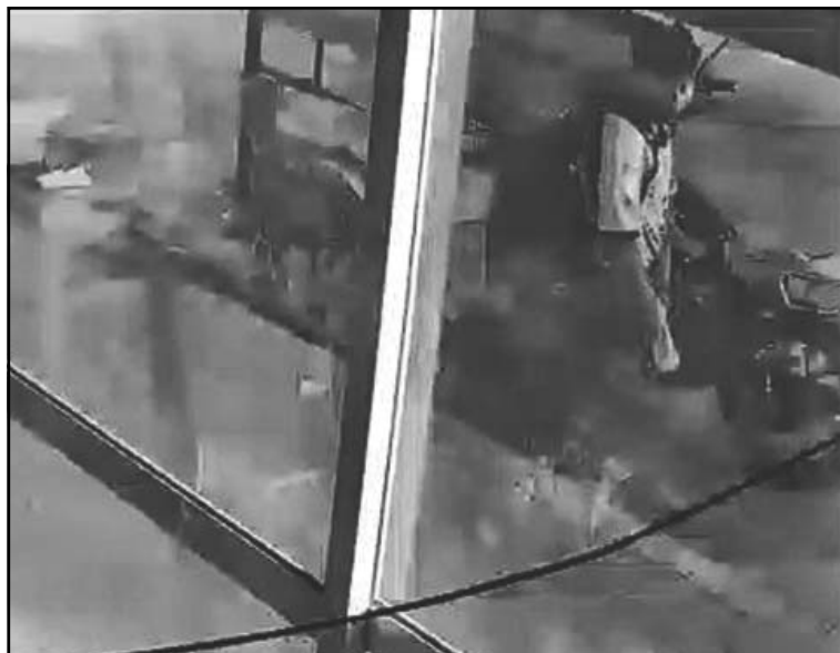
El audaz “amante de lo ajeno” ya ha sido identificado. (E. Caamal)