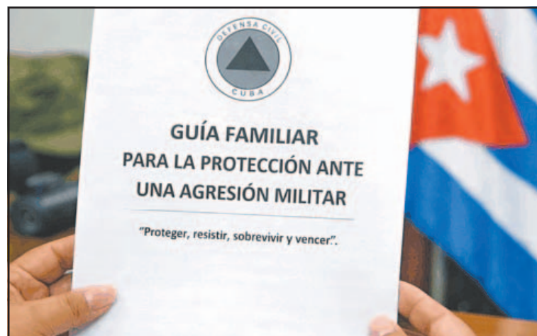
El documento incluye instrucciones avaladas por la Defensa Civil.

La difusión, más bien discreta, del documento se produce cuando Cuba, de 9.6 millones de habitantes, atraviesa una crisis socioeconómica sin precedentes. La situación de la red eléctrica también es crítica, ya que el país se ha quedado sin reservas de diésel ni de fueloil, según reconocieron altos funcionarios de la Isla. Los repetidos apagones han provocado en los últimos días