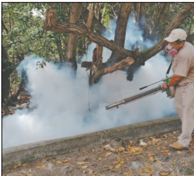
Los monitoreos incluyen control larvario y ovitrampas.