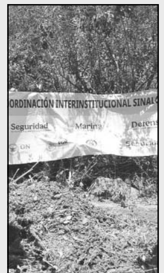
Las hierbas fueron halladas en Lago Walamito .