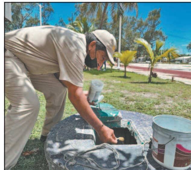
El exhorto es a mantener tapados recipientes con agua.