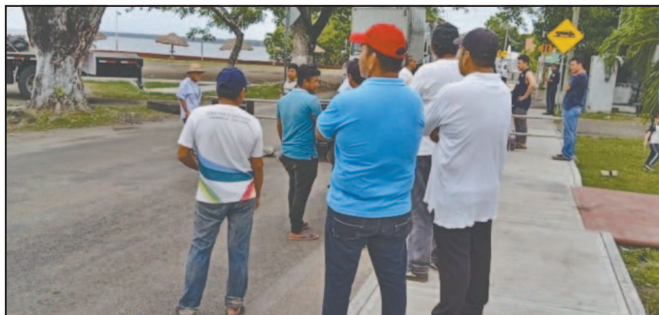
Los atastecos no aceptarán que falten al compromiso que les hicieron. (Perla Prado)