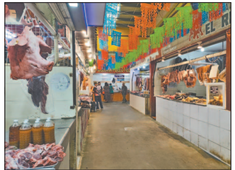
El centro de abasto requiere que se le dé urgente mantenimiento.