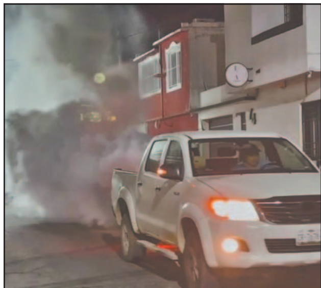
La fumigación se refuerza por donde vive el paciente.