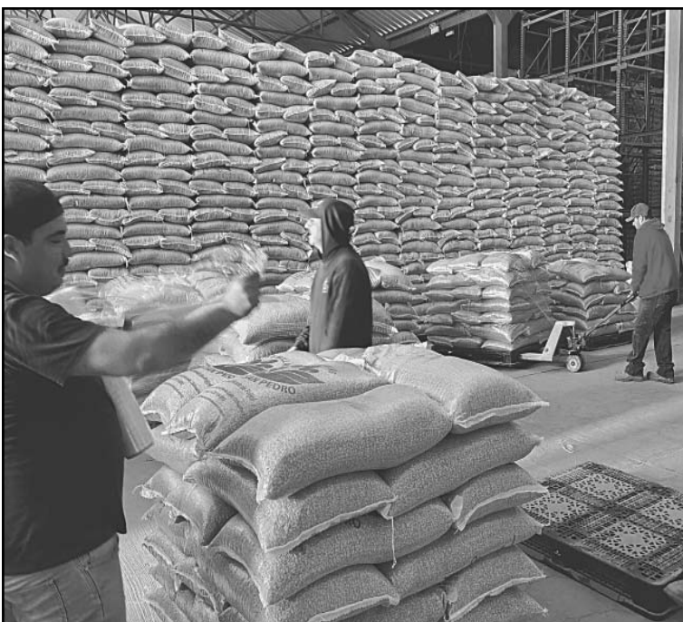
Se impulsan planes como Semillas para el Bienestar . (POR ESTO!)

CIUDAD DE MÉXICO.- La Secretaría de Agricultura y Desarrollo Rural (Agricultura) informó que contempla una inversión de 17 mil 266 millones de pesos para garantizar el bienestar de las familias rurales y mejorar las condiciones de producción en Zacatecas.