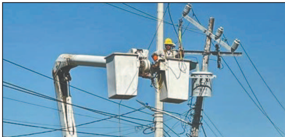
Las numerosas fallas en el servicio eléctrico incrementan el malestar social.