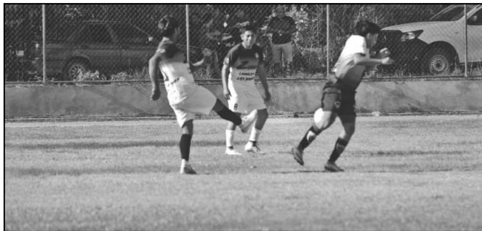
Este domingo jugarán con un rival con muchos años de experiencia. (Mauriel Koh)