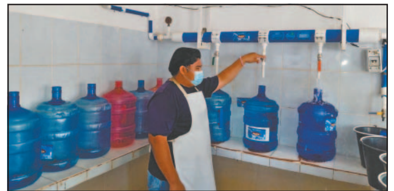
Las altas temperaturas llegaron más temprano en el año. (M. Koh)