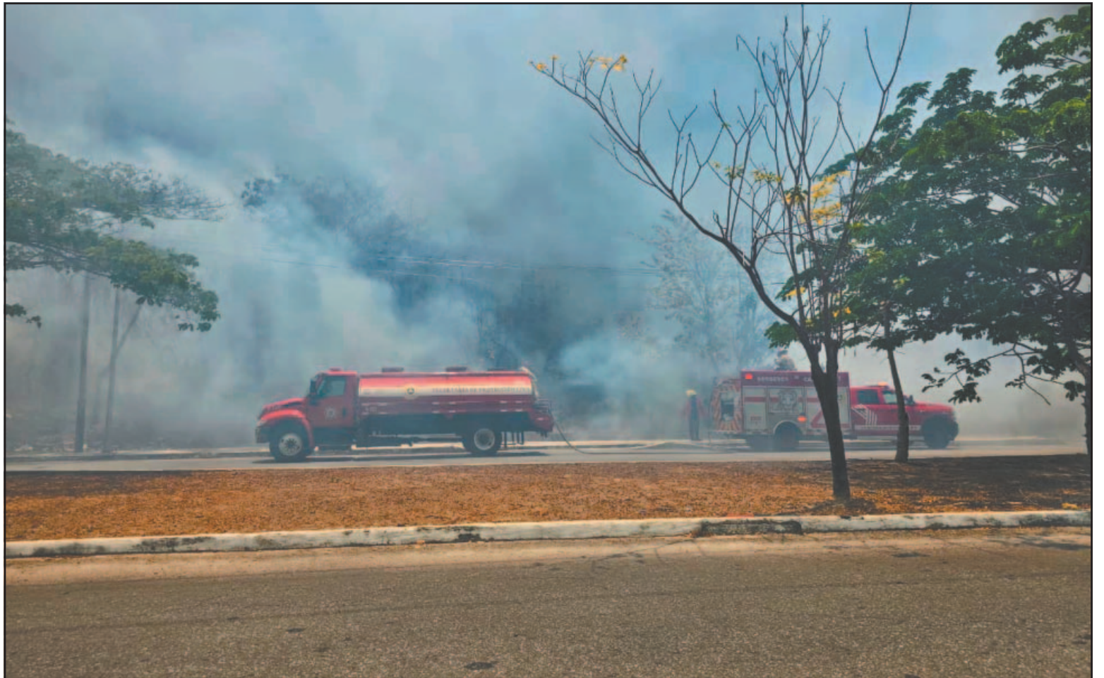
Las llamas devastaron todo a su paso y llegaron a un grado de expansión tal que el tránsito vehicular tuvo que suspenderse.