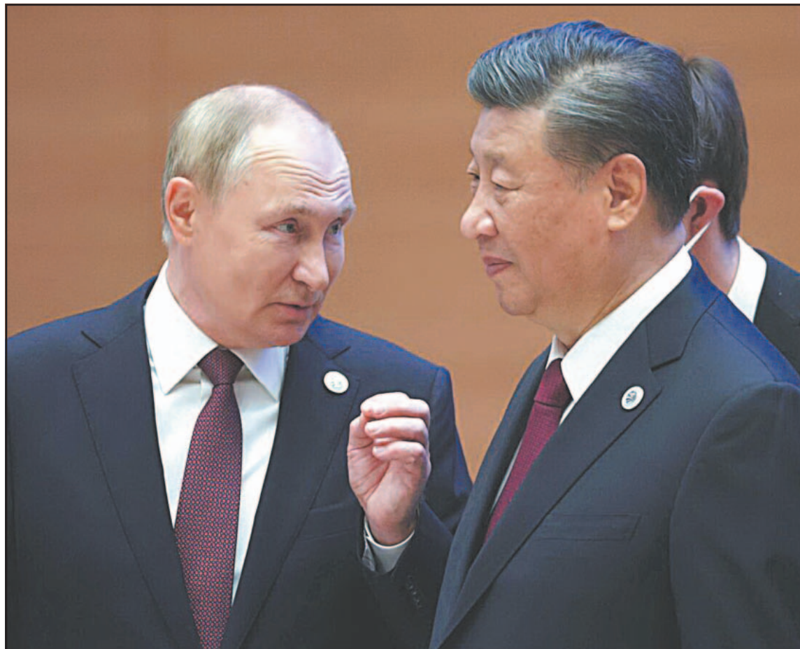
El nuevo encuentro entre ambos estadistas incluirá el tema Rusia-Ucrania como trasfondo.

China llama a negociaciones de paz y al respeto de la integridad