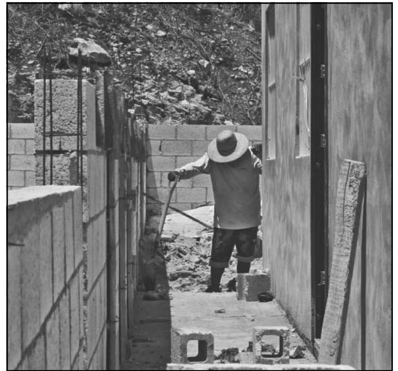
Empiezan a trabajar desde las cinco de la mañana, así no se exponen.