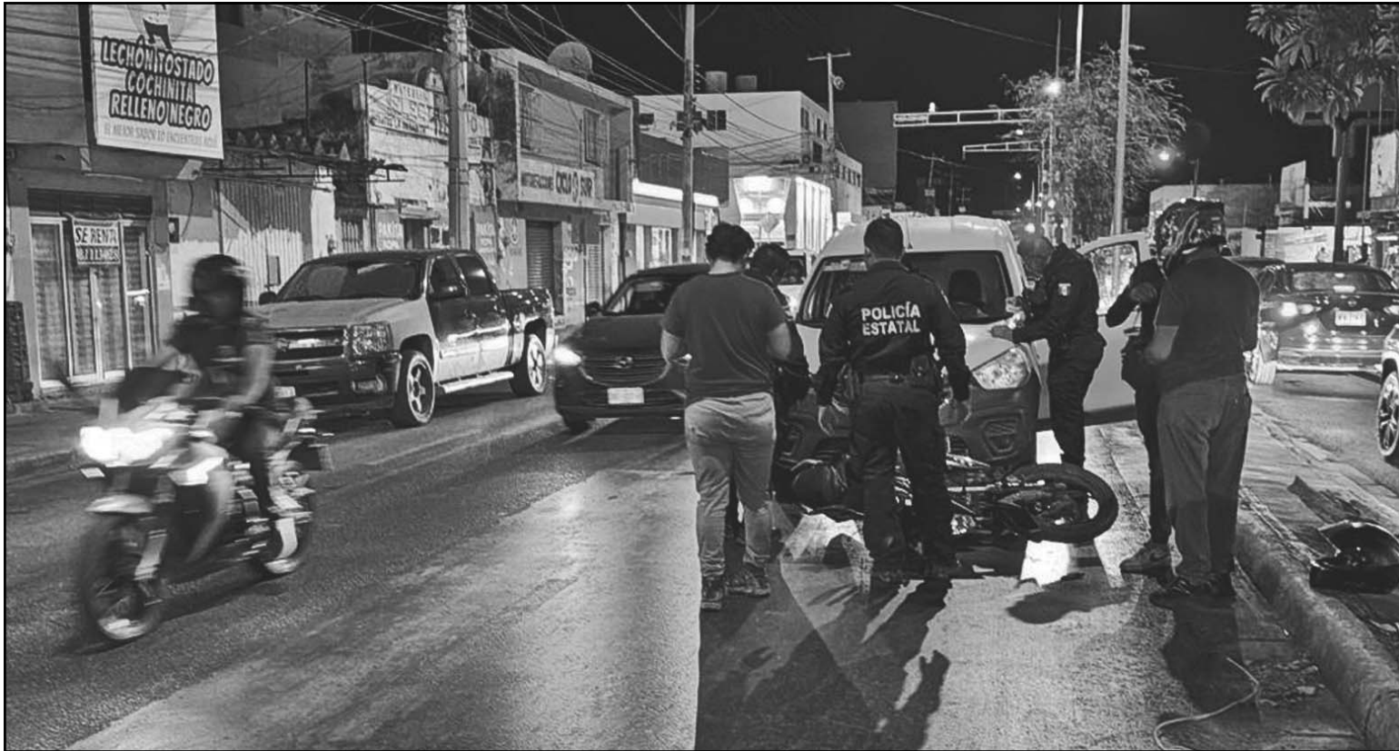
El conductor de la moto se quejaba de dolores, pero se negó a recibir atención médica, pues alegó que aún podía moverse. (Dismar H.)

Chofer de camioneta dedicada al reparto de paquetería se distrae con el celular y provoca siniestro