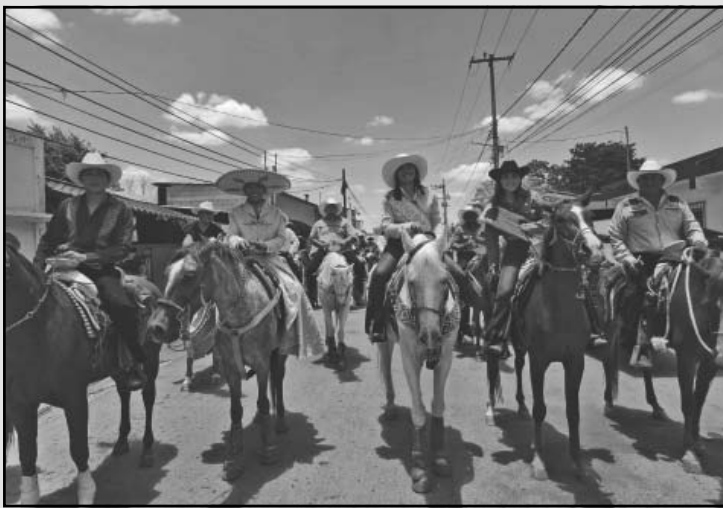
La embajadora de los ganaderos encabezó el desfile. (A. Caamal)