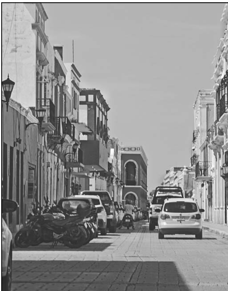
Lo que se busca es eliminar los registros de las calles. (Lucio Blanco)