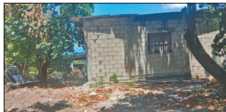
Todos descansaban cuando les entraron a robar. (Joaquín Guevara)