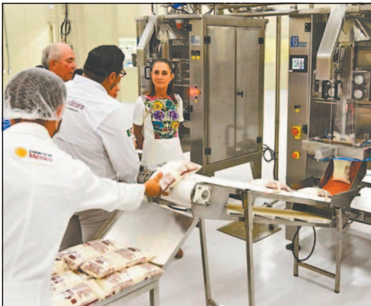
El Gobierno Federal ampliará los subsidios paulatinamente.