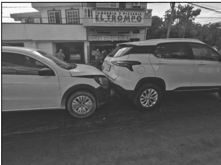
No se reportaron personas lesionadas luego del accidente. (A. Pech)

Un hecho vial entre dos camionetas obstruyó momentáneamente el tránsito sobre la avenida Jaina en la unidad habitacional Plan Chac, luego de que el conductor de una Volkswagen Saveiro no respetó su distancia correspondiente y la consecuencia fue que le "dio un beso" a la parte trasera de una Chevrolet Trax.