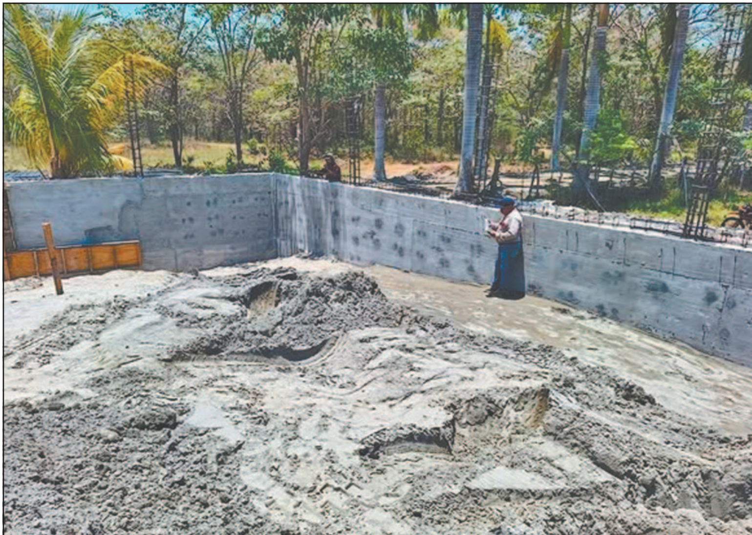
Los habitantes de la región no ven claridad en el proyecto prometido y el rumor de su inviabilidad los tiene en estado de alerta. (Especial)

Esta situación incluso ha provocado advertencias de un posible bloqueo carretero, aunque la