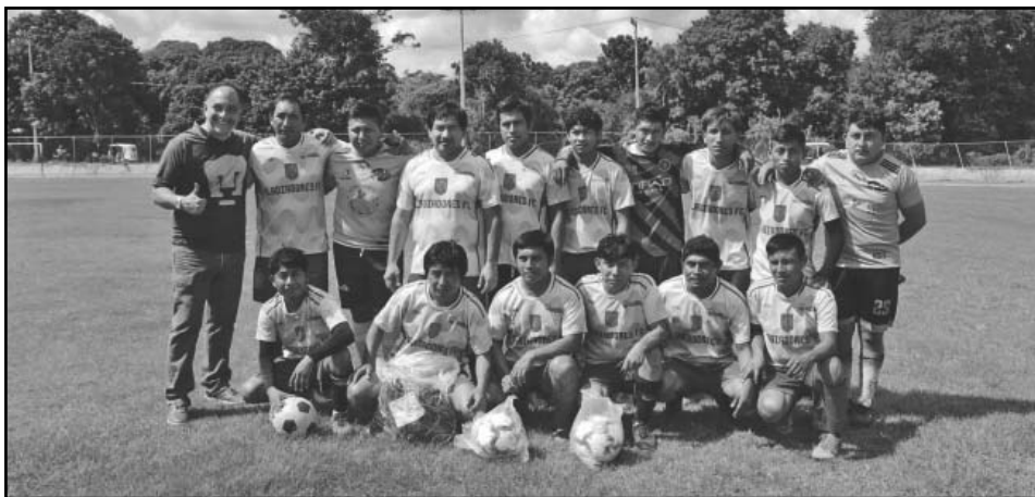
El equipo está preparado para avanzar a la siguiente fase del torneo. (Mauriel Koh)