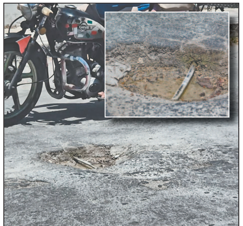
El paso constante de vehículos ya arruinó la manguera. (Jorge May)