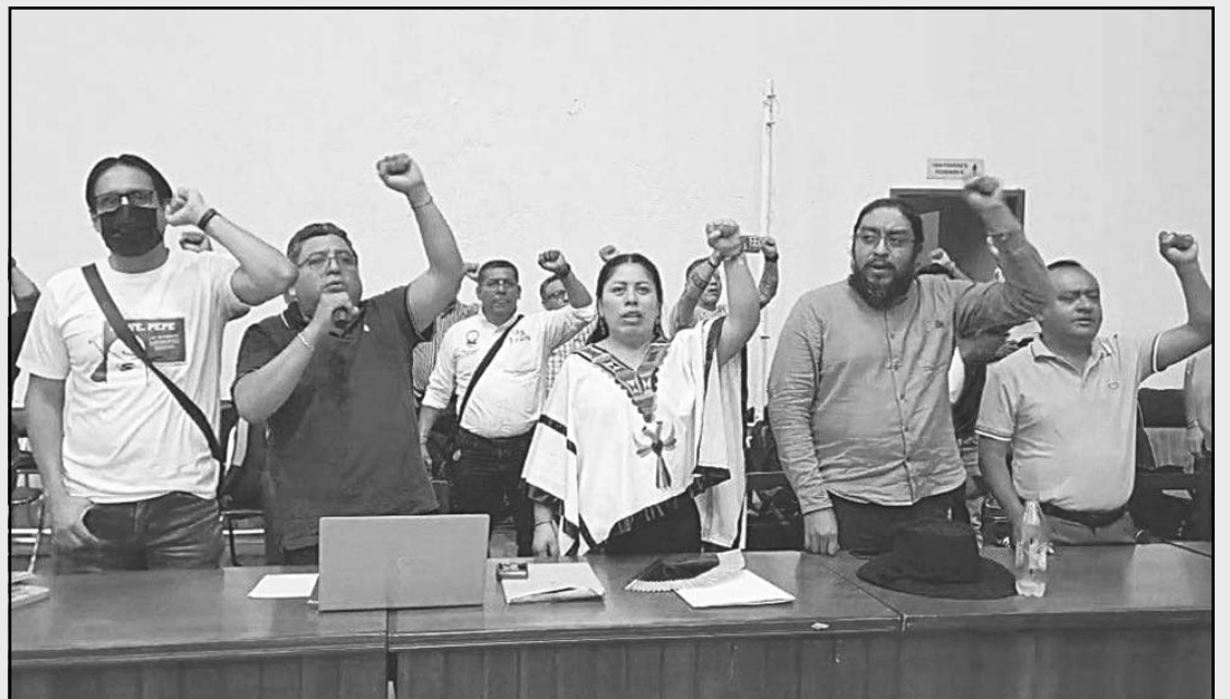
Los docentes exigen la abrogación de la Ley del Issste del 2007 y de reformas educativas. (POR ESTO!)