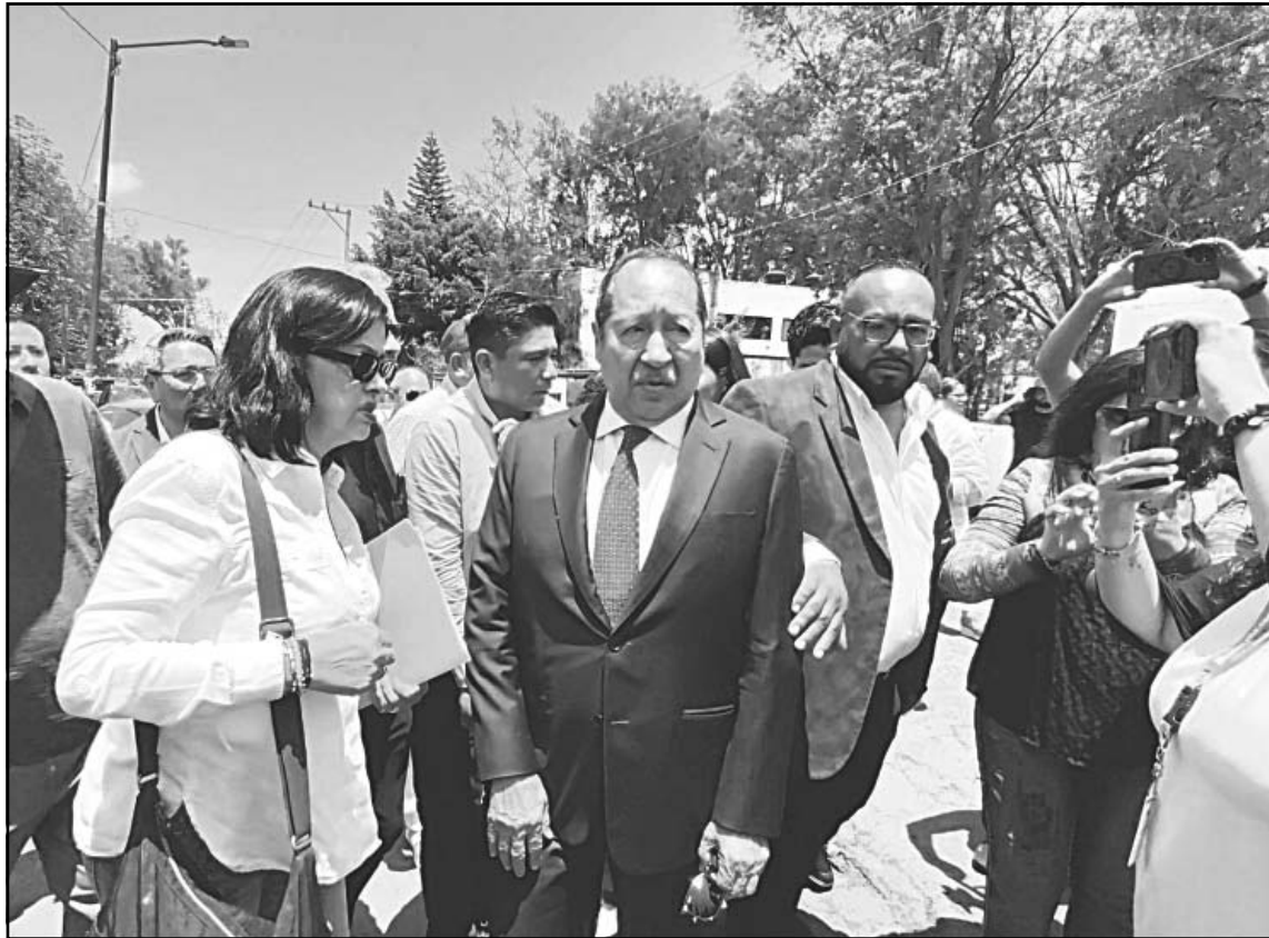
El diputado llegó a las instalaciones judiciales acompañado por simpatizantes de Morena.