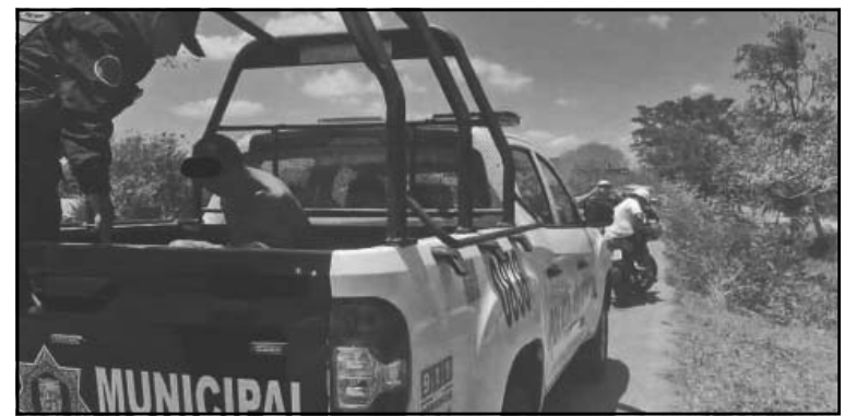
Al parecer el agresor padece de sus facultades mentales. (E. Caamal)