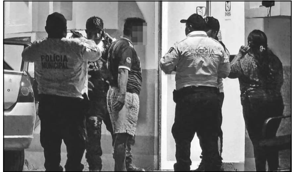
Los policías llegaron al nosocomio a hablar con la familia del baleado. (Erik Caamal)