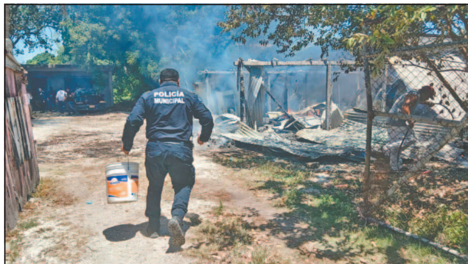
Por más esfuerzos que se hicieron no fue posible recuperar los bienes de la familia.