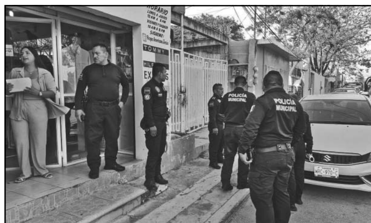
Las acusadoras se retiraron y la empleada mostró una denuncia.