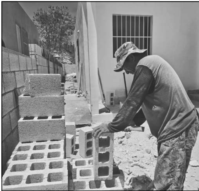
En el peor de los casos pasan más de 8 horas bajo los rayos del sol.

De acuerdo con la Dirección Local Campeche de la Comisión Nacional del Agua (Conagua), además de la localidad de Noh-Yaxché, otros puntos donde se han registrado altas temperaturas es en las estaciones climatológicas de Candelaria con 46 grados, Campeche UAC con 45, Hecel-