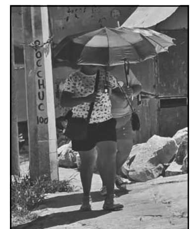
Continuará el clima muy caluroso.