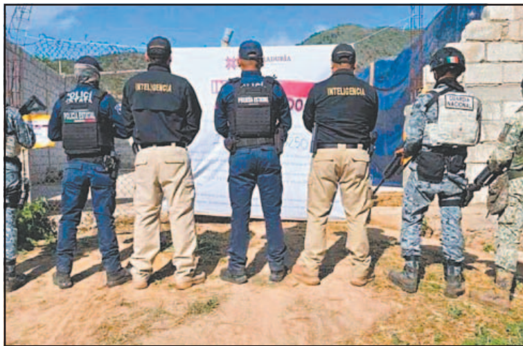
El inmueble operaba como centro de almacenamiento.

Por otro lado, un tribunal colegiado ordenó a la Fiscalía General de la República (FGR) entregar al capitán de navío Humberto Enrique López Arellano las copias necesarias de la carpeta de