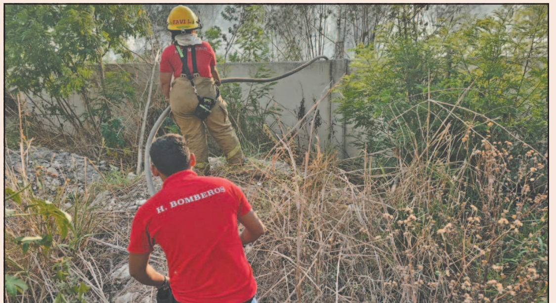
En Cumbres comenzó la labor de los "tragahumo" y con ello poder finiquitar el problema. (A. Pech)