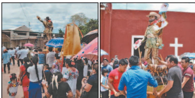
Arribaron las personas de poblados vecinos y de Yucatán. (M. Koh)