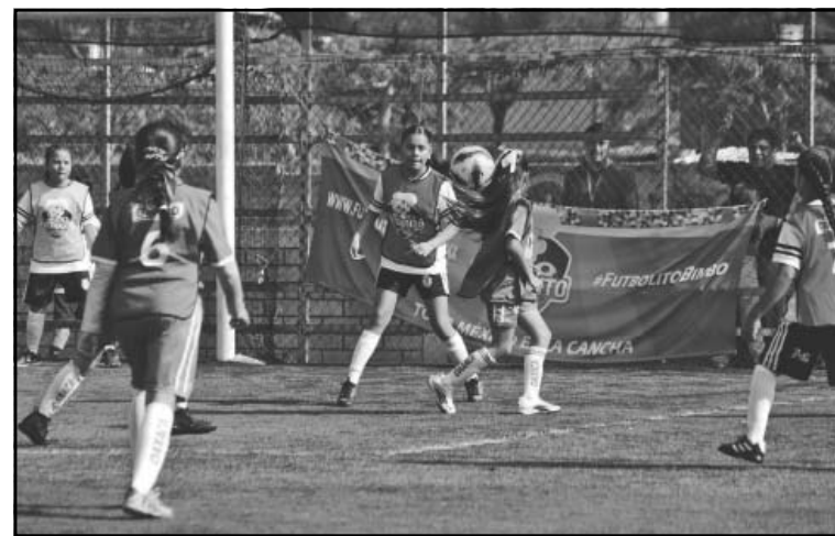
Ayer Campeche perdió ante Yucatán y Quintana Roo. (Pedro Díaz)