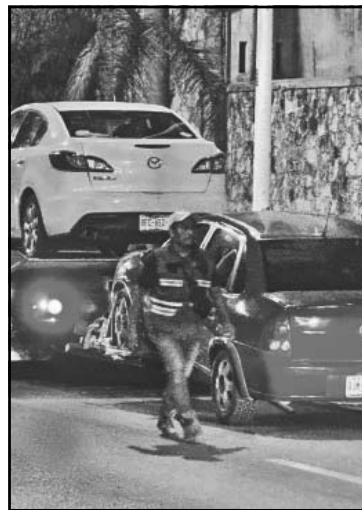
Les decomisaron las unidades.