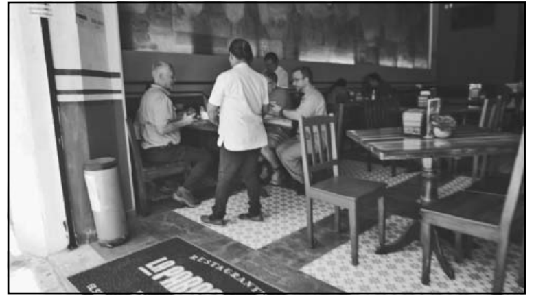
Los restaurantes se mantienen alerta ante cualquier eventualidad.