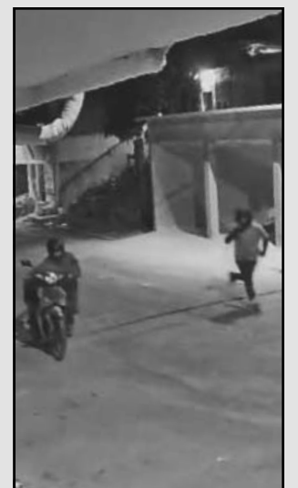
Lograron huir con rumbo desconocido. (Dismar H.)