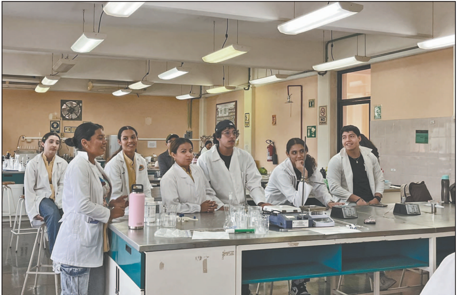
En la Entidad la mayoría de los alumnos están matriculados en carreras tecnológicas y universitarias, pero el número es aún bajo.

mil alumnos cursan el nivel superior en Campeche y mil 634 son normalistas.