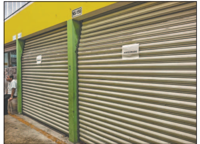
Si alzan la voz hay el riesgo de que le quiten su puesto en represalia.