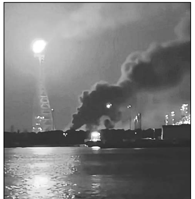
La flama derivó de trabajos de mantenimiento en los tanques.