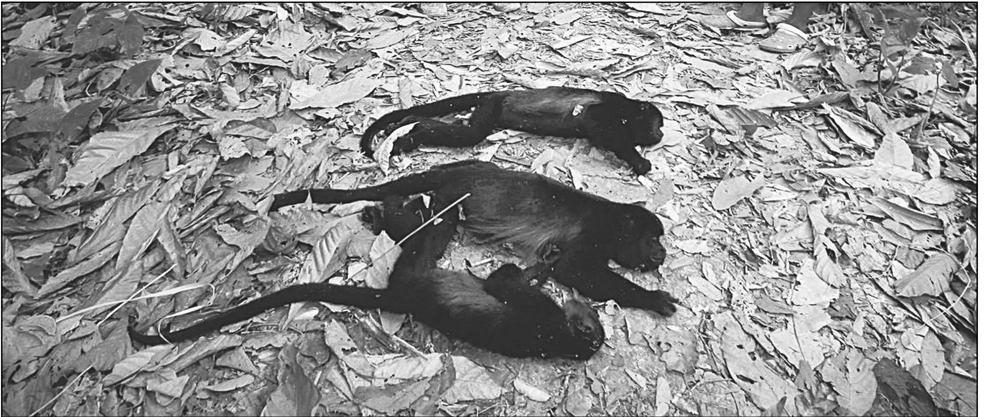
Mamíferos de la especie Alouatta palliata murieron en el 2024 debido a la sequía y las altas temperaturas en Buena Vista, Comalcalco, Tabasco.