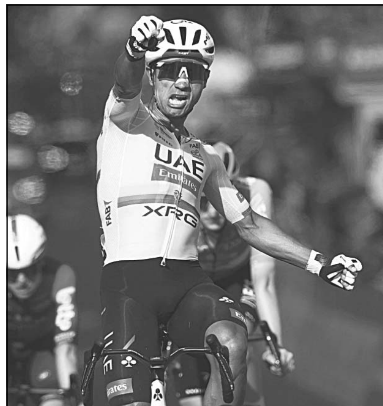
El ciclista igualó a Carapaz con 4 éxitos de etapa en la Corsa Rosa .