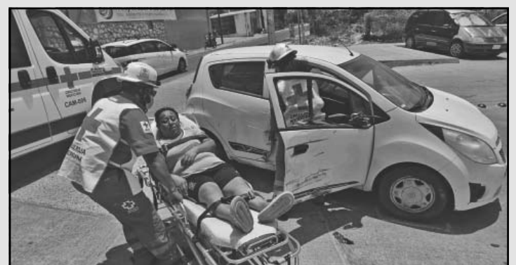
La acompañante resultó con lesiones sangrantes. (Alejandro P.)