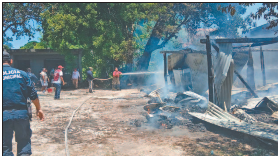
Las brasas consumieron el inmueble por el material inflamable con que fue fabricado.