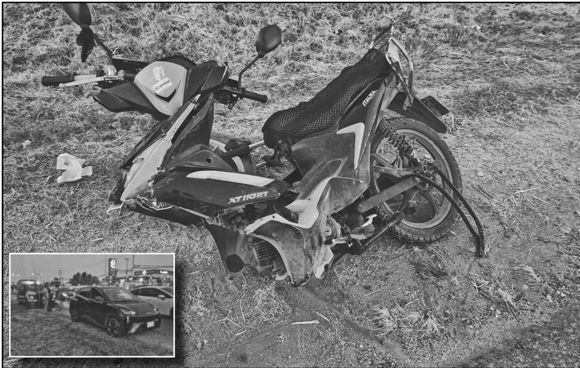
De acuerdo con testigos y el peritaje, la responsable no guardó la distancia de seguridad. (Israel L.)

De acuerdo con los primeros reportes y el peritaje preliminar, la motociclista no habría guardado la distancia de seguridad necesaria, por lo que se impactó violentamente contra la parte trasera de un automóvil BYD Dolphin color negro, con placas DJL-748-B también de Campeche, cuyo conductor transitaba en el mismo sentido sobre la citada vialidad.