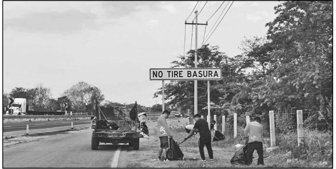
El problema de las personas que arrojan desechos en sitios prohibidos ya es preocupante. (E. Caamal)

Asimismo, elementos de la Policía Municipal serán los encargados de detener y sancionar a quienes sean sorprendidos tirando basura clandestinamente, las multas podrían ir de 15 a 20 UMAs, dependiendo de la cantidad y tipo de desperdicios abandonados, ya que incluso se han