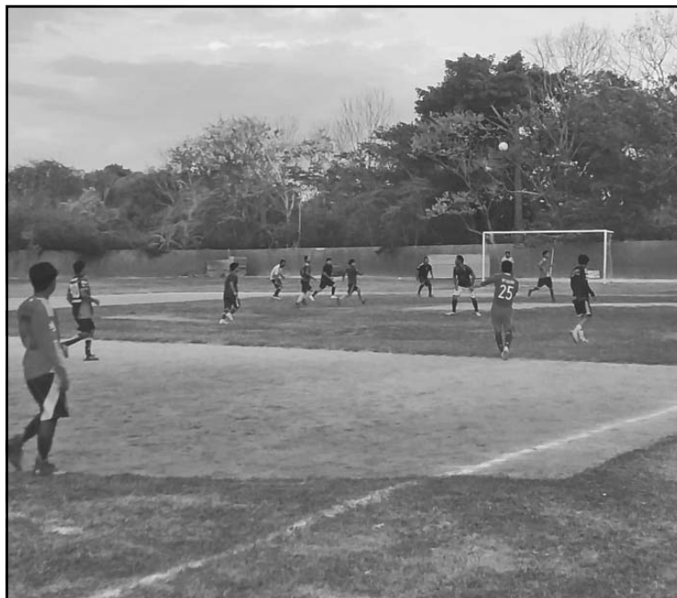
Los encuentros se programaron para el atardecer, por el fuerte calor.