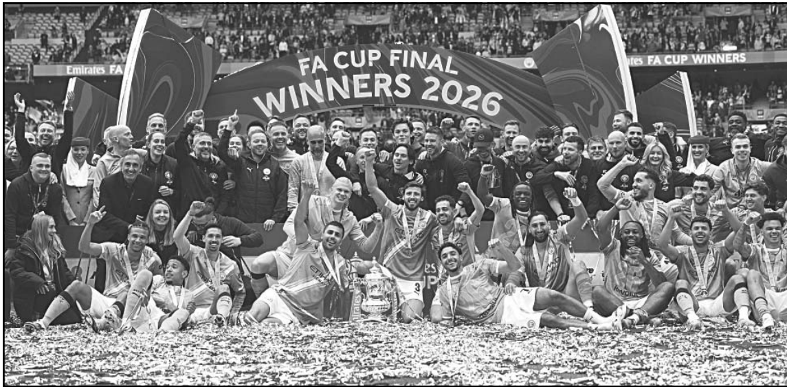
Es el vigésimo título Sky Blue bajo la dirección de Pep Guardiola y la segunda de esta temporada.

Después de tres años, los citizens conquistan la Copa de Inglaterra tras vencer 1-0 al Chelsea