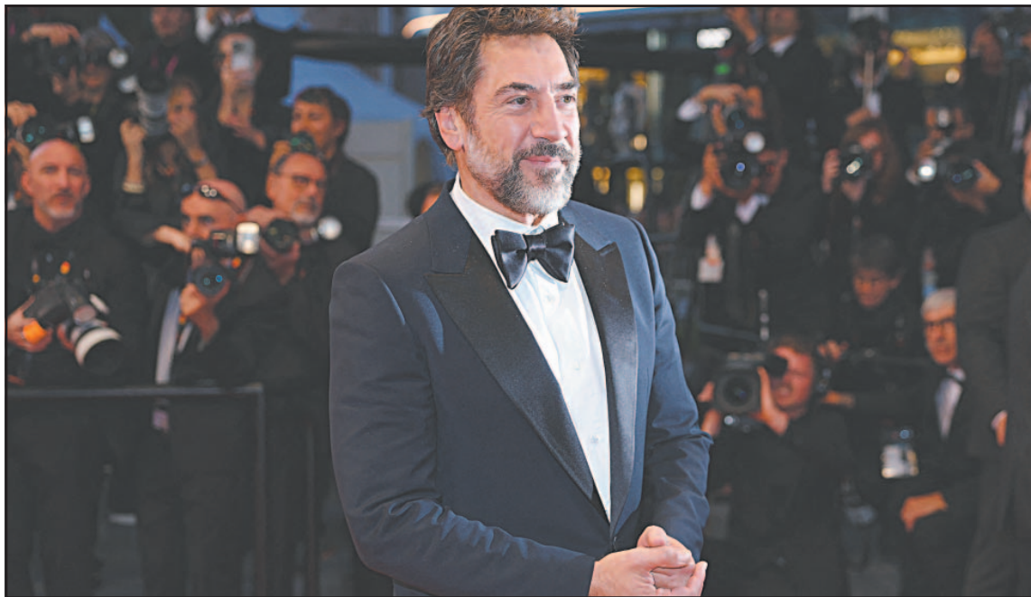
La cinta, en la que interpreta a un impulsivo director de cine, compete por la Palma de Oro . (POR ESTO!)

El filme de Sorogoyen es uno de los tres largometrajes españoles que compiten por la Palma de Oro , junto a Amarga Navidad de Pedro