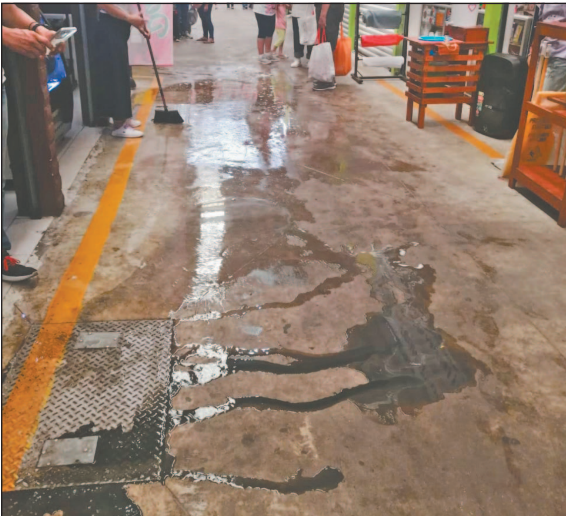
Desde hace tiempo se reportó el rebosadero de aguas negras y no se le dio una solución. (POR ESTO!)