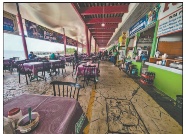
Han pasado años y el edil no acepta reunirse con los comerciantes.