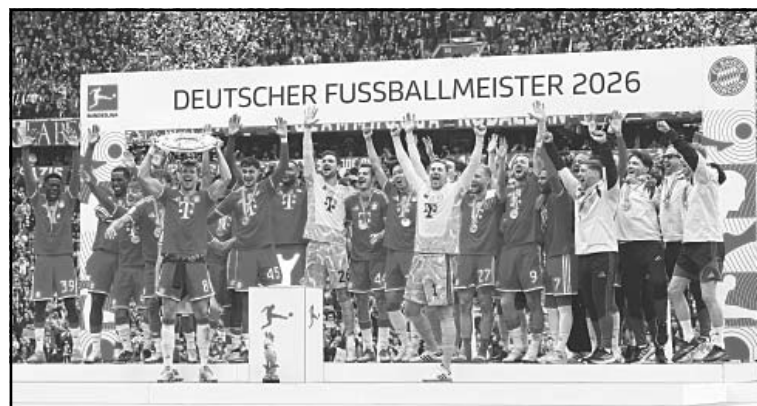
Con 122 goles, los bávaros superaron por 21 el récord histórico de liga.

Con la excepción de la notable temporada invicta a nivel de-