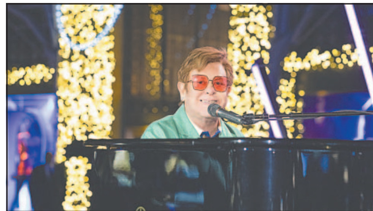
El británico califica el nuevo álbum como el más personal de su carrera.

La pérdida de visión también afectó aspectos cotidianos de su vida, ya que no puede leer, ver televisión ni disfrutar plenamente de