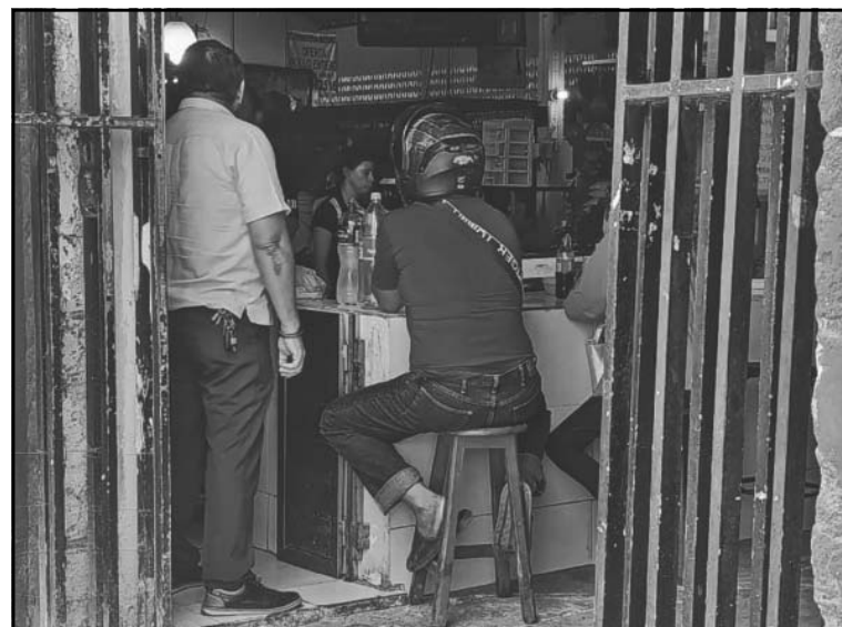
El atractivo principal son los antojitos, y son pilar de su economía.

Los locatarios recalcan que, pese a este abandono, la adminis-