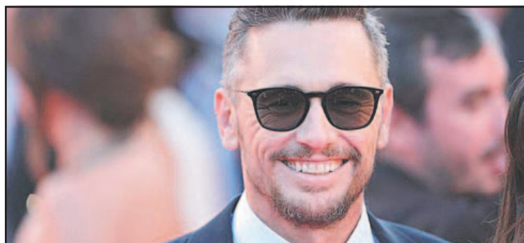
Tras estar alejado por escándalos, regresa como villano. (POR ESTO!)