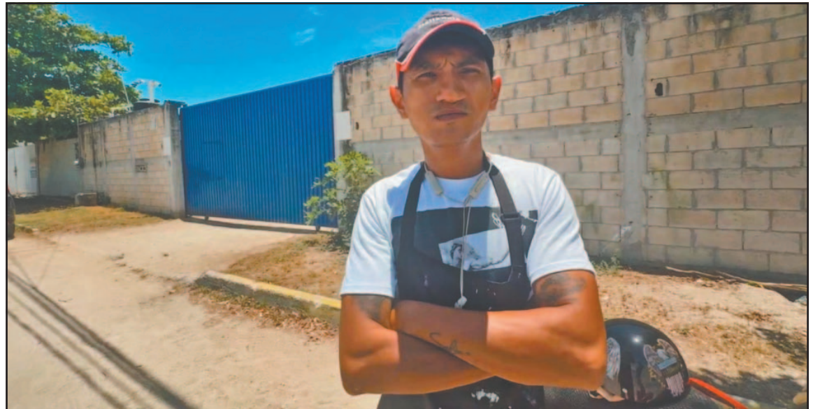
“Remsa Soluciones” mantuvo en litigio una demanda laboral durante casi año y medio. (Perla Prado)

Durante la exhibición del atropello del que estaría sujeto, el extrabajador de "Remsa Soluciones" hizo varios señalamientos relacionados con presunta contaminación ambiental. El denunciante aseguró que anteriormente interpuso denuncias contra la empresa por supuestos daños al medio ambiente y manejo inadecuado de residuos y aguas residuales, al indicar, incluso, que otro predio relacionado con la compañía habría sido clausurado en Playa Norte por situaciones similares.