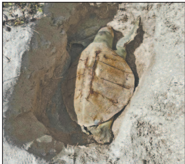
Las altas temperaturas también ocasionan su muerte.