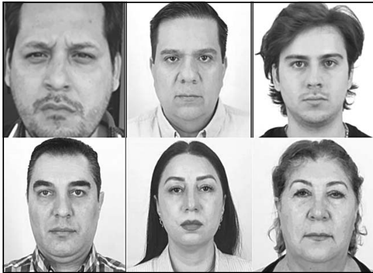
Más de una docena de personas fueron señaladas.