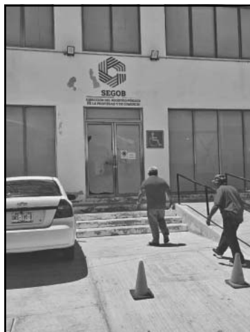
Impulsa el Registro Público la digitalización de títulos. (A. Pech)