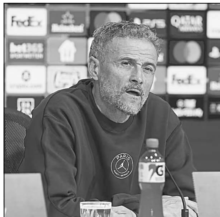
Paris Saint-Germain defenderá su corona el 30 de mayo en Budapest.