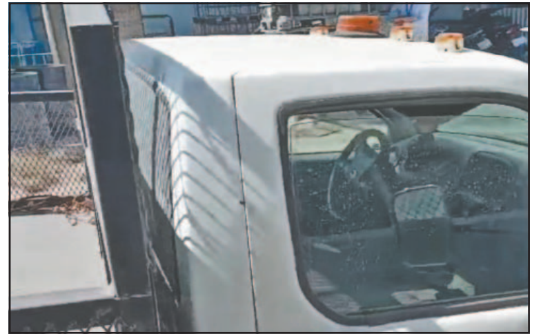
Antes del embargo ordenó retirar los vehículos de las instalaciones. (Perla Prado)