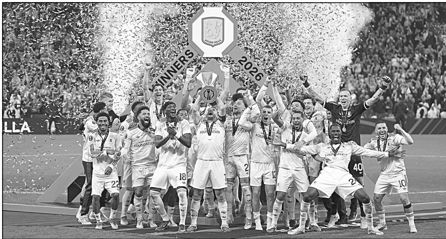
Los Leones conquistan el torneo por primera vez y su estratega Unai Emery por quinta ocasión para ser el máximo ganador del certamen.

posición. Miré a mi alrededor y me di cuenta de que tenía tiempo para controlar el balón y disparar. He estado practicando para un gol así", declaró Buendía.