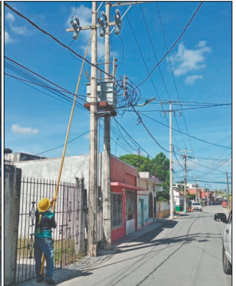
En los últimos días se ha agravado la problemática, pues los afectados reportan que el domingo estuvieron 10 horas sin luz. (Pedro Díaz)