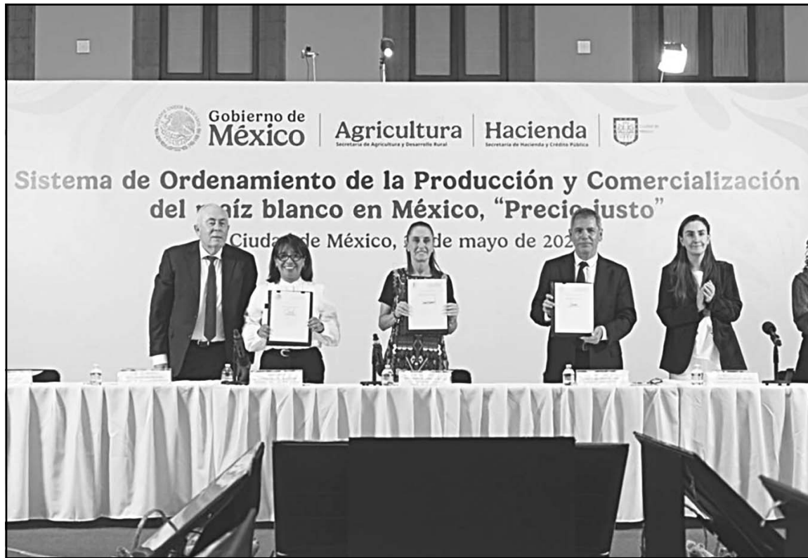
La mandataria federal Claudia Sheinbaum y la titular de Agricultura encabezaron el convenio.

La mandataria federal anunció la creación de un padrón de toda la cadena productiva y el diseño de una