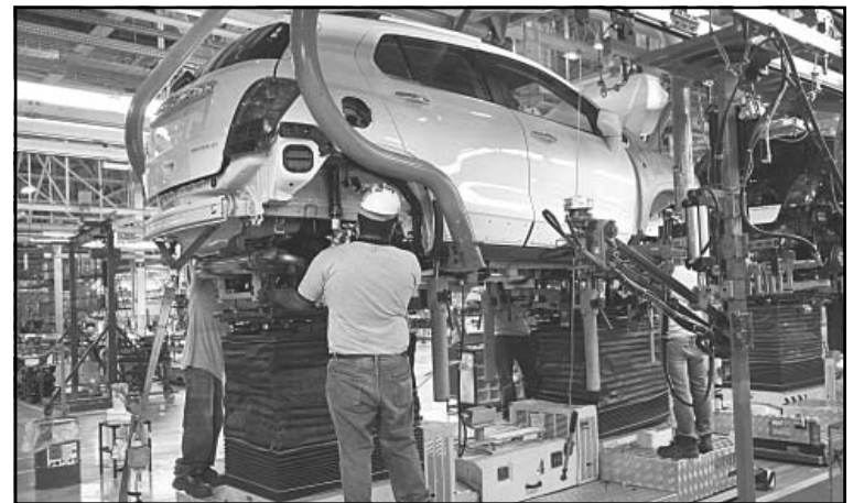
Hacienda destacó que México conserva grado de inversión.