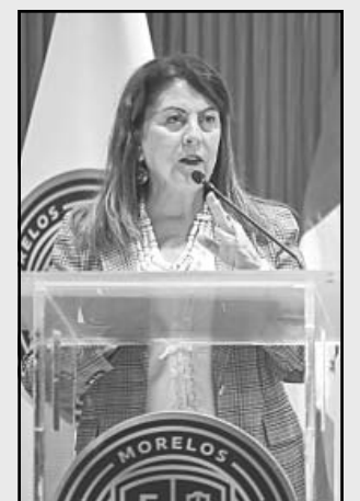
La Gobernadora morelense respaldó a los ayuntamientos.