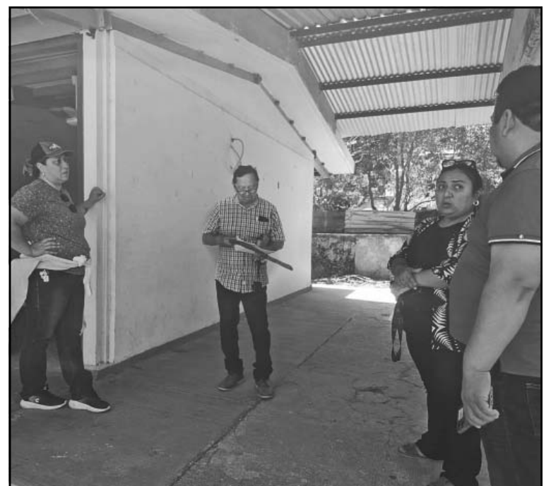
El viejo plantel volverá a la vida y ya ha sido rehabilitado. (A. Caamal)