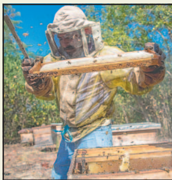
México es el 10° productor mundial.

Según la Dirección General del Servicio de Información Agroali-