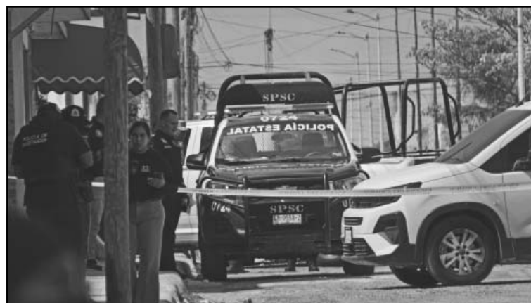
Fiscalía indaga narcomenudeo y tentativa de homicidio. (POR ESTO!)