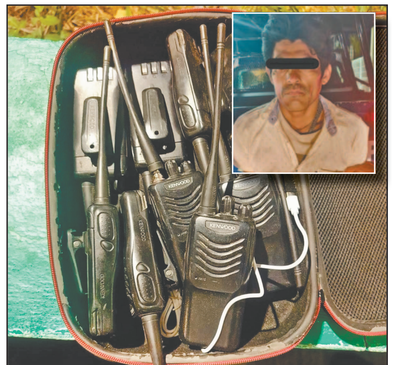
El detenido y el botín fueron remitidos a los separos. (Jorge May S.)