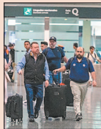
La Secretaría de Salud advirtió a visitantes sobre enfermedades.