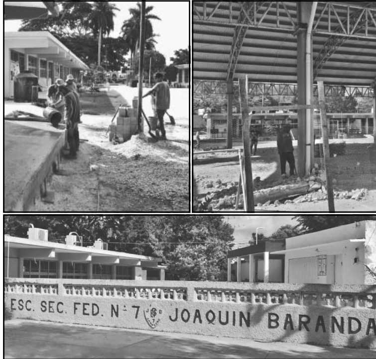
La Seduc anunció que investigará este delicado caso. (POR ESTO!)

La situación provocó que, en una asamblea reciente, las señaladas se comprometieran a devolver las cuotas escolares el 18 de mayo; sin embargo, el reembolso no ocurrió. Las involucradas señalaron que ya interpusieron ante