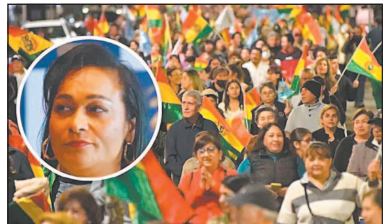
La Cancillería dio un plazo a García para que abandone el país. (EFE)

En su cuenta en la red social X, Petro dijo el pasado domingo que “Bolivia vive una insurrección popular” como “respuesta a la soberbia geopolítica”, y agregó que su Gobierno “está dispuesto, si es invi-