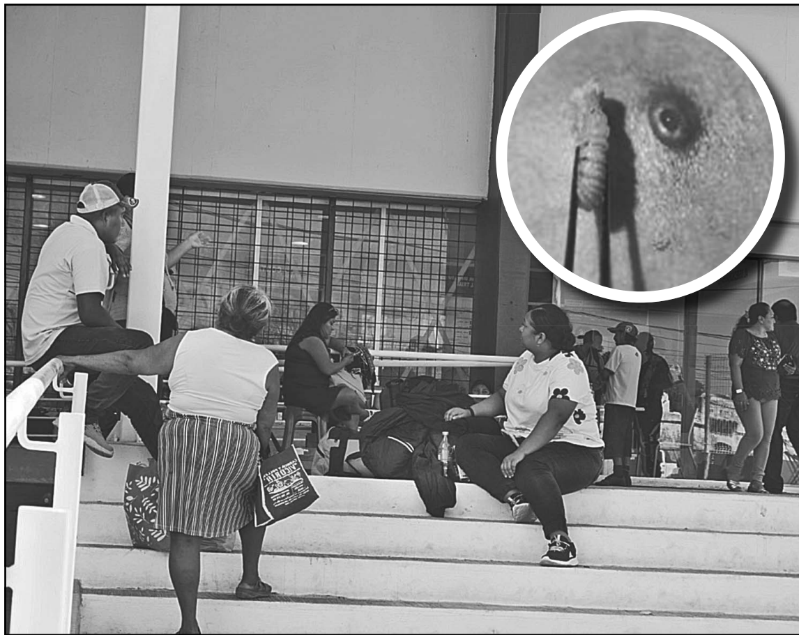
En la Península de Yucatán, El Estado tiene el menor número de brotes acumulados en el año.