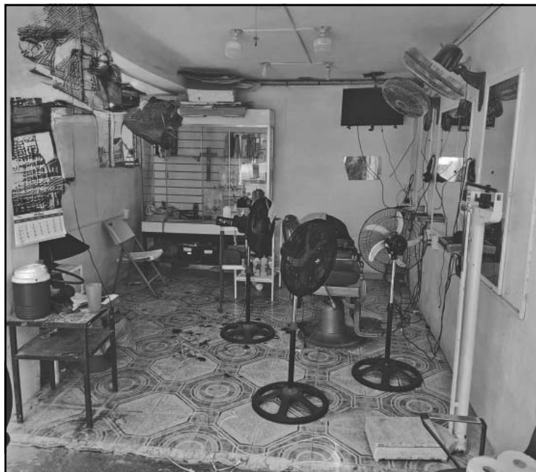
Los ladrones rompieron la ventana para ingresar al negocio.