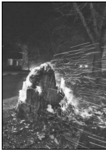
La mayoría fueron de maleza.