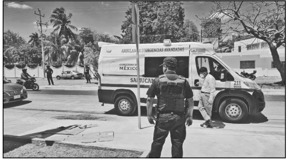
Por el cuadro epiléptico fue trasladado al IMSS Zona Centro para su atención. (A. Pech)