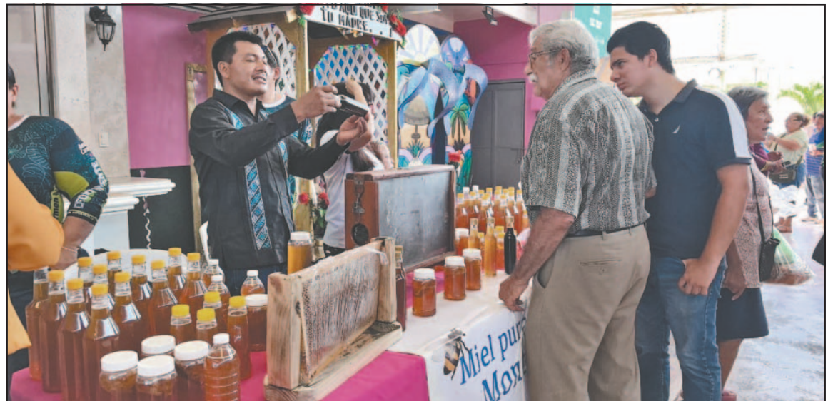
El valor de este alimento radica en que como mercancía tiene otros usos industriales.