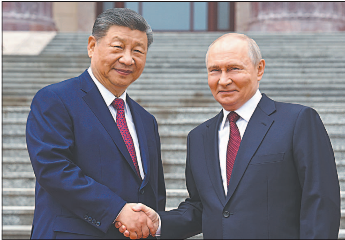
El presidente chino recibió a su homólogo ruso al pie de las escaleras del Gran Salón del Pueblo.

Ambos países subrayaron la necesidad de “retomar el diálogo y las negociaciones lo antes posible” en Oriente Medio, según la decla-