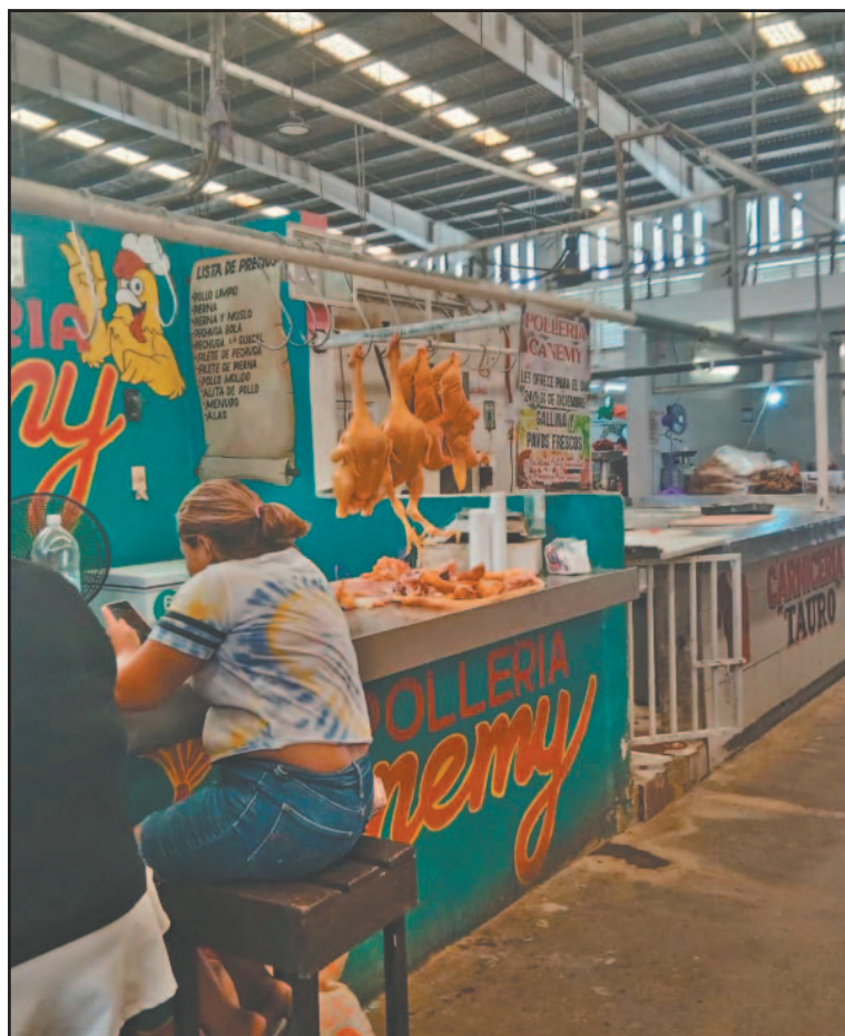
Las ganancias son pocas ante la falta de clientes. (Joaquín Guevara)