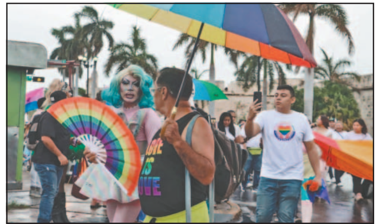
Los empresarios piensan que es un mercado prometedor.