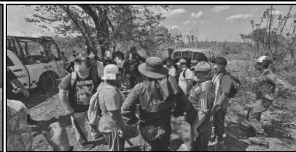
"Sinergias en el Sureste" se realizó por primera vez en la ciudad con la participación de varios Estados.

Campeche y reveló que entre 2025 y 2026 han realizado alrededor de 10 localizaciones de campechanos en territorio yucateco, además de tres procesos de reintegración familiar en lo que va del año.