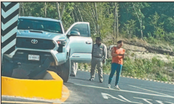
El incidente dejó pérdidas materiales en la unidad. (J. Guevara)