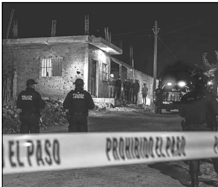
El crimen sucedió el domingo en un rancho de Texcalapa . (Agencias)

PUEBLA, Pue.- Dos personas más fueron detenidas por su probable participación en el asesinato de 10 víctimas (siete integrantes de una sola familia y tres trabajadores), ocurrido el pasado fin de semana en la Mixteca poblana .