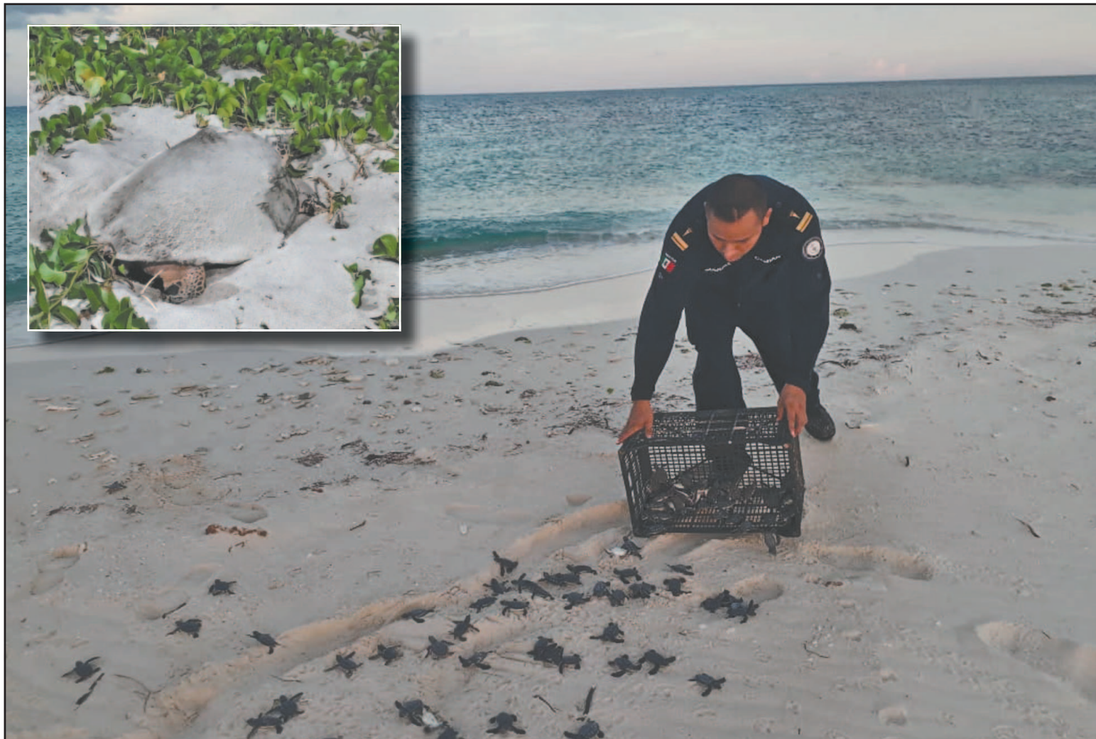
Cada año llegan a las costas carmelitas especies de carey , blanca y lora , las dos últimas se reproducen en menor cantidad. (Perla Prado)

“ Si las ven en su proceso no usen el flash de sus cámaras (...) Llamen al 911 para que las canalicen con los responsables del campamento a cargo del monitoreo ”.