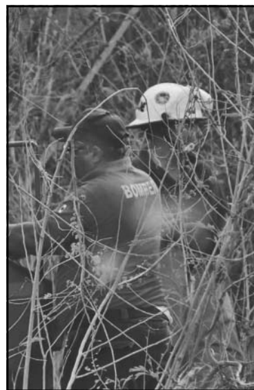
Se necesitaron dos camiones.