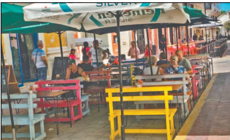
Consideran al calor como una amenaza económica. (Alejandro Pech)