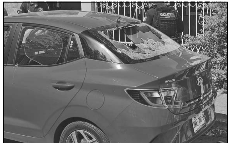
Uno destruyó el medallón de un auto en Concordia. (Dismar Herrera)