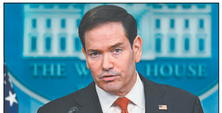
Marco Rubio ofreció a los cubanos una “nueva relación”.