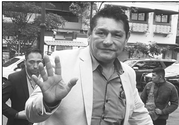
El presidente municipal de Cuautla, Jesús "N", está prófugo.