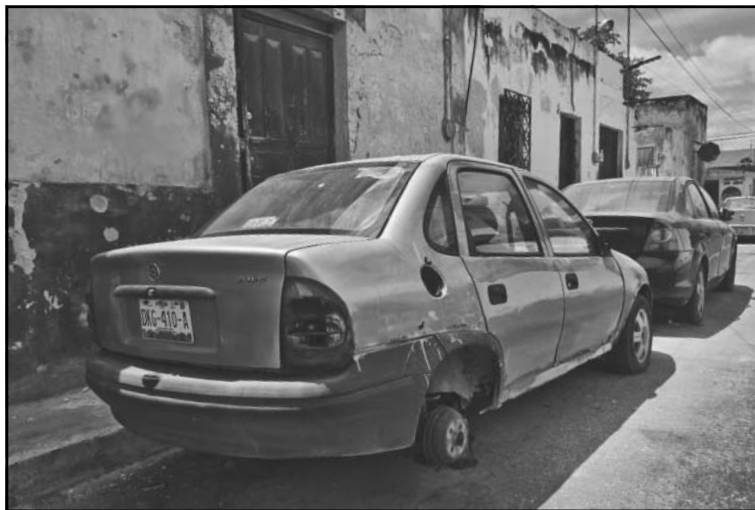
Los agentes estatales serán responsables del retiro de la unidad.

Otro de dictámenes aprobado fue la reforma a la Ley de Movilidad y Seguridad Vial y la Ley de Vialidad, Tránsito y Control Vehicular para permitir a las personas expresar vo-