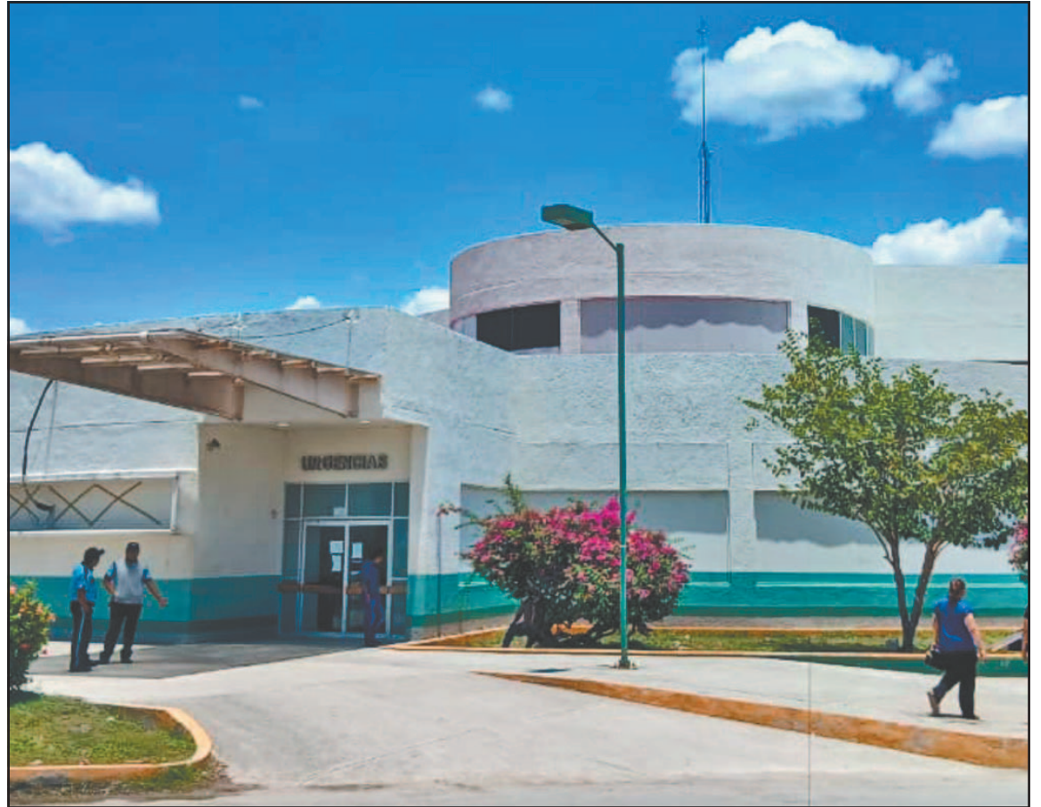
El hombre no resistió por la gravedad de las lesiones y falleció mientras recibía atención. (J. Guevara)