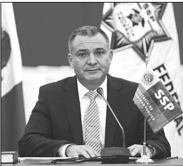
Hacienda reportó que se dictó sentencia contra el exsecretario.

CIUDAD DE MÉXICO.- La Secretaría de Hacienda y Crédito Público (SHCP), a través de la Unidad de Inteligencia Financiera (UIF), informó que un tribunal de Florida, en Miami, dictó una sentencia a favor del Estado Mexicano por 578.5 millones de dólares dentro de un procedimiento civil relacionado con un esquema de contratación pública ilícita vinculado al exsecretario de Seguridad Pública, Genaro García Luna.