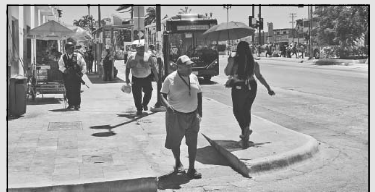
La Onda Tropical número 1 se mantiene en observación. (A. Pech)