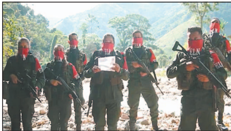
El alto al fuego se extenderá del 30 de mayo hasta el 2 de junio.