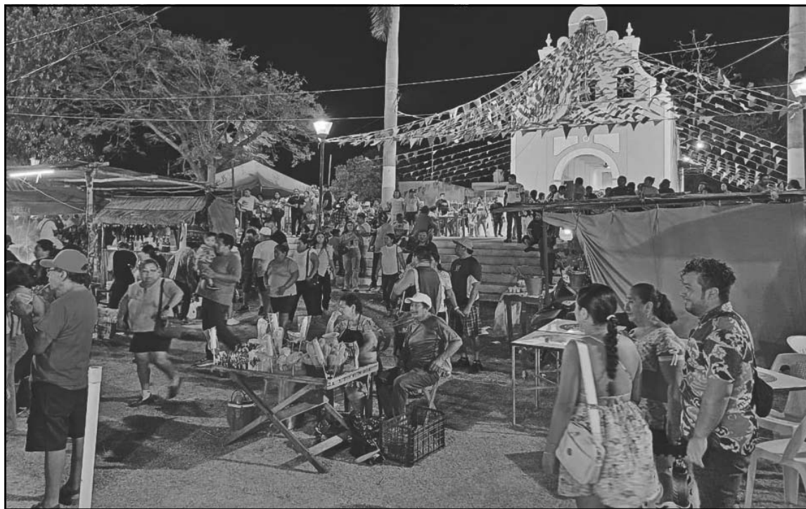
La celebración cumplió un año más y los fieles mostraron una gran devoción y respeto.