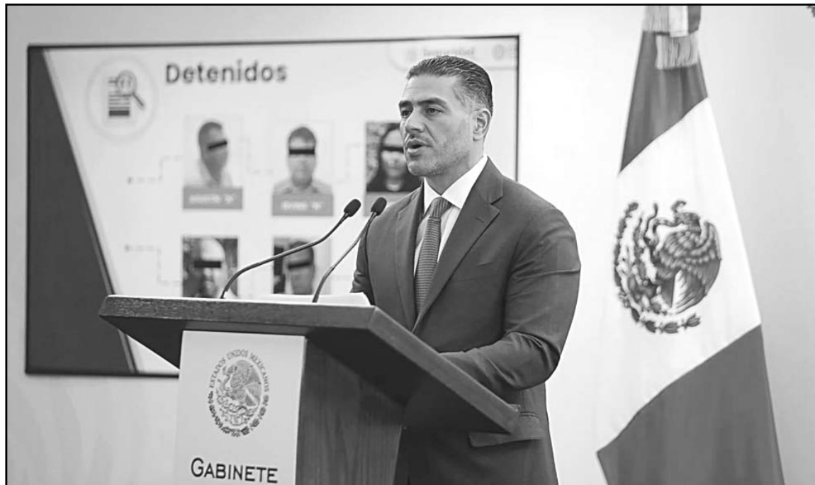
El secretario de Seguridad, Omar García Harfuch, explicó que se descubrieron nexos con el Cártel de Sinaloa .