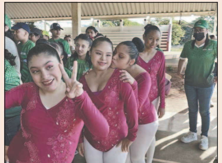
El evento será el 28 de mayo a partir de las 5 de la tarde. (Perla P.)