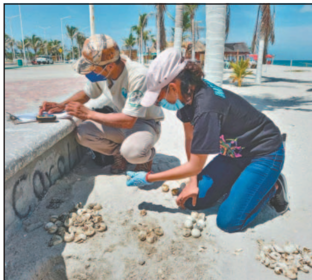
Los montículos de huevos son retirados para resguardo.