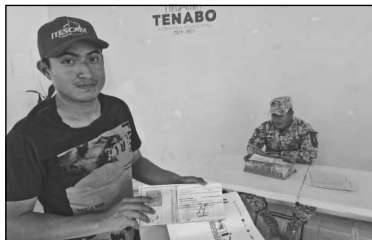
La Junta de Reclutamiento espera alcanzar cien registros. (A. Caamal)