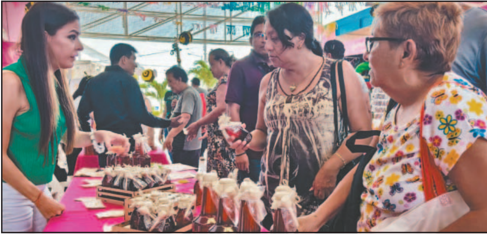
En el Estado hay alrededor de siete mil personas dedicadas a la actividad. (Perla Prado)