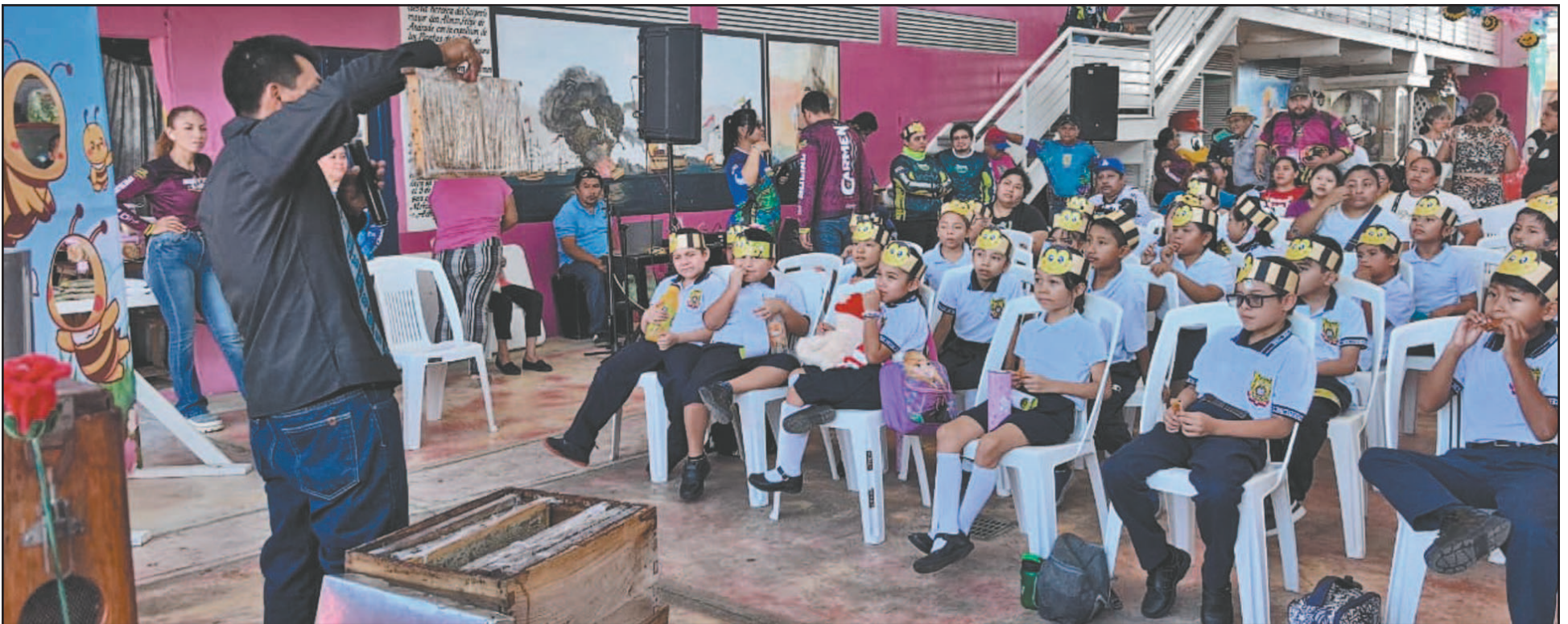
En el marco del Día Internacional de las Abejas se desarrollaron diversas actividades para explicar la importancia de estos insectos en la vida cotidiana. (Perla Prado)

La caída del precio internacional del producto los desanima y renuncian a seguir, explica la SDA