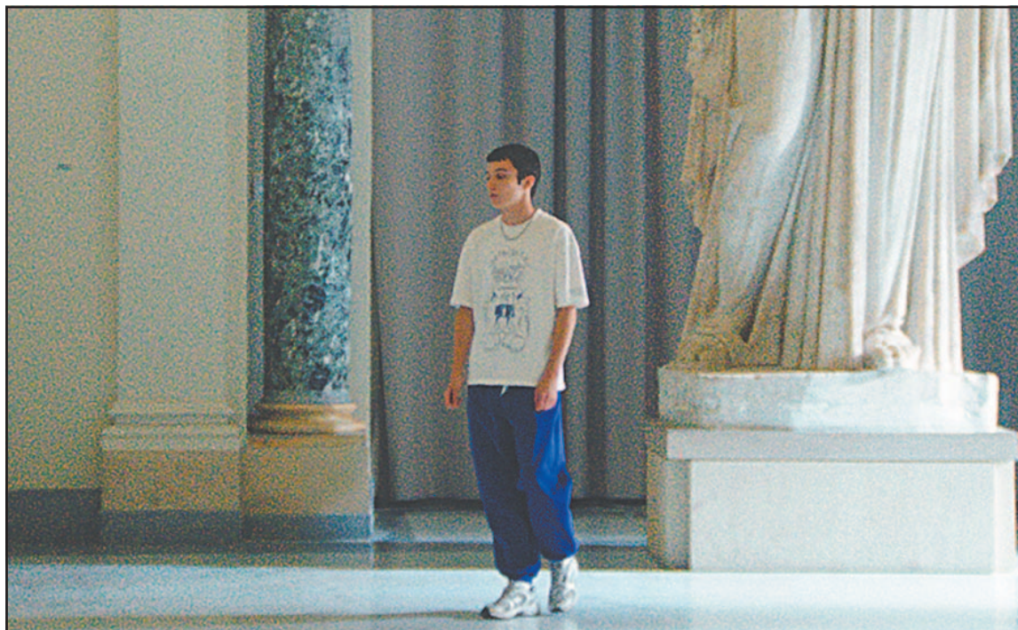
La cinta sigue a un grupo de estudiantes de secundaria que se embarca en un viaje escolar a Pompeya.

Aunque la cinta aborda cuestiones graves como la soledad, la enfermedad y la salud mental, Clotet intenta siempre presentarlas