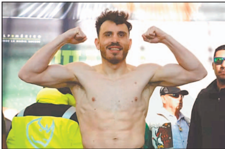
La causa del arresto del púgil no fue informada oficialmente.

Aquella captura generó amplia polémica debido a la relevancia pública del excampeón mundial y a la creciente atención de autoridades mexicanas y estadounidenses