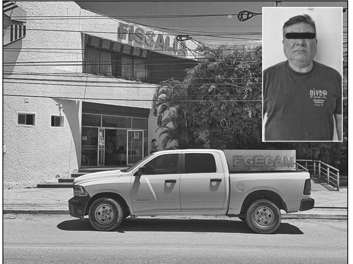
El hombre, identificado como E.H.C.A.C.V., enfrenta señalamientos por el delito de violación. (POR ESTO!)