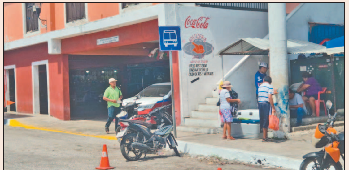
Los usuarios se quejan del alto costo de los taxis y la falta de transporte a sus destinos. (J. May)