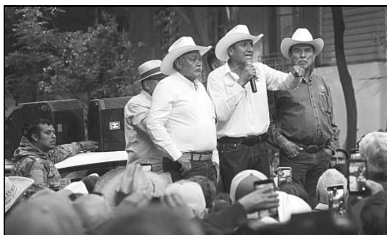
Productores advirtieron que podrían volver a sus marchas.