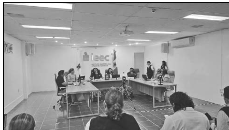
El Consejo avaló los modelos de documentación para el 5 de julio.