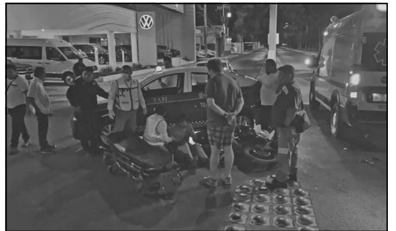
El joven sufrió severas lesiones y fue trasladado al IMSS. (D. Herrera)