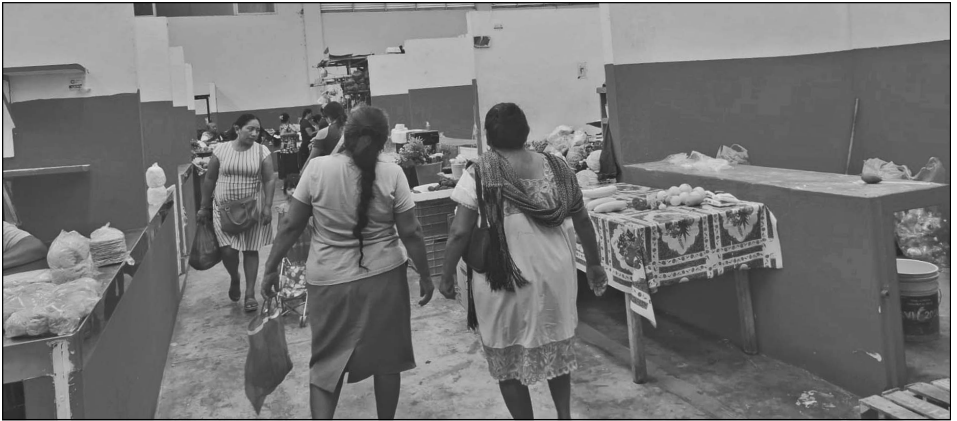
Las fuertes temperaturas ocasionan que los comerciantes abran más tarde y que los compradores eviten acudir; florerías, pollerías y carnicerías han perdido ingresos. (A. Caamal)