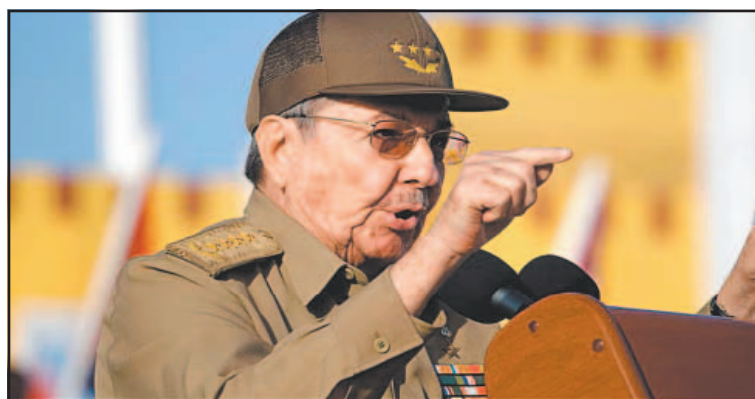
Hoy con 94 años, Raúl era entonces el ministro de Defensa.