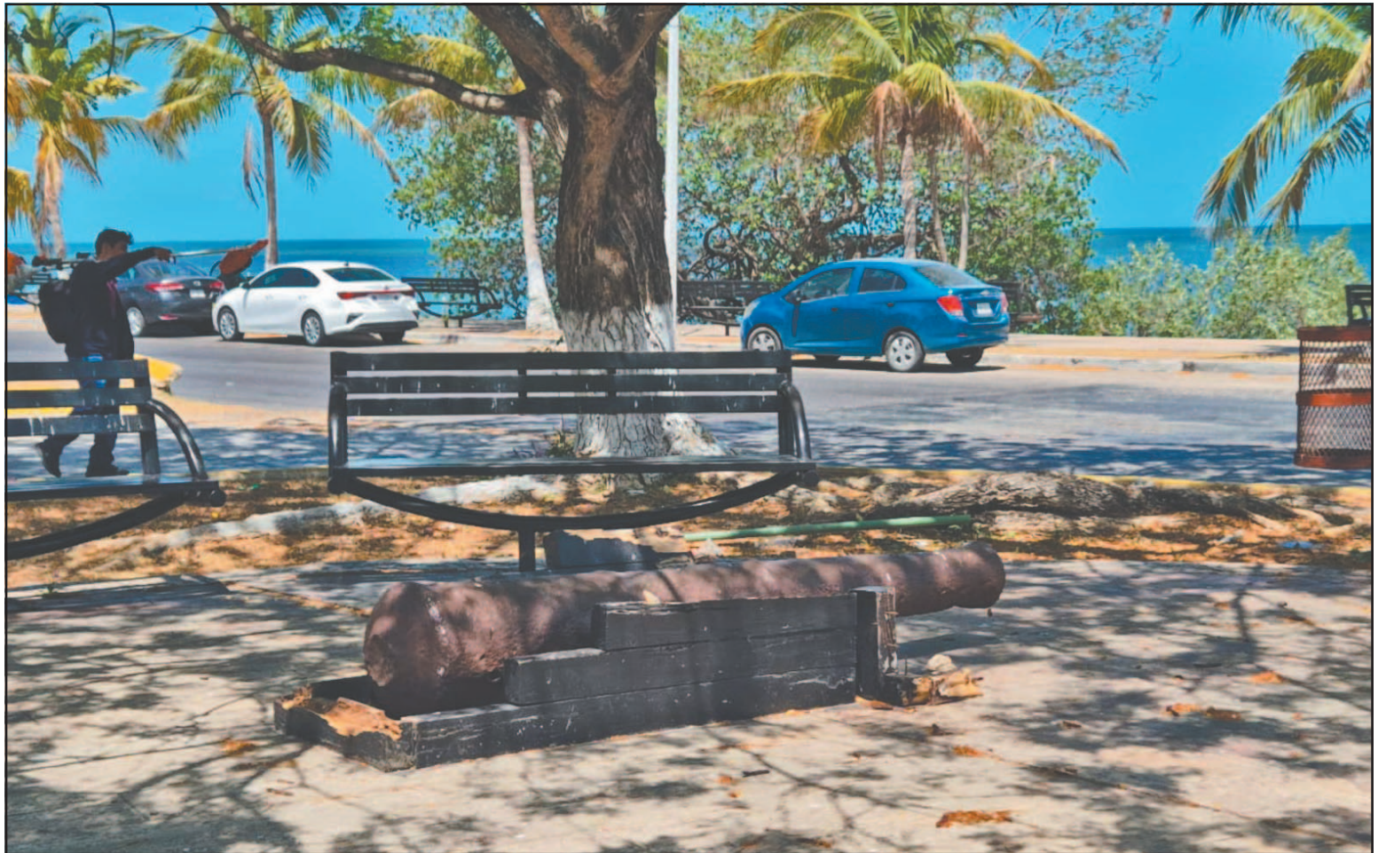
Diversos champotoneros se unieron al reclamo contra la Comuna para se realicen las reparaciones necesarias de la invaluable pieza.