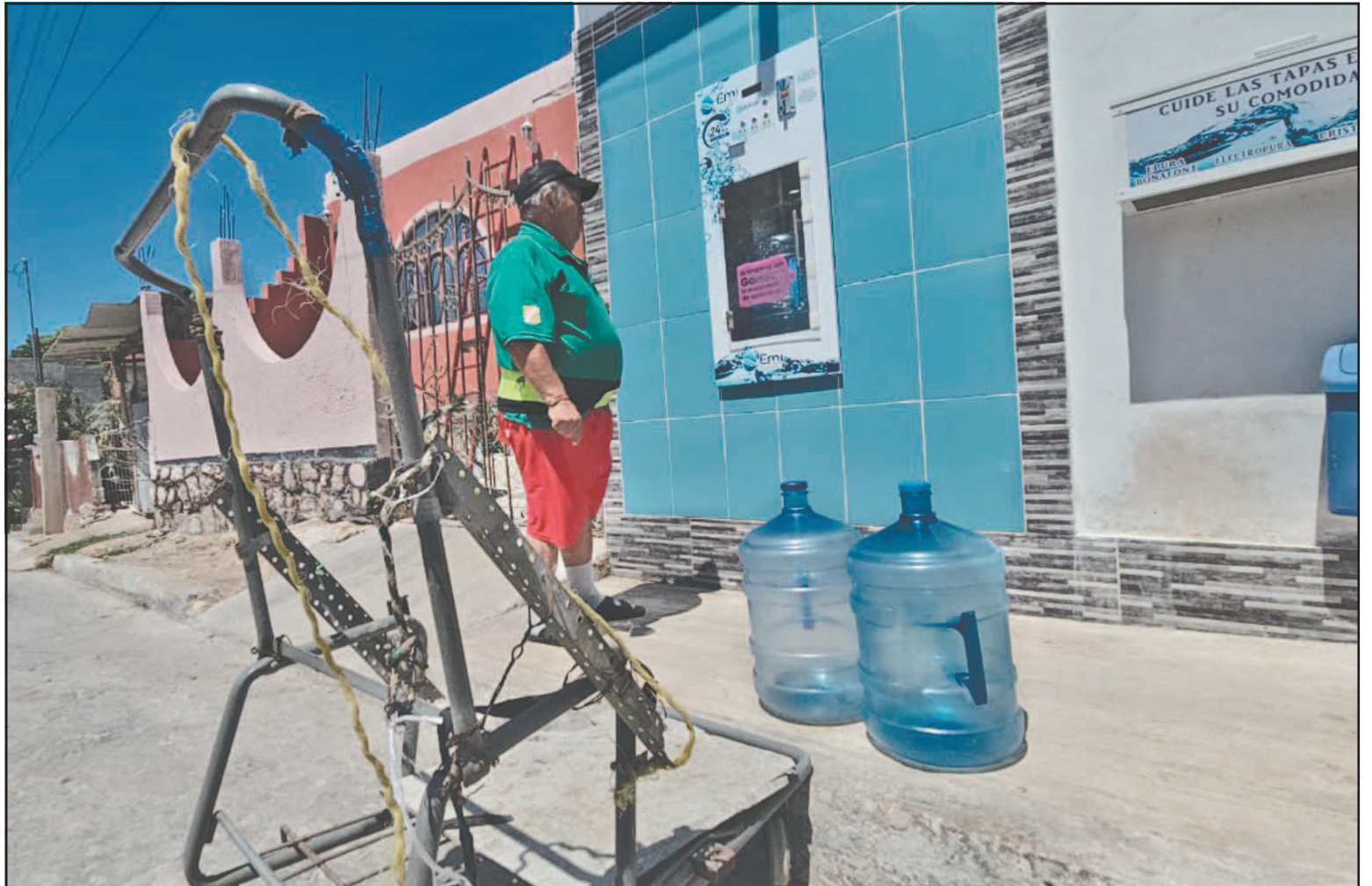
La situación de los ciudadanos raya en lo insostenible, sobre todo porque el desabasto ocurre en temporada de calor. (Alejandro Pech)

“Hace falta más unión de los campechanos para exigir solución a las autoridades pues en muchas ocasiones se desconoce qué hacen”.