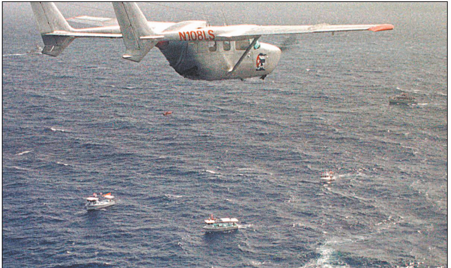
Los aviones de Hermanos al Rescate penetraron en aguas jurisdiccionales de la isla, afirmó el presidente del Gobierno.

Un juez de Miami levantó el secreto del sumario de un caso que durante años fue defendido por la comunidad cubana en el exilio en Florida, uno de los bastiones electorales de Trump.