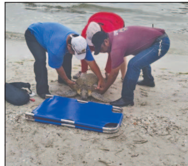
Los quelonios son víctimas constantes de accidentes.