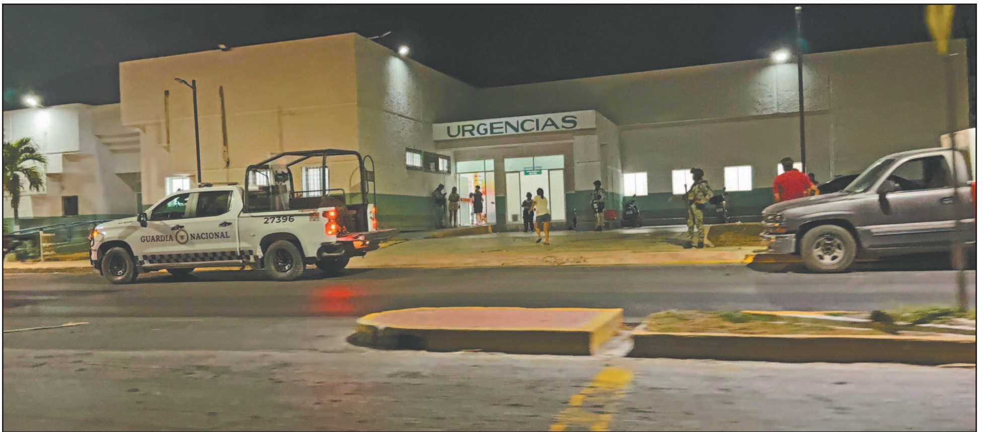
El afectado fue internado en el hospital de la cabecera municipal luego de ser trasladado en un vehículo particular por parte de las personas que estaban en el lugar. (J. May)