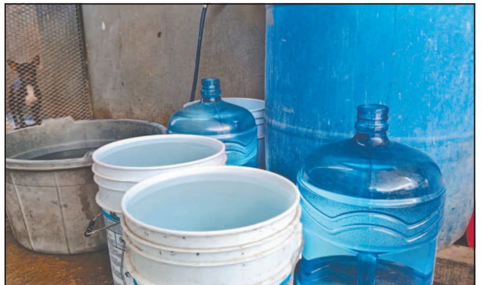
Las personas deben pasar mil peripecias para conseguir el vital líquido. (Alejandro Pech)