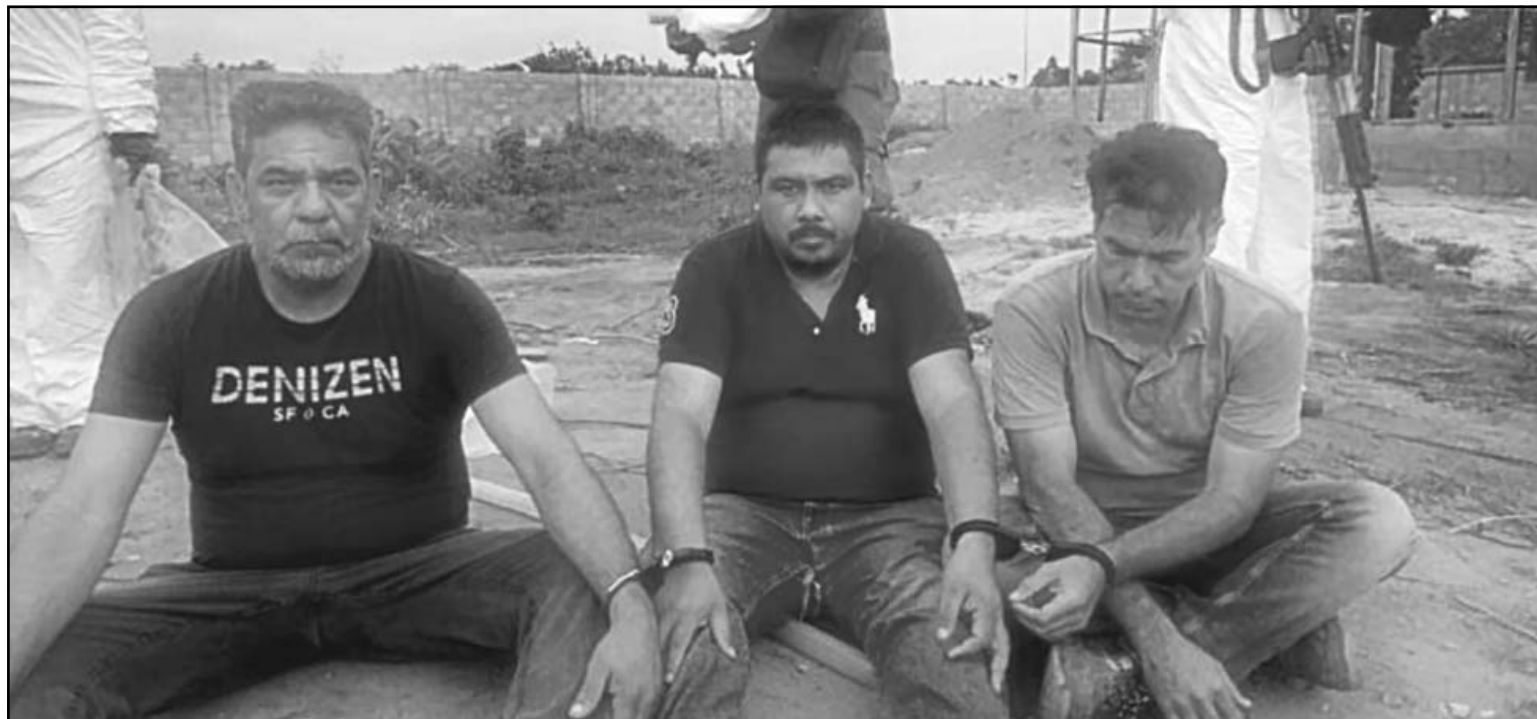
El operativo en una granja remota en el Suroeste del país reveló una enorme fábrica de droga a escala industrial jamás descubierta.

Autoridades africanas desmantelan un laboratorio de metanfetamina y arrestan a tres connacionales