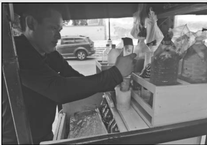
El granizado se ha impuesto en el gusto de la gente. (A. Caamal)