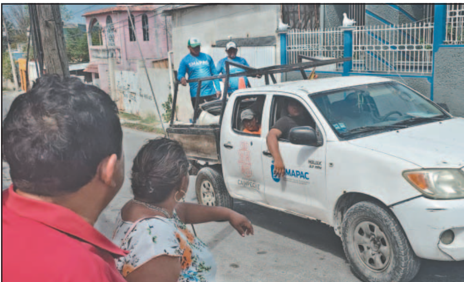
Barrios enteros de la ciudad capital viven con servicios deficientes. (Alejandro Pech)