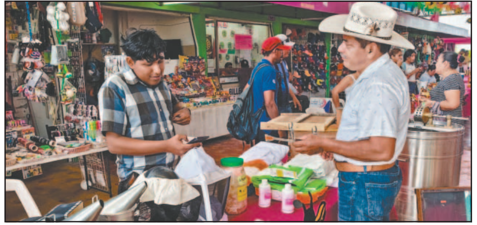
Pese a los altibajos, la labor apícola ha crecido en el Sur de Campeche. (Perla Prado)