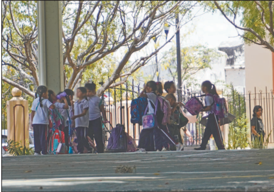
La dependencia asegura que proteger a los estudiantes es y será siempre la prioridad. (Lucio Blanco)

“Si suben más las temperaturas vamos a tener que interrumpir las