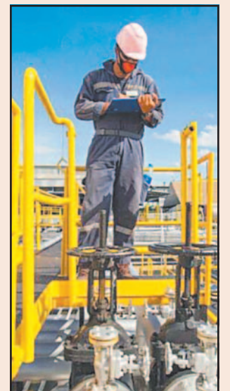
Moody's advirtió necesidades altas de la empresa pública.