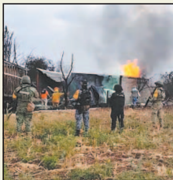
El predio está en Juventino Rosas.

contenedores y estructuras presuntamente utilizadas como centro clandestino de acopio y almacenamiento irregular de combustible.