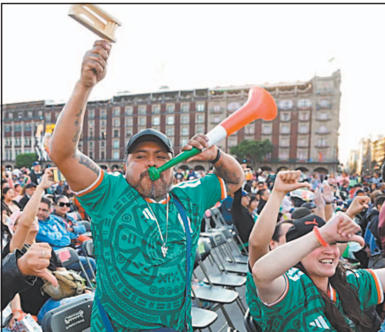
La Coparmex estima casi 27 mil mdp de ingresos en la capital.

CIUDAD DE MÉXICO.- La Confederación Patronal de la República Mexicana (Coparmex) en la Ciudad de México estimó ayer una derrama económica de 26 mil 985 millones de pesos en la capital durante el Mundial de Fútbol 2026.