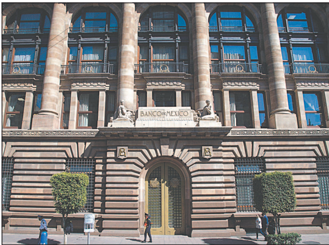
El organismo calculó en un 2.1% su proyección central del Producto Interno para 2027.

no mantuvo su pronóstico de la inflación, que estima en un 4.1% anual en el segundo trimestre de 2025.