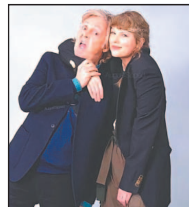
McCartney habló de la famosa.

Beatles continúa siendo histórica, con más de 600 millones de discos vendidos a nivel mundial y el récord de mayor cantidad de temas ubicados en el número uno del Billboard Hot 100 .