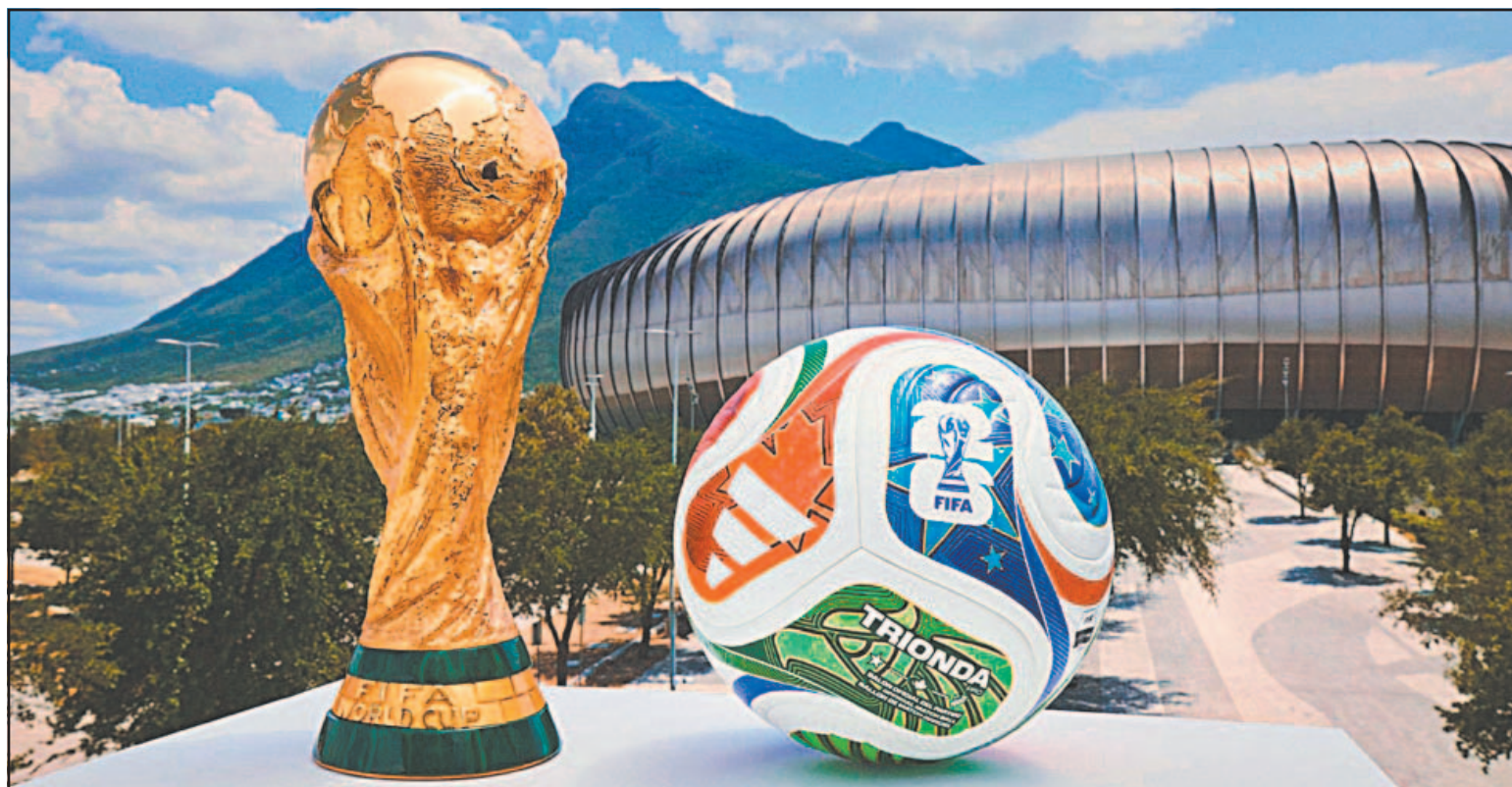
Formalmente, el 1 de julio entrarán en vigor límites de tiempo en sustituciones, cambios en el VAR y sanciones por retrasar saques de banda.

Otra de las modificaciones más relevantes será el límite de tiempo para las sustituciones. Los futbolistas tendrán únicamente 10 segundos para abandonar el terreno de juego una vez mostrada la pizarra de cambio o tras la indicación del árbitro. En caso de retrasarse, el suplente