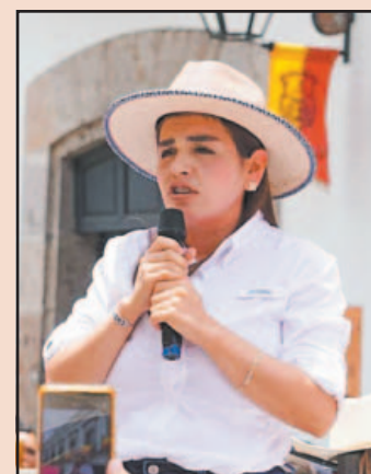
Grecia Quiroz criticó restricciones para candidaturas independientes.