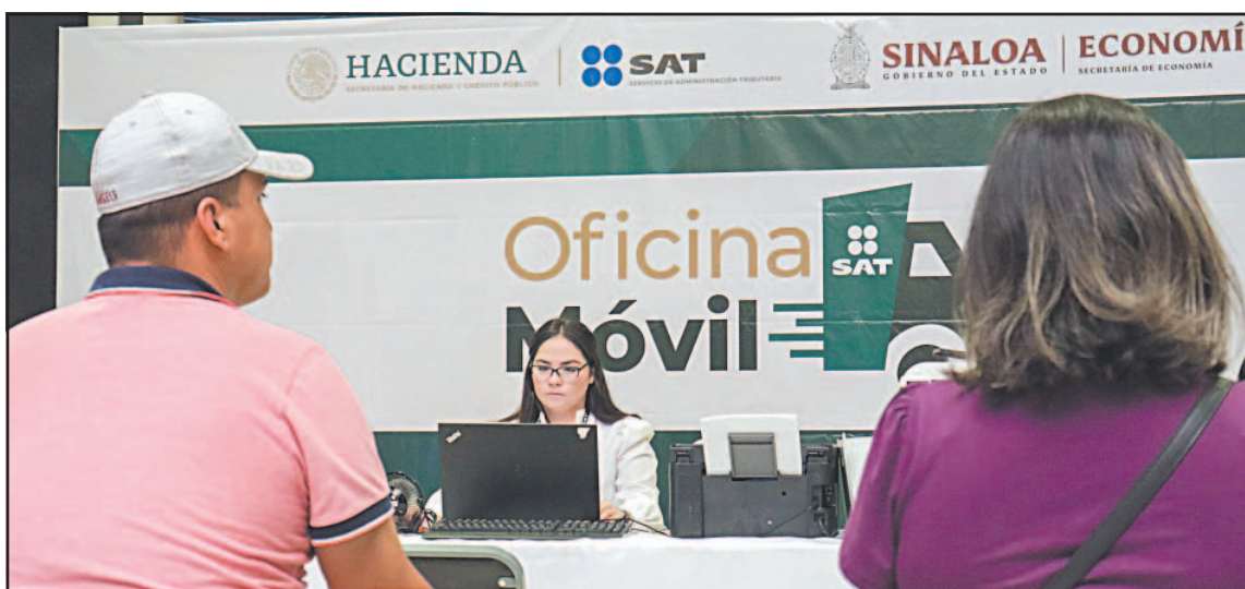
Desde ayer y hasta mañana, el organismo acercará la atención a personas de zonas rurales. (Agencias)

No se requiere cita previa y hoy se podrá acudir a los módulos en