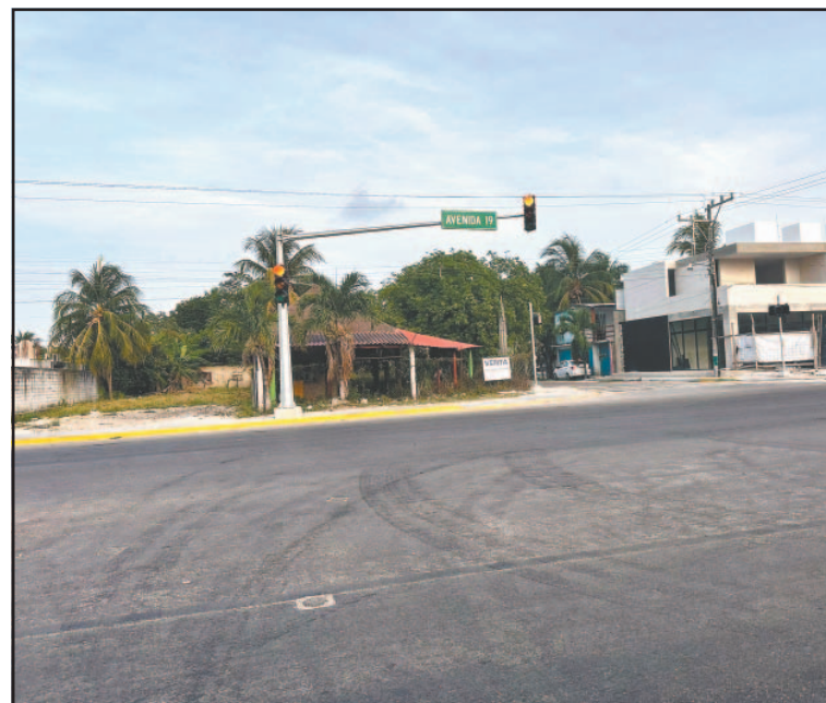
Las luces de tránsito se mantienen encendidas en rojo.