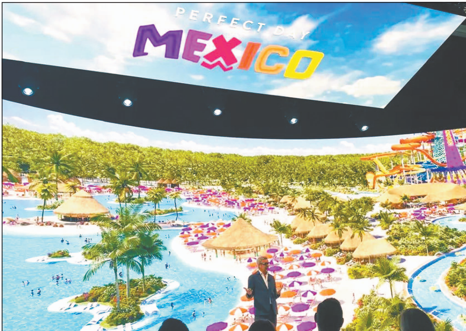
La Semarnat determinó posibles afectaciones a la zona costera de Mahahual, donde existe un sistema arrecifal.

Detalló que en esa región existe un sistema arrecifal de gran relevancia y además se localizan dos Áreas Naturales Protegidas destinadas a la conservación de ecosistemas: la Reserva de la Biosfera Banco Chinchorro y la