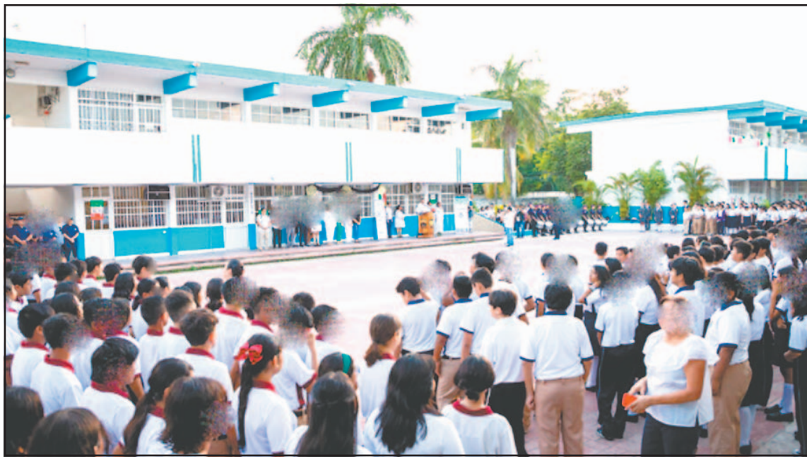
En preparatoria, el abandono de las aulas reporta un 10.2%; en nivel básico baja a 0.2. (POR ESTO!)

La matrícula escolar en Cozumel ronda los 19 mil estudiantes en todos los niveles educativos. De ellos, aproximadamente 16 mil corres-