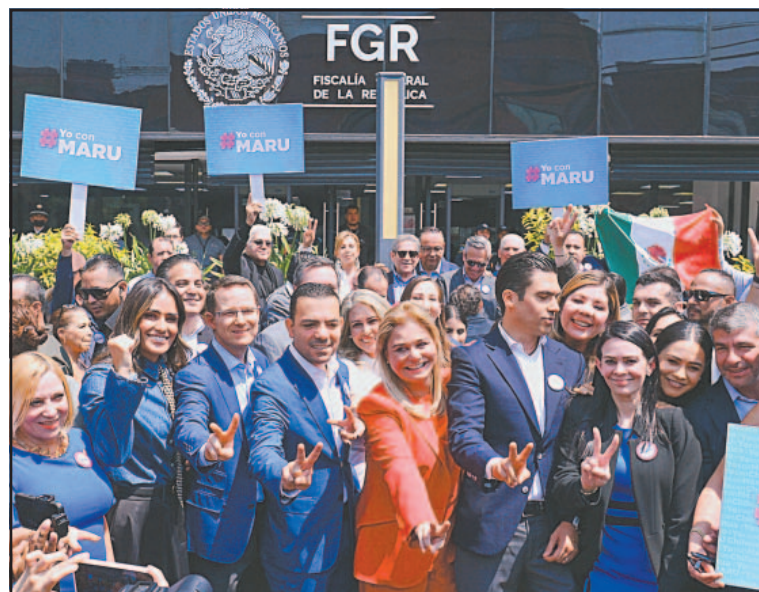
La Gobernadora leyó un escrito al salir de las instalaciones.