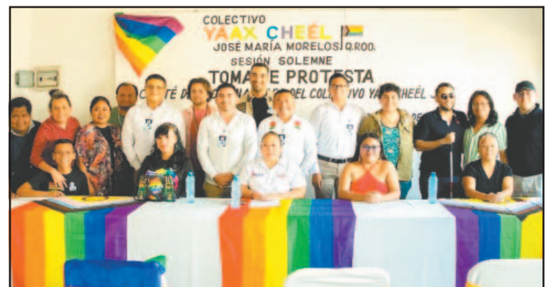
En zonas rurales persiste el prejuicio por la diversidad sexual. (L. Kauil)