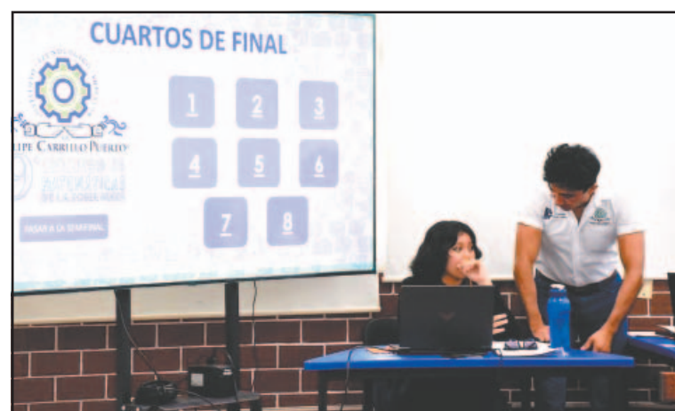
En la fase inicial abordaron aritmética, álgebra y geometría. (J. Xiu)

El objetivo fue obtener recursos para continuar con el proyecto de