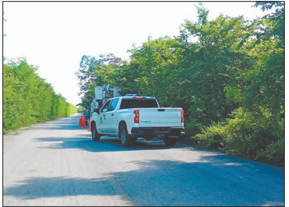
Personal de la CFE señaló que las cuadrillas trabajan conforme el clima lo permite.