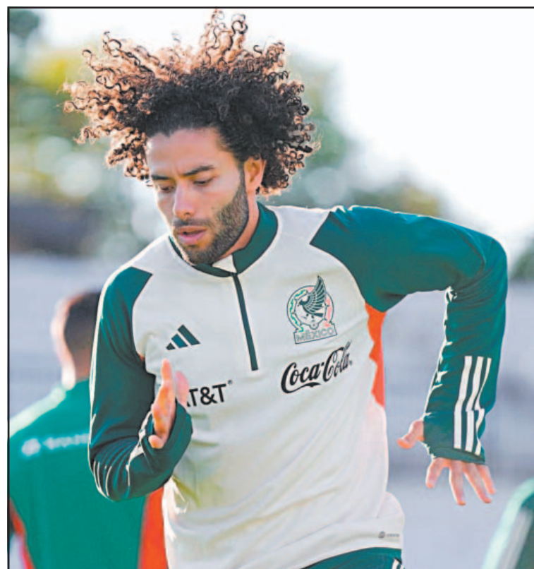
El azteca no tuvo actividad durante 7 meses debido a una lesión.