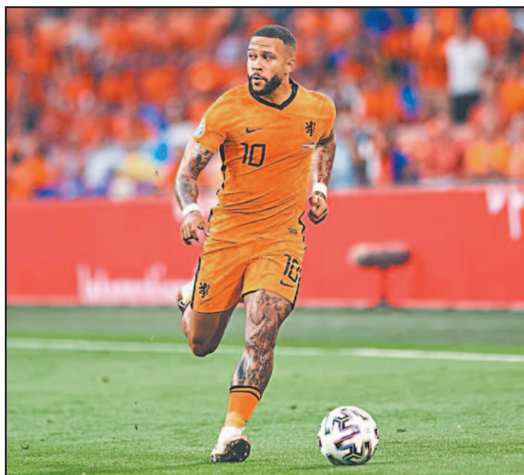
El neerlandés registra un gol en 13 encuentros con Corinthians.

LA HAYA.- Países Bajos presentó oficialmente su lista de 26 jugadores para la Copa del Mundo de 2026 con varias decisiones que llamaron la atención, especialmente por la inclusión de Memphis Depay, quien regresa tras una larga ausencia por lesión y con poca actividad reciente en el fútbol brasileño.