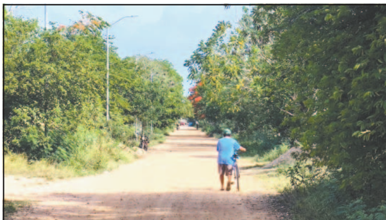
Debido al lodo los mototaxistas se niegan a dar el servicio.