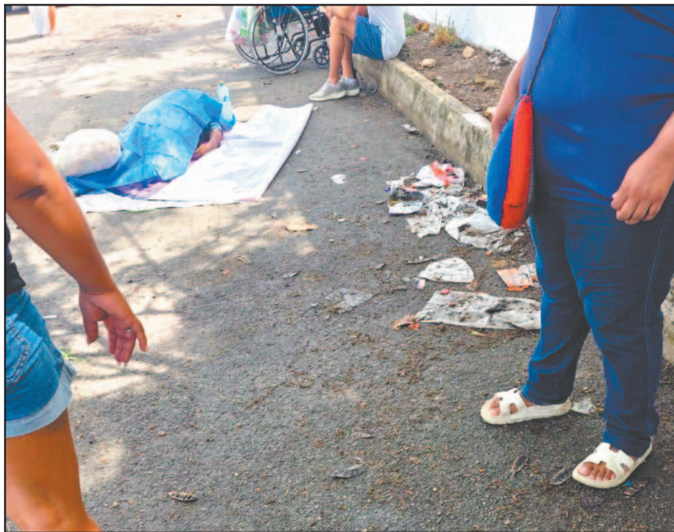
El can se ech o a los pies de su amo luego de que  ste se desplomara.

Chetumal, Q. Roo, jueves 28 de mayo del 2026