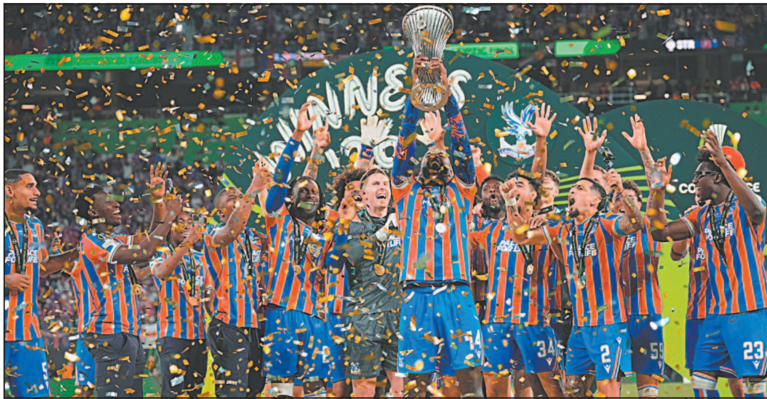
La victoria del Palace mantiene a los equipos ingleses encaminados a un posible pleno en las tres principales competiciones continentales.

Las Águilas consiguen su primer trofeo europeo al vencer 1-0 al Rayo en la Conference League