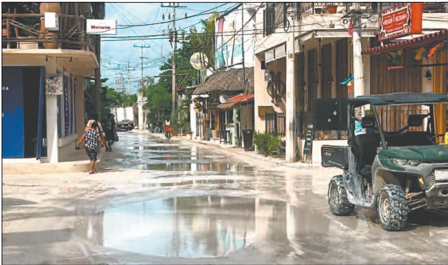
Prestadores de servicios y empresarios señalaron que la afluencia de viajeros decayó y la ocupación hotelera ronda el 50%.