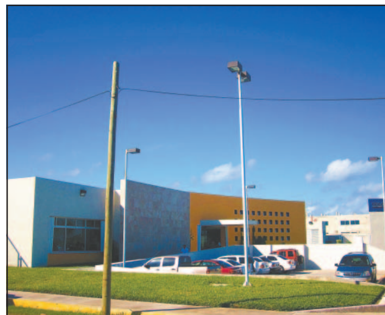
Usuarios reportaron crisis sanitaria en clínica ISSSTE. (Efrén Martín)