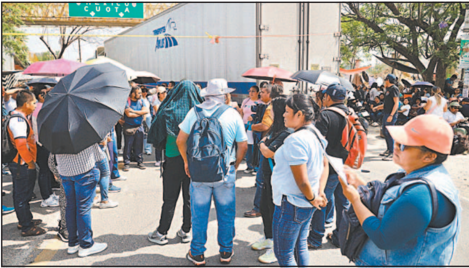
Los docentes bloquearon la carretera rumbo al municipio de San Pablo Villa de Mitla.