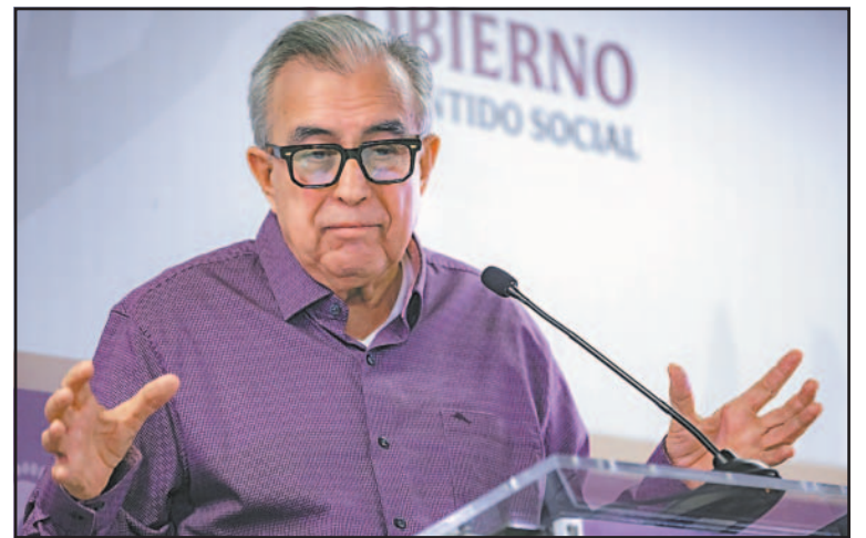
Estados Unidos busca extradición del mandatario con licencia.