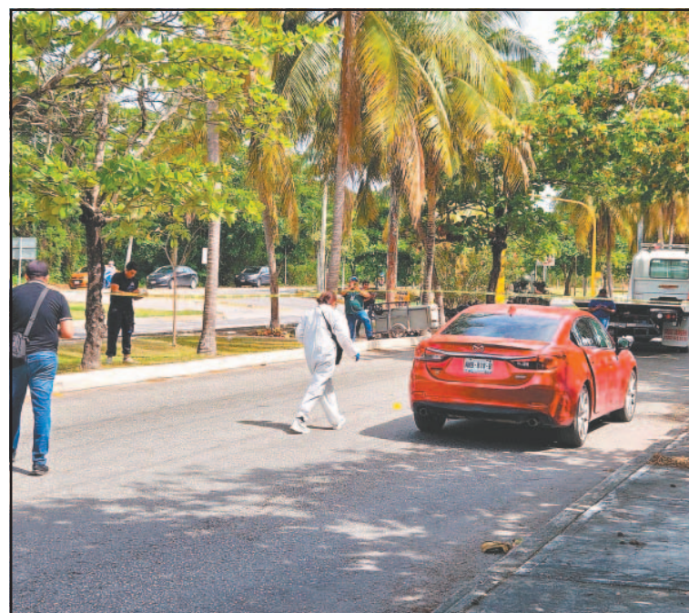
Lleg o a la Av. Bonampak y logr o ser auxiliado por la Polici .

Tras las diligencias para retirar el veh culo con m ltiples impactos de bala sobre la avenida Bonampak, agentes de la Polici  de Investigaci n acudieron a la calle Privada Jazmines, en el fraccionamiento Jardines de Bonampak, sitio donde