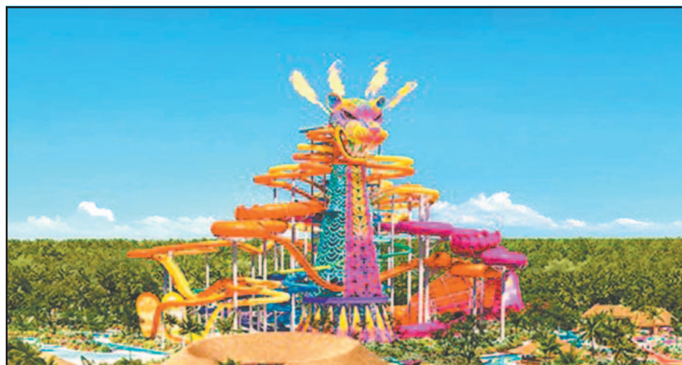
El Gobierno federal reveló que buscarán una categoría adicional de protección al sitio.