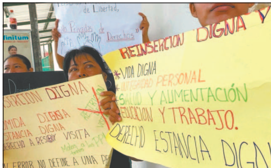
Inconformes reportaron que solo pueden comprar productos en la cooperativa que está dentro de la penitenciaría, lo que afecta su situación económica.