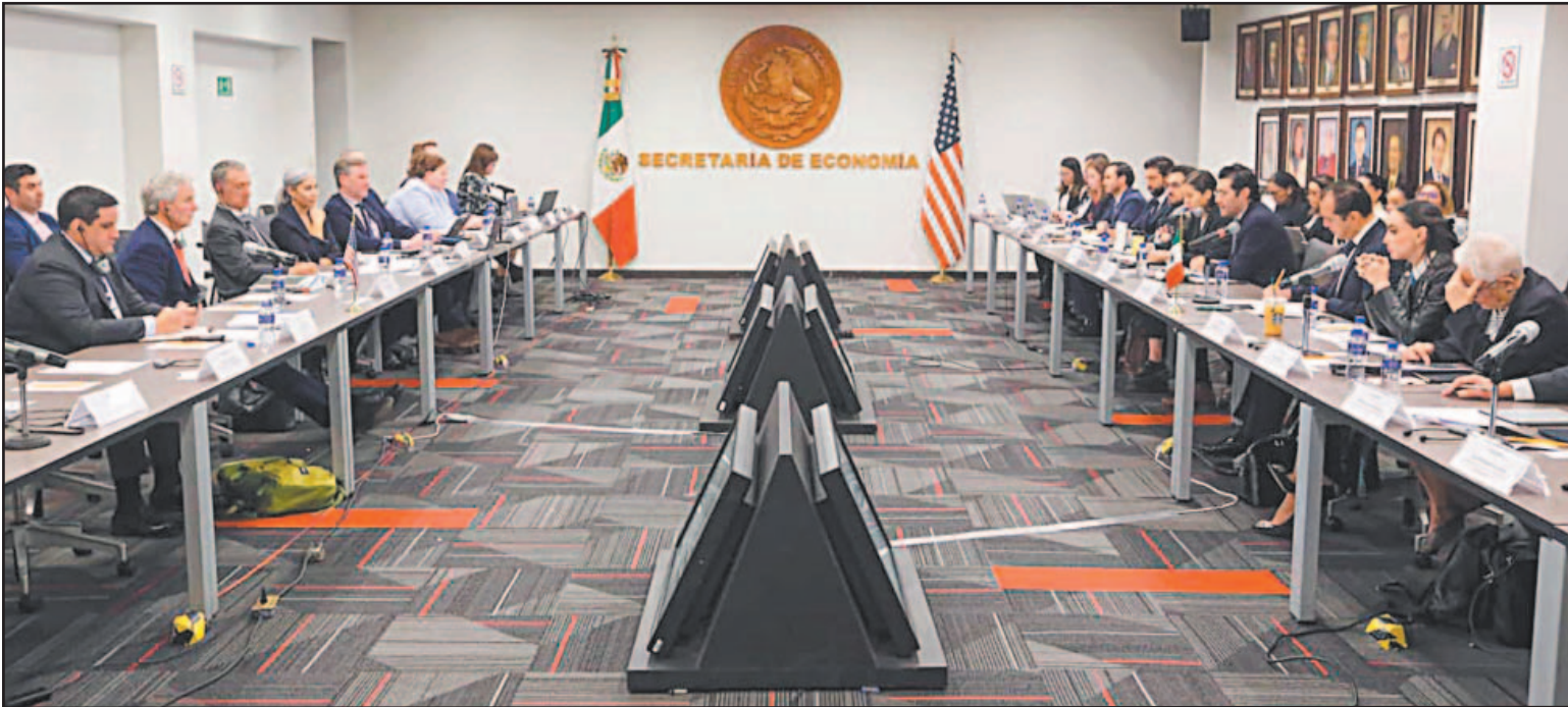
Las delegaciones mexicana y estadounidense arrancaron diálogos sobre sector automotriz, acero y aluminio, entre otros temas.

México y EE.UU. inauguran primera ronda bilateral para abordar aranceles y libre comercio agrícola