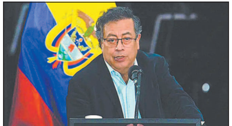
El presidente Petro denunció el caso de un conciudadano.

LONGVIEW.- Autoridades locales aseguraron ayer que no hay esperanza de encontrar más sobrevivientes tras la explosión ocurrida en Nippon Dynawave Packaging Co. en Longview, que provocó al menos un muerto y lesiones a otras nueve personas, entre ellas, un bombero que acudió a la emergencia.