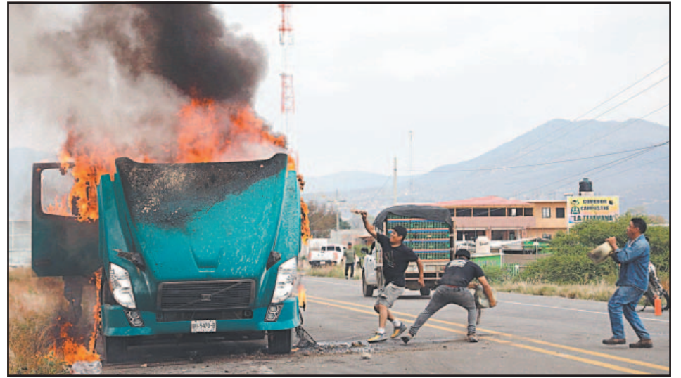
En la manifestación se reportaron disparos, aunque no hubo heridos.