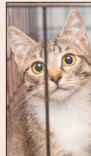
El Congreso de la Ciudad de México aprobó el dictamen.