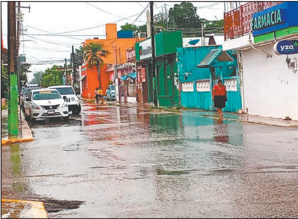
Colonos de CAPA, Expo y Centro reportan daños en sus aparatos.