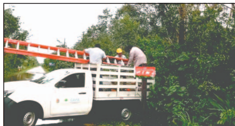
Se reportó que 14 pozos están fuera de funcionamiento. (POR ESTO!)