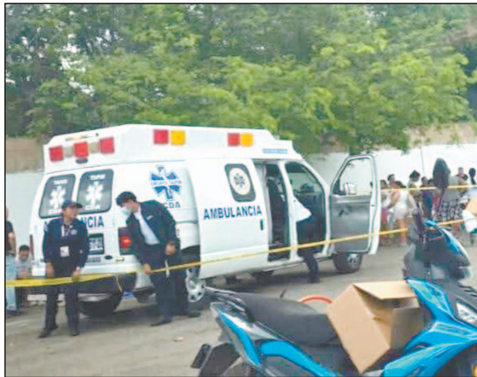
Param dicos confirmaron que el hombre carec a de signos vitales y cubrieron el cuerpo.