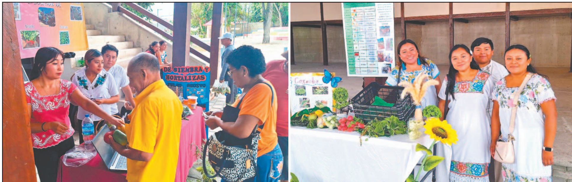
Los jóvenes de la Universidad para el Bienestar, sede Chan Santa Cruz, comercializaron cilantro, lechuga, rábano y chile habanero en el Teatro de la Ciudad.