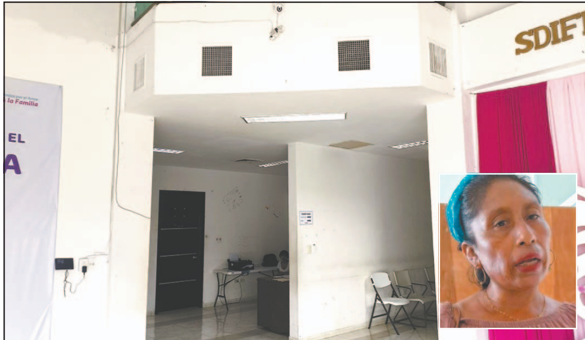
La madre de familia dijo que acusaron a su esposo de abusar del niño, pero que es falso.

Explicó que ella y su esposo han viajado a Chetumal, específicamente a las oficinas del DIF estatal, para intentar ver al niño, ya que les han informado que se encuentra en ese lugar, pero en esa dependencia han negado tener bajo resguardo al menor.