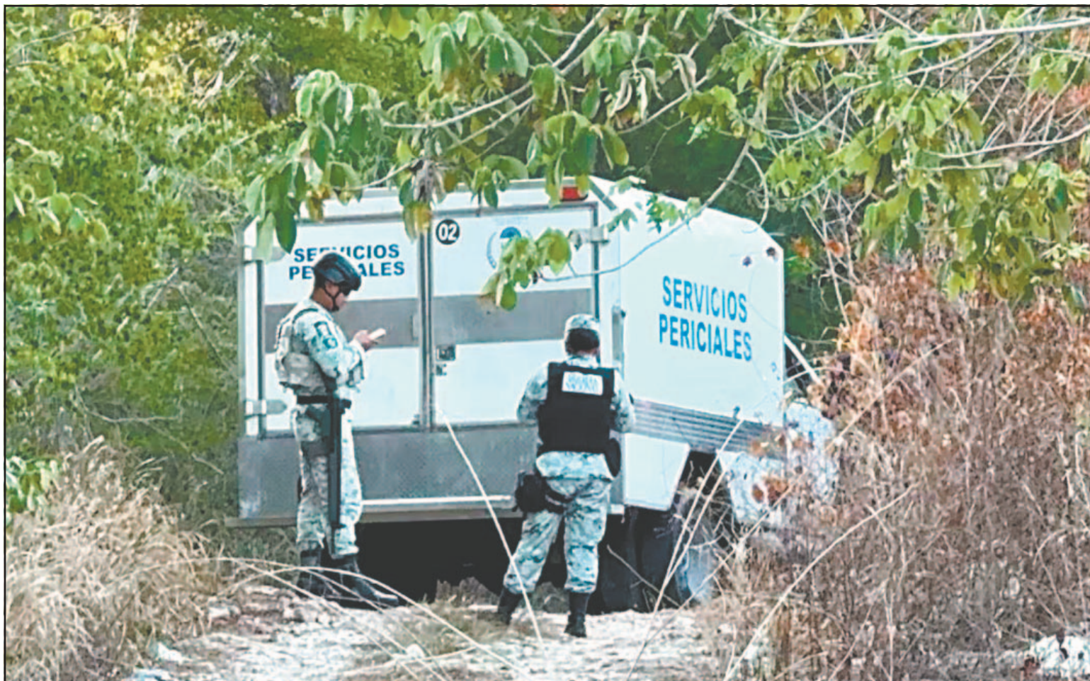
Una llamada anónima a través del C2 alertó a los agentes sobre una víctima a unos cuatro kilómetros de la avenida López Portillo. (L. Chacón)

Con datos preliminares, los elementos acudieron a la colonia México, a unos cuatro kilómetros de la avenida José López Portillo, donde se entrevistaron con un informante quien los guió hasta el punto exacto, tomado como referencia el poste marcado con el número 37, a unos 10 metros dentro del área verde.