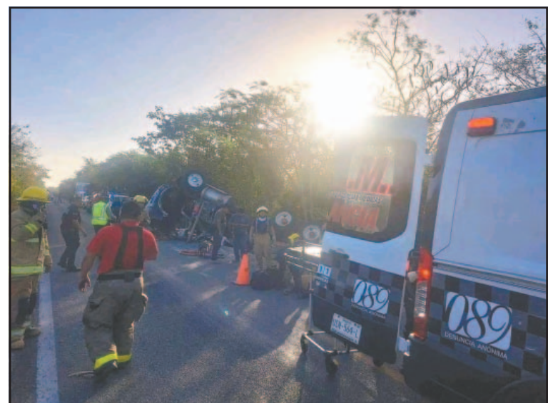
Un nuevo accidente reavivó el enojo de los ciudadanos. (E. Cauch)

La exigencia de ampliar la carretera también surge por antecedentes trágicos. Hace apenas unos meses, un habitante de El Ideal murió atropellado por un vehículo que huyó