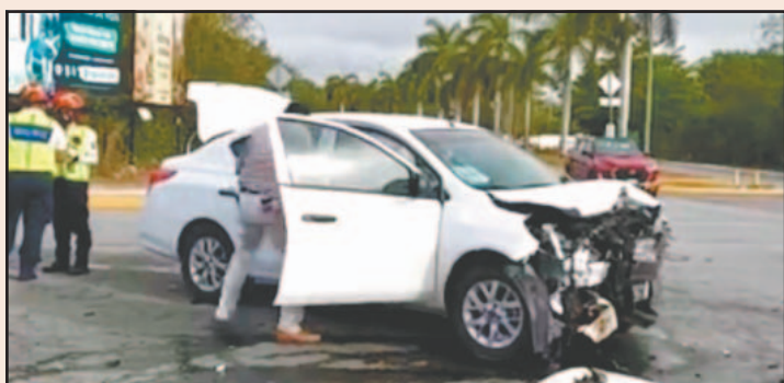
Uno de los coches casi se estrella contra un transformador. (G. Escalante)