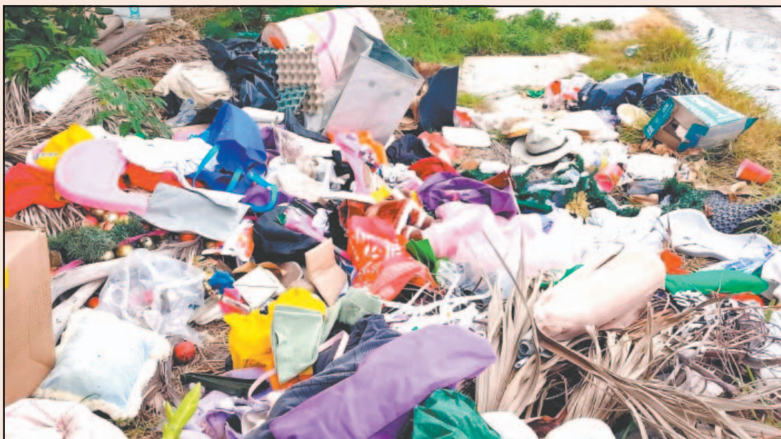
Desde hace unos días, en el área empezaron a acumular todo tipo de desechos. (Fernando Olvera)