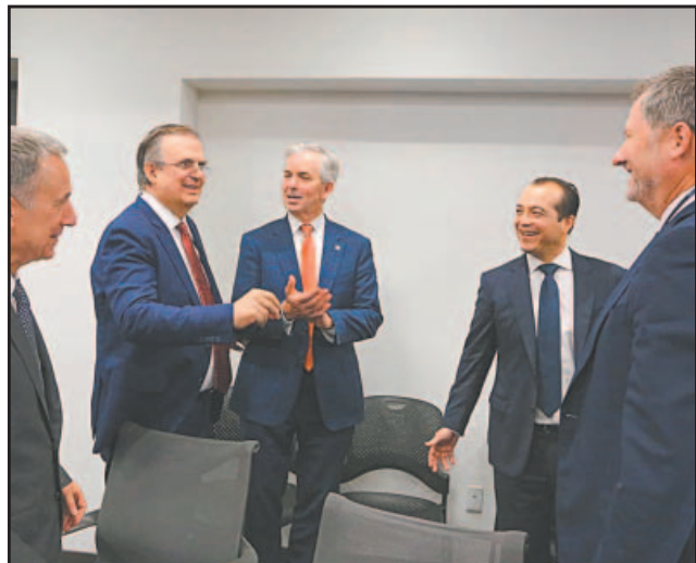
EN la primera ronda de conversaciones, ambas delegaciones reiteraron su compromiso de consolidar una región norteamericana más integrada y competitiva.- (POR ESTO!)