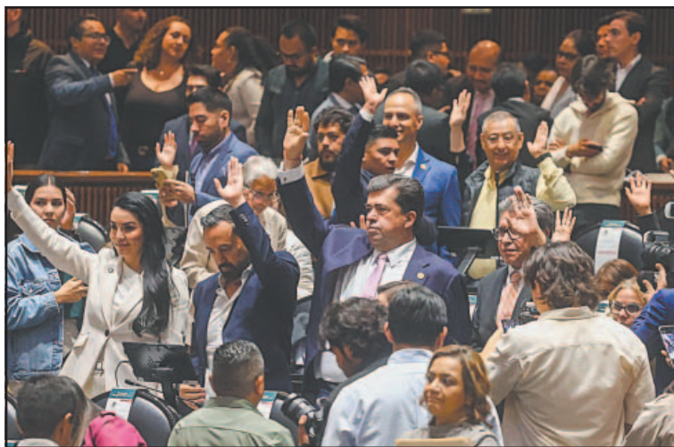
Las bancadas de Morena y aliados impulsaron el dictamen.

Entre otros aspectos, la exministra también propuso que se incluía una indemnización a los trabaja-