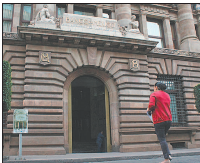
EL Banco de México advirtió que la inversión continuará mostrando señales de debilidad, al menos hasta la segunda mitad del 2026, ante la incertidumbre por el T-MEC.- (POR ESTO!)