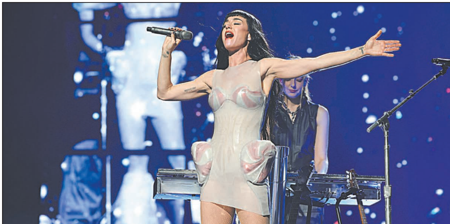
La diva del pop compartió un video en Instagram para anunciar su espectáculo con entrada libre el próximo 25 de agosto.

“Los artistas invitados al pelenque son de talla mundial, tanto de talla nacional como internacional, que van a dar esa gala de música, a todos los potosinos y a todos los mexicanos, sabemos que va a venir gente de todas partes de México,