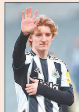
Anthony Gordon firmó por 5 campañas con el Barça.