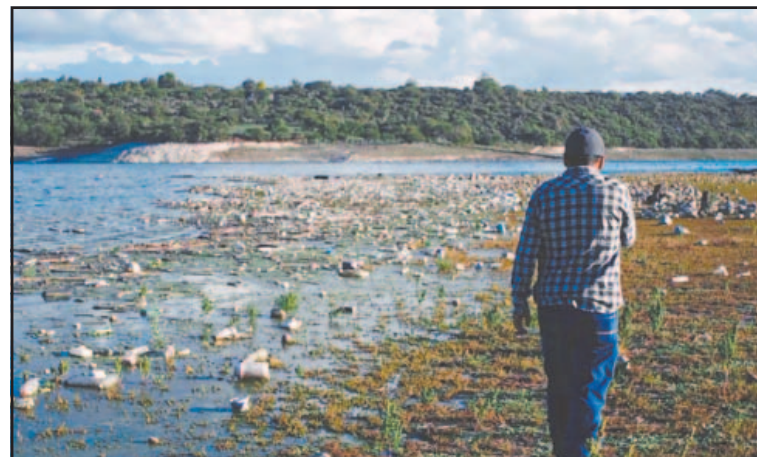
Habitantes de la zona de la presa Endhó exigen apoyo de la autoridad.