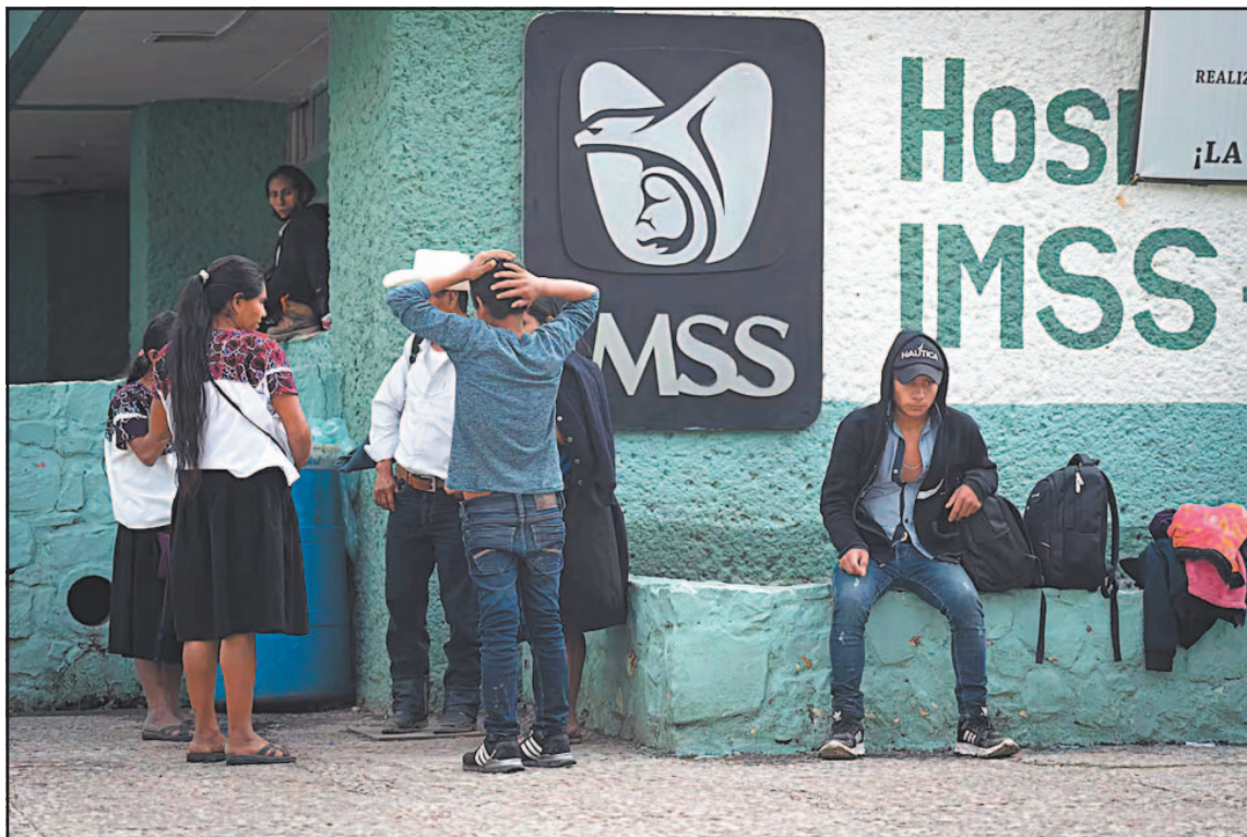
Un hombre de 47 años presentó gusano barrenador en una lesión en la pierna izquierda.

Indicó que lo más probable es que la contaminación se haya producido por contacto con algún bovino e informó que se ha implementado un cerco sanitario para prevenir más