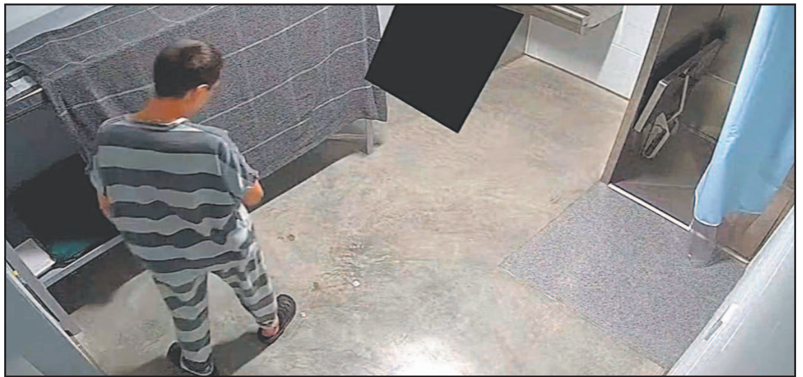
Desde enero del 2025 se han registrado 51 decesos bajo la custodia de la institución.

En reacción a la investigación de la AP, el presidente Gustavo Petro escribió el miércoles en X que la cancillería del país debería emitir una protesta formal por la muerte de un colombiano y que el Gobierno de Estados Unidos debería "reflexionar cómo la política de inmigración está matando a estadounidenses y a latinoamericanos". El presidente de Colombia denunció ayer el suicidio de un conciudadano en uno de los