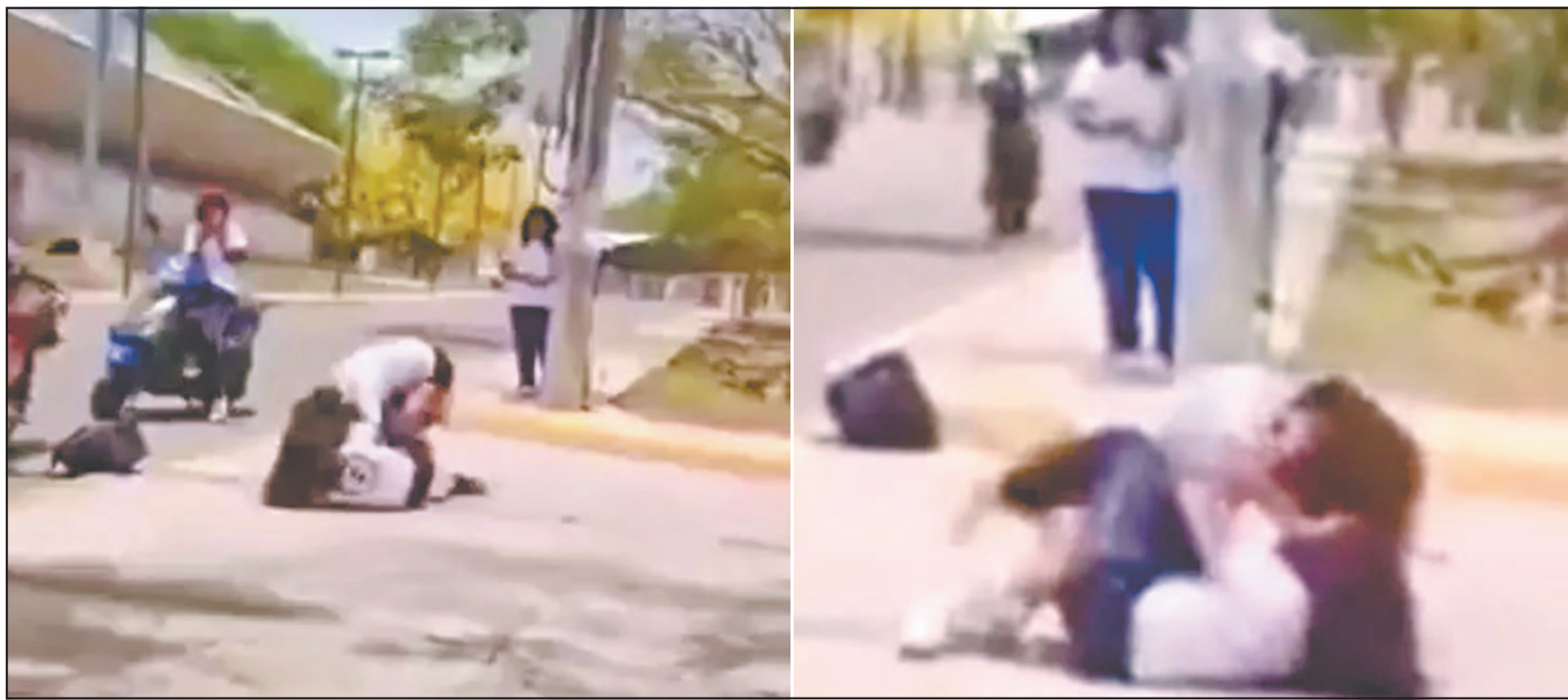
Los tutores coincidieron, luego de ver el video de la pelea, en la urgente necesidad de promover los valores y el respeto entre compañeros estudiantiles.