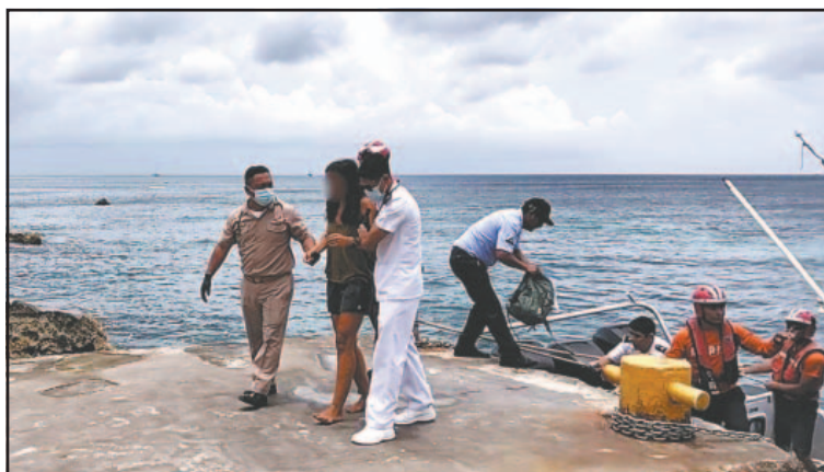
La pasajera fue estabilizada en altamar antes de llegar a tierra. (POR ESTO!)