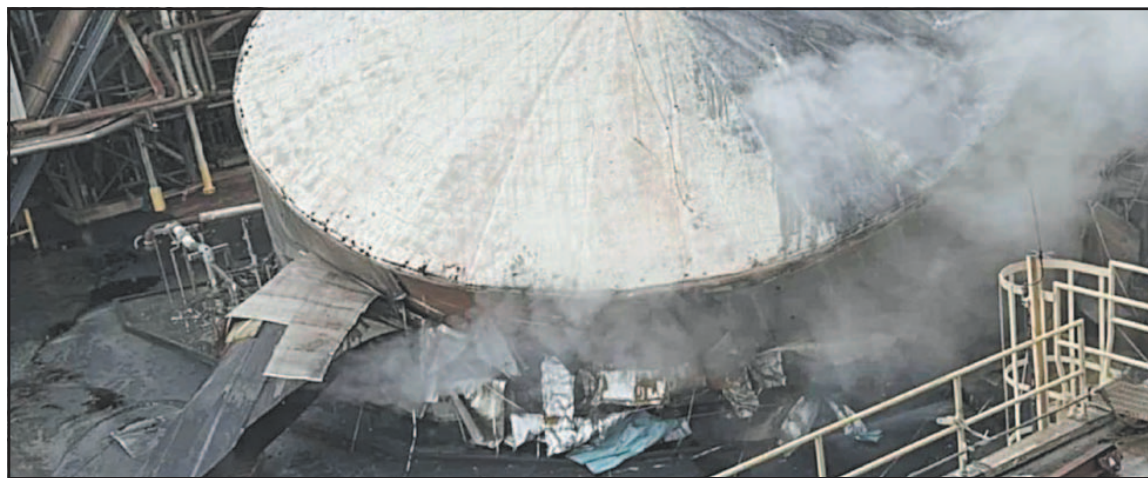
El depósito está liberando una mezcla química muy destructiva llamada "licor blanco".

riedades indicaron que solo trabajarían durante el día debido a los