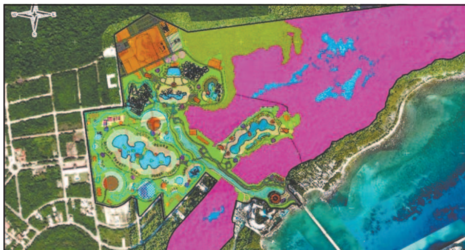
La compañía planeó un muelle privado dentro de la terminal portuaria del destino.

tualmente se mantiene diálogo con la empresa para determinar si existe otro punto donde pudiera desarrollarse una propuesta similar sin ocasionar daños al entorno natural. Agregó que cualquier plantea-