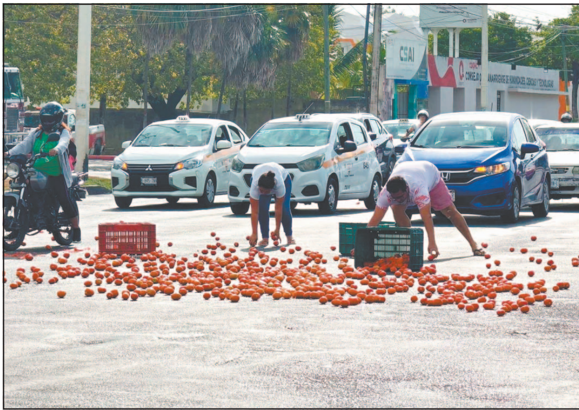
El incidente ocurrió en las avenidas Insurgentes y Benito Juárez, donde tres rejillas terminaron en el suelo.

Por su parte, Mirna Aceves, empleada de una farmacia ubi-