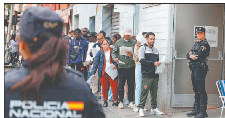
Fila de inmigrantes de la isla en proceso para residencia.

En España, los cubanos solicitaban protección internacional, luego de denunciar la pérdida de sus pasaportes, para ocultar que habían entrado por Serbia, lo que les habría inhabilitado pedir refugio en suelo español.